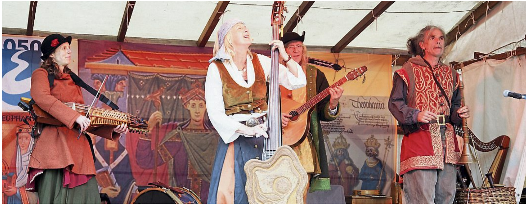
Eschweger Marktplatz mal anders: Spielleute, Gaukler und Vaganten nahmen das Publikum mit auf eine Zeitreise, eine bunte Mischung aus Profispektakel und Laienspiel. KRISTIN WEBER