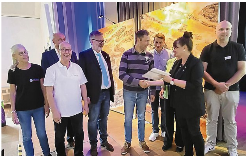
Sontra Adam-von-Trott-Schule Sontra zum vierten Mal als „MINT-freundliche Schule“ ausgezeichnet