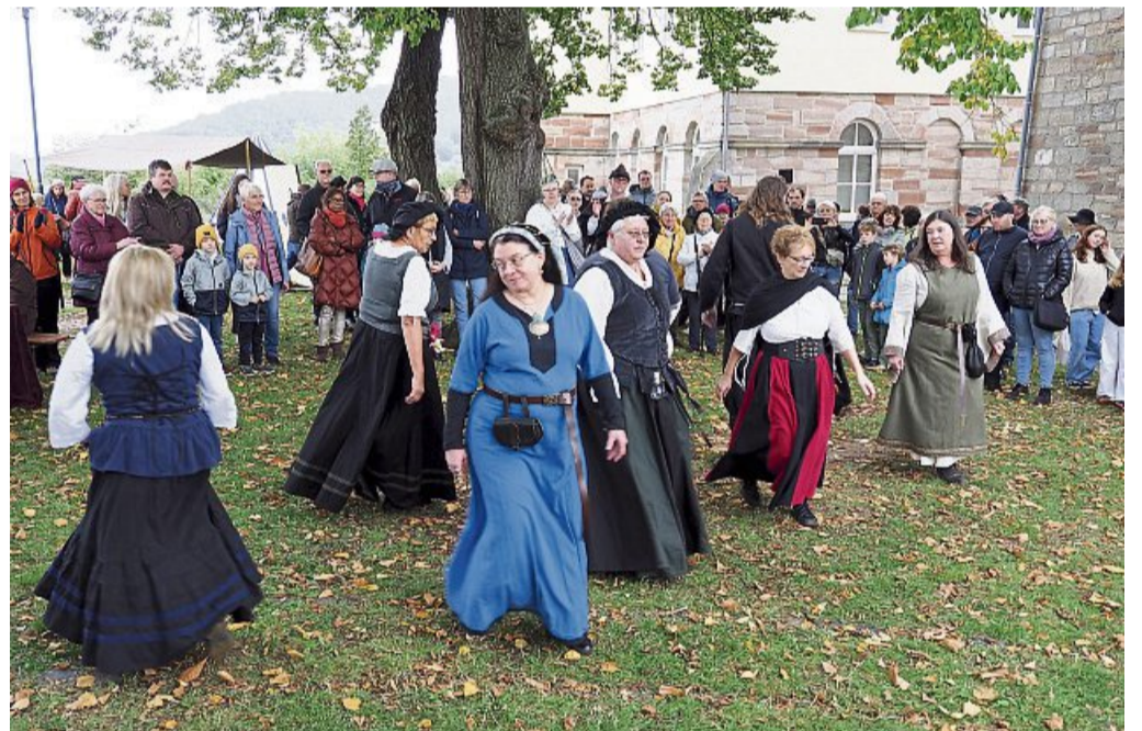
Tanz auf dem Schulberg: Die Mitglieder der Tanzgruppe „Saltarre in Luna Noctis“ aus Rotenburg an der Fulda zeigen alte Schreittänze des Mittelalters. KRISTIN WEBER