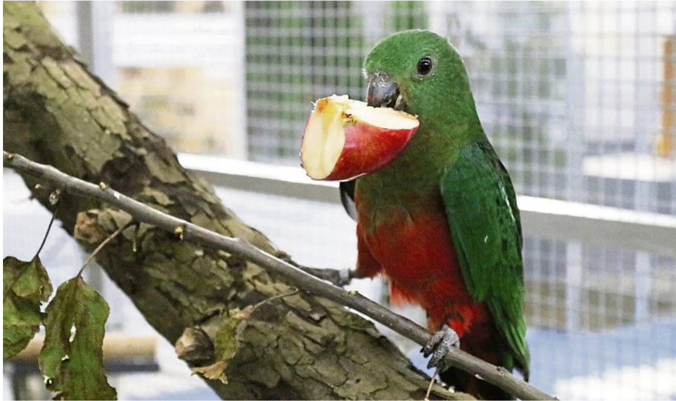
In den Volieren im E-Werk werden den Besuchern verschiedene Arten mit ihren ganz eigenen Eigenschaften präsentiert.