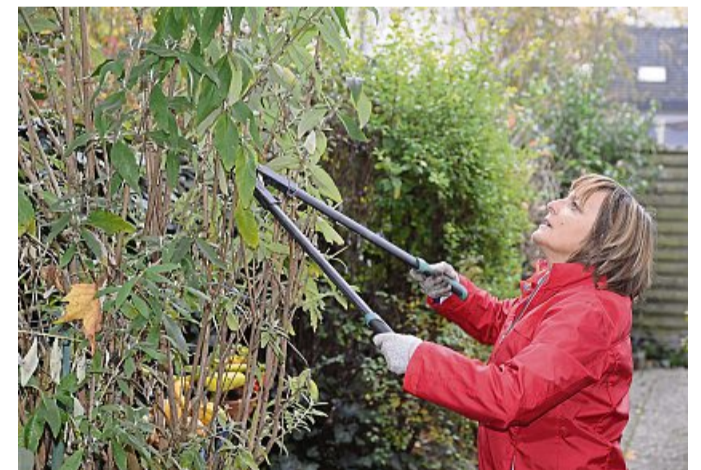
Kostenfreie Abgabe: Am Samstag, 19.10. kann Baumschnitt abgegeben werden.

Flohmarkt 6 bis 15 Uhr: Kram- und Trödelmarkt, Straßenmarkt mit Atmosphäre, Imbiss vorhanden, Breitwiese