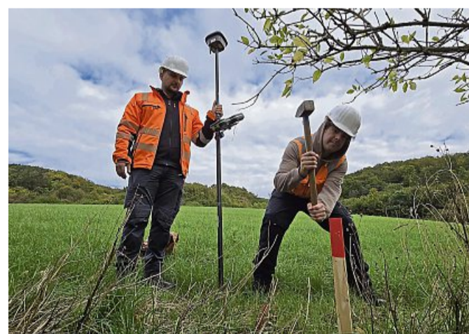
Erst Hammer, dann HDD-Bohrer: Die Bauarbeiten an der Megastromtrasse Suedlink in Hessen haben jetzt bei Ringgau-Röhrda begonnen. STEFANIE SALZMANN

Immer wieder kam es bei Planungen und Genehmigungen zu Verzögerungen, und auch im Ringgau stehen die Genehmigungen zum Teil noch aus. Doch ein vorzeitiger Baubeginn ist möglich, insofern die Arbeiten im Zweifel rückgängig gemacht werden könnten. Der Erörterungstermin zum Planfeststellungsverfahren ist im November in Eschwege, mit einem abschließenden Plan-