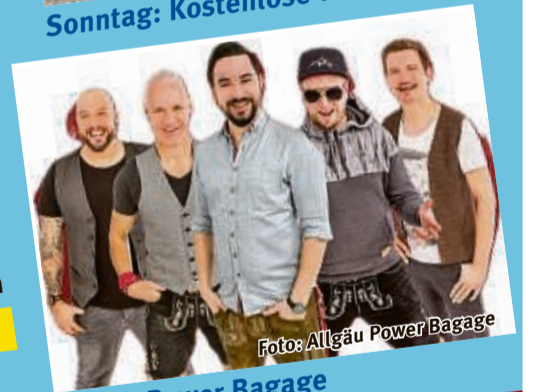
Allgäu Power Bagasch

Vier Tage buntes Programm für jedes Alter!