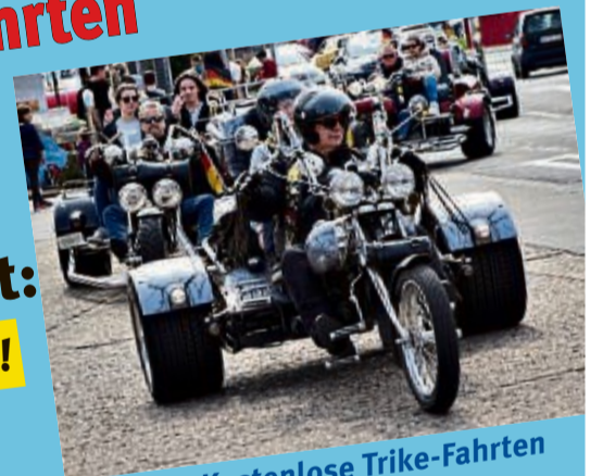
Sonntag: Kostenlose Trike-Fahrten