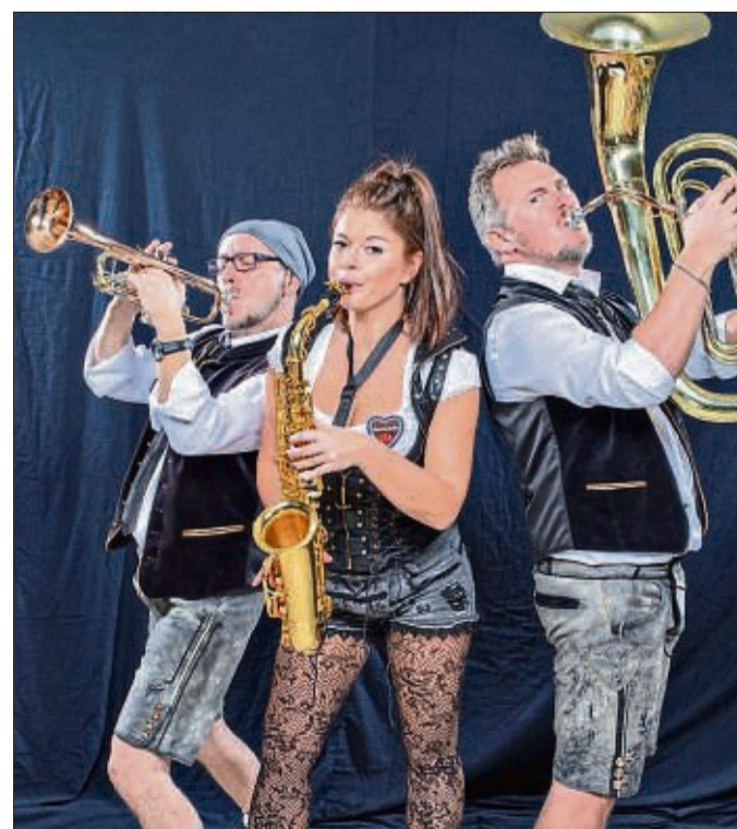
Die »Bayern Mafia« spielt zum Auftakt des Oktoberfestes im Kaufpark am Donnerstag, 26. September, von 15 bis 21 Uhr auf der Bühne am »Aurelia« Biergarten der Firma Ahlendorf (Tegut-Parkplatz).

Die Einzelhändler laden am Oktoberfest-Sonntag (29. September) von 12 bis 18 Uhr zum verkaufsoffenen Sonntag ein. Ebenfalls exklusiv am finalen Sonntag: Die Trikefreunde Mittelhessen sind zurück im Kaufpark und bieten kostenloses Kurztrips an.