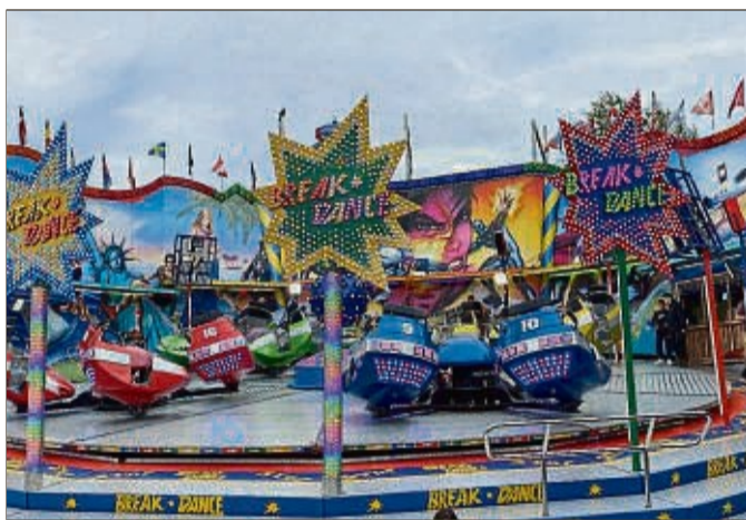
Abwechslung ist etwa mit dem »Breakdancer« garantiert, der erneut im Kaufpark aufgebaut wird.

Der Bummel durch den Kaufpark ist dann stets ein besonderes Erlebnis, weil sich