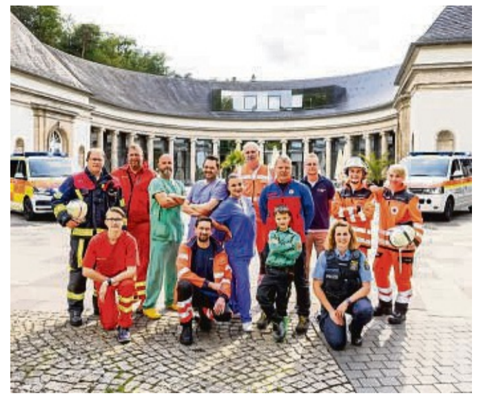
Wie die Arbeit von „Blaulichtorganisationen“ funktioniert, wird in Bad Wildungen am 27. September der Öffentlichkeit präsentiert.