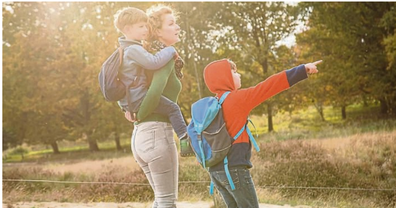
Entdecken, was glücklich macht: Auch kleine Erlebnisse, etwa in der Natur, können unseren Glücks-Tank auffüllen.