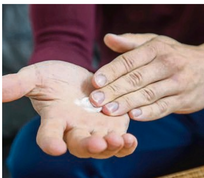
Vor und nach dem Putzen: Eine rückfettende Handcreme, die frei von Duftstoffen und Konservierungsmitteln ist, hilft, die empfindliche Haut zu schonen.

Sie rät deshalb, Haushaltshandschuhe nur über trockene Hände zu ziehen – und auch die Hautschutzcreme vorher gut einziehen zu lassen.