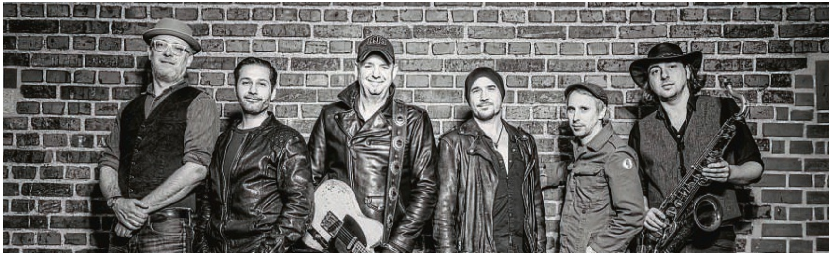
Bruce Springsteens Spielfreude will Bosstime in die Usselner Schützenhalle bringen.