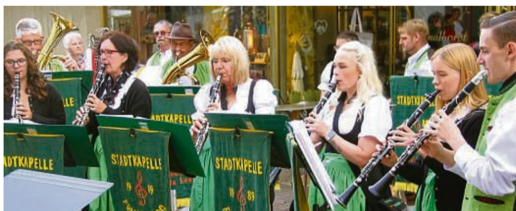
Stadtkapelle Frankenberg: Sie will beim Herbststadtfest wieder für Stimmung in der Frankenger Fußgängerzone sorgen.

Die Innenstadt und speziell die Fußgängerzone locken mit zahlreichen Attraktionen und Angeboten für große und kleine Besucher. Für jeden ist etwas dabei. Kreis: „Der verkaufsoffene Sonntag bietet den Besuchern der Stadt die Möglichkeit, in aller Ruhe durch die Geschäfte zu schlendern, sich inspirieren zu lassen und die neuesten Herbsttrends zu entdecken.“ Beim Stadtfest dürfen die