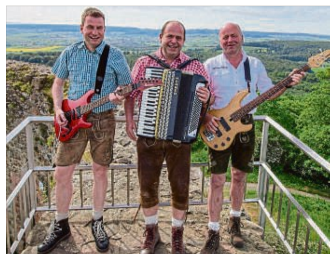
»Die Rosshäuser« sorgen am 29. September zum verkaufsoffenen Sonntag für Stimmung auf der Bühne am »Aurelia« Biergarten (Tegut-Parkplatz).

Die Einzelhändler laden zum Abschluss des Oktoberfestes am 29. September von 12 bis 18 Uhr zum verkaufsoffenen Sonntag ein. Hier lassen sich mit Sicherheit die ein oder anderen besonderen Angebote in den Fachgeschäften entdecken!