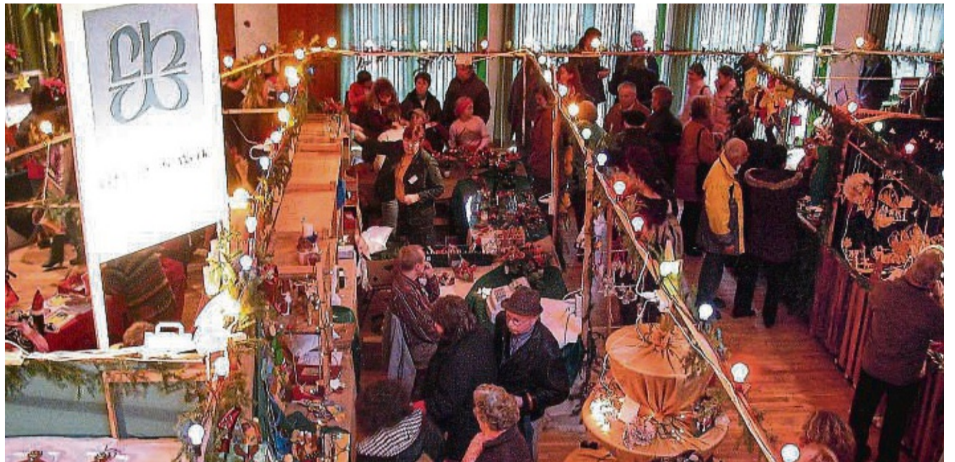
Dichtes Gedränge bei einem früheren Lebenshilfe-Weihnachtsbasar in der Frankenger Ederberglandhalle (heute Philipp-Soldan-Forum). Solche Veranstaltungen wird es vorläufig nicht mehr geben.

Bei der Tombola müsse berücksichtigt werden, dass der Hauptpreis „Auto“ wegen der drastisch gestiegenen Kosten nicht mehr finanzierbar sei und die Vorverkaufsstellen in den Banken deutlich gesunken seien. Die bisherigen Holzgerüste für die Einrichtung der Stände könnten im neuen Philipp-Soldan-Forum