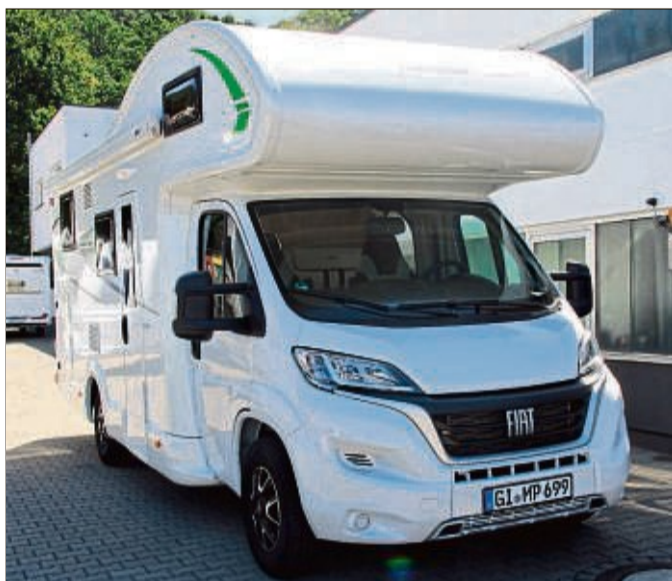
Bereit für ein Abenteuer? Mit einem Wohnmobil von MP Camping Marburg bietet sich jetzt DIE Gelegenheit, 7 Tage lang die mobile Reisefreiheit zu testen.

Der Kaufpark Wehrda bietet mit jeder Branche ein vielfältiges Spektrum an Einkaufsmöglichkeiten: Mode, Augenoptik, Babyausstattung, Lebensmittel,