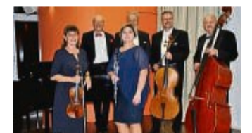
Mit neuen Programm: das Waldeckische Salonorchester „Cappuccino“.

Korbach – Auf Einladung des VHS-Kulturforums Korbach präsentiert das Waldeckische Salonorchester „Cappuccino“ am Samstag, 5. Oktober, um 19.30 Uhr sein neues Programm „Magic Cinema – Filmmusik live“ im Bürgerhaus. Bei dem Konzert verschmelzen Musik und Kino in kammermusikalischer Besetzung miteinander, großartige Filmmelodien verzaubern das Publikum. „Cappuccino“ hat für dieses Programm sein Repertoire durchstößert und gern gehörte Titel aus der Welt der Filmmusik wie „Winnetou“, „Miss Marple“, „Doktor Schiwago“, „Wie im Himmel“ oder „Schindlers Liste“ ausgewählt. Die Auswahl wird durch frisch arrangierte Filmhits wie „My heart will go on“ (Titanic), „Cinema Paradiso“, „Die Kinder des Monsieur Matthieu“ und