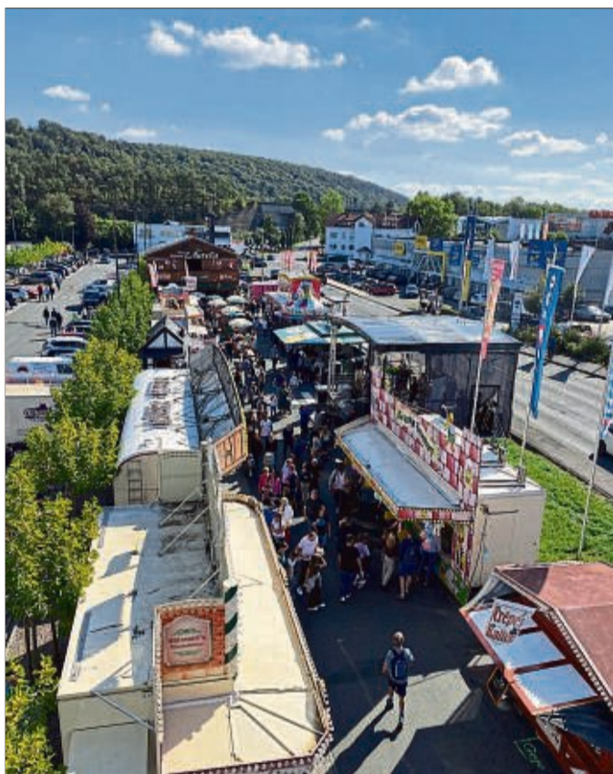
Abwechslung ist bis Sonntag, 18 Uhr, mit allen Fahrgeschäften – darunter die Riesenschaukel – sowie in der Vergnügungsmeile garantiert.

Seitdem gibt es im Festzelt von Bill-Event zu deren 2. Licher Wiesnfest am ehemaligen Schlachthofgelände sowie in der Hessenscheune »Aurelia«