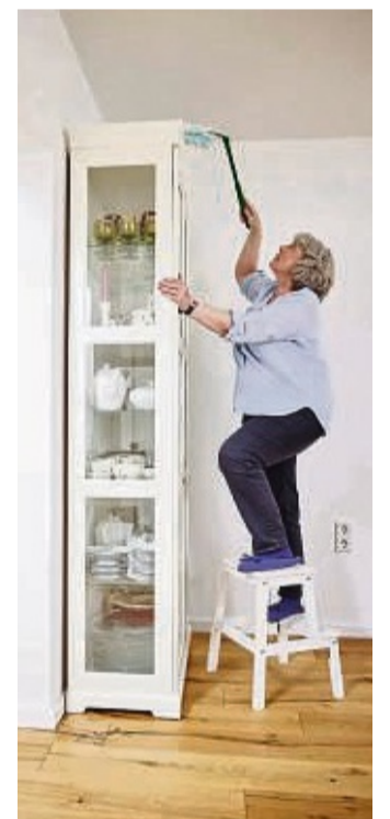
Vorsicht: Unfälle passieren oft im eigenen Zuhause.

Wenn die Beine schwächer werden, sollte man sich rechtzeitig auf diesen Umstand einstellen. Ganz wichtig, um sich wohlfühlen, sei dabei die Gewissheit, zu jeder Tages- und Nachtzeit Hilfe per Knopfdruck rufen