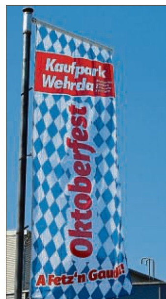
Der Werbekreis des Kaufparks Wehrda freut sich darauf, »A Fetz'n Gaudi!« mit den Besuchern feiern zu können.

Mitmachen ist ganz einfach: Beantworten Sie folgende Frage: Welche Wohnmobil-Marken führt MP Camping in Marburg? Senden Sie dazu eine Mail mit dem Stichwort »MP Camping« an gewinnspiel@sonntagmorgenmagazin.de . Bitte geben Sie hierbei auch Ihre Telefonnummer zwecks möglicher Kontaktaufnahme an. Einsendeschluss ist der 1. Oktober.