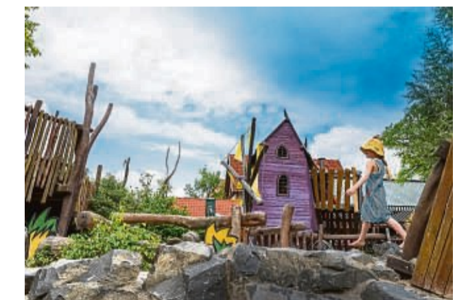
Die Spielplätze im Erlebnis-Zoo Hannover sind bei Kindern beliebt.