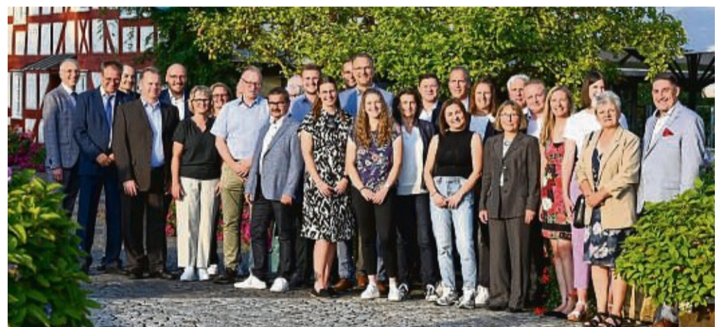
Verdienste gewürdigt: Die Waldeck-Frankenger Bank hat langjährige Mitarbeiter geehrt und einige Kollegen in den Ruhestand verabschiedet.