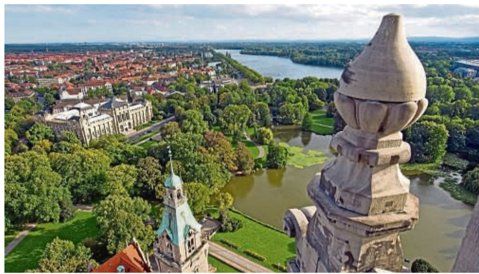
Von der Rathauskuppel reicht der Ausblick weit über das Landesmuseum und den Maschsee hinaus.

Aus der Großstadt ist auch das grüne Umland mit dem Nahverkehr gut zu erreichen, mit der Ermäßigungs-