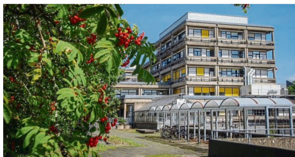
Das Gebäude des Fachbereichs Biologie an der Uni Marburg. Im Shanghai-Ranking zu den weltweit besten 1000 Universitäten wurden die Leistungen der Biologen besonders gut bewertet.

In der Rangliste, die vor allem die Forschungsstärke der Hochschulen bewertet, werden nur die ersten 100 Plätze einzeln ausgewiesen. Danach werden die Ränge zwischen 101 und 150, zwischen 151 und 200, sowie ab da jeweils im Hunderter-Paket ausgewiesen. Unter die Top 100 schafften es nur drei deutsche Universitäten: die Ludwig-Maximilians-Universität München (Platz 43), die TU München (Platz 47), die Universität Heidelberg (Rang 50) sowie die Universität Bonn