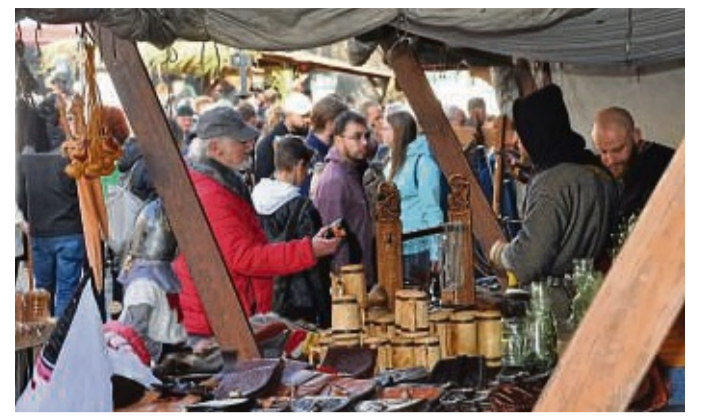
Beim Mittelalterlichen Markt 2023 gab es ein reichhaltiges Angebot.