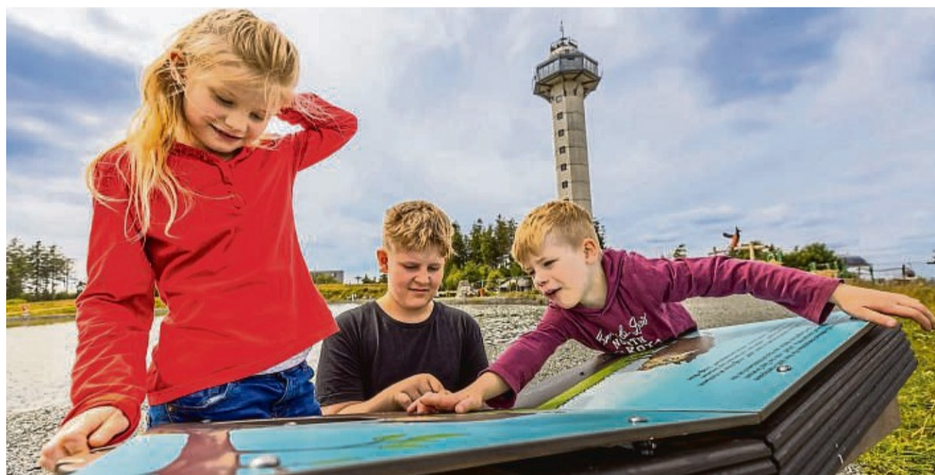
Eine Geschichte für junge Besucher erzählt „Rikes Raupenweg“.

Das Angebot für Kinder wird auch durch eine Erweiterung des Abenteuerspielplatzes verbessert: „Der ist nicht nur für ganz kleine, auch Kinder mit zehn oder elf Jahren haben ihren Spaß“, sagt Elisabeth Schilling vom Seilbahn-Marketing.