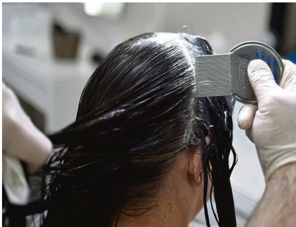
Lästig, aber ungefährlich: Weil Läuse im trockenen Haar schnell übersehen werden, ist das Auskämmen im nassen Zustand ratsam.

Wird die Laus vom Wirt – also dem Mensch – getrennt, bleibt ihr allerdings kaum