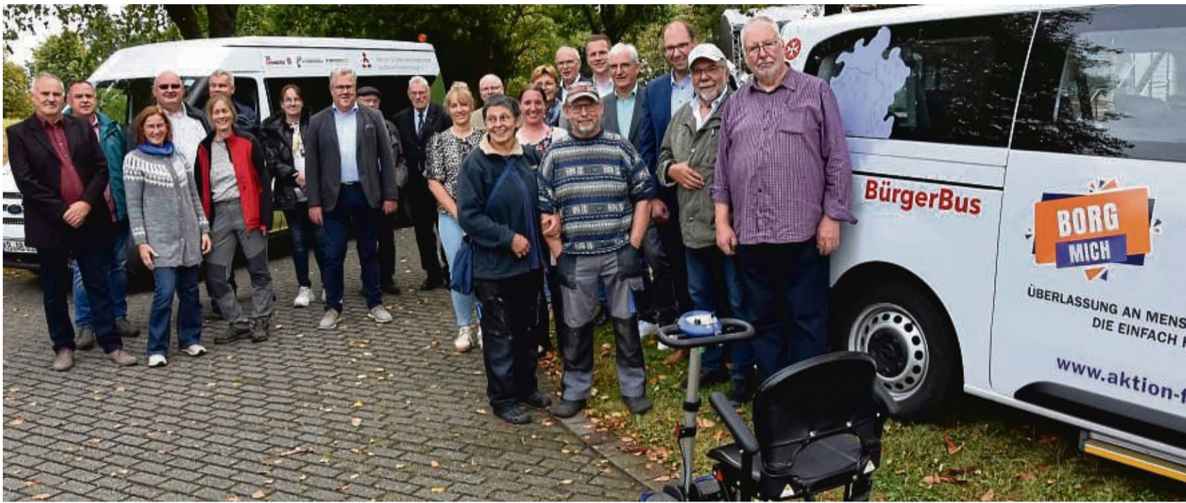
Der neue Bürgerbus der Aktion für behinderte Menschen Waldeck-Frankenberg ist in dieser Form einmalig in Hessen. Zur Vorstellung kamen viele ans Kreishaus in Korbach.