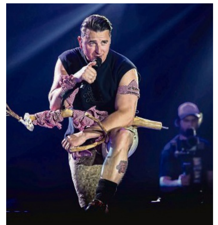
Gabalier selbst sagt: „Ich

Tickets gibt es online bei eventim.de sowie ab heute, 14 Uhr, an den bekannten Vorverkaufsstellen. red