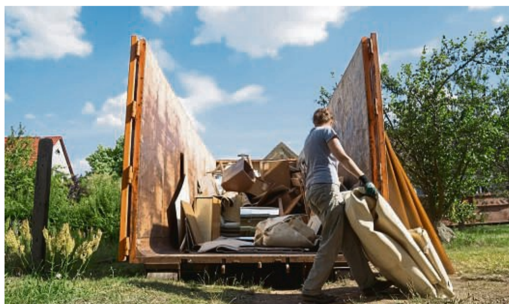
Kann auch körperlich schlauhen: Das Haus der Eltern ausräumen.