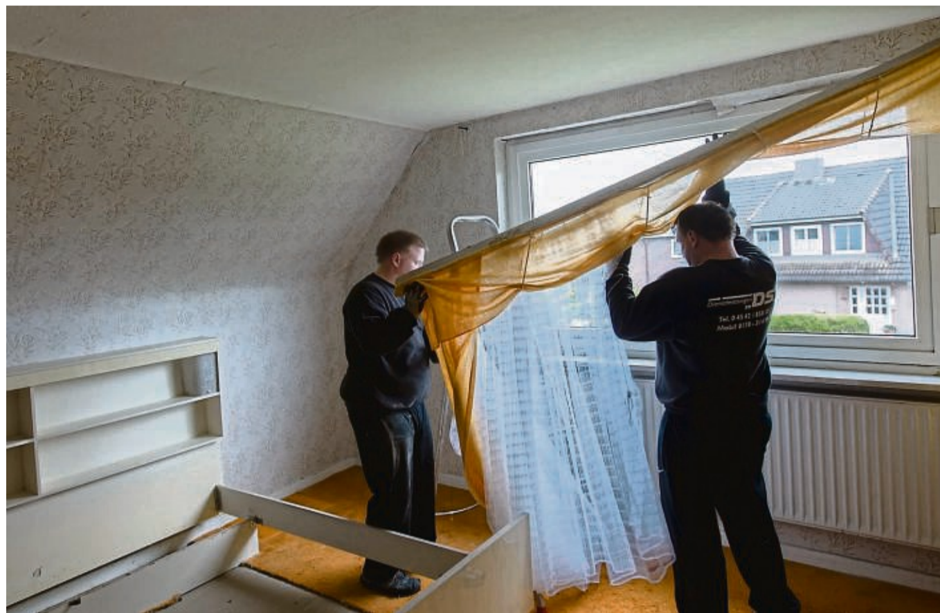
Sie müssen nicht alles allein machen: Manchmal kann es sinnvoll sein, Profis mit dem Ausräumen zu beauftragen.

Ohnehin gilt: Wer das Elternhaus verkaufen möchte, sollte sich zügig daran machen, alle nötigen Unterlagen zur Immobilie zusammenzutragen. Denn: so ein Immobilienverkauf kostet Zeit. Etwa ein halbes Jahr sollte man für Notartermine, Grundbuchauszüge und Co. einplanen. „Bis dahin sind Sie natürlich für die Kosten des Hauses zuständig“, sagt Lücke-Schmidt. Auch nicht mehr benötigte Versicherungen sollten schnellstmöglich gekündigt werden.