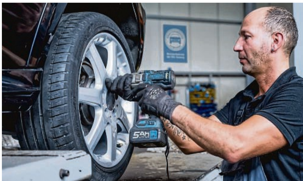
Spätestens jetzt sollten Sommerreifen gegen ihre Winterpendants ausgetauscht werden.