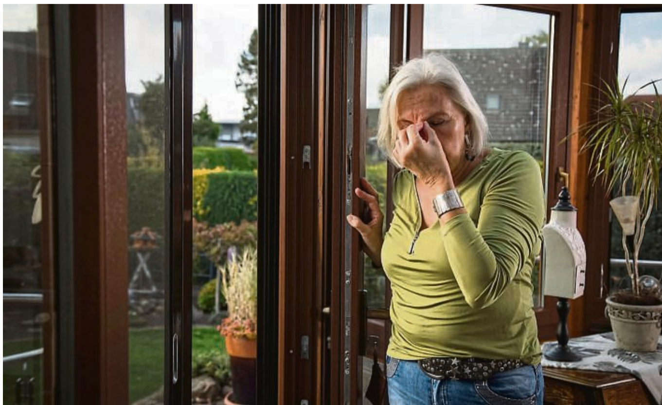
Augenreiben hilft nicht: Dass Pünktchen und Wolken durch das Gesichtsfeld schweben, liegt an Veränderungen des Glaskörpers.

Im Laufe des Lebens verändert sich die Zusammensetzung des Glaskörpers allerdings. Die Kollagenfasern können sich verdichten und zusammenklumpen, während der gelartige Teil flüssiger wird. „Dann kann es pas-