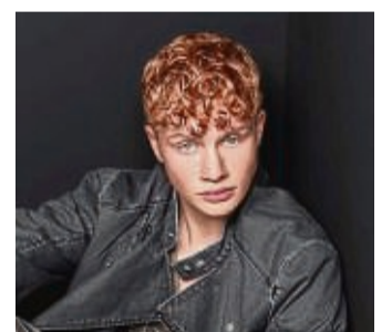
„Cherub Rock“ heißt ein Trendlook für Männer.

Ob Natur oder nachgeholten: Haarstylings mit Locken sind bei Männern derzeit angesagt. Laut dem Portal „Haut.de“ verleihen sie einen weniger strengen Ausdruck als glatt gegeltes Haar. Und es gibt viele verschiedene Lockenfrisuren – für unterschiedliche Haarlängen.