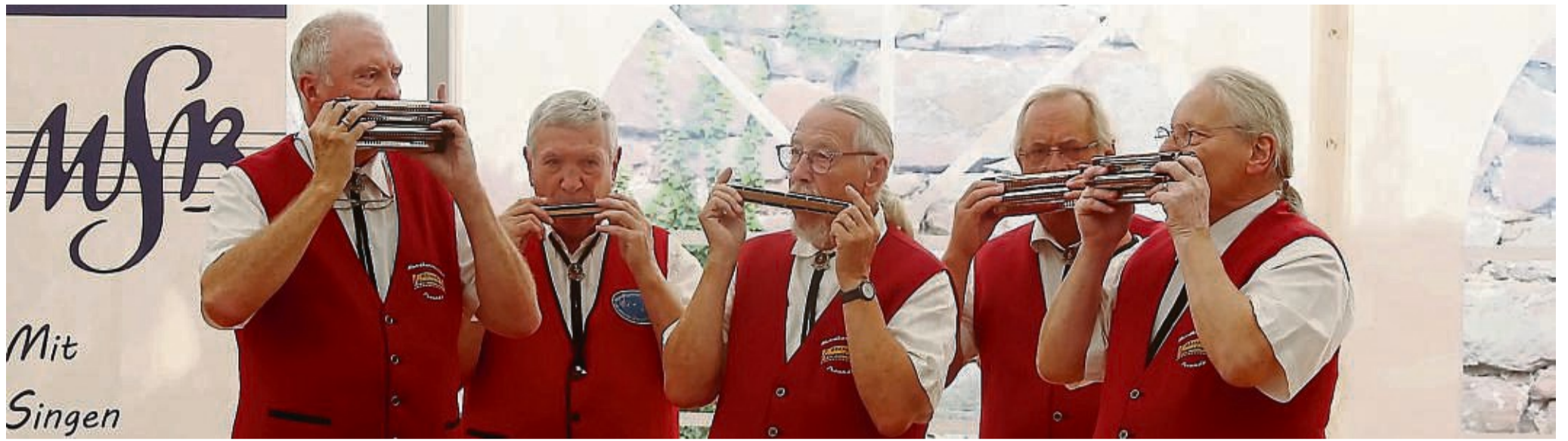
Auch wenn sie nur in kleiner Besetzung antraten, wussten die Mundharmonikafreunde Oberode-Ziegenhagen 1982 mit ihrem Vortrag voll zu überzeugen.