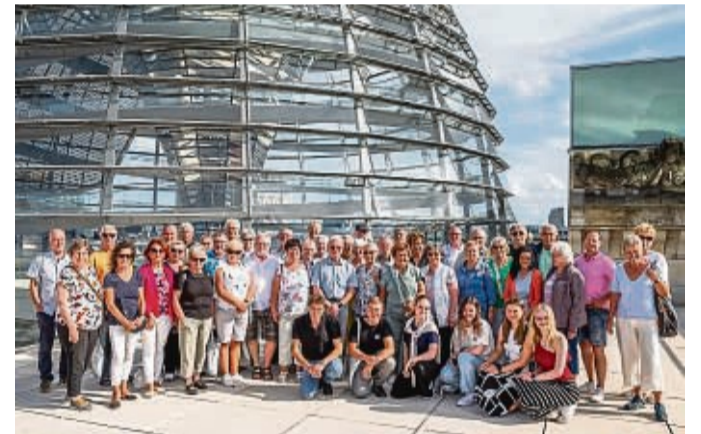
Auf Einladung des heimischen Bundestagsabgeordneten Michael Roth (SPD) reisten zum zweiten Mal in diesem Jahr politisch interessierte Bürger aus den Landkreisen Hersfeld-Rotenburg und Werra-Meißner in die Bundeshauptstadt.