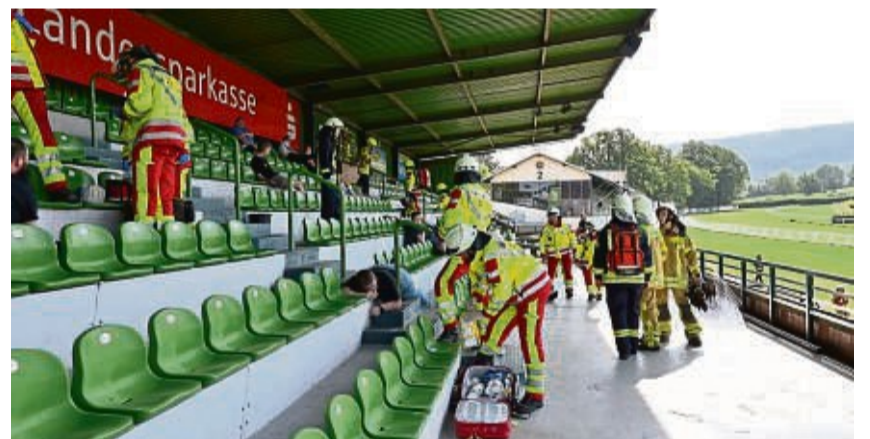
Bei einem Tribüneneinsturz wurde ein Massenansturm von Verletzten angenommen.