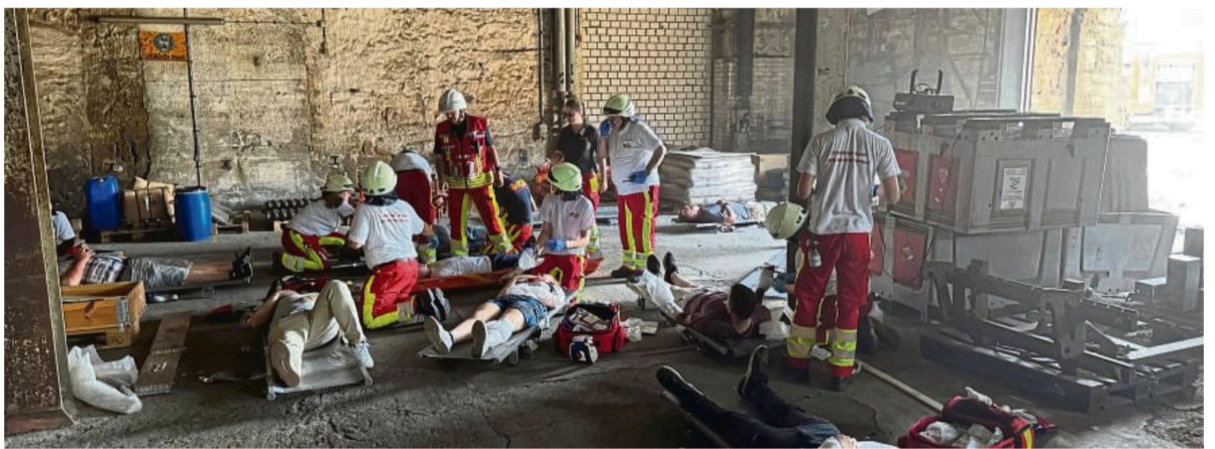
Ein Industriebetrieb wurde von den Teilnehmern als Übungsgelände genutzt.

Bemerkenswert war laut ASB, dass das angedachte Übungsszenario eines Vegetationsbrandes in der Region Harz durch den tatsächlichen Großbrand auf dem Brocken seit Freitag, 8. September, 2024, erschreckende Realität