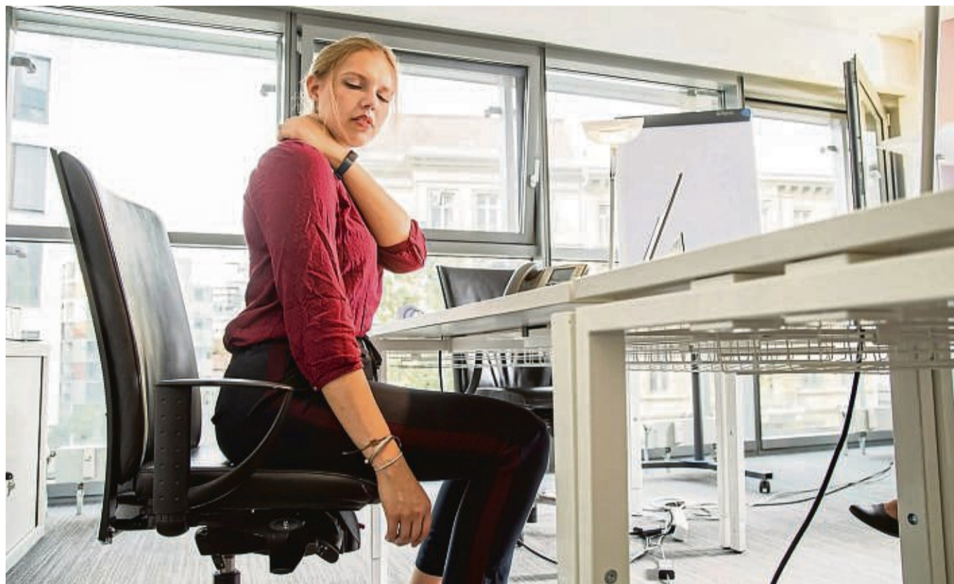
Eine schiefe Körperhaltung, oft durch lange Büroarbeit verursacht, kann zu Verspannungen und Schmerzen führen.

Wenn etwa das linke Schulterblatt etwas höher steht als auf der rechten Seite, hat man automatisch mehr Spannung zwischen den Schulterblättern. Links kann es somit eher zu Verspannungen im Schulterbereich kommen.