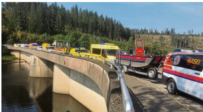
Geübt wurde vom ASB auch an der Staumauer der Okertalsperre.