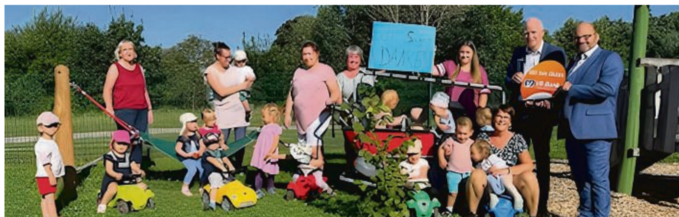
Die Freunde war groß über die Spende bei der Kita St. Martini in Dransfeld.