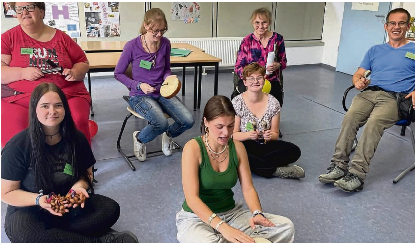
Beim Projekt Musik mit Bewegung der Berufsfachschule Ergotherapie der Berufsbildenden Schulen durfte jeder Gast ein Musikinstrument nach Wunsch bedienen.