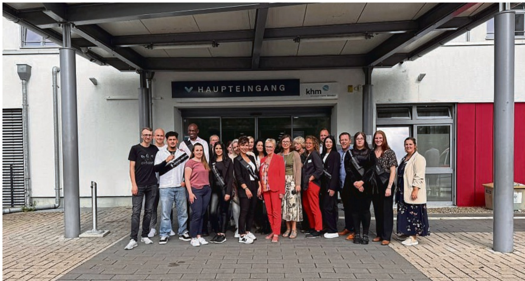
Sieben Pflegefachmänner und Pflegefachfrauen wurden in den Berufsalltag verabschiedet. Klinikum Hann. Münden übernimmt alle Schüler.

Die generalistische Pflegeausbildung, die es seit dem Ja-