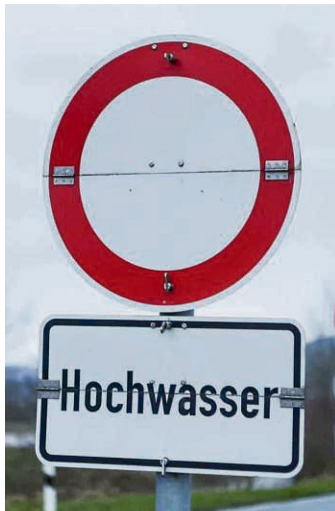
Nach Dauerregen kein seltenes Bild: Das Land Hessen hat sein Hochwasserportal überarbeitet.

die Pegelstände und Prognosen der angrenzenden Hochwasserzentralen, so unter anderem aus dem benachbarten Thüringen. Auch diese Pegel können über die Plattform abgerufen werden, mögliche Entwicklungen entlang der Werra können also auch bei unseren Nachbarn eingesehen werden. kmn