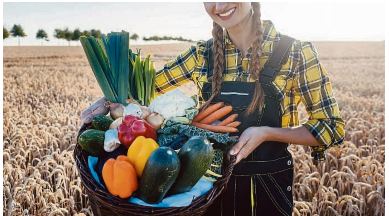
Frisch auf den Markt: Neben Herbst-Spezialitäten gibt es am Sonntag, 6. Oktober, auf dem Marktplatz und in den anliegenden Gassen auch Dekoartikel, Töpferwaren und vieles mehr zu entdecken.

Ab 12 Uhr spielt zum Frühschoppen der Musikverein Ungedanken auf der Marktplatzbühne.