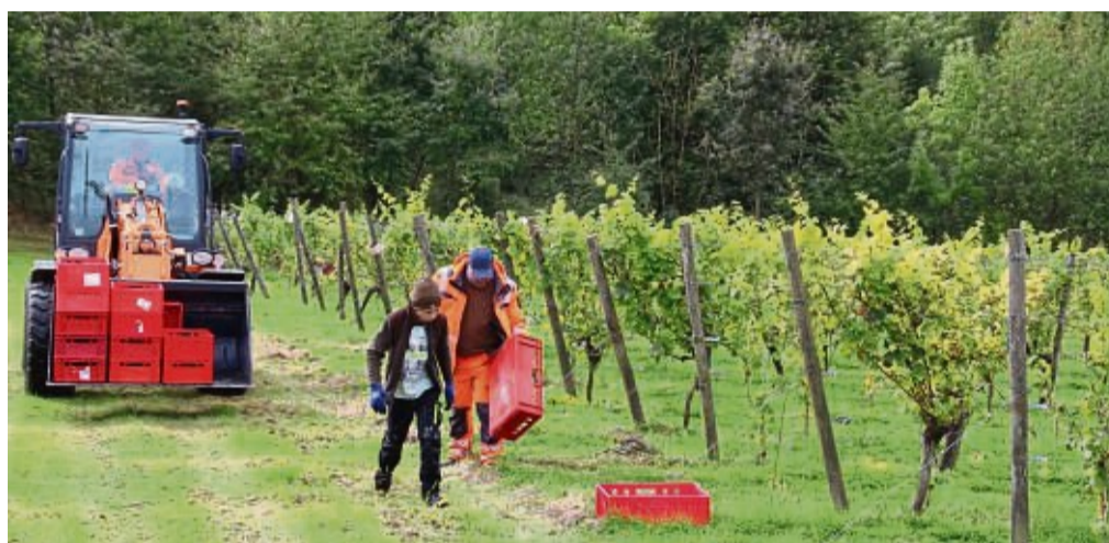
Leere Kisten: Beim Austeilen hatte man trotz schwerer Frostschäden auf eine bessere Ernte gehofft. Doch dann mussten viele Behälter leer eingesammelt werden.