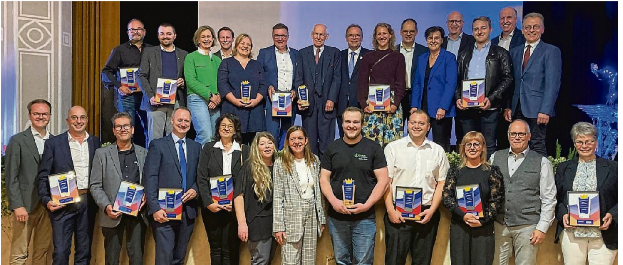
Die Schwalm-Eder-Krone wurde im Bereich Wirtschaft das erste Mal verliehen: Es gab Auszeichnungen in fünf Kategorien.