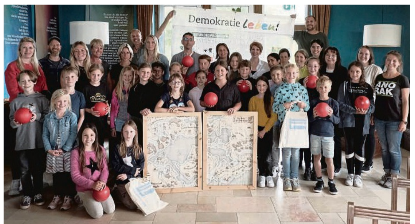
Echte Helden der Demokratie: Grundschul Kinder aus dem Landkreis haben an einem Demokratieprojekt teilgenommen.

Ein Höhepunkt der Reise sei der Projekttag „Das Hand-in-Hand-Land“ gewesen. Es fand auf der Ranch des Vereins Anorak 21 statt. Dabei kamen auch die Ponys des Vereins zum Einsatz. „Die Arbeit mit den Tieren ermöglicht eine Sensibilisierung bei den Kindern für ihr eigenes Verhalten und dessen Auswirkung auf das Empfinden des Gegenübers“, so Pascal