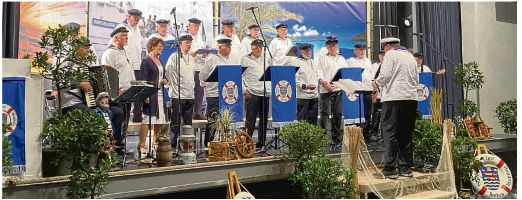
Hatte natürlich seinen Auftritt: Der Shantychor Homberg-Borken in Aktion.

Dass die Darbietungen an dem Abend im Bürgerhaus mühelos klingen, ist dem Übungsfleiß der Sänger zu verdanken und ihrer Erfah-