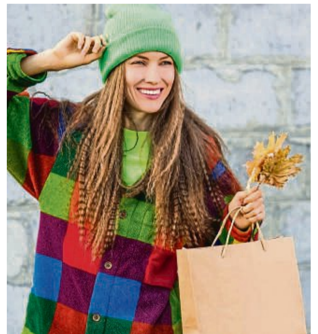
Herbstmode, Accessoires und Co. gibt es beim verkaufsoffenen Sonntag von 12 bis 18 Uhr.