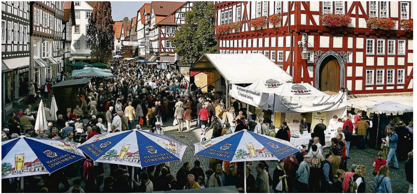
Spezialitätenfestival: Rund ums Melsunger Rathaus zeigen 40 Hersteller aus Nordhessen am 13. Oktober ihre Produkte, die nach Slow-Food-Kriterien hergestellt werden.

Teilnehmen darf nur, wer die Qualitätskriterien von Slow Food für eine gute, saubere und faire Herstellung von Lebensmitteln einhalten kann. Dazu müssen im Vorfeld die Zutatenlisten aller Produkte vorgelegt werden, die von Andrea Berg-Busch und Jakob Hinkel auf Einhaltung der Standards geprüft werden: Mitgebracht werden darf nur, was ohne Geschmacksverstärker und unnötige Zusatzstoffe und Hilfsmittel hergestellt ist.