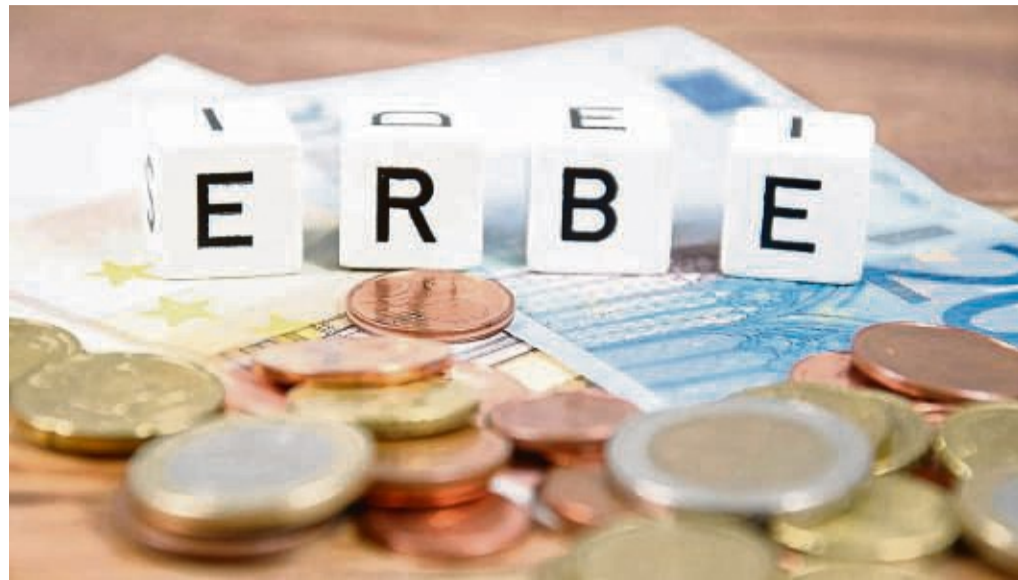
Am 18. Oktober findet im AWO-Altenzentrum in Wabern eine kostenlose Informationsveranstaltung zum Thema „erben und vererben“ statt.

Fundiert und anschaulich präsentieren sie die aktuellen Regelungen zur Erstellung eines Testaments. Anhand praxisnaher Beispiele erläutern die Referenten,