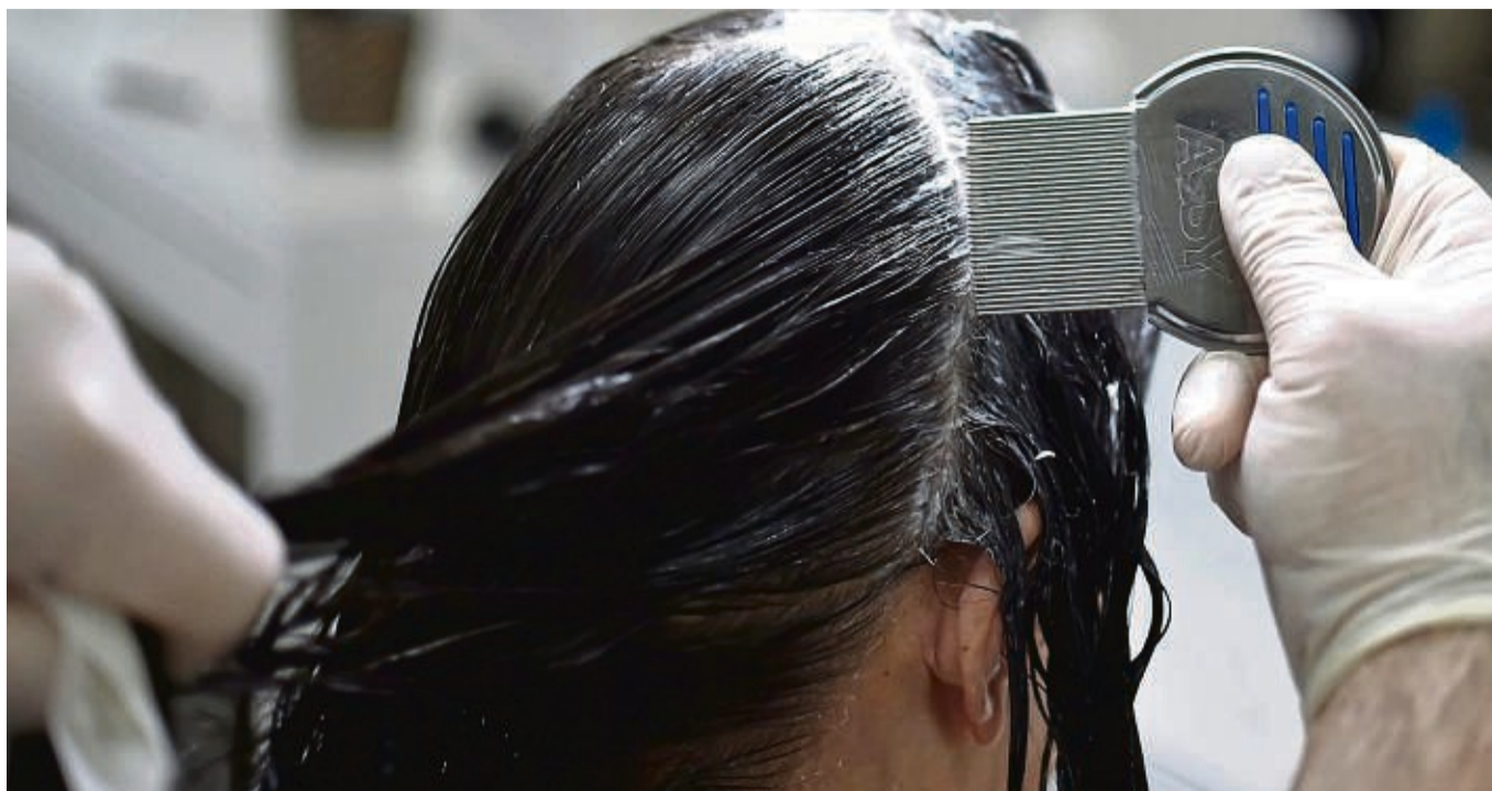
Lästig, aber ungefährlich: Weil Läuse im trockenen Haar schnell übersehen werden, ist das Auskämmen im nassen Zustand ratsam.

Die Läuse sieht man dem Kinderarzt zufolge erst dann, wenn sie sehr viele sind oder man sie mit einem Läuse-