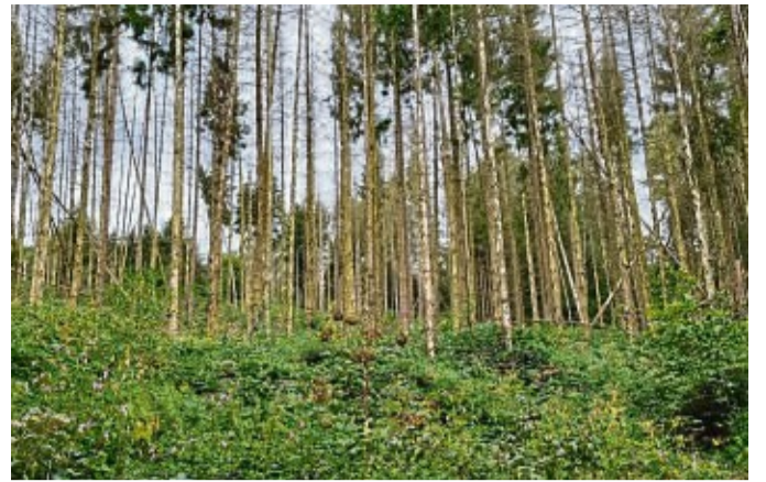
Kein guter Zustand: Das Foto zeigt einen Fichtenbestand, der infolge der vergangenen Trockenjahre größtenteils abgestorben ist.