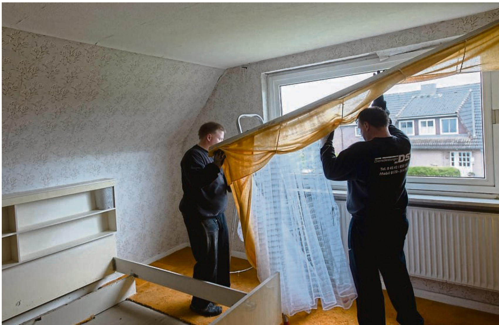
Sie müssen nicht alles allein machen: Manchmal kann es sinnvoll sein, Profis mit dem Ausräumen zu beauftragen.