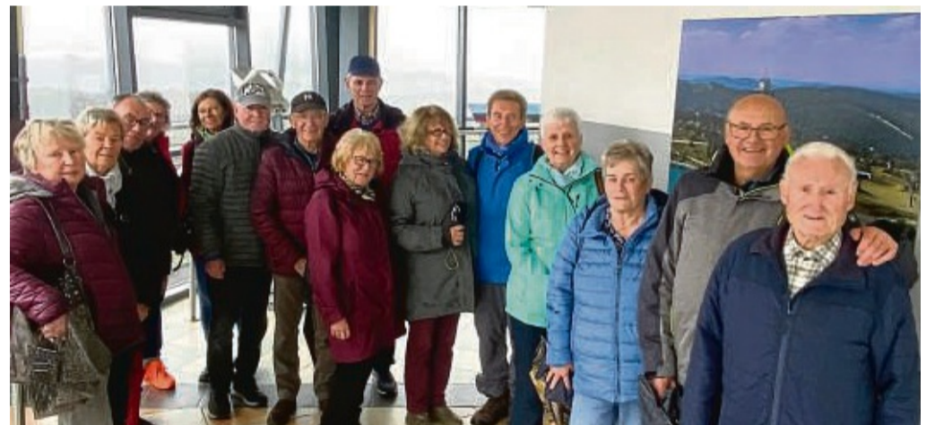
Hoch hinaus: Einige der Seniorenfahrt-Teilnehmer hatten sich für eine Fahrt mit der Seilbahn auf den Ettelsberg entschieden. Oben angekommen stand auch der Besuch des Hochheideturms auf dem Programm.