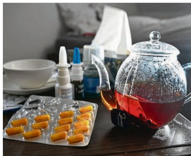
Wer Erkältungen gründlich auskuriert, verhindert oft eine Nasennebenhöhlenentzündung.

Etwas sanfter sind Nasensprays auf Basis von Meerwasser. Was die Nase ebenfalls