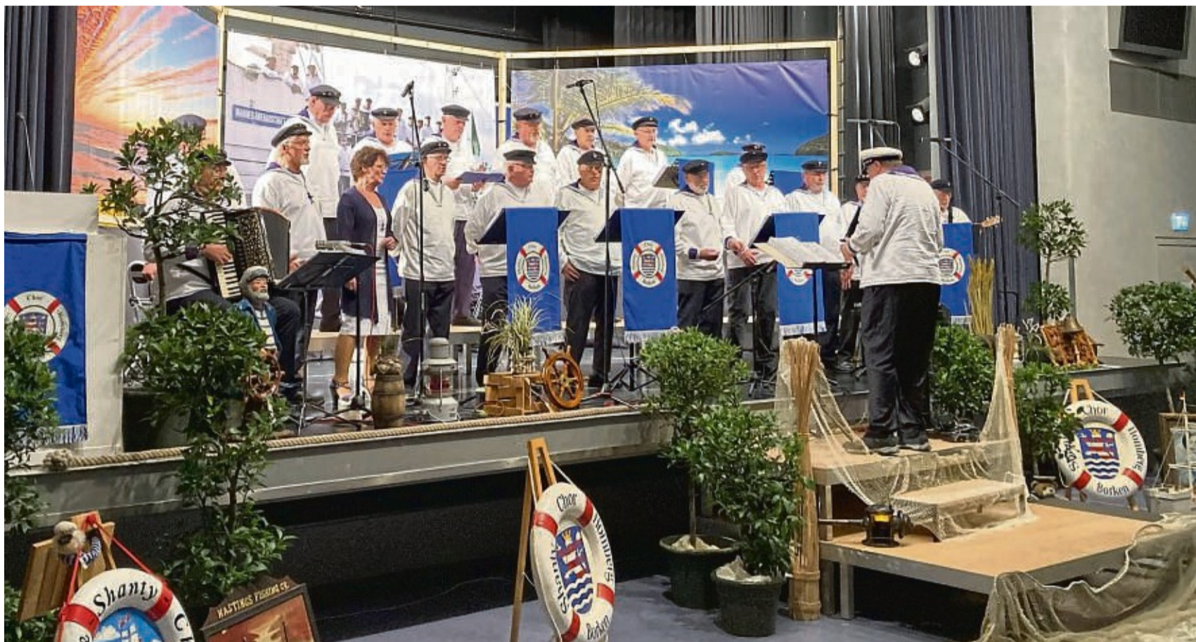
Hatte natürlich seinen Auftritt: Der Shantychor Homberg-Borken in Aktion.