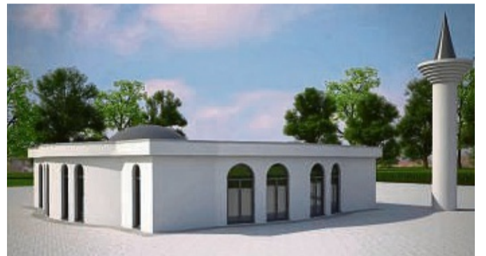
Das ist der Plan: Im Frühjahr wird die Borkener Moschee umgebaut.

de Borken auch ihr Herbstfest. Mehrere Hundert Gäste feierten bei leckeren Speisen, Getränken und landestypischen Tänzen und Gesang mit der Gruppe Endaze aus Dortmund.