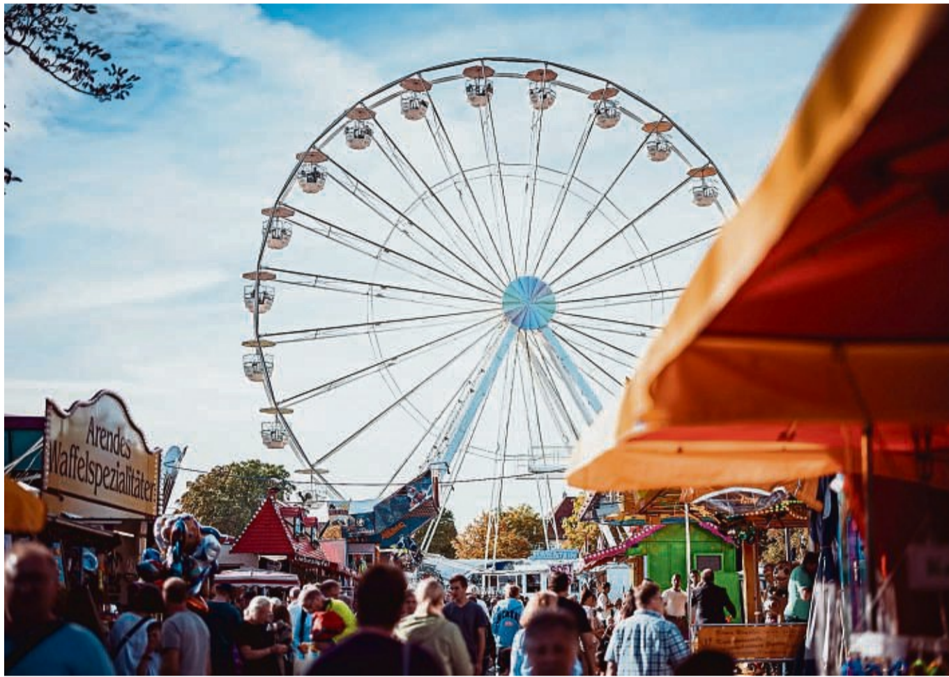
„Feiern mit Freunden“: Am 28. September startet die 75. Auflage der Oktoberwoche in Warburg, die wieder zahlreiche Attraktionen bereithält.

„Als Schirmfrau Ihrer diesjährigen Oktoberwoche freue ich mich darauf, das besondere Flair der Veranstaltung zu erleben“, kündigt Mona Neubaur an. Sie unterstreicht die wachsende Bedeutung eines Festes, wie das der Warburger Oktoberwoche „in herausfordernden Zeiten, die uns alle mit ihren Krisen belasten.“ Das beste Mittel, um neue Kraft zu schöpfen, sei das, was im Mittelpunkt der Festwochen stehe: „Das Gemeinschaftsgefühl und das Herzblut vieler engagierter Bürgerinnen und Bürger und