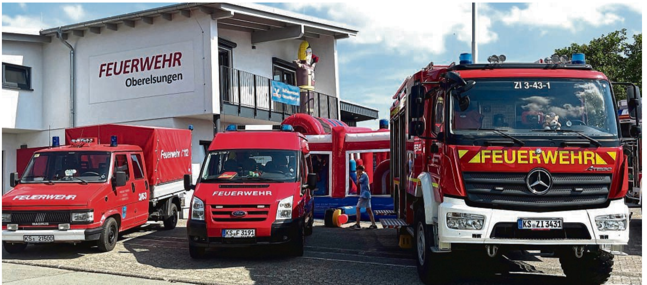
Einsatzflotte vorm sanierten Feuerwehrhaus: Nach vierjähriger Bauzeit konnte Oberelsungens Hilfs- und Rettungsstation nun eingeweiht werden.