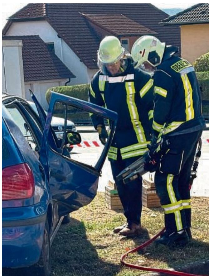
Vorführung: Zwei Feuerwehrmänner zeigen, wie sie mithilfe eines hydraulischen Spreizers beschädigte Autotüren öffnen.

Die Geselligkeit kam auch nicht zu kurz. Bei Kaffee, Kuchen, Bratwurst und kühlen Getränken konnten die Besucher sich unterhalten und die Vorführungen der Jugendfeuerwehr verfolgen.