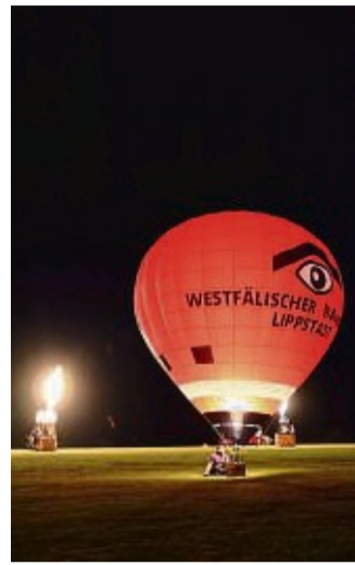
Zumindest ein Ballon glühte: Der Wind spielte nicht mit. Aber einen Eindruck, wie es hätte aussehen können, wenn alle vier Ballons glühten, bekamen die Zuschauer am Abend trotzdem.

baut. Für die Kinder boten Hüpfburg, Malaktionen sowie ein Spielplatz Abwechslung und Unterhaltung.