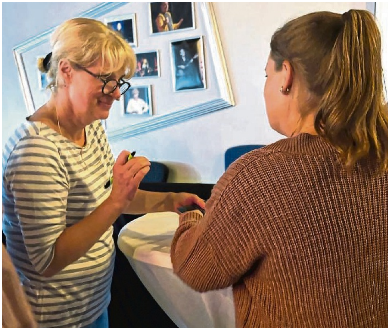
Signierstunde: Erfolgsautorin Nele Neuhaus (links) erfüllte zahlreiche Autogrammwünsche und signierte im Kulturladen in Wolfhagen Bücher.

Die nächsten Romane liefen ebenfalls über den Selbstverlag, bis der Ullstein Verlag auf Nele Neuhaus aufmerk-