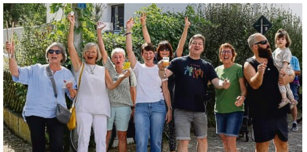
Beste Stimmung bei den Besuchern des Umzugs auch am Straßenrand.