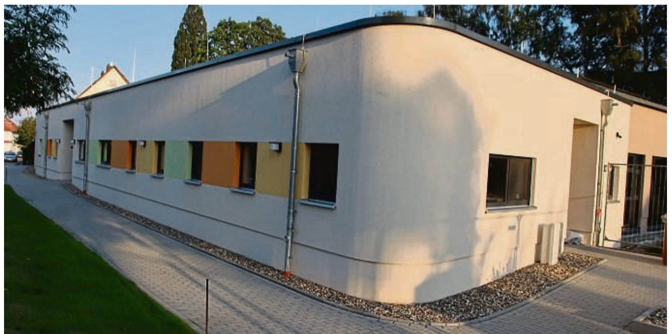
Modernster Kindergarten Hofgeismars: Am Reithagen entstand die neue KiTa, die bis zu 75 Kindern Platz bietet.

Drei gleich große Gruppenräume finden Platz in dem modernen Gebäude, das in dem großen luftigen Hauptraum drei Spielinseln beherbergt. Diese gewährleisten auch bei schlechtem Wetter eine hohe Aufenthaltsqualität für die circa 75 Kinder im Alter von 2 bis 6 Jahren, die hier wochentäglich zwischen 7 und 17 Uhr betreut werden. Aber