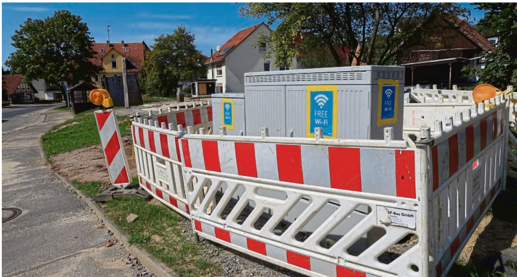
Widerspruch: In der Ortsmitte wird den Gottsbürenern freies Wlan angeboten (Bild), gleichzeitig will das Unternehmen offenbar doppelte Gebühren kassieren. HNA-Recherchen ergaben, dass es sich um eine Abrechnungspanne handelt.