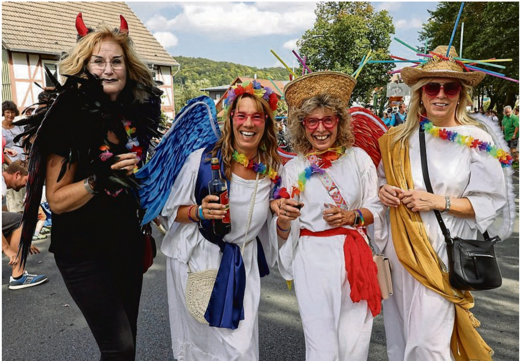
Höhepunkt der Dörnberger Kirmes ist der Umzug: Gemeinsam feierten Engelchen und Teufelchen.

Diese Einschätzung werden neben den meisten Einheimischen vermutlich auch viele der zahlreichen Besucher und Besucherinnen teilen, die sich am Sonntagmittag auf den Weg machten, um dem großen Festumzug