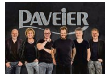
Die Band Daveier sorgt am 1. Oktober für Stimmung auf der Warburger Oktoberwoche.

Am Montag, 30. September, rockt die Hermes House Band das große Festzelt. Mit partywütigen Coverhits wie „Country roads“, „Life is life“ oder „que sera sera“ bringt die Band ihren rhythmusbetonten, unverwechselbaren Partysound mit nach Warburg und bildet damit nur eines der vielen Programmhilights. nh