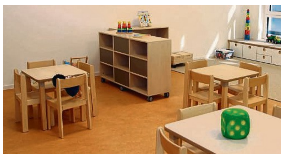
In drei Gruppenräumen können die Kinder bei schlechtem Wetter zum Beispiel mit einer Puppenküche spielen.

Fortsetzung ▶ bildet das Satteldach. Im Flachdachbereich mit Folienabdichtung wird ein Gründach entstehen und eine PV-Anlage ist vorgesehen. Die Fassadenfläche ist mit Außenputz farbig abgesetzt und die kleinformigen Fenster sind aus Aluminium und Kunststoff. Zur technischen Gebäudeausstattung gehören zwei Luft-Wasser-Wärmepumpen, die reversibel für Heizung und Kühlung einsetzbar sind. Die Aufenthaltsräume wurden mit Fußbodenheizung ausgestattet. Die Lüftung erfolgt über eine zentrale Lüftungsanlage mit Wärmerückgewinnung. In den Sanitärräumen mit seiner nutzungsbedingten – sprich: auf Kindergröße angepasste – Ausstattung findet eine dezentrale Warmwasserversorgung mit Durchlauferhitzern statt. Die Elektroausstattung kann auf die PV-Anlage zurückgreifen. 42 Firmen waren am Bau beteiligt, der Großteil aus der unmittelbaren Region. Die Kosten für das Projekt betragen circa 3 945 000 Euro und