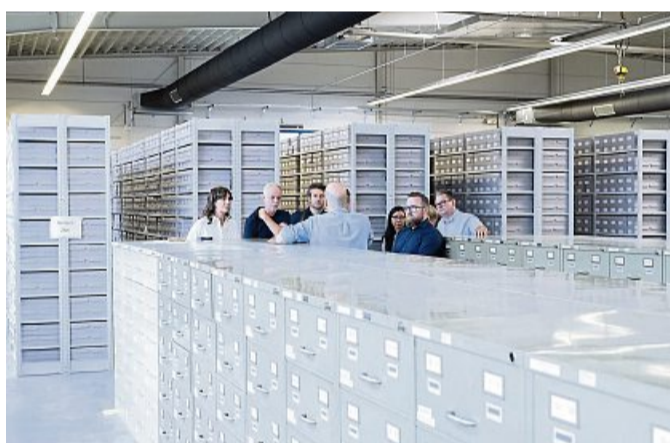
Arolsen Archives: Die Architekt*innen des Büros Nieto Sobejano Arquitectos besuchen das jetzige Archiv der Arolsen Archives.