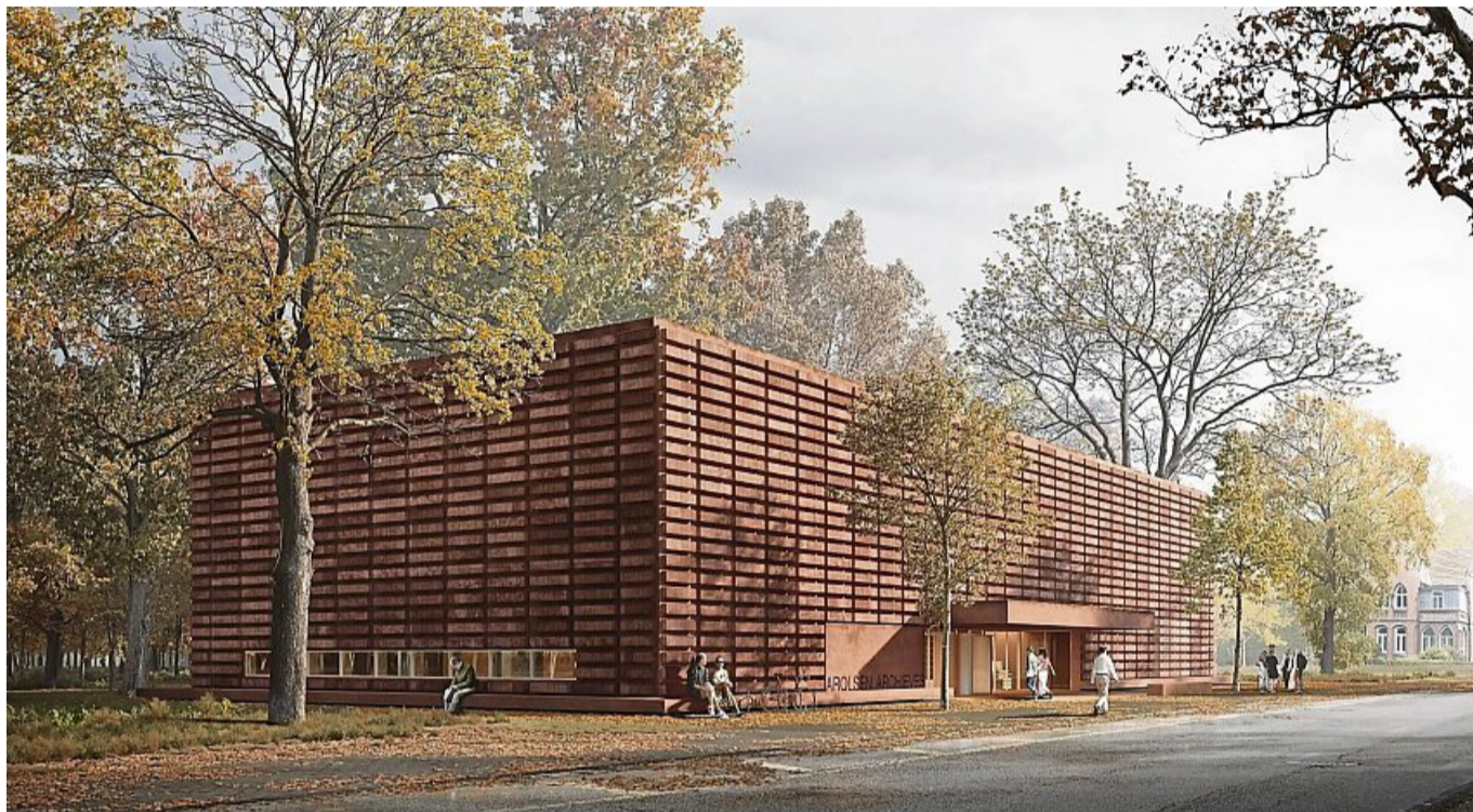
Arolsen Archives: Eine moderne Fassade aus rot eingefärbten Betonfertigteilen, die an Schachteln und Archivboxen erinnert: So wird das neue Archivgebäude der Arolsen Archives aussehen. NIETO SOBEJANO ARQUITECTOS

Mit der Beauftragung des spanisch-deutschen Architekturbüros geht das Projekt ab sofort in die Planungsphase. Derzeit arbeiten die Architekten von Nieto Sobejano bereits an einer detaillierten Ausführungsplanung des Neubaus. Mit der Realisation von modernen Archiv- oder Museumsgebäuden kennt sich das Team bestens aus. Viele Kultureinrichtungen weltweit planen ihre Neubauten und Erweiterungen mit dem renommierten Architekturbüro. Nieto Sobejano hat beispielsweise zuletzt das historische Dresdner Blockhaus für die Nutzung als „Archiv der Avantgarden“ moder-