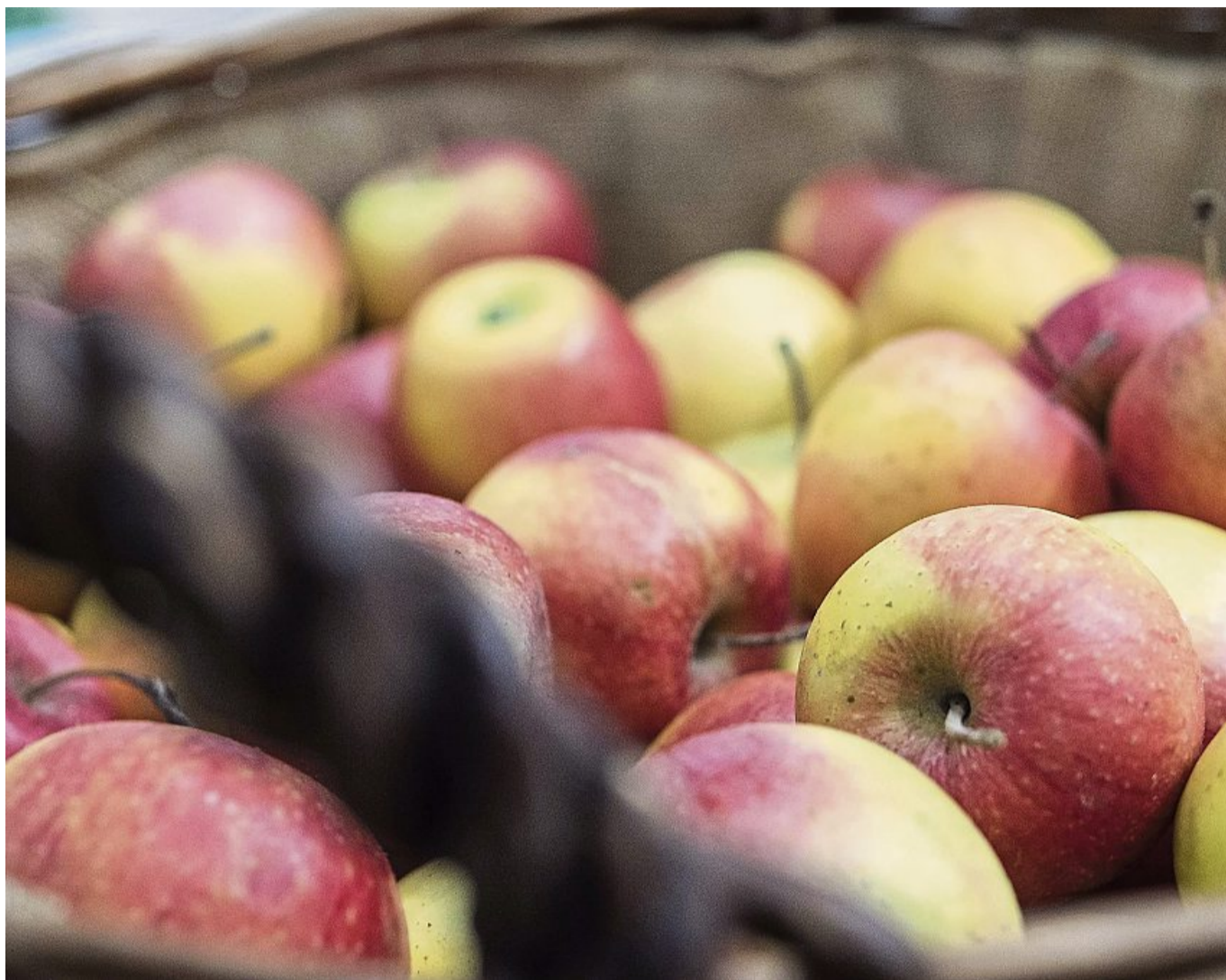
Äpfel sind vielseitig: Ob für Apfelstrudel, Salate oder als frischer Snack - für jede Verwendung gibt es die passende Sorte.

Das Bundeszentrum für Ernährung (BZfE) gibt Tipps: Für Apfelstrudel oder Pfannkuchen eignen sich besonders süß-säuerliche Sorten wie „Boskoop“ oder „Elstar“. Sie behalten auch beim Backen ihren intensiven Geschmack. Desserts wie Crumble oder Muffins profitieren von Sorten, die einen süßen und aromatischen Geschmack haben. Daher eignen sich dafür besonders Sorten wie „Braeburn“ oder „Gala“. Bei herzhaften Salaten mit herbem Chicorée, Radicchio oder Endivie sorgen Äpfel wie „Cox Orange“ oder „Rubinette“ für eine frische Note, gerade in Kombination mit Pilzen oder Walnüssen. Auch mit Käsewürfeln auf Spießen oder auf