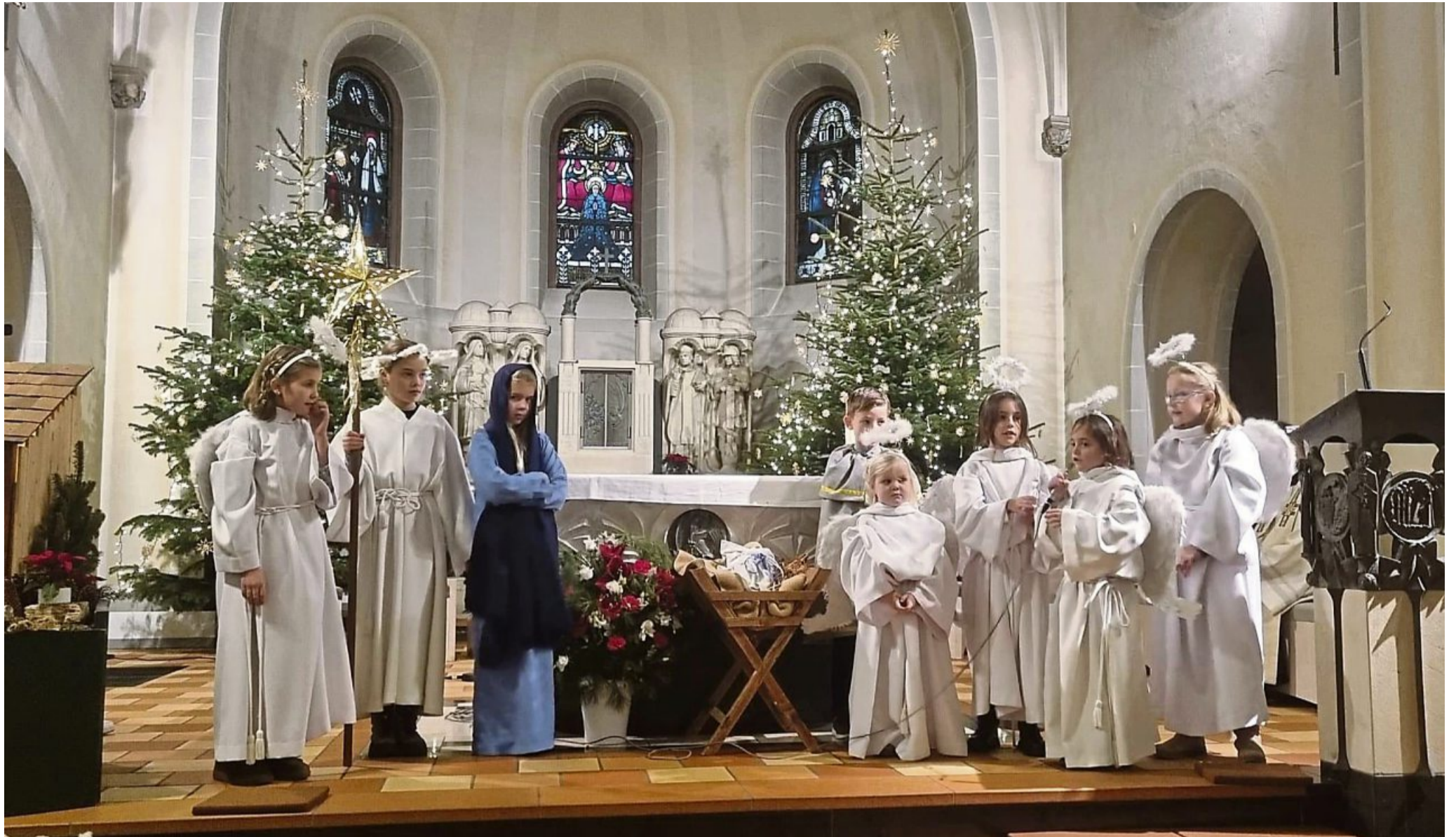
Mitwirkende gesucht: Das Krippenspiel hat in der Korbacher Kirchengemeinde St. Marien eine lange Tradition. Ob es in diesem Jahr stattfindet, ist fraglich, da sich bislang keine Interessenten gemeldet haben.