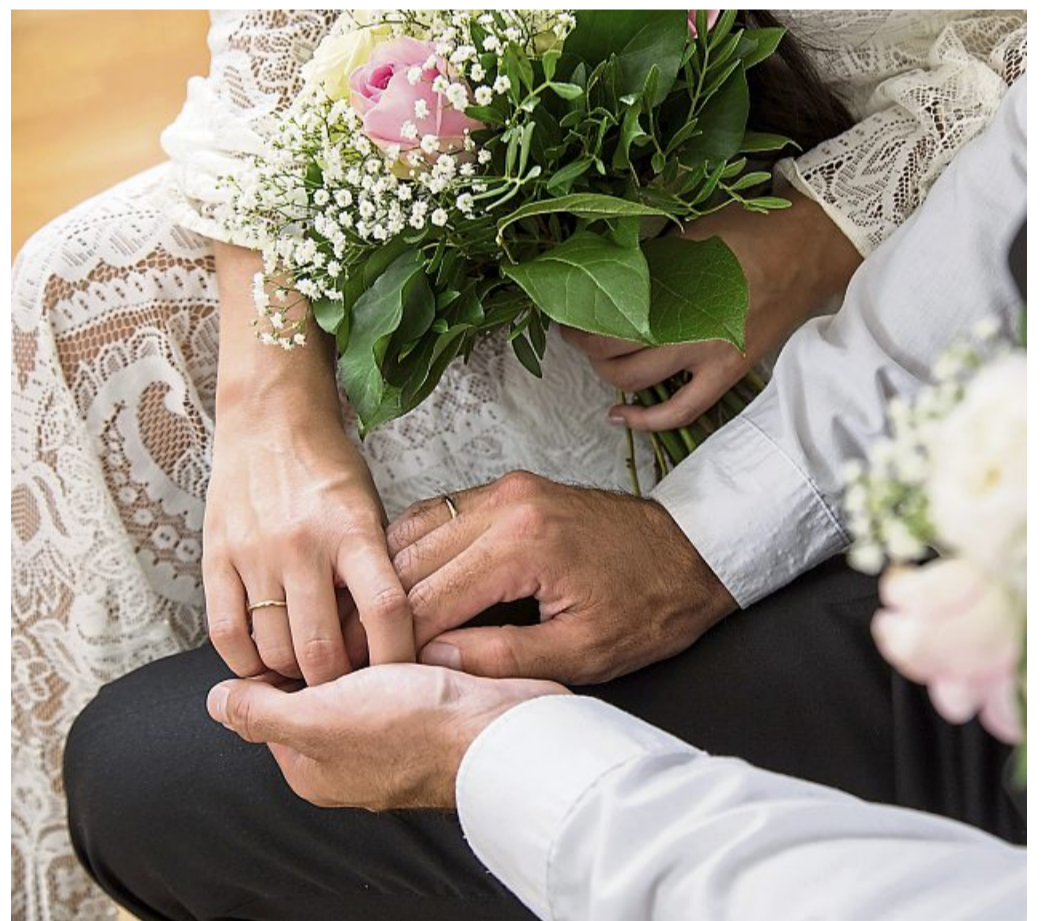
Ein Ehevertrag gilt manchen als unromantisch, kann aber individuell gestaltet werden.