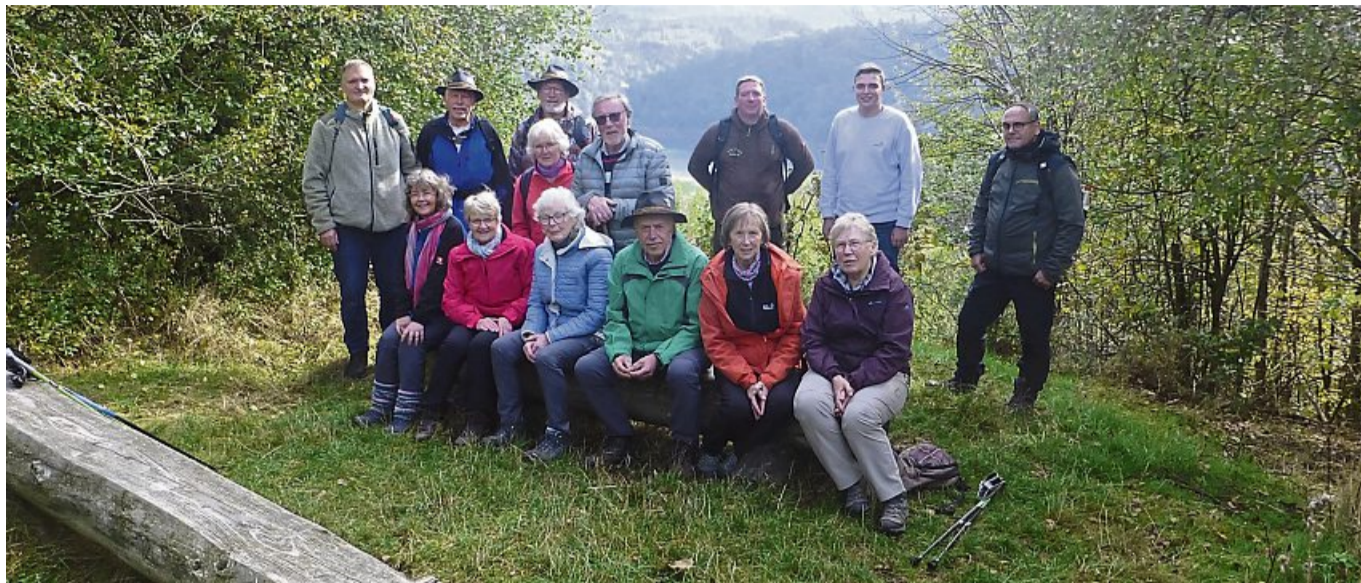
Jubiläum am Ringelsberg: Die Wanderer machten Rast auf dem Ringelsberg bei Asel-Süd - mit Blick auf den Edersee und das Hochspeicherbecken im Hintergrund.

Bereits am Sonntag, 27. Oktober steht die nächste Wandertour an. Sie führt unter der Leitung von Wilfried Schnatz „Auf