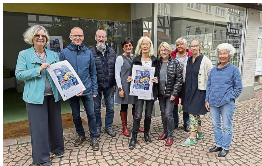
Ort der Begegnung: Der Verein Kunstraum Bad Wildungen zieht für einige Zeit in den Start-Up-Laden in der Brunnenallee 34 und will mit seinem Engagement dazu beitragen, die Altstadt zu beleben.

ne Ideenwerkstatt und ein Kommunikationsraum sein. Die Ladenfläche ist groß genug und bietet jede Menge Raum für Inspiration.