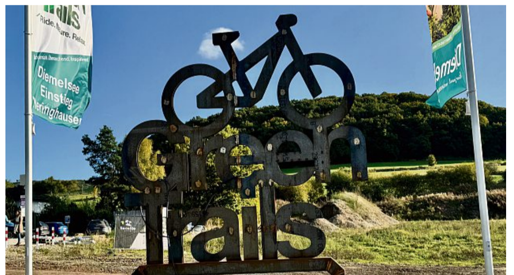
Das neue Einstiegsportal zum Greentrail in Hringhausen ist schon jetzt ein beliebtes Selfie-Motiv.