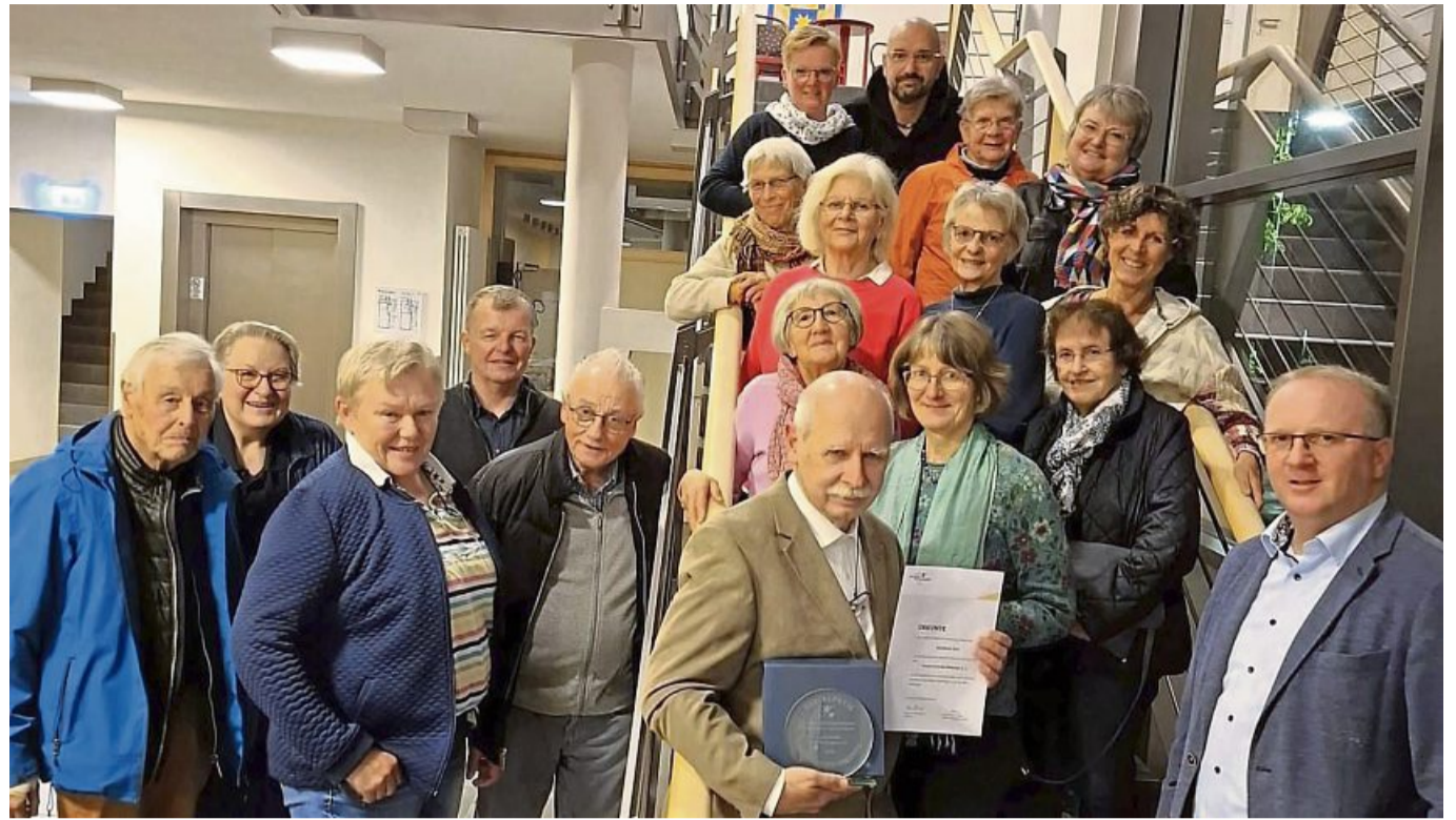
Der Hospizverein Bad Wildungen sucht eine hauptamtliche Koordinatorin.