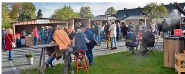
Auf Gut Glindfeld finden vom 25. bis 27. Oktober die „Novemberträume“ 2024 statt.

Ein Ausstellerplan gibt eine Übersicht unter www.gutglindfeld.de . ma