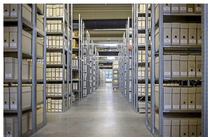
Der Blick ins ausgelagerte Archiv zeigt ein gewaltiges Magazin mit Regalen, so weit das Auge reicht.