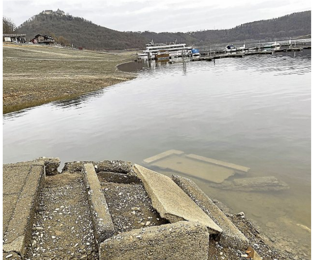
Abgerutscht: Die Grabplatten auf dem Grabfeld bei Berich, aufgenommen im Dezember 2021.

Edersee – Nach dem Bau der Edertalsperre in 1914 wurden Ruinen der ehemaligen Dörfer und Grabstellen überflutet. An einigen Gräbern in Bringhausen und Berich nagt schon seit Jahren der Zahn der Zeit, Platten sind abgebrochen, Grabstellen sind durch Ausspülungen beschädigt. Der Wasserstraßen- und Schifffahrtsamt (WSA) Weser will nun bei fallenden Wasserständen durch den Außenbezirk Edertal die