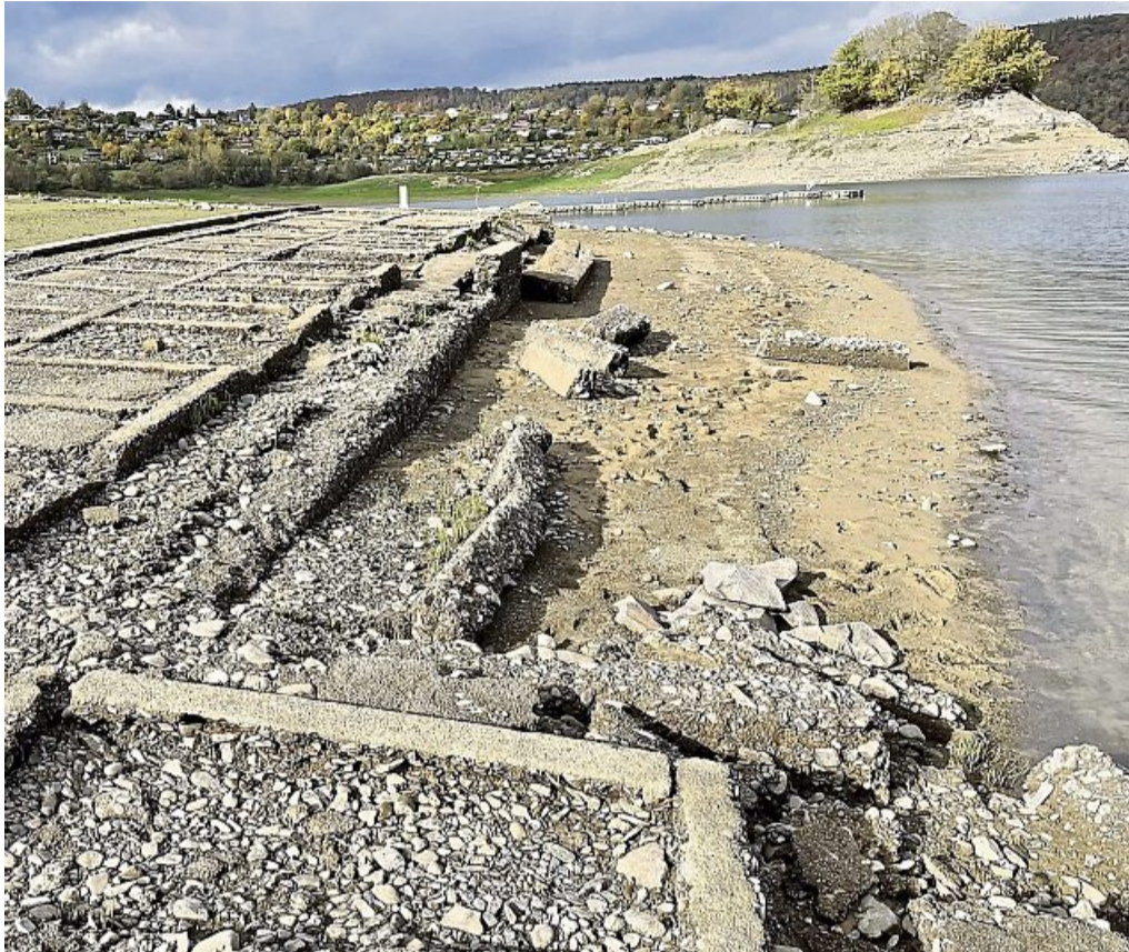
Das Atlantis bröckelt: Gräber am Grabfeld von Alt-Bringhausen sind deutlich vom Zerfall gezeichnet; im Bild eine Aufnahme vom 31.10.2023.