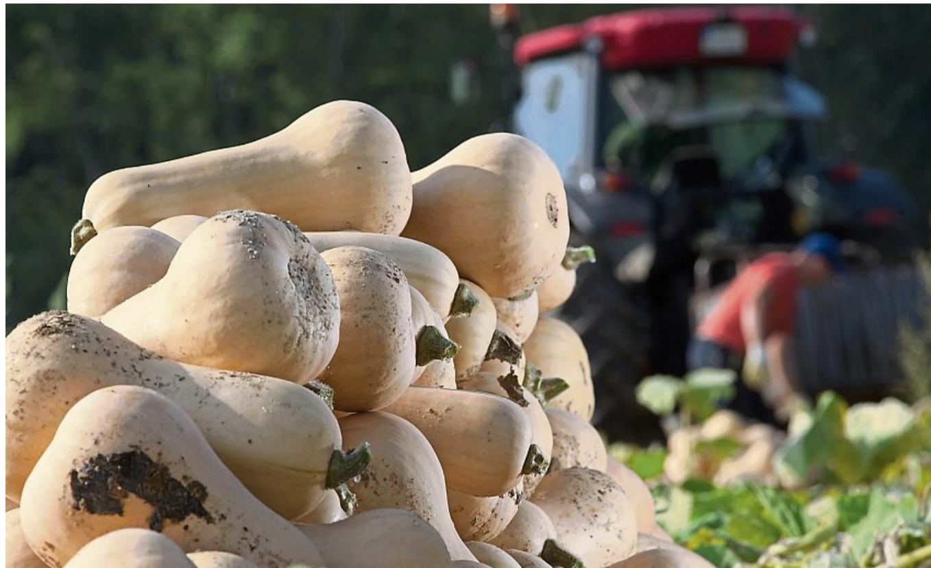
Der Name ist Programm: Die Vorzüge des Butternut-Kürbisses ist sein milder nussigbuttriger Geschmack.

HERBSTGENUSS Mit Ravioli-Kunst oder Fruchtsalat