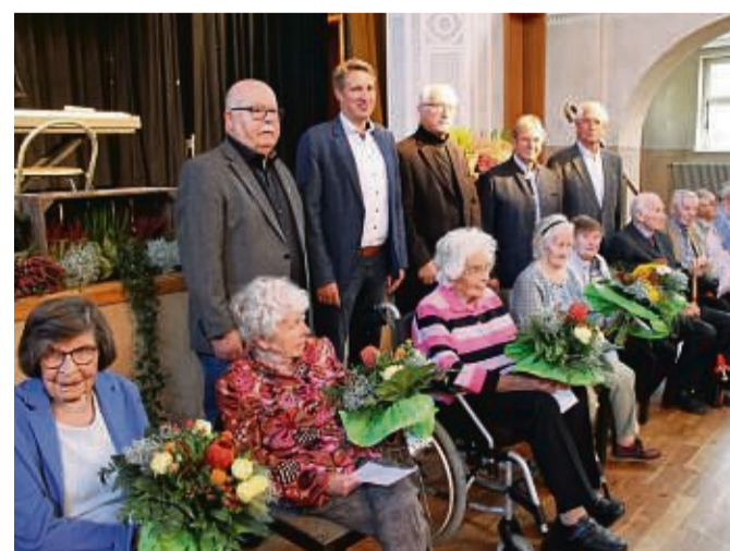
Ehrung der ältesten Homberger: Beim Seniorennachmittag bedachte die Stadt die ältesten Teilnehmer mit einem Präsent.