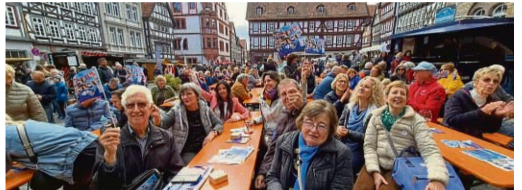
Alsfeld Bürgerfest „Grande Fête du Jumelage“ zu Ehren der 50-jährigen Städtepartnerschaft mit Chaville

Die Geschichte „50 Jahre Chaville-Alsfeld“ wurde in einer Festschrift dokumentiert, die man für zwei Euro beim Städtepartnerschaftsverein Alsfeld sowie auf dem Schokoladenmarkt am 27. Oktober und auf der Herbstmesse vom 1. bis 3. November am Stand des Städtepartnerschaftsvereins erhalten kann. Darüber hinaus bringt der Städtepartnerschaftsverein zum Schokoladenmarkt das Alsfelder Wimmelbuch heraus, in dem Alsfelds Städtepartnerschaften ebenfalls eine große Rolle spielen. red