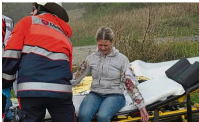
Realistisches Szenario: Bei der Katastrophenschutzübung waren auch „verletzte“ Menschen dabei.

versammelten sich zunächst am sogenannten Bereitstellungsraum am Herkules-Baumarkt in Fritzlar.