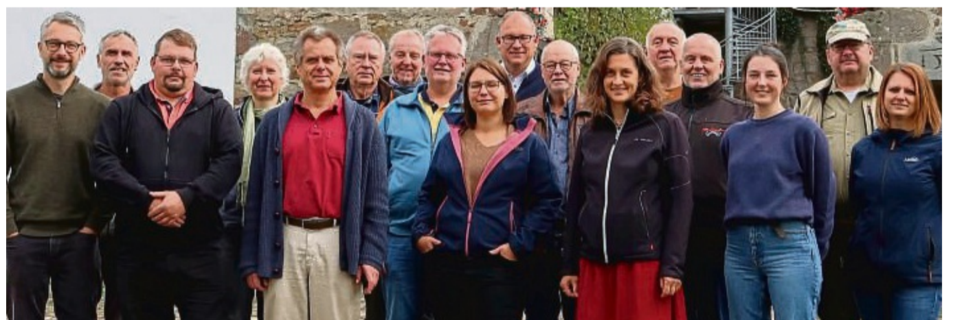
Sie machen alle mit: die Steuerungsgruppe für das Projekt „Ökologisches Grünflächenmanagement“ im Naturpark Knüll.

So hat Ottrau beispielsweise bereits 2022 anlässlich des