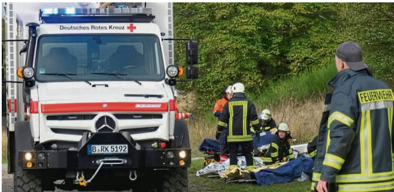
Feuerwehrleute und das Deutsche Rote Kreuz waren bei der Katastrophenschutzübung im Einsatz.