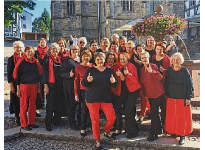
Freuen sich über ihre Auszeichnung: die Gruppe New Voices.