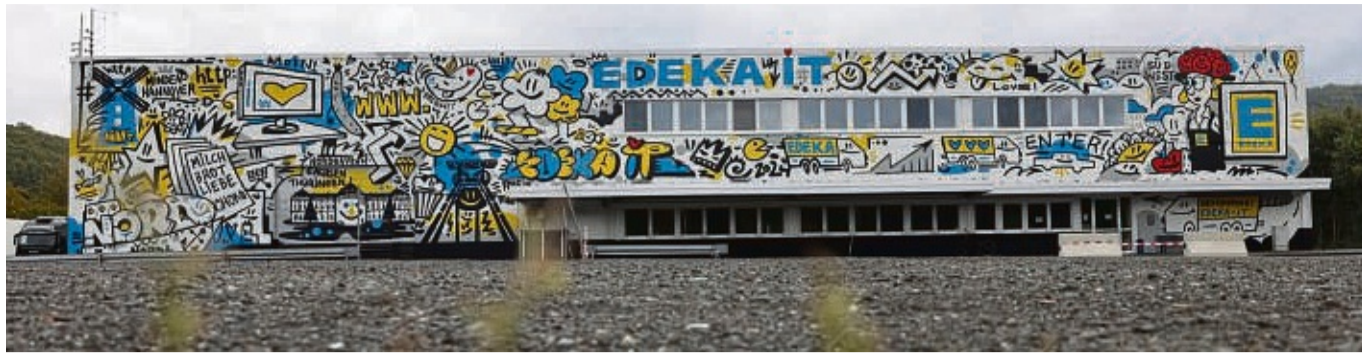
Hingucker: In dem neuen Wandgemälde der EDEKA IT-Halle lässt sich viel entdecken.