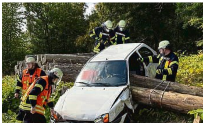
Einsatzkräfte räumen nach einem nachgestellten Unfall auf, der zur Katastrophenschutzübung dazugehört.