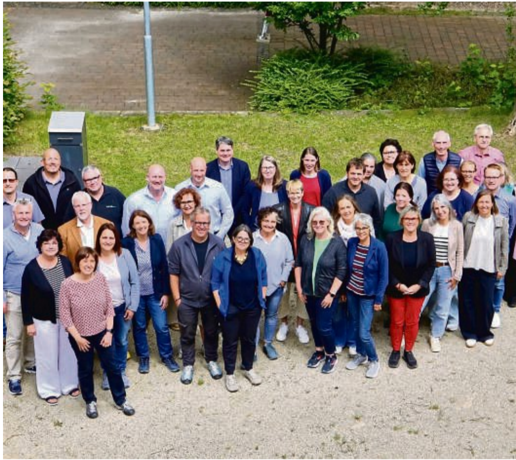
Schulleitungen aus ganz Hessen waren zu Gast bei der Hephata-Förderschule in Schwalmstadt-Treysa und sprachen über Ganztagsbetreuung.

40 Schulleitungen diskutieren im Hephata-Kirchsaal