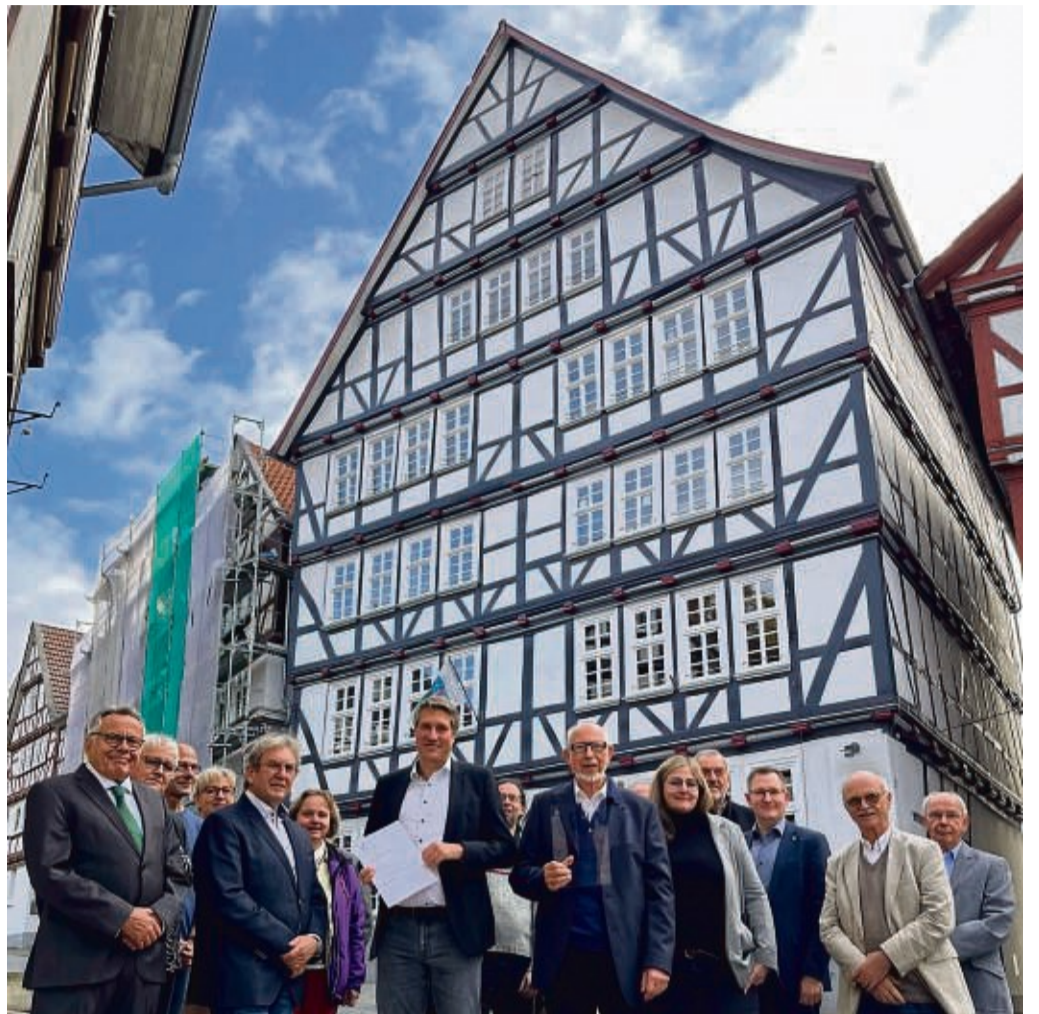
Vor dem „Haus der Geschichte“: Vertreter der Stadt, der Arbeitsgemeinschaft Deutsche Fachwerkstädte, der Vereine und des Architekturbüros Hess freuen sich über die Auszeichnung für herausragende Fachwerksanierung.