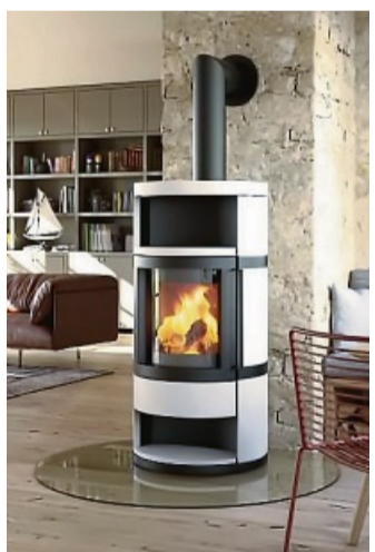
Neue Kamine oder Kachelöfen entsprechen der Verordnung und dürfen weiterhin betrieben werden.

Bei Unsicherheiten, ob der eigene Kamin- oder Kachelofen, Heizkamin oder Pelletofen die geforderten Emis-