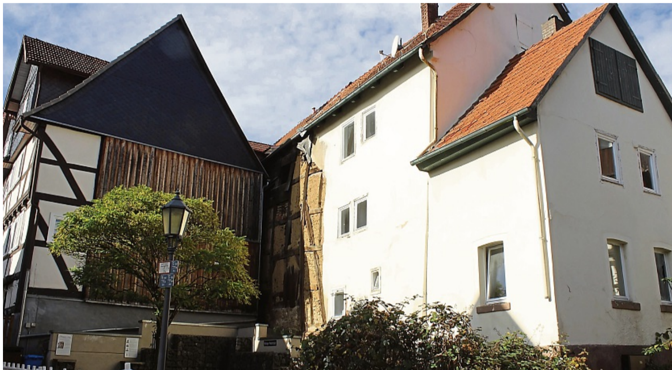
Verfällt zusehends: Die Hinterstraße 30 (rechts). Wegen der Gefahr durch herabfallende Gebäudeteile ist der öffentliche Mundartplatz links daneben seit Langem gesperrt. MATTHIAS SCHULD

Bad Wildungen – Das Haus Hinterstraße 30 in der Wildunger Altstadt steht leer und verfällt seit Jahren. Drei Termine zur Zwangsversteigerung verliefen ergebnislos. Am 31. Oktober folgt nun der vierte Termin am Amtsgericht Fritzlar, und der Wildunger Magistrat hätte gerne bis zu 10 000 Euro geboten, falls sich an Halloween erneut kein privater Interessent für den historischen Fachwerkbau findet.