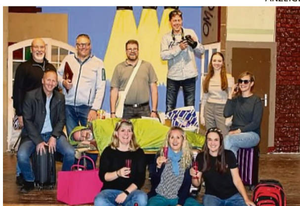
Die Medebacher Laienspieler unternehmen eine aufregende Zugfahrt.