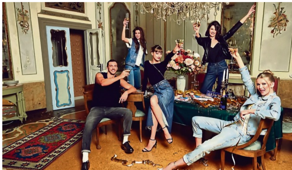
Das Modehaus Manhenke feiert sein 100-jähriges Jubiläum nach. Alle Kunden können sich bis 9. November an allen Standorten über 20 % Rabatt auf das gesamte Sortiment freuen.

Fünf Jahre später erfolgte der Anschluss weiterer Verkaufsflächen unter der Unterführung in den Räumen von ehemals Spielzeug