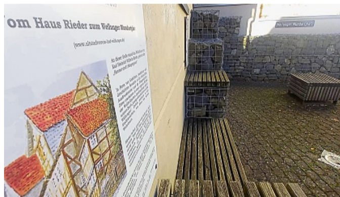
Seit mehr als zwei Jahren ist der „Wellunger Mundartplatz“ gesperrt, bedauert nicht nur der Altstadtverein. SCHULD

Eine intensive Debatte war vorausgegangen. Der Magistrat mit dem Bürgermeister an der Spitze hatte etliche Argumente für seine Idee ins Feld geführt. Der leere Bau gelte als „Lost-Place“, in dem sich wiederholt „zweiwichtige Gestalten aufhal-