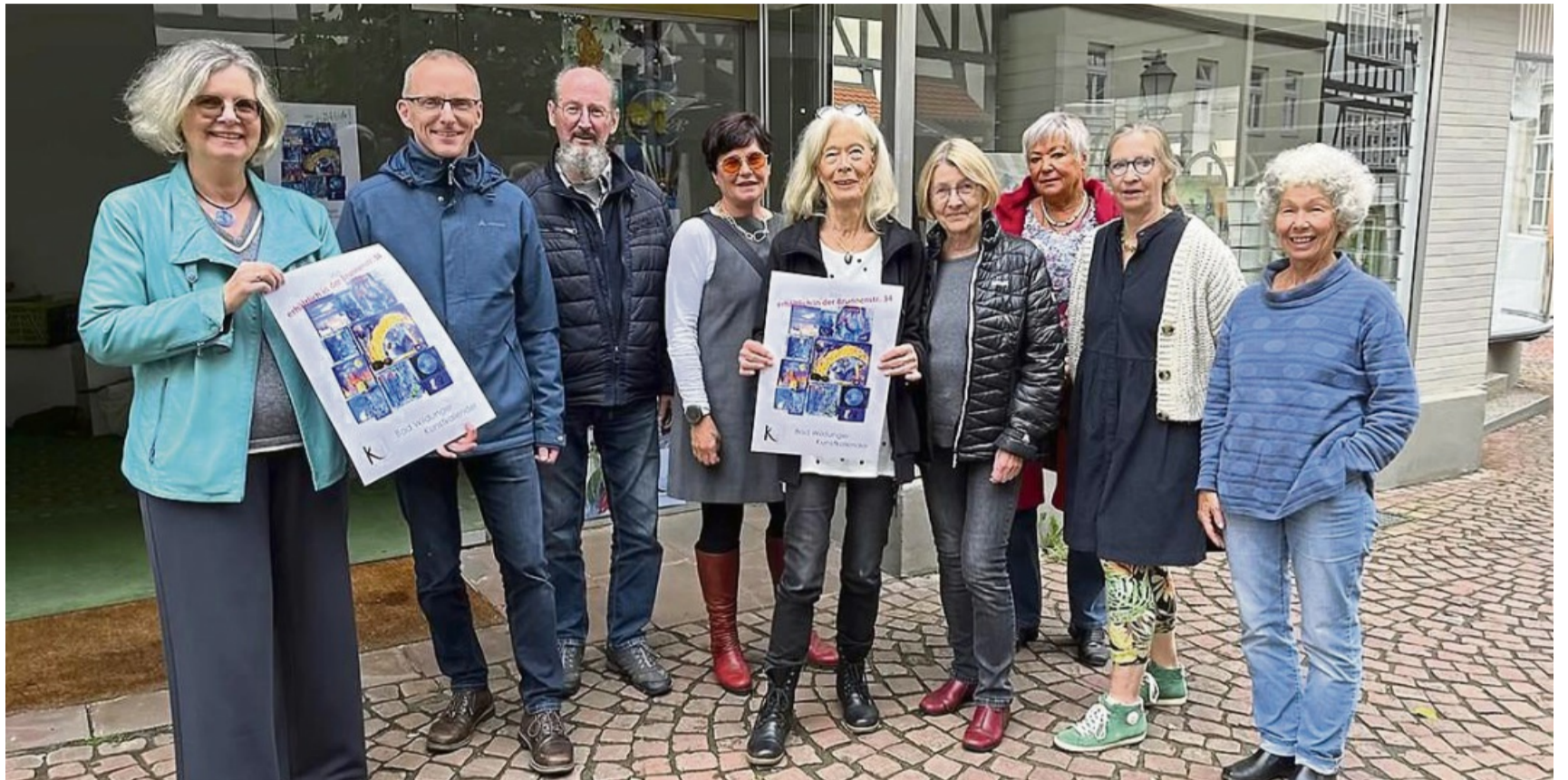
Ort der Begegnung: Der Verein Kunstraum Bad Wildungen zieht für einige Zeit in den Start-Up-Laden in der Brunnenallee 34 und will mit seinem Engagement dazu beitragen, die Altstadt zu beleben.

Das Kunstgeschäft wird am Samstag, 19. Oktober, um 17 Uhr zusammen mit dem abendlichen Altstadtfest eröffnet. Ein besonderes Angebot zur Eröffnung ist der Verkaufsstart des druckfrischen Bad Wildunger Kunstkalenders 2025. Er kann für 29 Euro erworben werden, ein Teil des Kaufpreises ist für einen guten Zweck bestimmt. Außerdem sind Bilder und