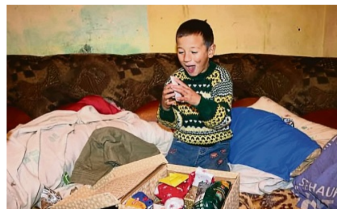
Ein rumänischer Junge freut sich sehr über sein Weihnachtspäckchen.

Die diesjährige Sammelaktion läuft vom 28. Oktober