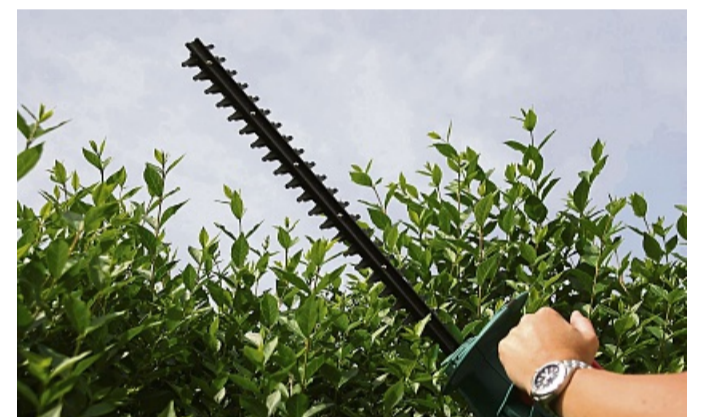
Rückschnitt empfohlen: An Edertaler Straßen behindern wuchernde Hecken und Gehölze die Sicht.

Entsorgen können die Edertaler ihren Baum- und Strauchschnitt bis zum 31. März auf dem Schredderplatz in Anruff. Geöffnet ist er mittwochs von 14 bis 17 Uhr und samstags von 9 bis 12 Uhr.