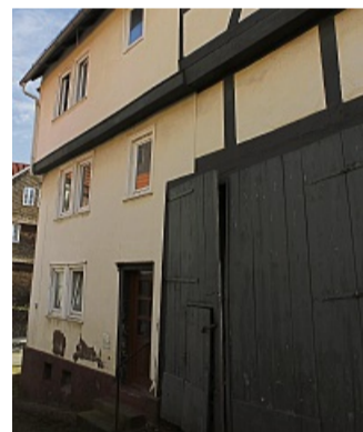
Der Hauseingang mit dem Scheunentor. SCHULD

„Warum 10 000 Euro Obergrenze für ein Gebot? Warum nicht 5000 oder 3000?“ kritisierte CDU-Fraktionsvorsitzenden Marc Vaupel: „Wir sollten keine Begehrlichkeiten wecken durch den Beschluss.“ Ihn überzeugte auch der Folgeplan des Magistrats für den Fall ei-