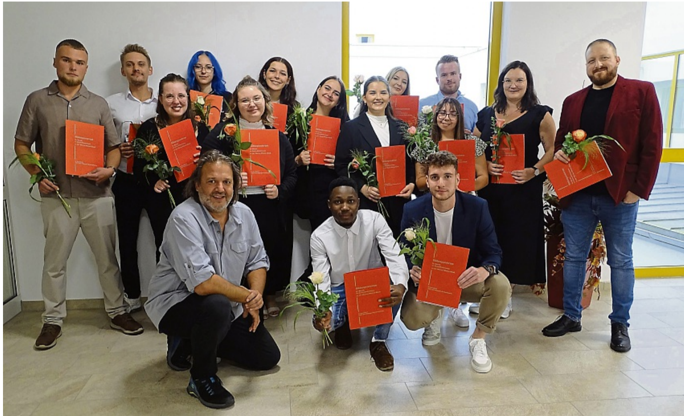
Examen bestanden: Die Absolventen der dreijährigen Ausbildung zur Pflegefachkraft nahmen im Wicker-Bildungszentrum ihre Abschlusszeugnisse entgegen.