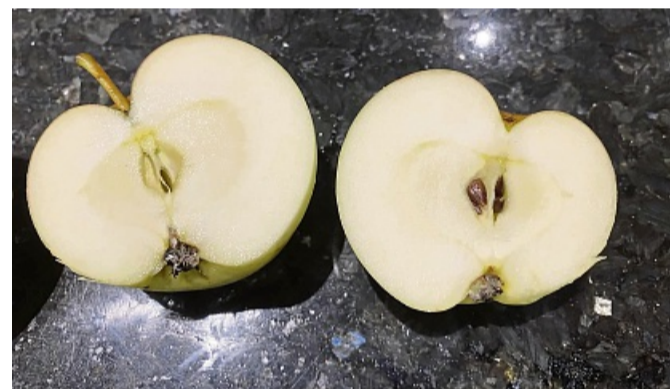
Die Früchte sind klein bis mittelgroß, flachrund, unregelmäßig geformt, mittelbauchig. Der Stiel ist kurz, das Kernhaus mittig, die Kerne groß.