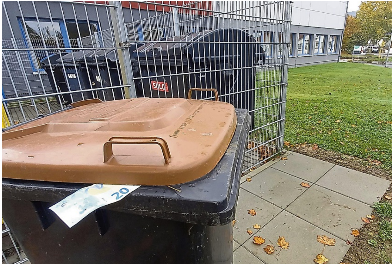
Der Appetit der Tonnen: Die Abfallgebühren in Bad Wildungen müssen zum 1. Januar steigen, um den Müll-Haushalt auszugleichen.