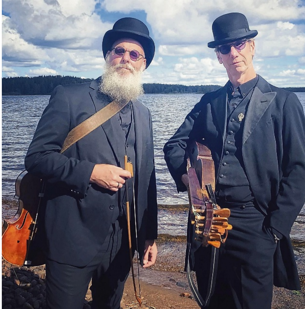
Ein „Aushängeschild“ skandinavischer Folkmusik soll das Duo „Väsen“ sein.

Väsen sind das Aushängeschild der skandinavischen Folkmusik und haben bereits Konzertbesucher von Washington bis Tokio begeistert.