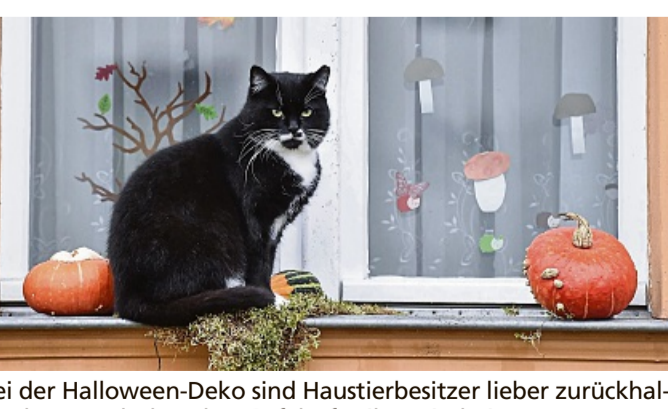
Bei der Halloween-Deko sind Haustierbesitzer lieber zurückhaltend - sonst droht echte Gefahr für ihre Vierbeiner.