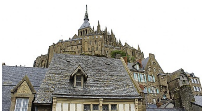
Hoch hinaus: Das 25 Einwohner starke Dorf am Mount-Saint-Michel mit Kathedrale auf dem Berg beeindruckte die Besucher.

zudem neben zahlreichen Ausflügen auch das gemeinsame Essen gehörte. Tagsüber seien die sieben Besucher keine Stunde allein unterwegs gewesen, so Stein, der begeistert von der Gastfreundschaft berichtet. Untergebracht hatten sie sich in einem Hotel nahe Vimoutiers.