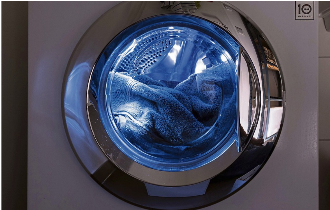
Die Stiftung Warentest hat Frontlader und Toplader in einer umfassenden Untersuchung getestet, um die besten Waschmaschinen in Bezug auf Waschleistung, Handhabung und Umweltfreundlichkeit zu ermitteln.

Frontlader oder Toplader? Wer eine Waschmaschine anschafft, muss sich entscheiden. Erstere werden, der Name verrät es, von der Vorderseite befüllt. Letztere belädt man von oben mit Wäsche. Sie sind in der Regel etwas schmaler, haben weniger Fassungsvermögen und passen gut in kleinere Bäder. Doch wie schneiden die jeweiligen Geräte in puncto Waschleistung, Handhabung und Umwelteigenschaften ab? Das hat sich die Stiftung Warentest („test“, Ausgabe 11/2024) bei neun Frontladern (zu Preisen zwischen 535 und 1.300 Euro) und vier Topladern (350 bis 765 Euro) genauer angesehen – und die Maschinen außerdem einer Dauerprüfung unterzogen. Insgesamt 218 Tonnen Textilien wurden dafür insgesamt durch die Maschinen gejagt – und 610 Kilo Waschmittel verbraucht. Das Ergebnis: Zwei Toplader sind „gut“, einer ist „befriedigend“, einer „ausreichend“. Bei den Frontladern sind nahezu alle getesteten Modelle „gut“, nämlich acht. Nur eines der neun Modellen schneidet „ausreichend“ ab. Der Grund: Ein versammeltes Dauertest, bei dem alle drei Exemplare des Modells in dieser Prüfdisziplin nur zwischen 330 und 700 der geforderten 1.200