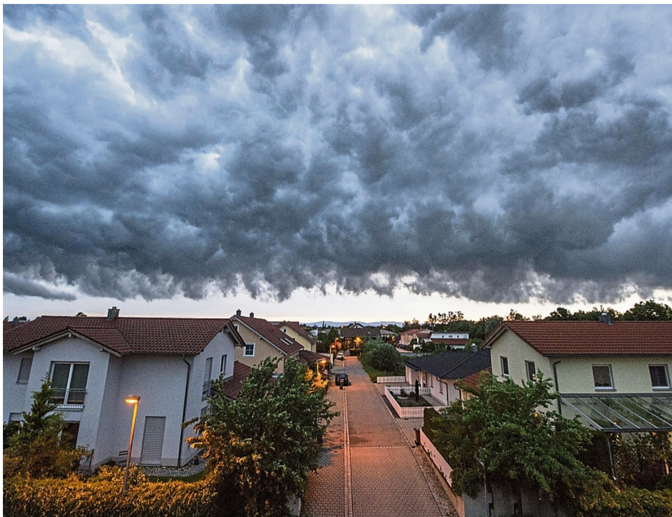
Fenster zu, Blumenkübel rein: Droht ein Sturm, sollten Sie sich und lose Gegenstände in Sicherheit bringen.

Was kann man also tun, sobald ein Sturm angekündigt ist? Zunächst ist es wichtig, alle Türen und Fenster zu schlie-