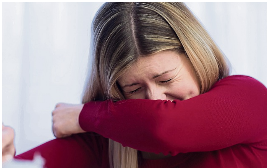
Schutz für andere: Richtiges Niesen in den Ellenbogen und regelmäßiges Lüften verringern die Ausbreitung von Krankheitserregern.

Gründliches Händewaschen braucht seine Zeit: 20 bis 30 Sekunden sollten es „infektions-