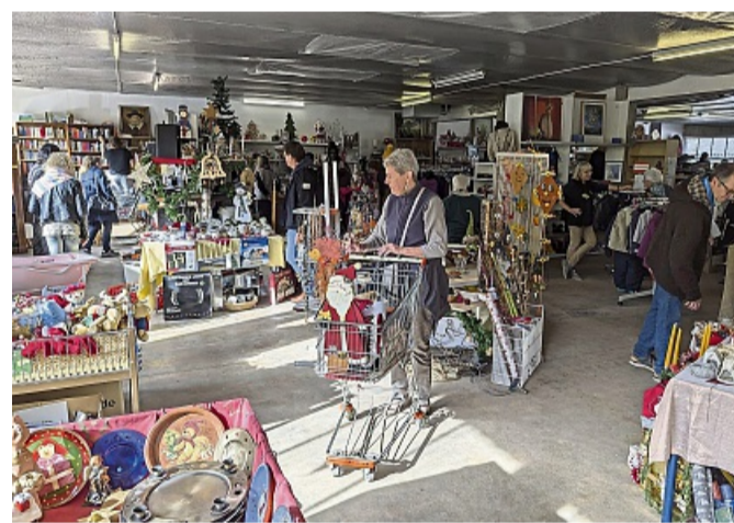
Der Hospizflohmarkt Eschwege ist an einem neuen Standort wiedereröffnet worden.