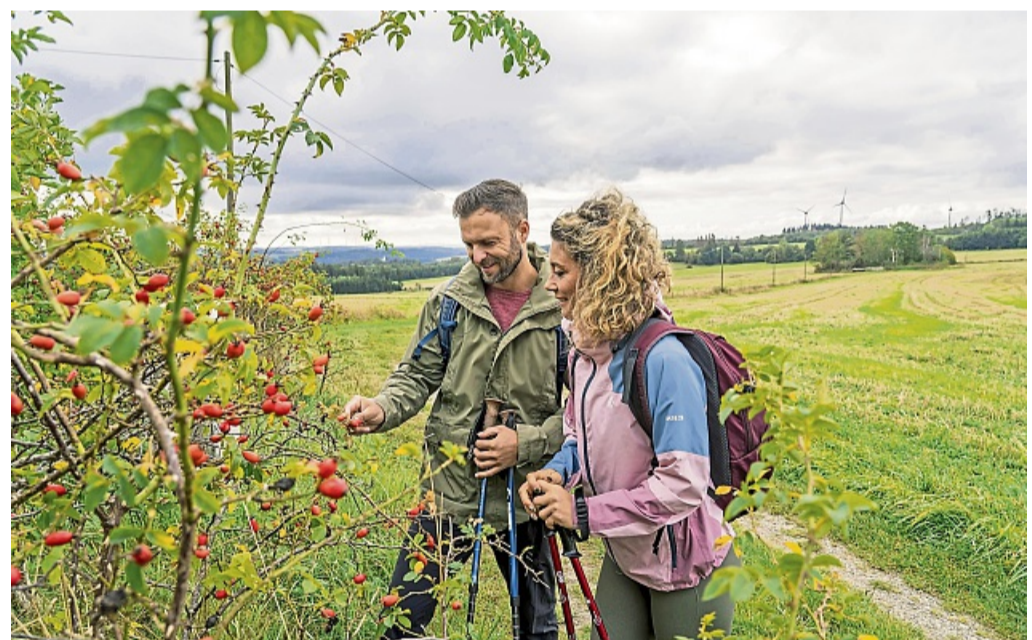
Auf dem aussichtsreichen Kammweg Erzgebirge-Vogtland reifen die Früchte des Herbstes.