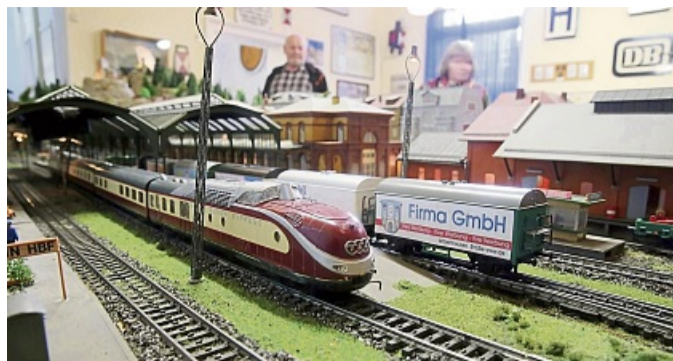
Die Modellbahn-Schau findet an den kommenden beiden Wochenenden statt.

Oder vereinbaren Sie gerne online auf unserer Seite www.sontra.de einen Termin!