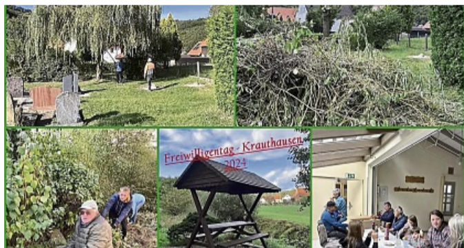
Freiwilligentag in Krauthausen: Viele Hände packten an.