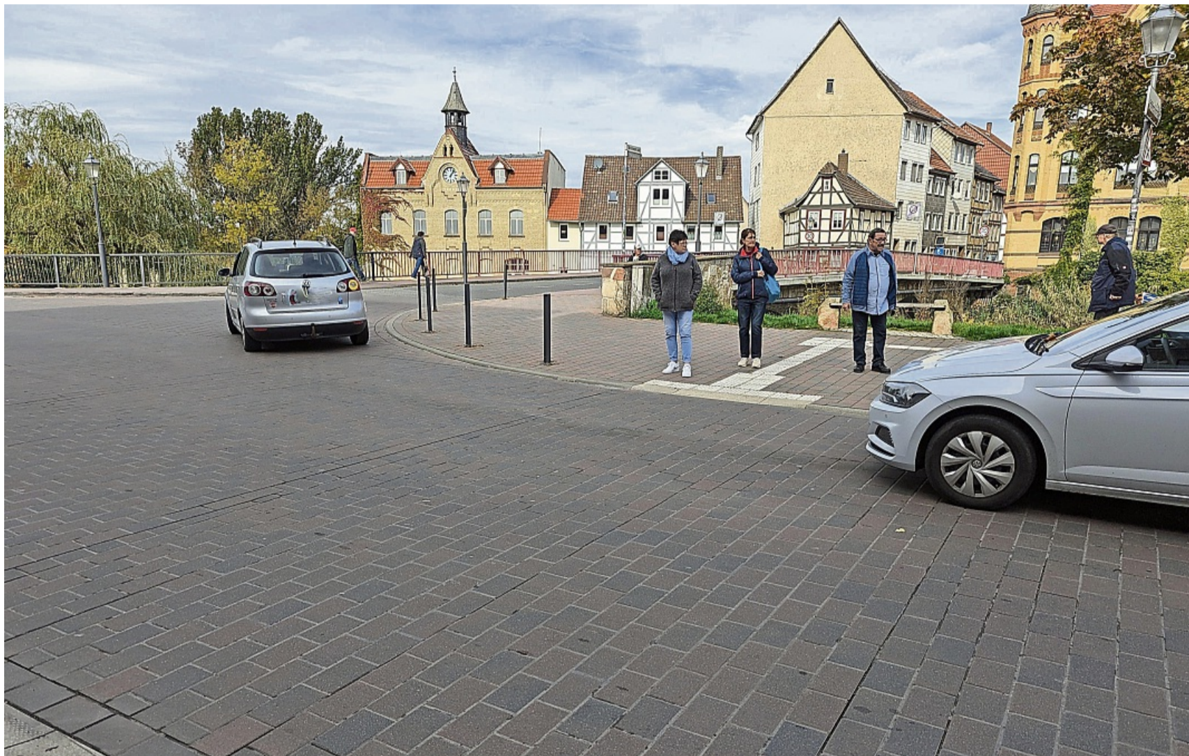
Wartende Fußgänger sind öfter an der Straße Unter dem Berge zu beobachten. Trotz Gleichberechtigung im Verkehr müssen sie warten, bis ein Auto anhält.