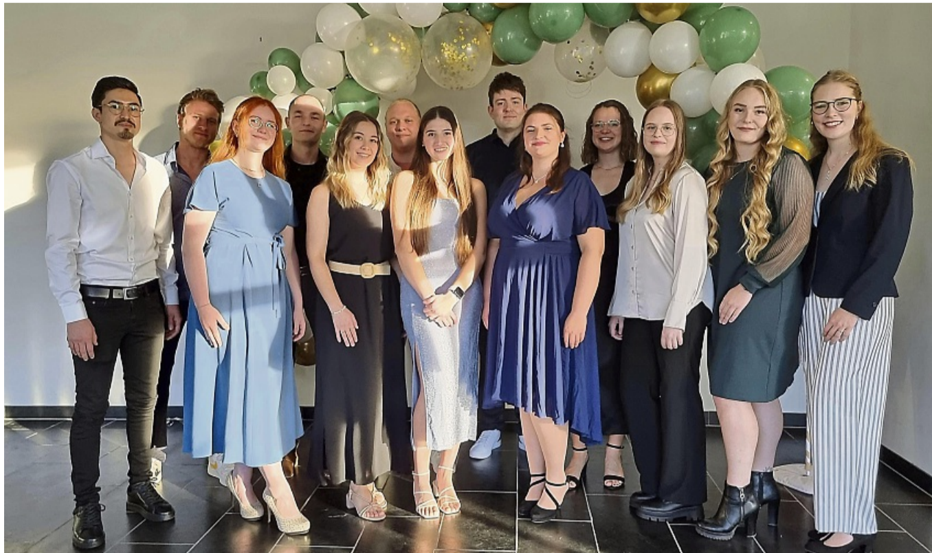
Die stolzen Absolventinnen und Absolventen: 14 Schülerinnen und Schüler der Physiotherapieschule der Orthopädischen Klinik Hessisch Lichtenau bestanden das Examen.

Die Vorbereitungen auf die Prüfungen begannen für einige Schüler bereits ein Jahr im Voraus. Zusätzlich fand ein Zwischenexamen statt, das die Schüler auf die finalen Prüfungen vorbereitete. Kurz vor den Prüfungen gab es ein Repetitorium, in dem prüfungsrelevante Themen wiederholt und offene Fragen geklärt wurden. Die schriftlichen Prüfungen umfassten vier umfangreiche Klausuren, während die praktischen Prüfungen direkt am Pa-