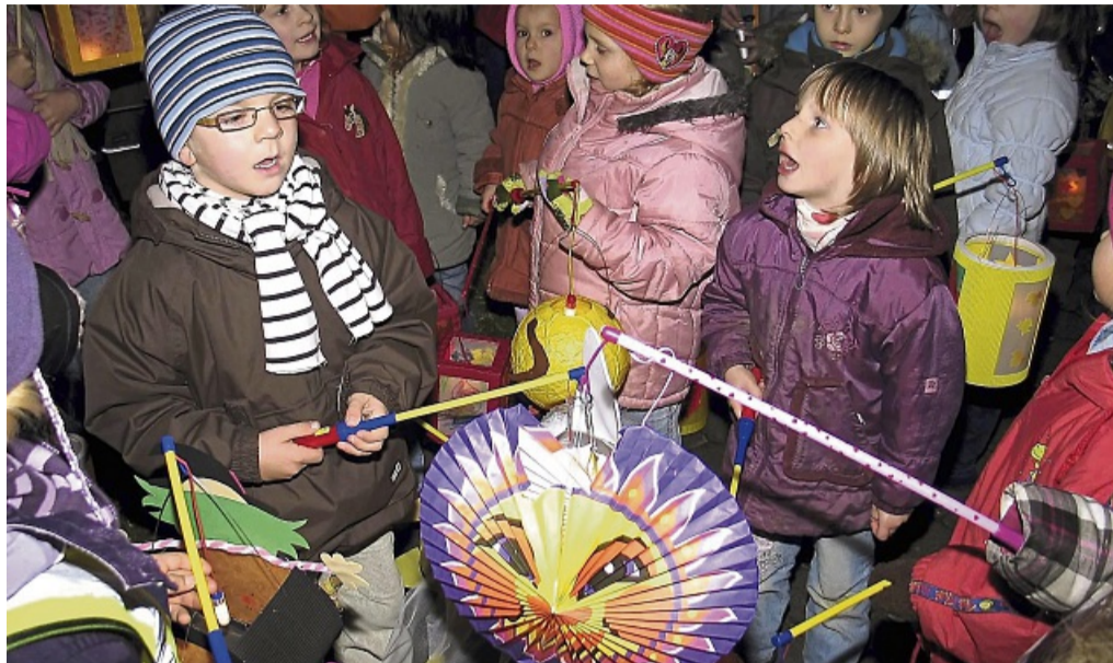
Laternenumzug: Am Martinstag werden sich alle Sontraer Kindergärten zu einem Umzug treffen.

Am Montag, 11. November, finden die traditionellen Martinsumzüge, der Kindergärten in Sontra statt. So werden die u.g. Straßen temporär für die Umzüge gesperrt. Der Verkehr wird von der Freiwilligen Feuerwehrgeregelt. Den Anweisungen der Feuerwehr ist Folge zu leisten. Die Umzüge der Kindergärten finden von 17.30 bis 18.30 Uhr statt. Um besondere Vorsicht und Rücksicht in den genannten Bereichen wird gebeten.