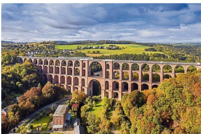
Die berühmte Göltzschtalbrücke ist von Greiz aus gut mit dem Fahrrad zu erreichen.

Bunte Laubwälder und weite Fernsichten können Aktivurlauber zum Beispiel auf dem Kammweg Erzgebirge-Vogtland erleben: Der Fernwanderweg zählt zu den „Top Trails of Germany“, beginnt südlich von Dresden im Ostergebirge und endet in Blankenstein in Thüringen. Unter dem Motto „Dachs statt Dax“ lädt er dazu ein, zwischen Felsformationen, Bergwiesen, Wäldern und Bachtälern vom Alltag abzuschalten. Für Tagesausflüge in die herbstliche Landschaft bietet Greiz viele Möglichkeiten, etwa eine Radtour zur berühmten Göltzschtalbrücke oder einen Rundwanderweg zu drei Schlössern.