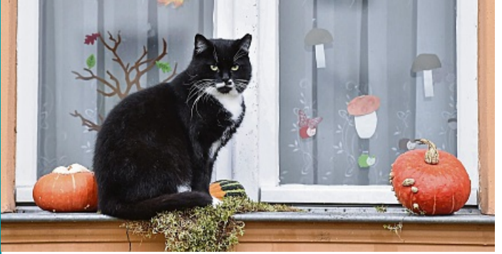
Bei der Halloween-Deko sind Haustierbesitzer lieber zurückhaltend - sonst droht echte Gefahr für ihre Vierbeiner.