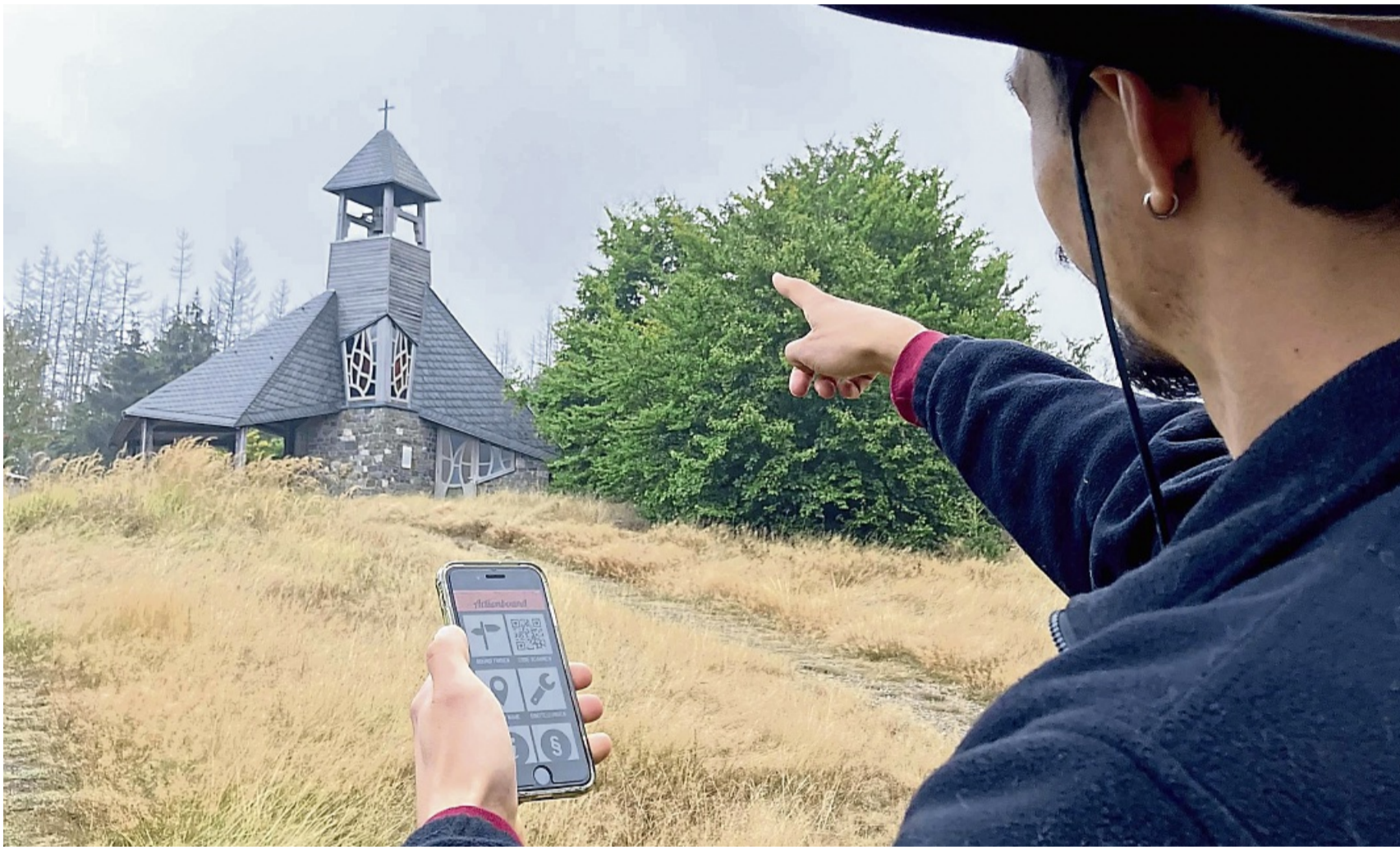
Schatzsuche an der Quernst: Der Quernst-Bound ist eine der drei digitalen GPS-Touren durch den Nationalpark Kellerwald-Edersee.

Für die Touren sollten jeweils circa 2 bis 2,5 Stunden eingeplant werden. Weitere Informationen zur Teilnahme und zur App gibt es auf der Internetseite des Nationalparks unter folgendem Link: https://nationalpark-kellerwaldersee.de/erleben/actionbound .