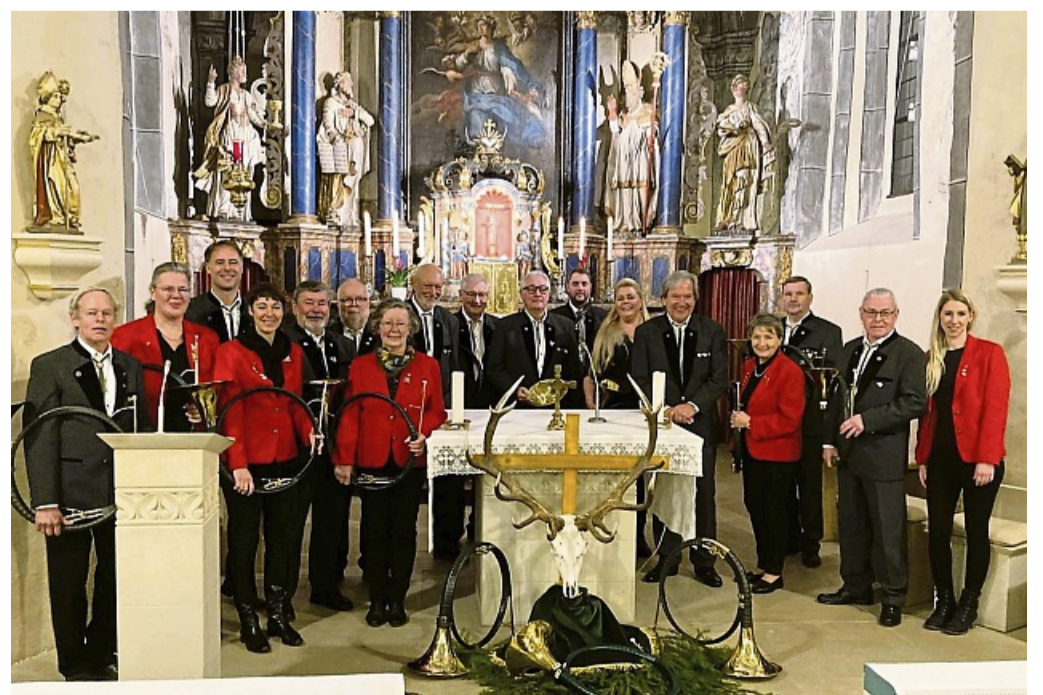
Jagdhornbläsergruppe der Jägervereinigung Frankenberg.