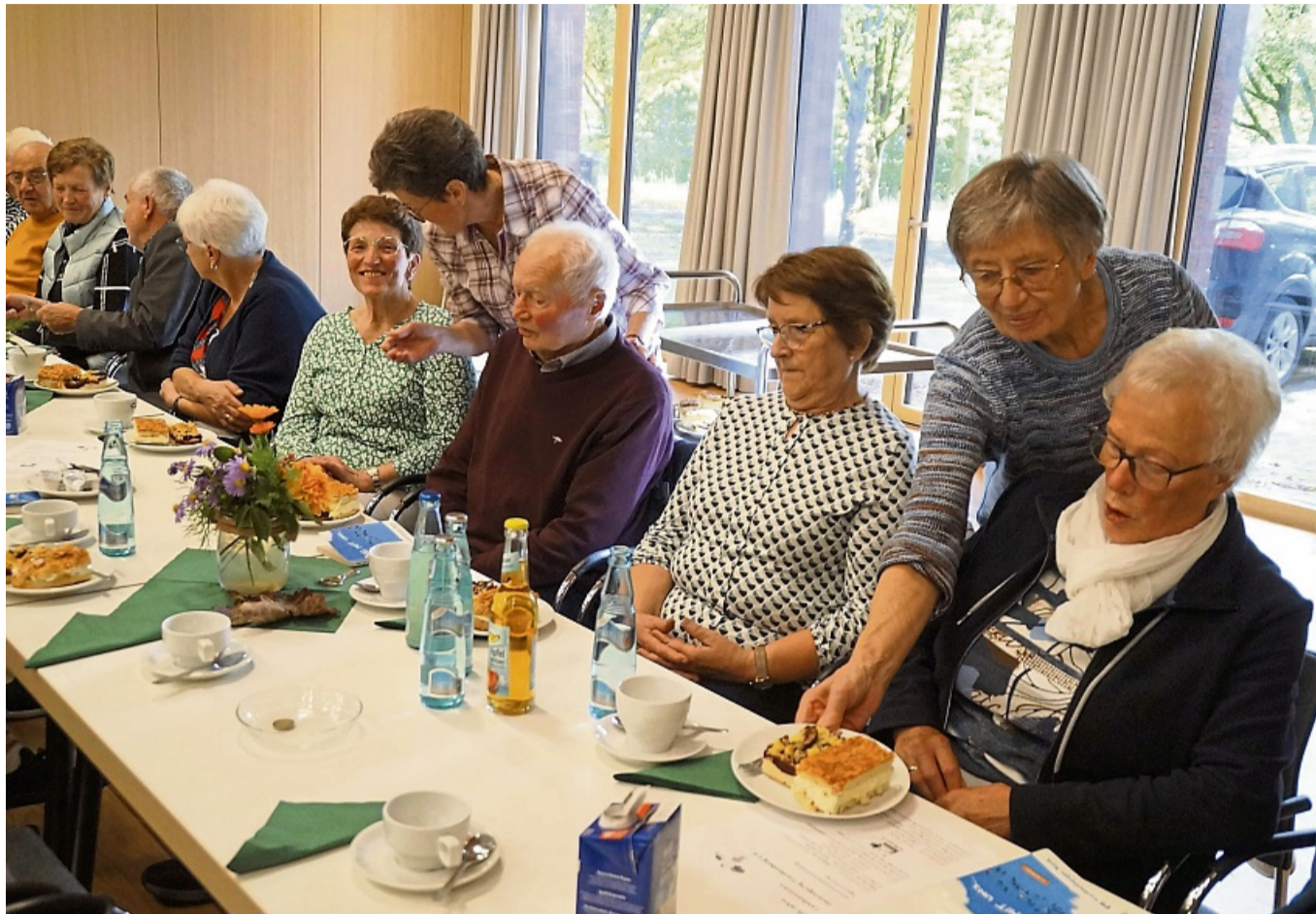
Die Landfrauen des Ortsvereins Frankenberg und Friedrichshausen bewirteten die Landsenioren im Philipp-Soldan-Forum.