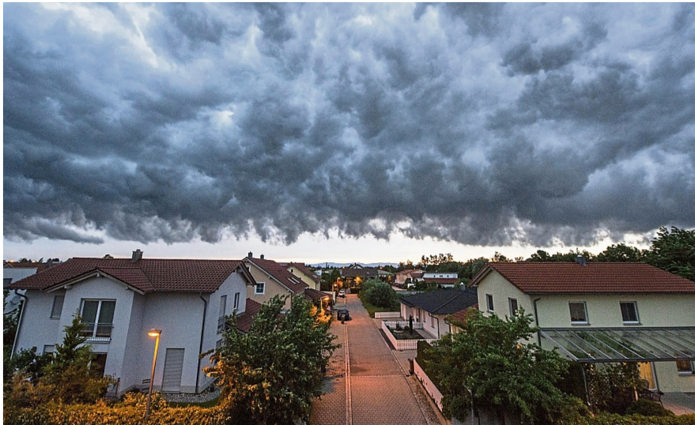
Fenster zu, Blumenkübel rein: Droht ein Sturm, sollten Sie sich und lose Gegenstände in Sicherheit bringen.

Was kann man also tun, sobald ein Sturm angekündigt