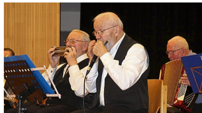
Das DRK-Orchester unter Leitung von Werner Schielke und Heinrich Cronau (nicht im Bild) sorgten für musikalische Unterhaltung.