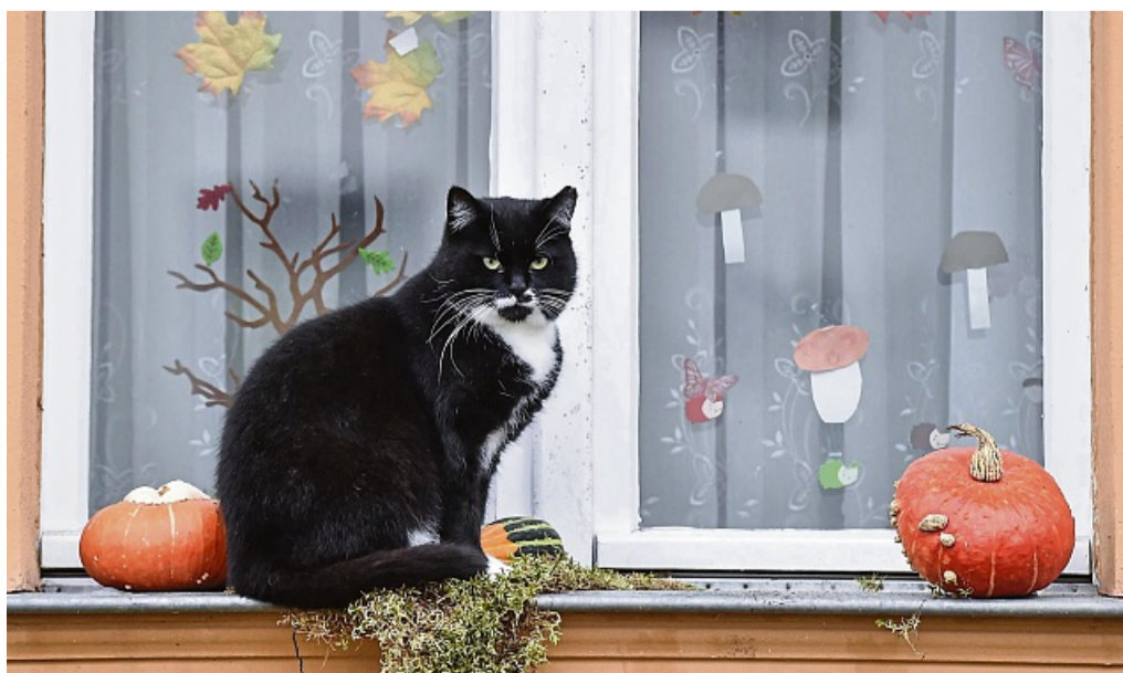
Bei der Halloween-Deko sind Haustierbesitzer lieber zurückhaltend - sonst droht echte Gefahr für ihre Vierbeiner.