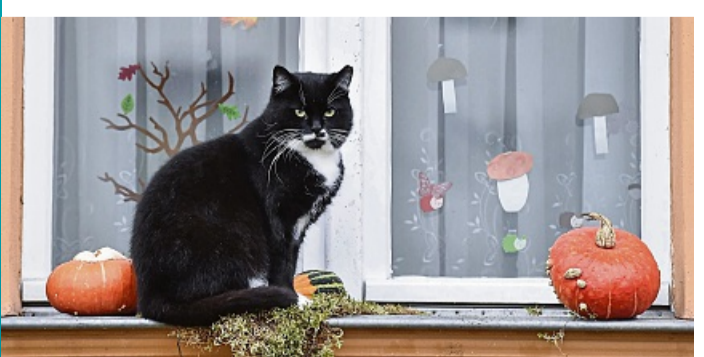
Bei der Halloween-Deko sind Haustierbesitzer lieber zurückhaltend - sonst droht echte Gefahr für ihre Vierbeiner.