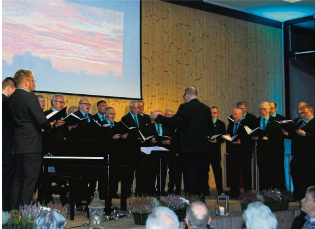
Die Gastgeber: Der Männergesangverein „Liedertafel 1878“ Goddelsheim hatte befreundete Chöre am Samstagabend zu einem bunten Liederabend eingeladen und zog eine positive Bilanz.

Männergesangverein Goddelsheim hat bunten Liederabend veranstaltet