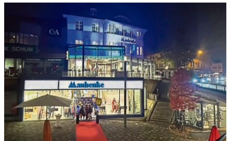
Mit der „Manhenke Night“, einem Shopping-Event für Stammkunden, hat der Jubiläumsverkauf begonnen.

individuellen Schnäppchen machen. Im Modehaus Manhenke und dem Street One Store gibt es stündlich wechselnde, interessante Sternstundenangebote zahlreicher Modemarken. Über die Manhenke Sternstundenangebote kann man sich auf der Website manhenke.de informieren. Natürlich wird auch an diesen Tagen das 100-jährige Jubiläum gefeiert und die Kunden können sich auf den Jubiläumsrabatt von 20 % freuen. Ein weiteres Highlight sind an diesem Wochenende wieder die zahlreichen Foodtrucks direkt am Berndorfer Tor, die die Besucher mit zahlreichen Spezialitäten verwöhnen.