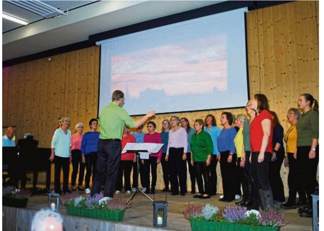
Hoffnung verbreiten: Der Goddelsheimer Frauenchor „TonArt“ trug unter anderem das Lied „Ist da jemand“ von Adel Tawil vor.