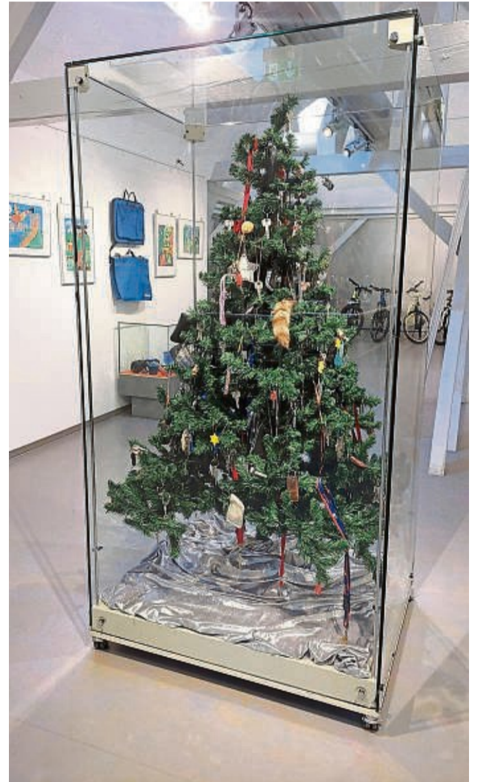
Erlesene Stücke können in Schaufenstern besichtigt werden.

ter Vorlage eines gültigen Ausweisdokumentes am Auktionstag von 9 bis 10.45 Uhr vor dem Quellensaal im Erdgeschoss der Wandelhalle ausgegeben. Nach der Auktion können die ersteigerten Fundstücke direkt mitgenommen werden. Es wird nur Barzahlung akzep-