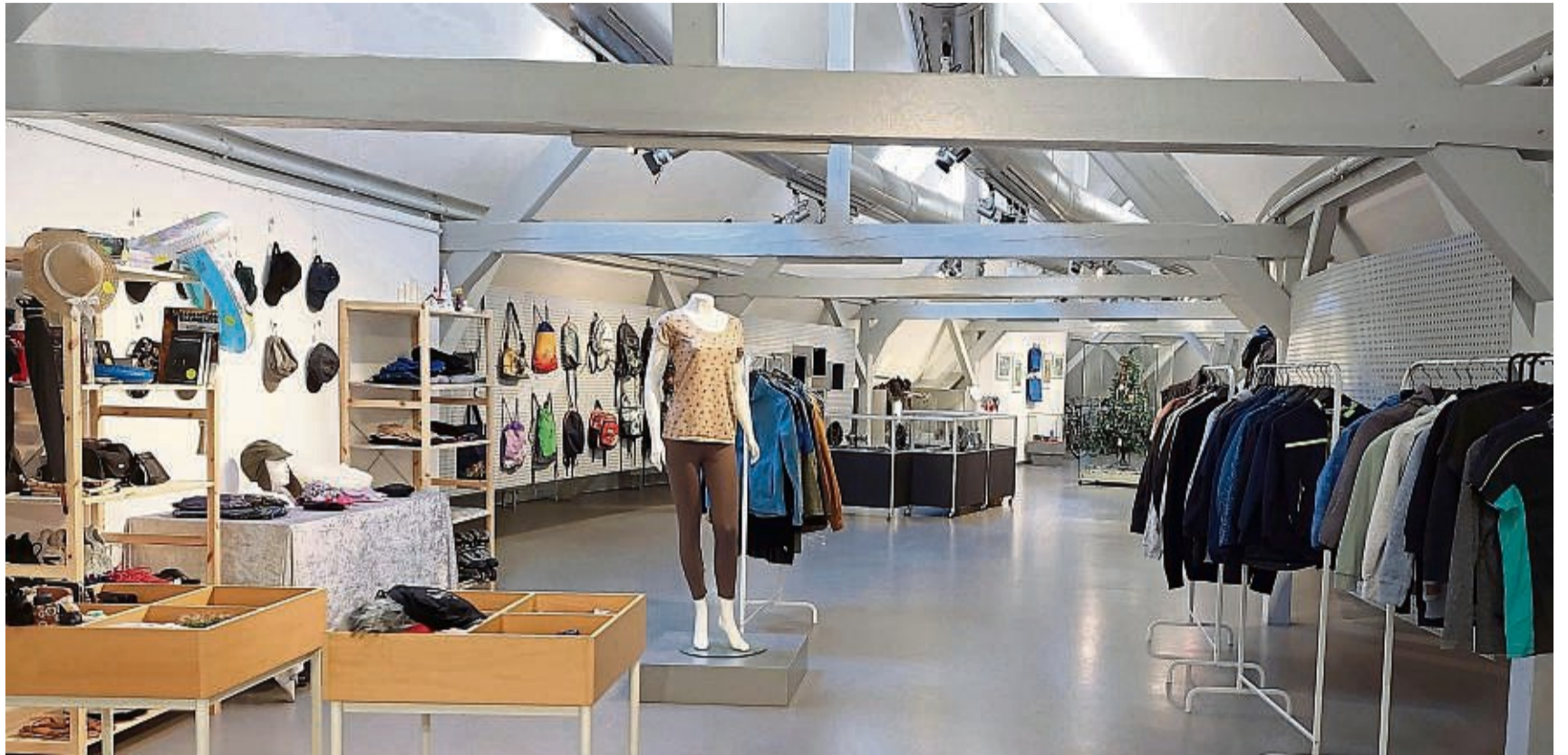
Wie in einem Shoppingcenter: Fundstücke, die sich in 14 Jahren in Bad Wildungen angesammelt haben, werden in einer Sonderausstellung präsentiert.

Vor 14 Jahren fand die letzte Versteigerung von Fundstücken statt. Im Laufe dieser Zeit