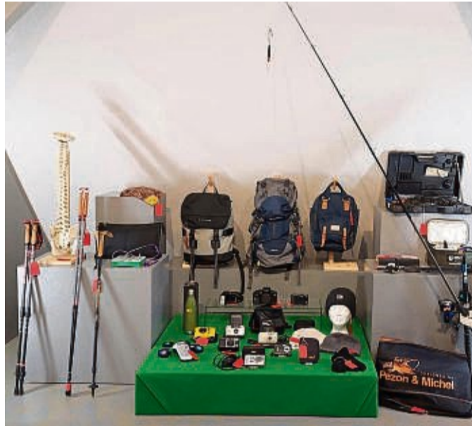
Gesäubert und funktionsbereit: Zahlreiche Objekte können zu günstigen Preisen sofort mitgenommen werden.