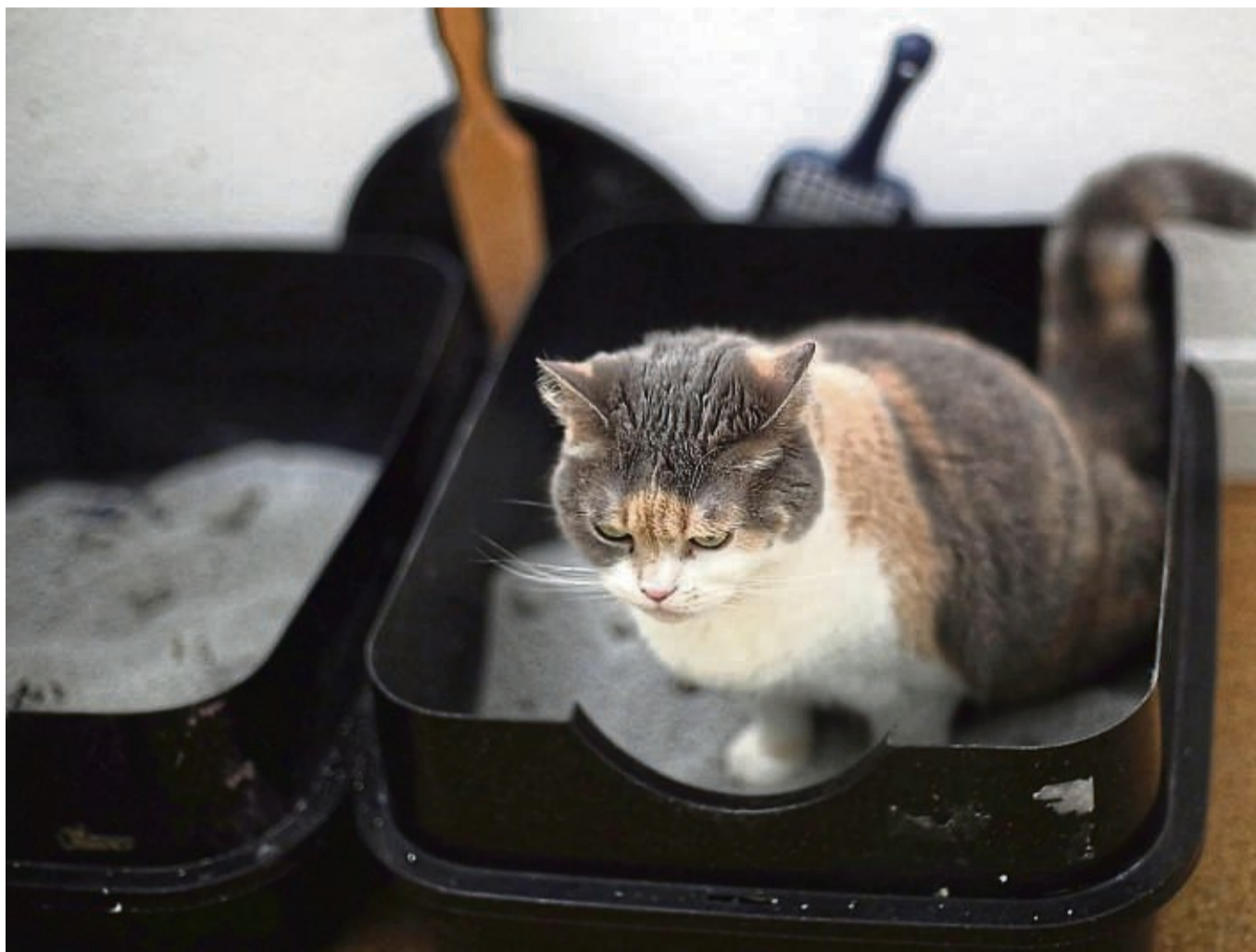
Mögen es sauber: Mindestens einmal am Tag sollte man das Klo reinigen, damit sich die Katze wohlfühlt.