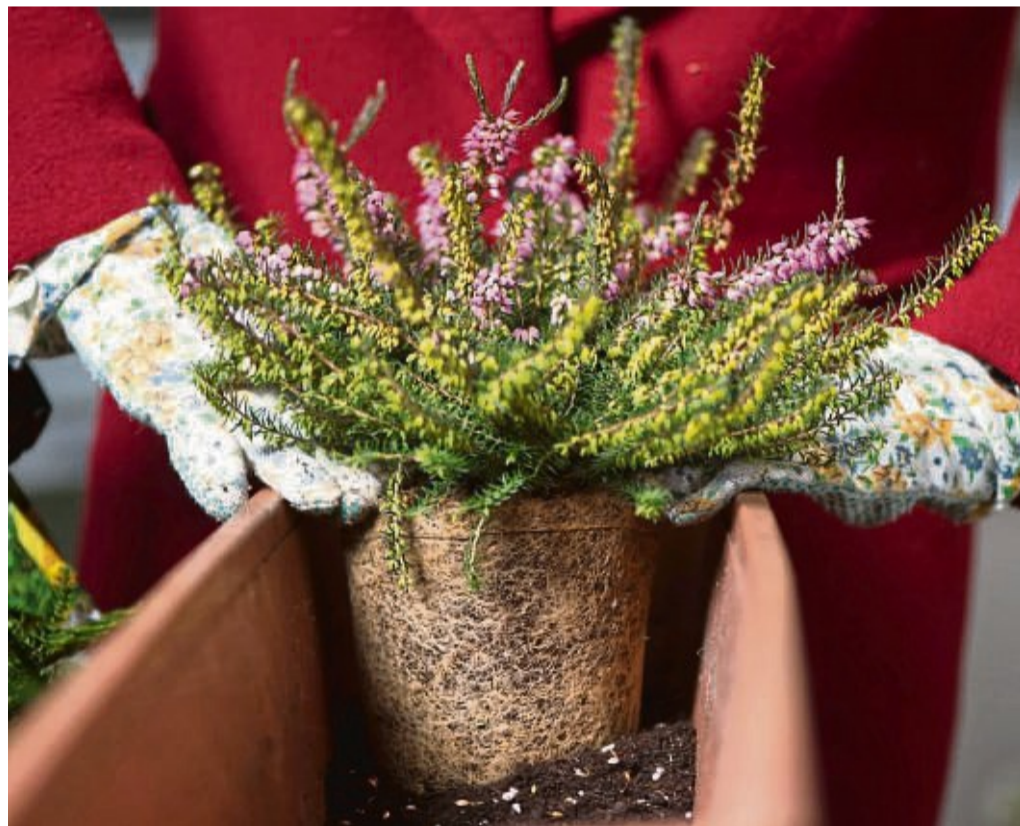
Winterharte Pflanzen wie Winterheide, Scheinbeere und Efeu halten Balkone auch in der kühlen Jahreszeit lebendig.