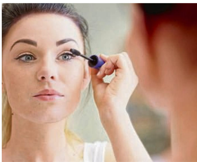
Schönes Make-up braucht auch das richtige Licht – am besten schattenlos und blendfrei.

Andere Spots und Strahler dürfen zwar ebenfalls auf den Spiegel gerichtet sein. Man sollte dann aber darauf achten, dass sie nicht blenden. Bei großen Spiegelflächen ist außerdem eine zusätzliche