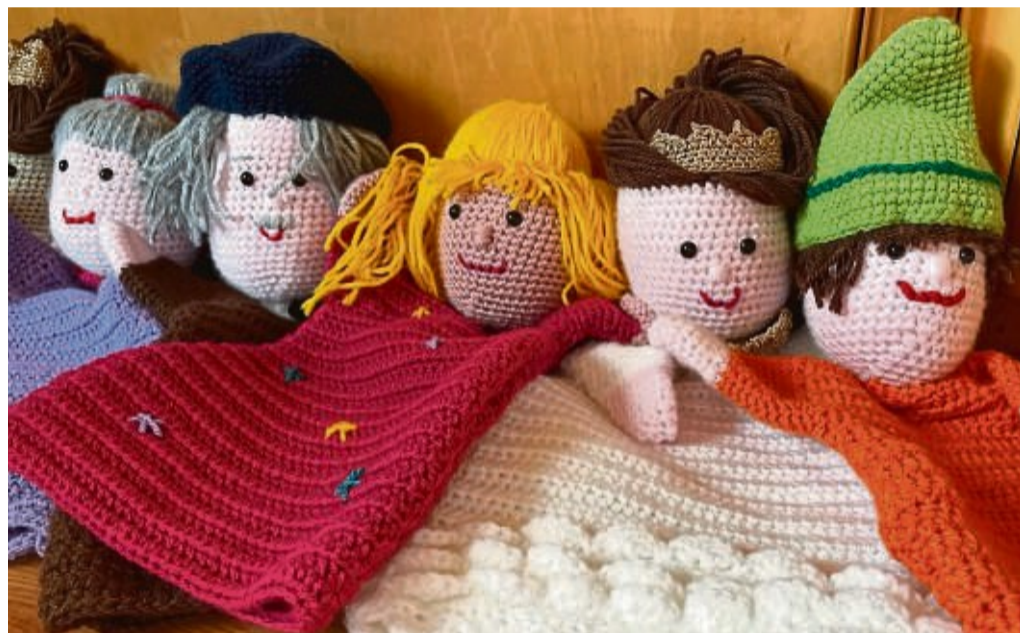
Wunderschön: Die selbstgestrickten Handpuppen von Ulrike Müller stehen beim Kunsthandwerkermarkt zum Verkauf.