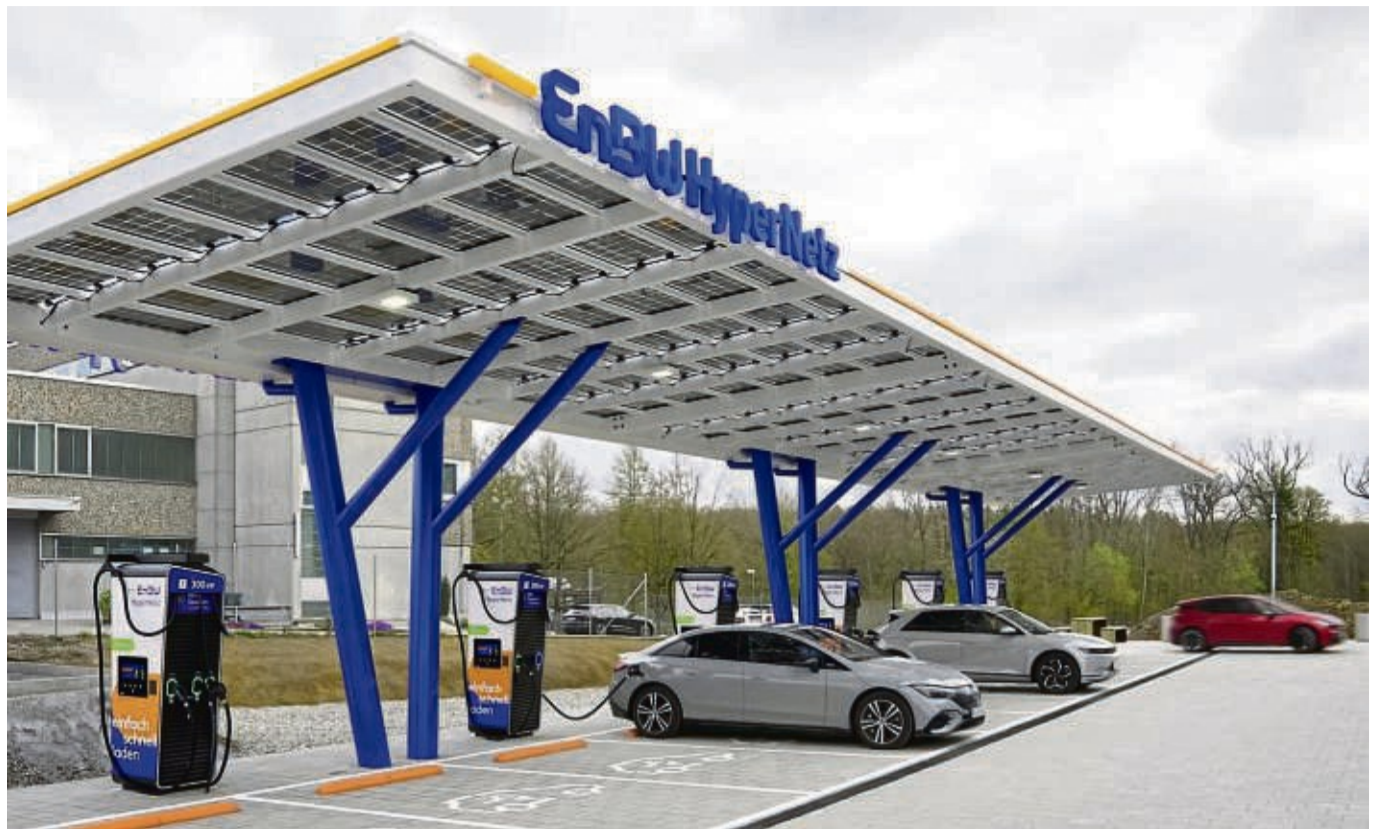
Bis zu 400 Kilowatt Ladeleistung: Der Energieversorger EnBW baut einen Schnellladepark für Elektroautos im Gewerbegebiet Wrexer Teich an der Autobahnauffahrt bei Rhoden.

16 Ladestationen mit bis zu 400 Kilowatt Ladeleistung in Rhoden geplant