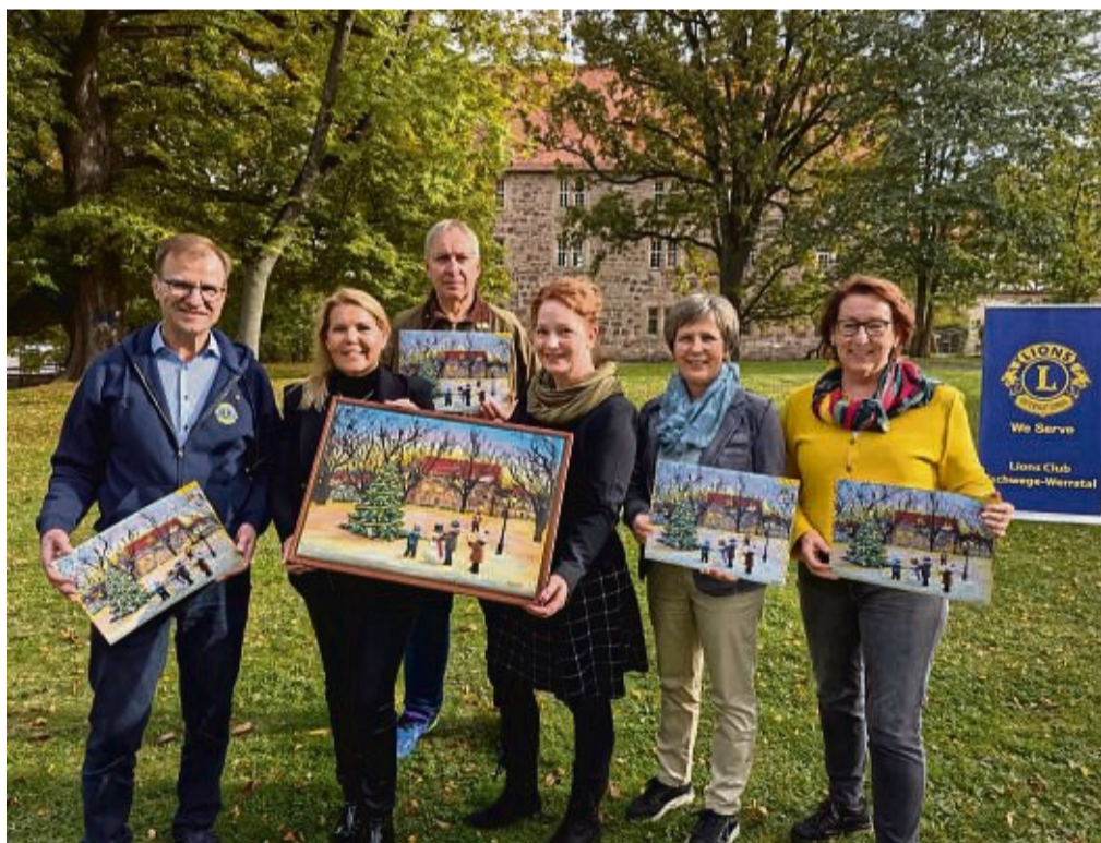
Der Lions Club Eschwege-Werratal stellt seinen neuen Adventskalender 2024 vor.