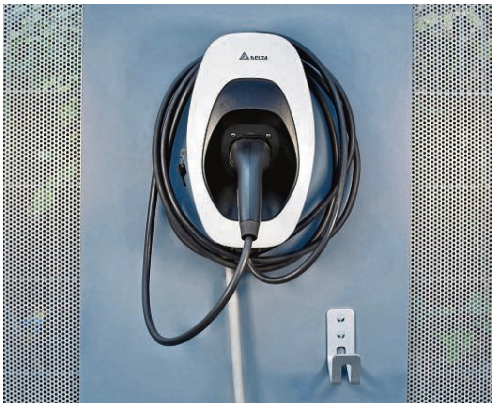
Der Testsieger ist die kompakte AC Max Basic von Delta für 199 Euro, die mit praktischen Features überzeugt.

Insgesamt schnitten alle untersuchten Wallboxen gut ab. Auffällig: Testsieger (Gesamtnote 1,7) ist die günstigste Wallbox im Test, nämlich