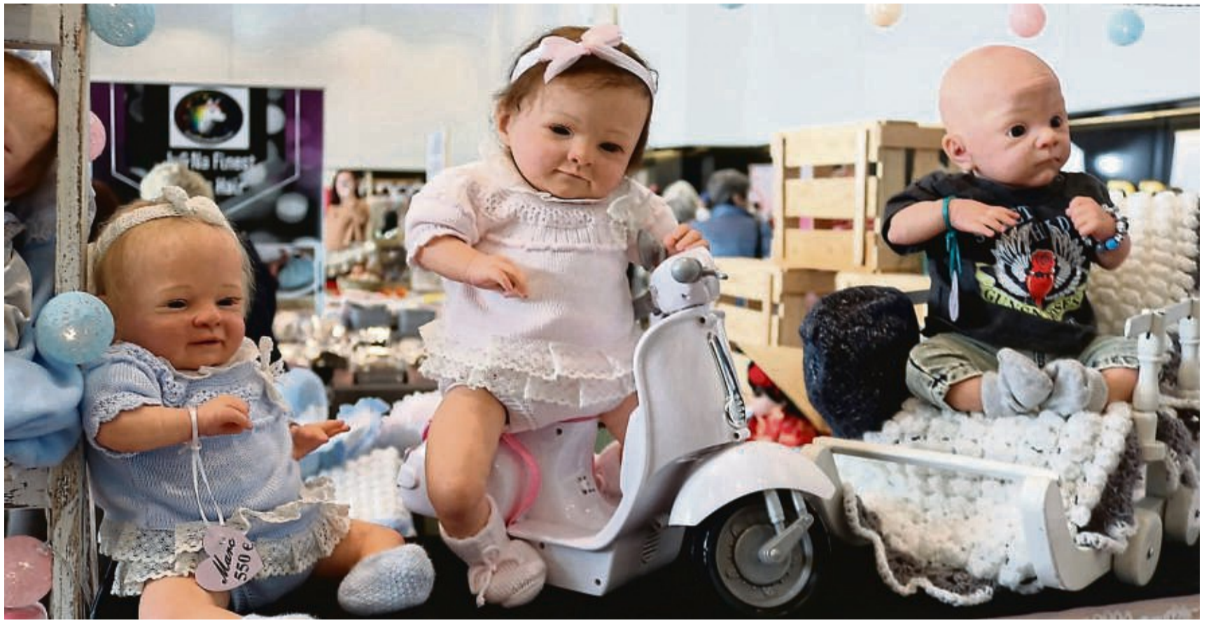
Das wird ein Puppenfest: Am 2. und 3. November trifft sich die Szene in Eschwege.

Flankierend zu den Puppenfesttagen findet am Sonn-