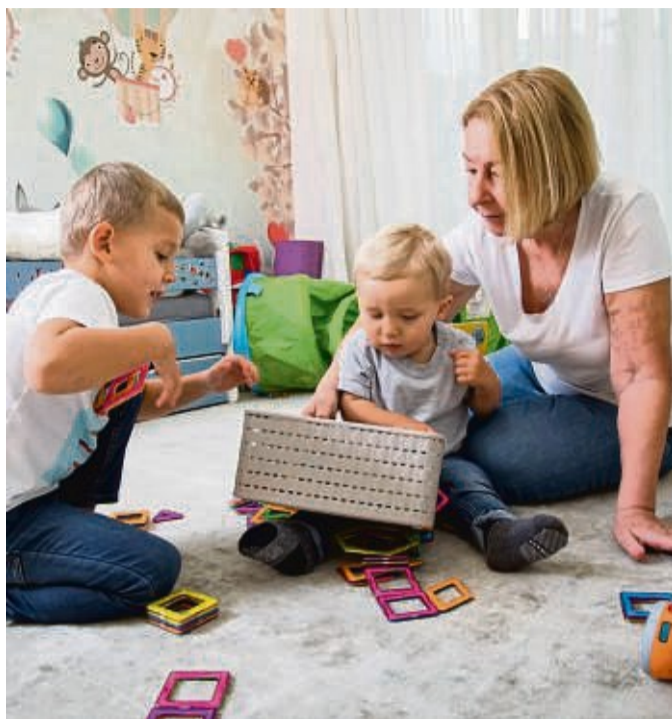
Kürzerer Altersabstand zwischen Geschwistern: Dafür sprechen nicht nur praktische und finanzielle Gründe, sondern auch ein gleicher Erziehungsansatz.

Die individuelle Entscheidung für einen kleinen oder großen Abstand hängt auch vom Umfeld ab, etwa der Wohnsituation, der Wohnungsgröße, der Arbeitssituation, der familiären Unterstützung vor Ort, dem familiären Freundes-Unterstützungs-Netz, der finanziellen Situation oder der gesundheitlichen Situation. Ein weiterer Punkt ist auch die eigene Kindheit, sprich die Vorlie-