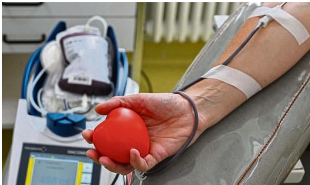
Blut spenden, Leben schenken und dabei Erlebnisse gewinnen.

Das Leben ist wertvoll. Blutspender*innen retten Leben und schenken Mitmenschen Hoffnung. Diese Leistung muss gefeiert werden! Unter allen Blutspender*innen verlost das DRK im Aktionszeitraum (30. September bis 29. November) zehnmal ein Erlebniswochenende für zwei Personen im Erlebnispark Tripsdrill oder im Technikmuseum Sinsheim/Speyer sowie 500x zwei Cineplex-Kinokarten. So geht's: Termin buchen, Blut spenden und danach online an der Verlosung teilnehmen: www.blutspende.de/aktion-leben-feiern