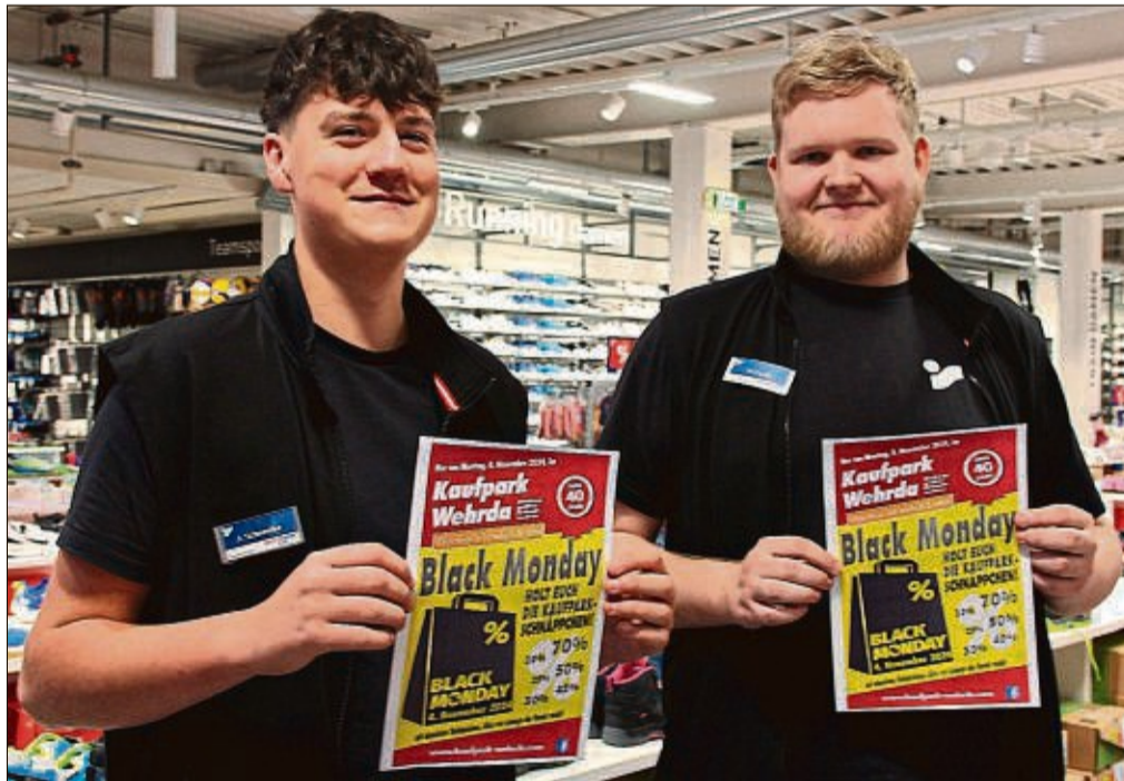
Die Einzelhändler in Marburgs größtem Einkaufszentrum haben sich zum Black Monday am 4. November wieder jede Menge Schnäppchen einfallen lassen.

Anders als beim Online-Shopping punkten die Fachgeschäfte vor Ort vor allem mit ihrer individuellen Betreuung und dem persönlichen Service – ob das die Beratung zu be-