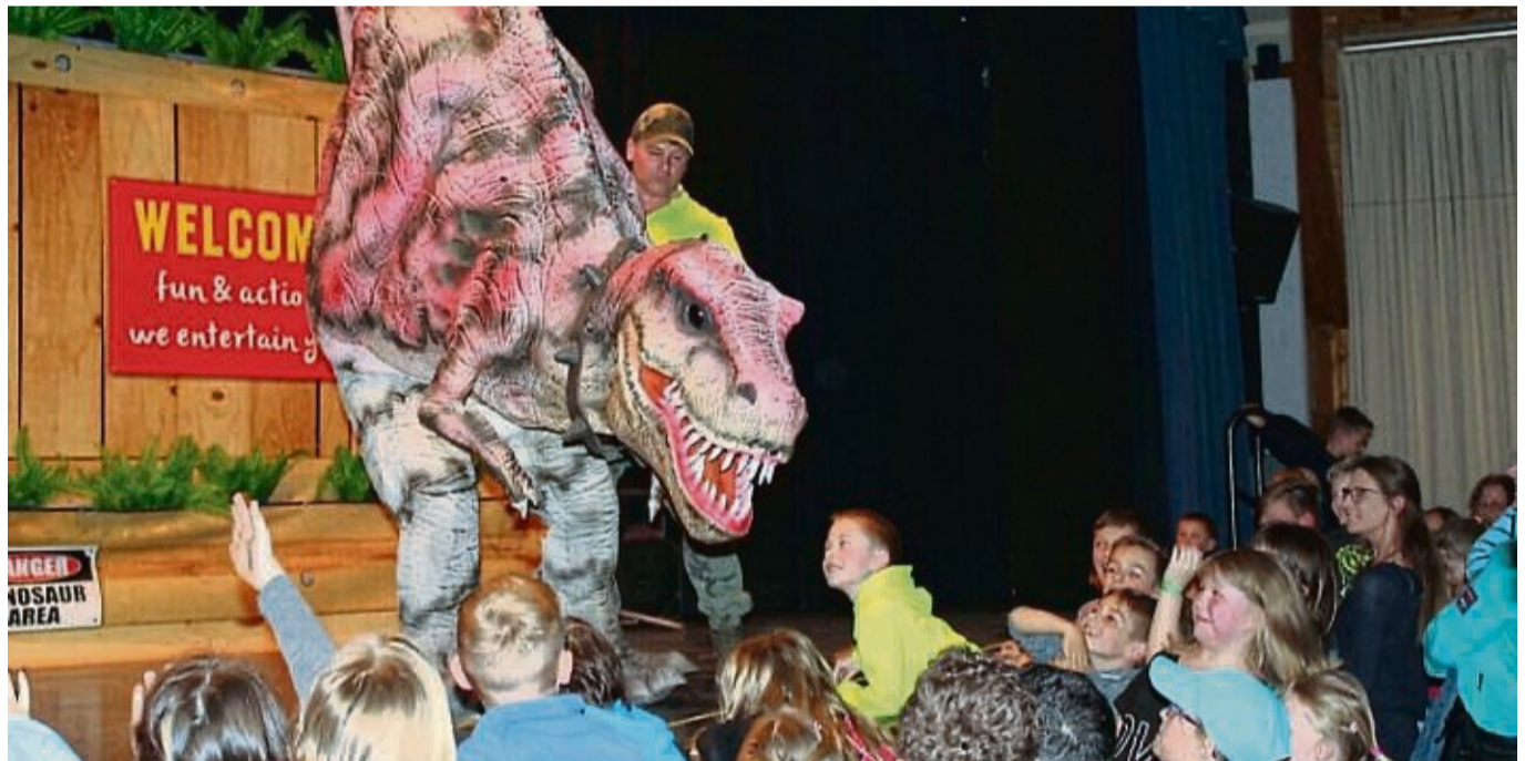
Die Dino-Live-Show kommt mit computergesteuerten Dinosauriern nach Frankenberg.