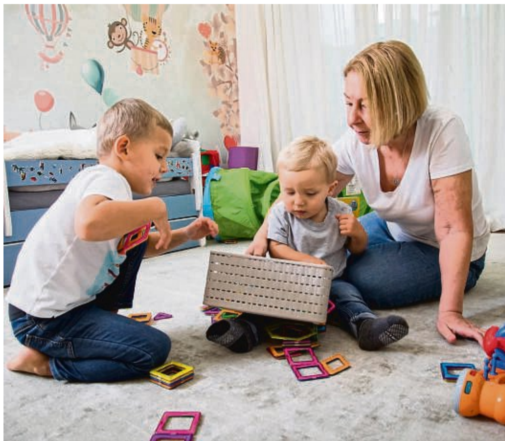
Für einen kürzeren Altersabstand zwischen den Geschwistern sprechen nicht nur praktische und finanzielle Gründe, sondern auch ein gleicher Erziehungsansatz.

Die individuelle Entscheidung für einen kleinen oder großen Abstand hängt auch