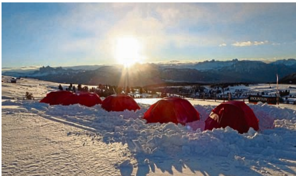
Eine Übernachtung im Biwak-Camp in den Dolomiten verspricht unvergessliche Eindrücke.