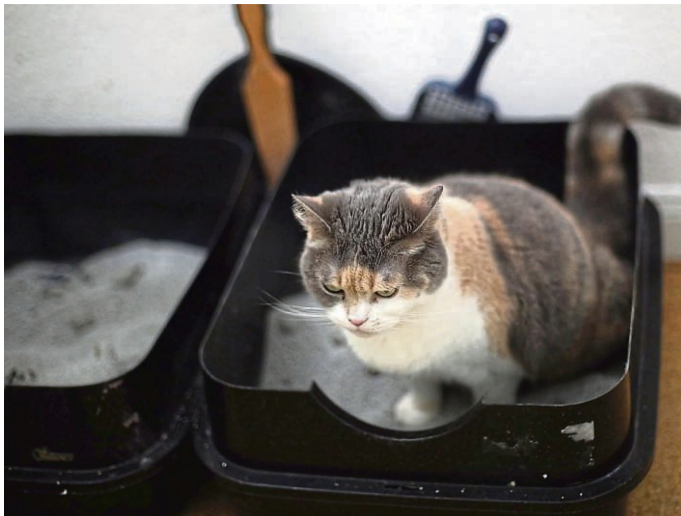
Mögen es sauber: Mindestens einmal am Tag sollte man das Klo reinigen, damit sich die Katze wohlfühlt.