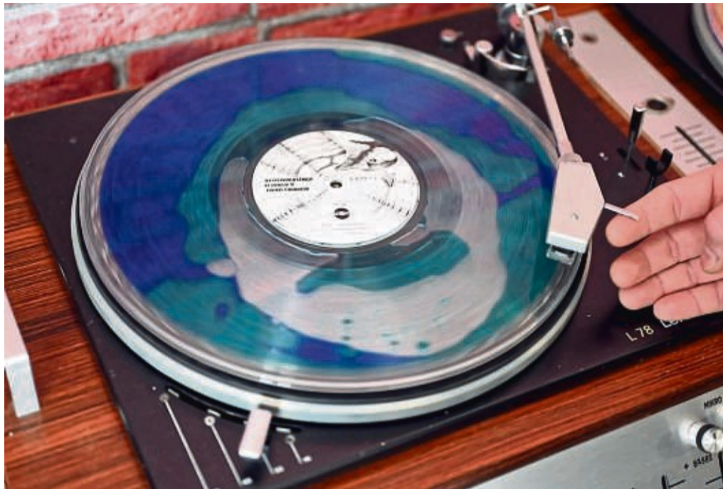
Längst nicht alles Schwarz: Vinyl gibt es in vielen Farben oder auch veredelt mit Sand oder sogar Flüssigkeit im Inneren einer transparenten Schallplatte.

Aber es kann noch weiter nach oben gehen: Dem Musiker-Onlinemagazin „Delamar.de“ zufolge wechselte im November 2015 die einzige