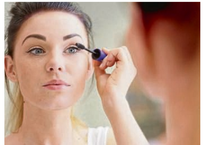
Schönes Make-up braucht auch das richtige Licht – am besten schattenlos und blendfrei.