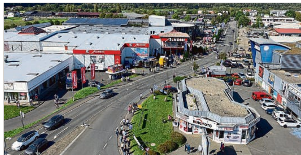
Der Kaufpark ist bei Kunden aus nah und fern äußerst beliebt. Hier finden sie alles an einem zentralen Ort.

Das Motto im Kaufpark Wehrda lautet: »Hier shop' ich einfach & alles!« Und davon können sich die Kundinnen und Kunden am Black Monday im 50.000 Quadratmeter großen Einkaufszentrum erneut überzeugen!