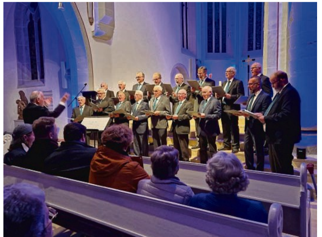
Männerstimmen erfüllten die Stadtkirche in Spangenberg: Unser Bild zeigt den Männergesangsverein Liedertafel 1842 Spangenberg.