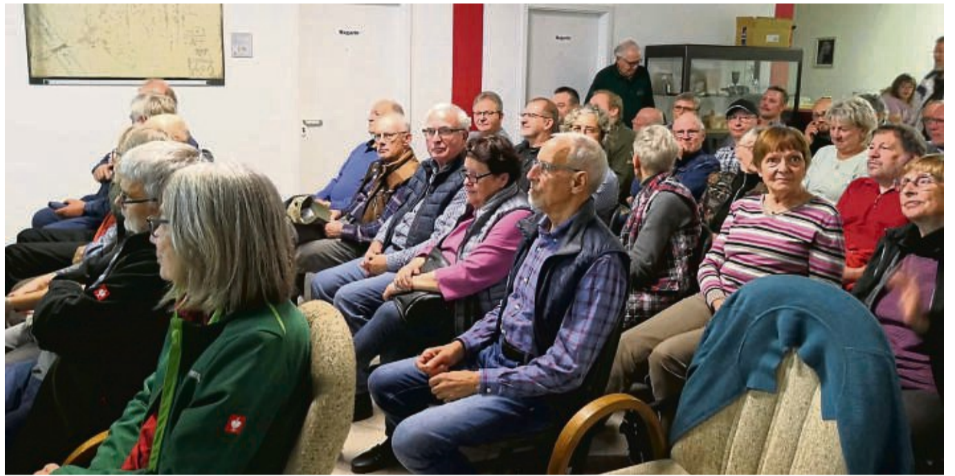
Die Besucher zeigten großes Interesse an der Geschichte der Braunkohlenzeche Heiligenberg.

Nicht verschwiegen wurden laut Mitteilung auch die dunklen Seiten der Zeche während der beiden Weltkriege. Für die Zeit des Ersten Weltkrieges hatte das Team vom Stadtarchiv ein Foto ausfindig gemacht mit Kriegsge-