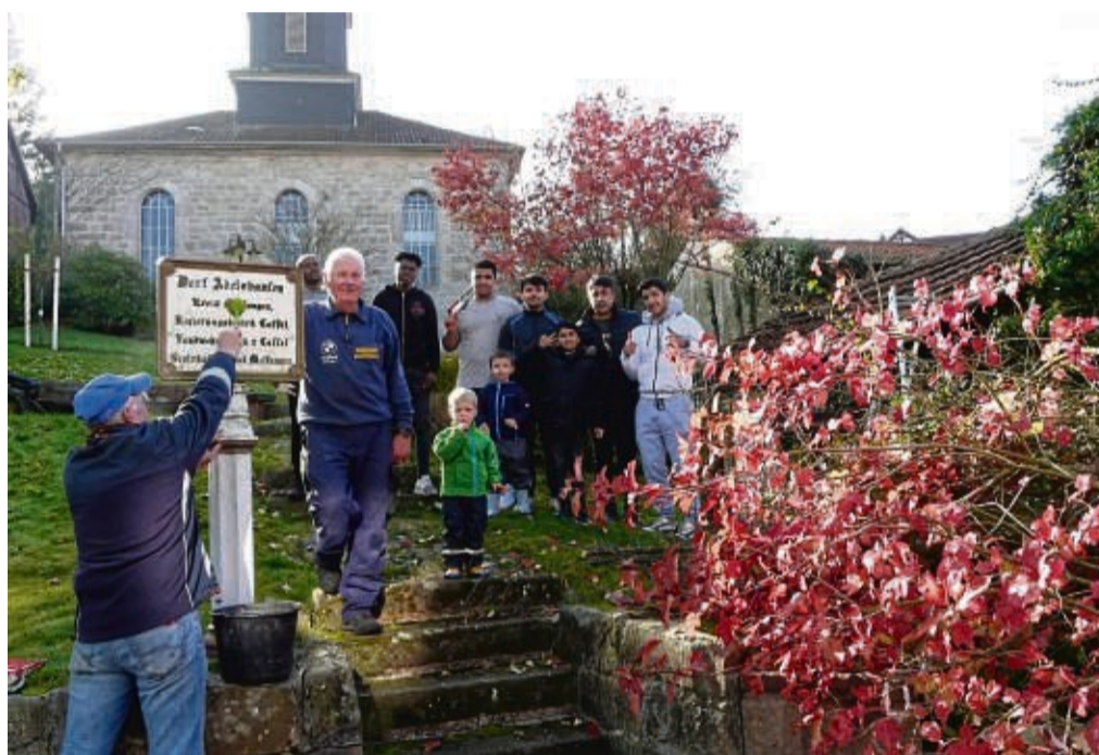
Vielen zu tun gab es in Adelshausen: Beim Tag der Landschaftspflege packten viele mit an.

Nach tatkräftigem Einsatz erfreuten sich alle fleißigen