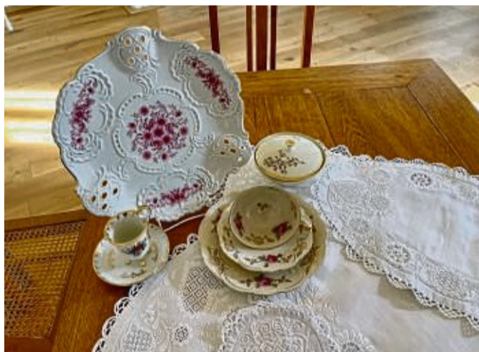
Objekte der Schwälmer Weißstickerei und Sammelstücken, die in der neuen Ausstellung zu sehen sind.