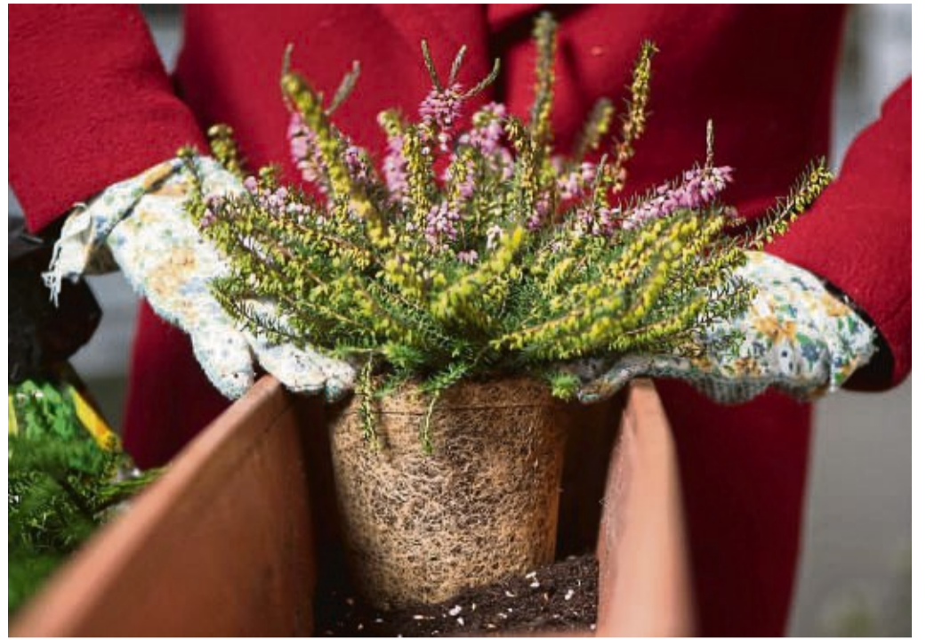
Winterharte Pflanzen wie Winterheide, Scheinbeere und Efeu halten Balkone auch in der kühlen Jahreszeit lebendig.

Gut zu wissen: Topfpflanzen benötigen mehr Wasser als Pflanzen im Freiland. Deshalb müssen sie auch im Winter regelmäßig gegossen werden.