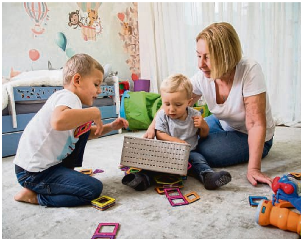
Für einen kürzeren Altersabstand zwischen den Geschwistern sprechen nicht nur praktische und finanzielle Gründe, sondern auch ein gleicher Erziehungsansatz.

Und noch etwas ist bei der Entscheidung wichtig: Man sollte nach jeder Geburt dem Körper Zeit zum Regenerieren lassen. Denn eine Geburt ist anstrengend und auch jede weitere Schwangerschaft, vor allem, wenn das erste Kind noch im Babyalter ist. Ich denke da an die Müdigkeit und Erschöpfung, die auch im Frühstadium der Schwangerschaft durch die