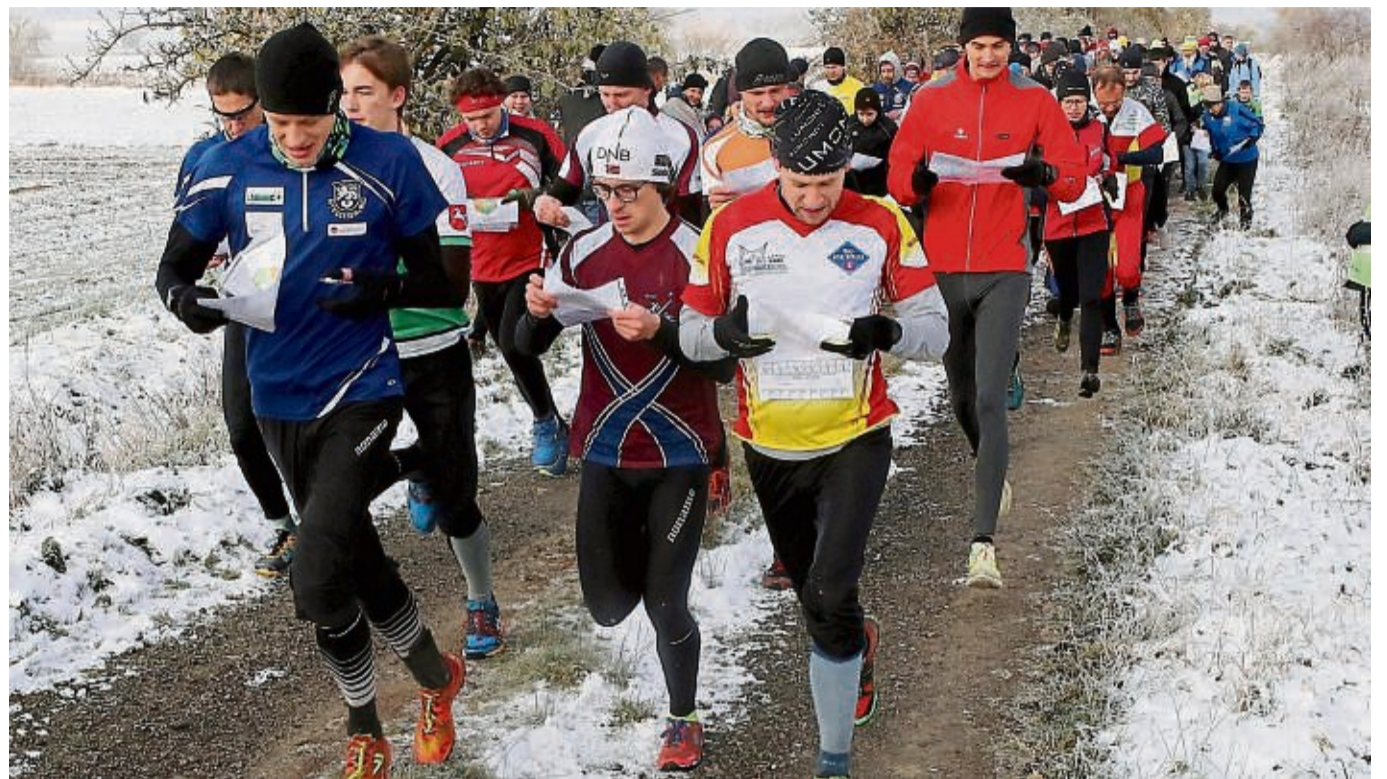
Wie vor zwei Jahren in Dankelshausen hoffen die Organisatoren auf ein großes Teilnehmerfeld.

möglich bis Freitag, 15. November, unter orientierungslauf@tg1860.de (mit Namen, Jahrgang und Verein). Das