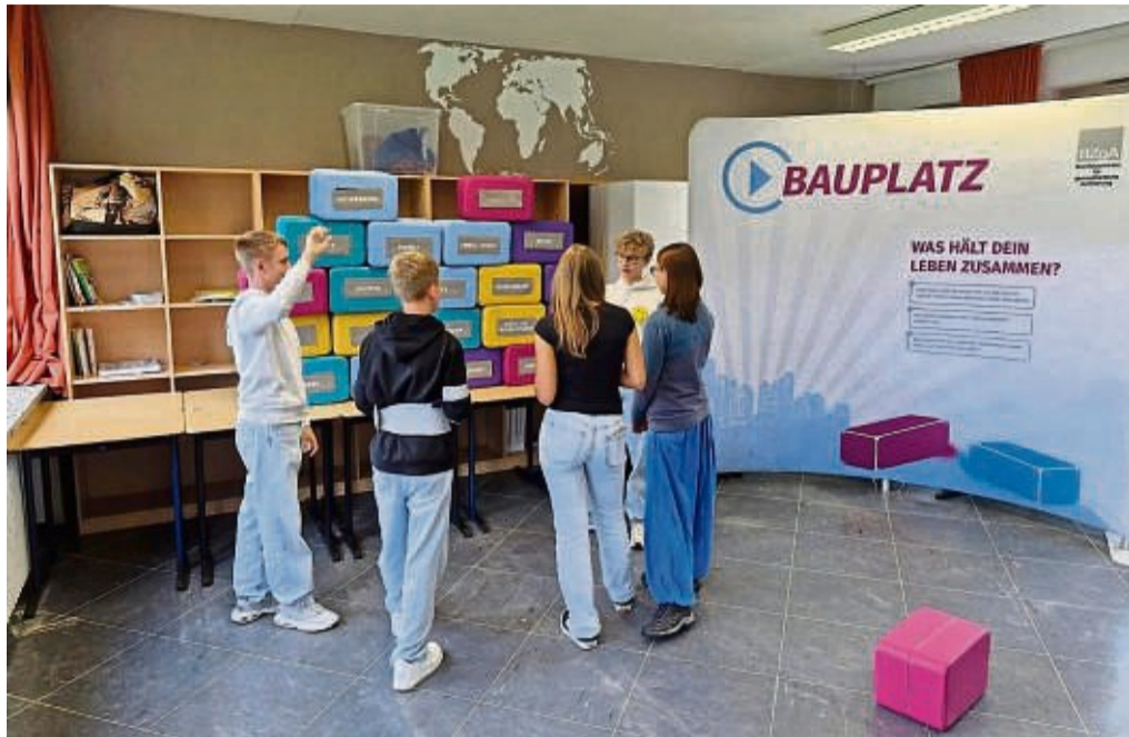
Bewusstmachung: Schüler der Rhenanus-Schule bauten bei den Jugendfilmtagen eine „Mauer-of-Power“. Darin bewerteten die Jugendlichen, was für sie wichtig ist.

Nach dem Film hatten die Schüler die Möglichkeit, in einer moderierten Diskussion ihre Eindrücke und Gedanken auszutauschen. „Diese offene Gesprächsrunde förderte nicht nur das kritische Denken, sondern ermutigte die Jugendlichen auch, über ihre eigenen Erfahrungen und das Thema Sucht zu reflektieren“, schreibt Isabelle Stern in einer Mitteilung. Um das Bewusstsein für die Suchtprävention zu stär-