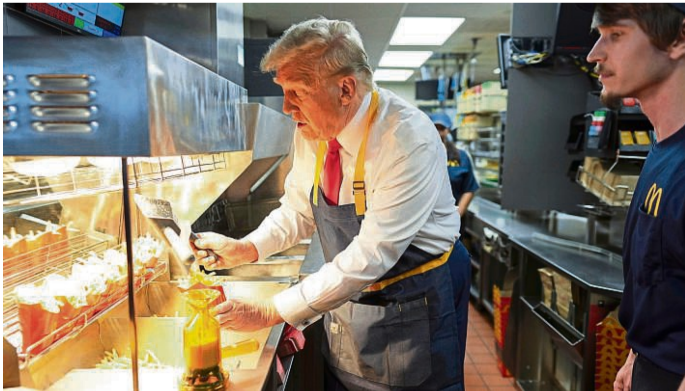
Donald Trump, Präsidentschaftskandidat der Republikaner und ehemaliger US-Präsident, bereitet Pommes Frites zu.

Warum sich Politiker im Schnellrestaurant inszenieren