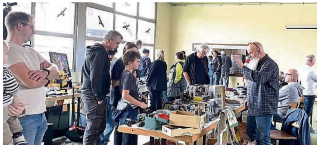
Das Interesse bei den Besuchern des Männerflohmarktes war groß. Die Standbesicker hatten auch ordentlich aufgetischt.

In Volkmarshausen fand der erste Männerflohmarkt statt