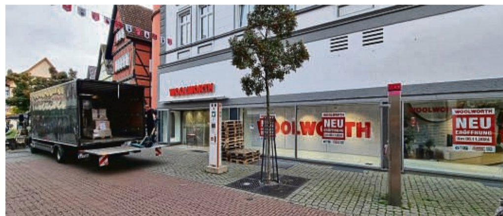
Noch wird eingeräumt: Am 8. November eröffnet die neue Woolworth-Filiale an der Breitenstraße in Bad Hersfeld (ehemals C&A).

Für den Auftritt geprobt wird schon seit Frühjahr, denn allein für die Spendenaktion wird Brahms Requiem nicht einstudiert: Einen Tag später, am 24. November, wird es „in großer Runde“ gemeinsam mit dem Sinfonieorchester Thüringer Symphoniker Saalfeld-Rudolstadt ab 18 Uhr in der Evangelischen Stadtkirche aufgeführt. nm