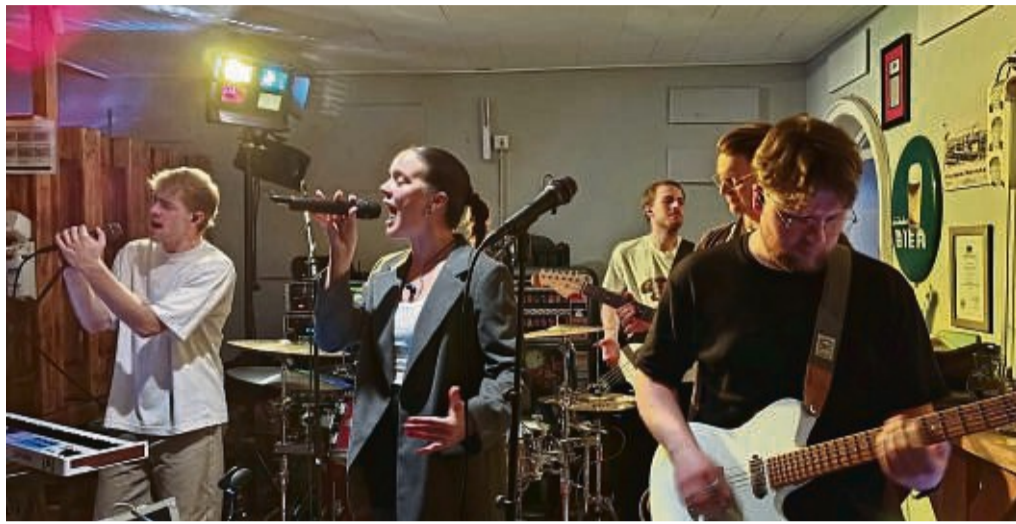
In der Biermanufaktur spielte die Hersfelder Band „Red Carpet“.

Die ebenfalls für den Samstagabend eingeplante Band „Werratal egal“ musste wegen einer Erkrankung absagen, deshalb spielten „No Sugar“ nach einer Pause ihr Set einfach noch einmal. Da das Publikum von Location zu Location rotierte, war das eine