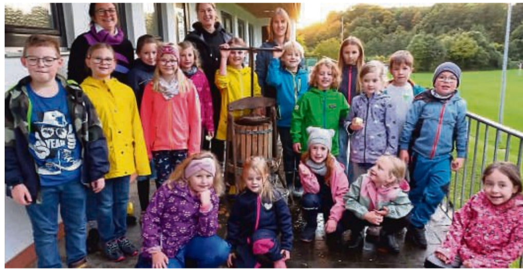
Solzer Füchse: Kinder und Jugendliche beschäftigten sich in Solz mit dem Thema „Wie kommt der Saft aus dem Apfel“.