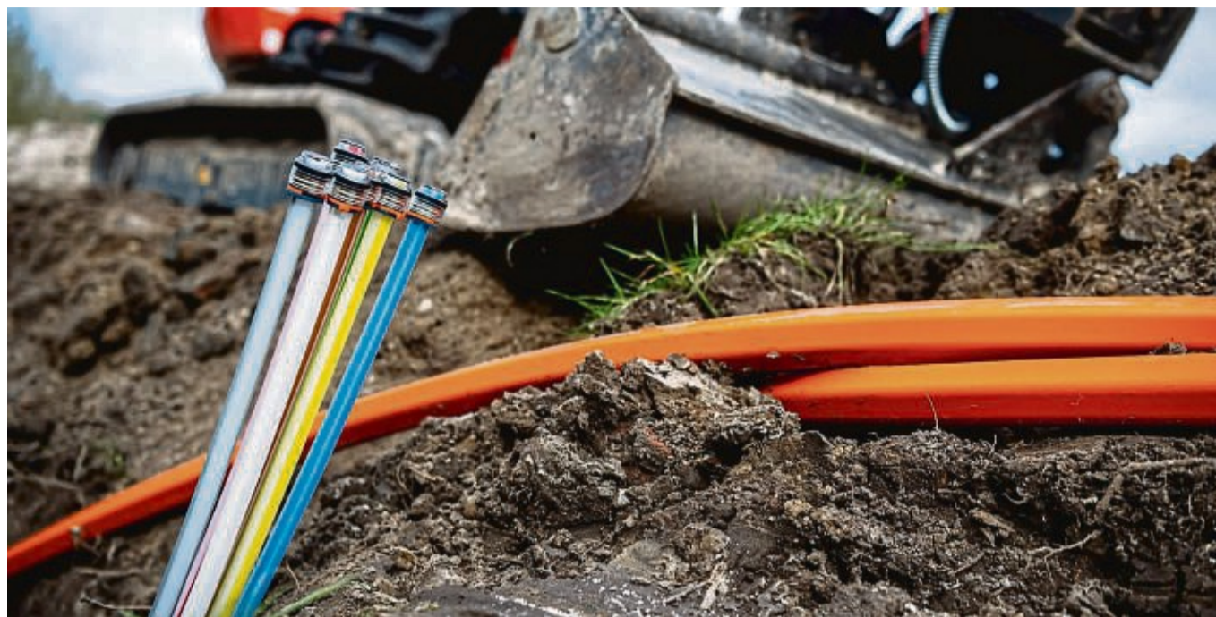
Glasfaser: In Haunetal ist man mit der Ausbaugeschwindigkeit unzufrieden und kritisiert einen unzureichenden Informationsfluss.

„Unsere Bau-Abteilung hat das Projekt Haunetal auf der Agenda. Da wir die Glasfasernetze eigenwirtschaftlich bauen, müssen wir vorab kalkulieren, ob und unter welchen Umständen der Ausbau möglich ist. Es kann zum Beispiel sein, dass bereits Glasfaser-Infrastruktur in einer Kommune liegt, die wir anmieten können, oder, dass es bereits Leerrohrverbände gibt, in die wir die Glasfaser einführen können. All das wird zunächst geprüft und eine Kostenkalkulation aufgestellt. Erst dann können wir grünes Licht für die Bauarbeiten geben und eine Baufirma für die Umsetzung beauftragen“, so Kadèra.