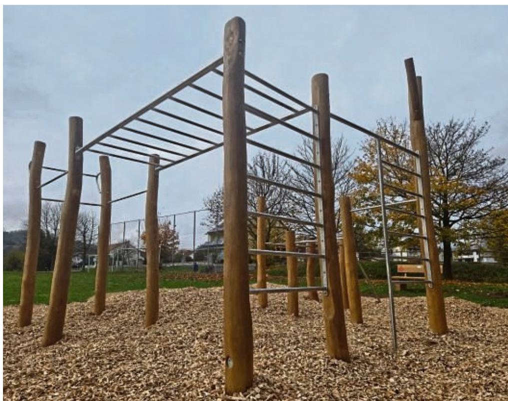
Training für jedermann: Am Sportplatz in Oberaula-Hausen gibt es nun einen Calisthenicspark.

Der Park ist so konzipiert, dass er von Menschen mit