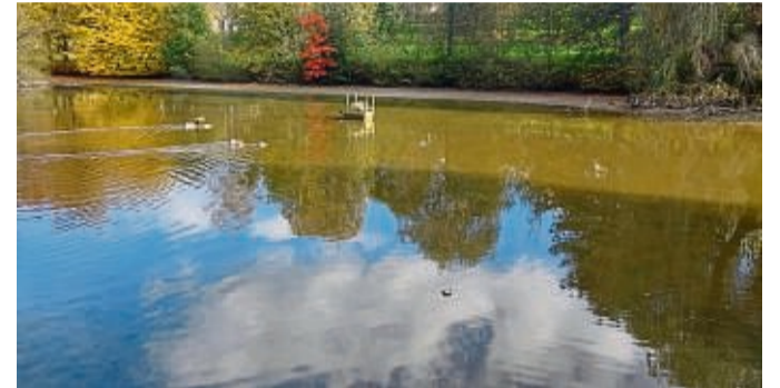
Die Teichanlage im Bebraer August-Wilhelm-Mende-Park wird saniert.

Bebra – Die Vorbereitungen für die Sanierung der Teichanlage im August-Wilhelm-Mende-Park in Bebra haben begonnen. Im Zuge des Förderprogrammes „Sozialer Zusammenhalt“ wird zur Steigerung der Aufenthaltsqualität der Teich neu modelliert und die Wege saniert, heißt es in einer Mitteilung. Dafür wurde in den vergangenen Tagen der Mönch, zur Regulierung des Wasserstandes, für das behutsame Wasser- auslassen vorbereitet. In Abstimmung mit der unteren Naturschutzbehörde werden die Fische vom Angelverein Weiterode fachgerecht abgefischt und in ein Spezialfahrzeug, das einen hohen Sauerstoffgehalt garantiert, umgesetzt. Teile des Teiches im Park sollen dann in den kommenden Monaten abtrocknen, um ausgebagert zu werden. Danach kann der Teich neu modelliert werden. red/aw