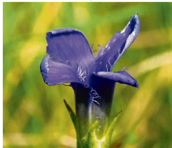
Gewöhnlicher Fransenenzian: Die Pflanze darf nicht gepflückt werden, betonen Experten.

Aufgrund ihrer Ökologie wächst die Art in der Region nur auf trockenen, steinig, stickstoffarmen Kalkmagerasen. Die Blütezeit erstreckt sich vom Spätsommer bis Anfang November. Der Enzian hat eine Wuchshöhe von fünf bis 30 Zentimeter. Ein starker Duft, der an Veilchen erinnert, und die dunkelblaue Farbe der Blüten, die das UV-