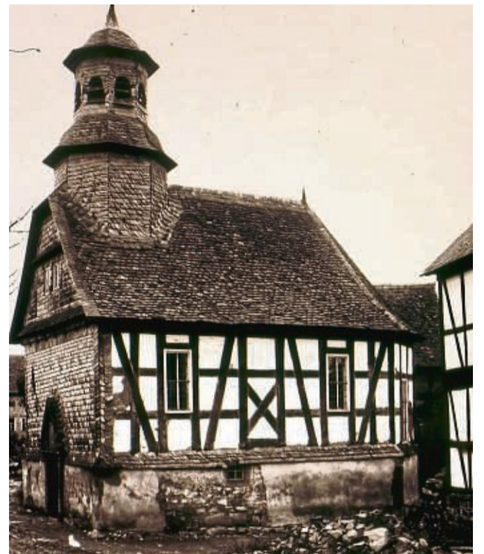
Fachwerkkirche von Haine: Sie birgt kaum bekannte Schätze aus der Mauritiuskapelle im Kloster Georgenberg in Frankenberg.