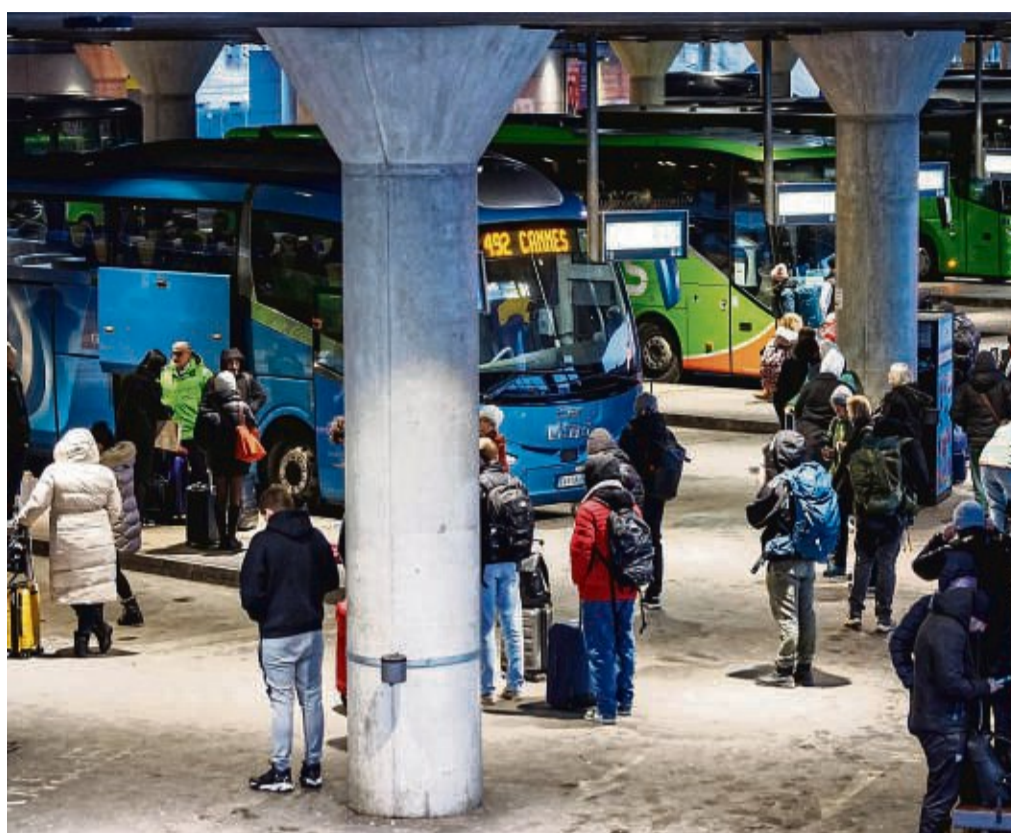
Bei Fernbus-Verspätungen oder -Ausfällen haben Reisende Anspruch auf Umbuchung oder Ticket-Erstattung.

Weil der Bus dann aber ansich pünktlich war, und man in aller Regel eingeeckelt hat und damit der Fahrschein