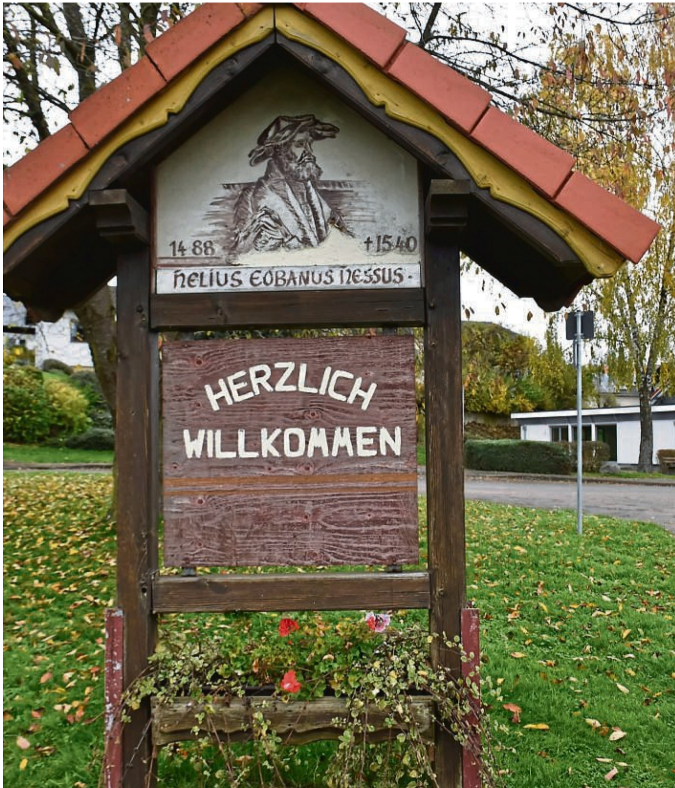
Jubiläumsort 2025: Auf der Willkommenstafel am Ortseingang erinnert Halgehausen an seinen berühmten Sohn, den Humanisten Eobanus Hessus.

Donnerstag, 1. Mai: Die erste Grenzwanderung, initiiert vom TSV Halgehausen, führt mit Bewohnern und Vereinen der angrenzenden Dörfer auf eine Tour entlang der