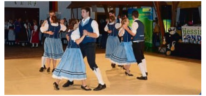
Die Hessenmeister im Volkstanz werden beim Turnier in Adorf gesucht, das von der Kreislandjugend Waldeck ausgerichtet wird. Das Archibild zeigt den Auftritt der Landjugend Adorf beim Volkstanzturnier 2015 in Rhenege.