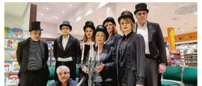
Debüt in der Buchhandlung: die Mitglieder des „Buchstaben-theaters“.

Auf einen ebenso erfolgreichen Turnierverlauf hofft die Kreislandjugend Waldeck auch in diesem Jahr. An der Hessenmeisterschaft nehmen von der Kreisgruppe die Landjugend Adorf (Vierpaar) und die Landjugend Wirmighausen (Mehrpaar) teil. red