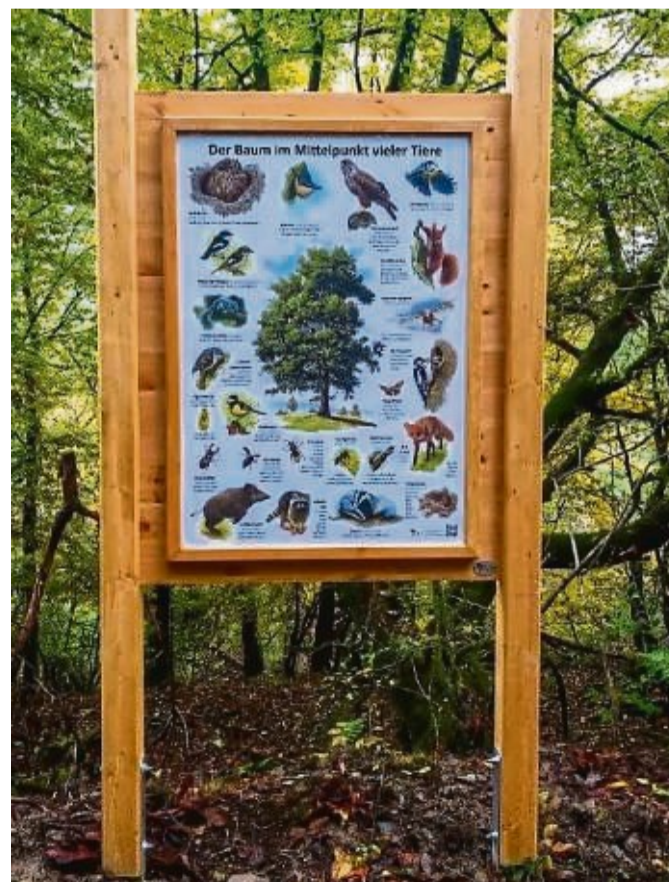
Tafeln am Naturlehrpfad geben Informationen zu Tieren und Pflanzen.

Im Auftrag der Stadt Hatzfeld wurden aus Verkehrssicherungsgründen einige