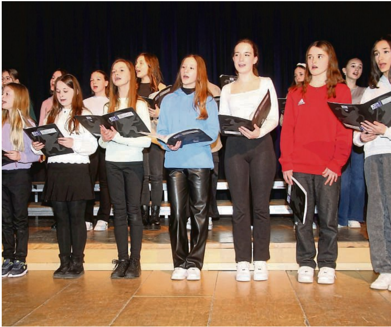
An dem Benefizkonzert in der Liebfrauenkirche werden auch die Chöre des Franckenberger Gymnasiums Edertalschule mitwirken – hier bei einem Schulkonzert im vergangenen Februar.