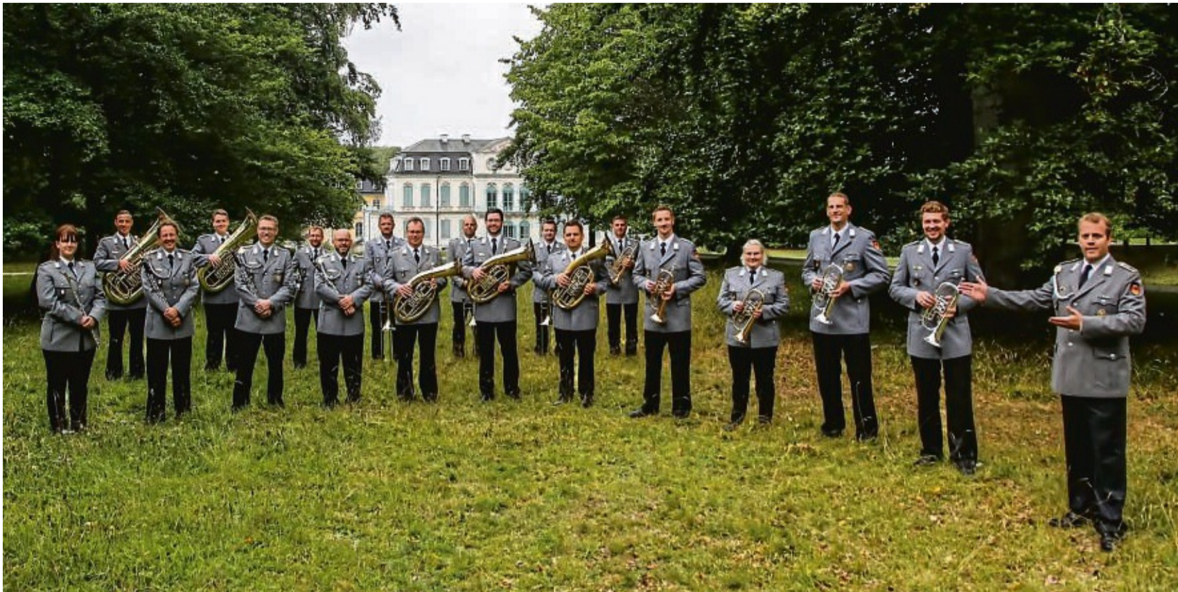
Das Heeresmusikkorps Kassel auf den Spuren von Ernst Mosch - Egerländerbesetzung zu Gast in Bromskirchen.