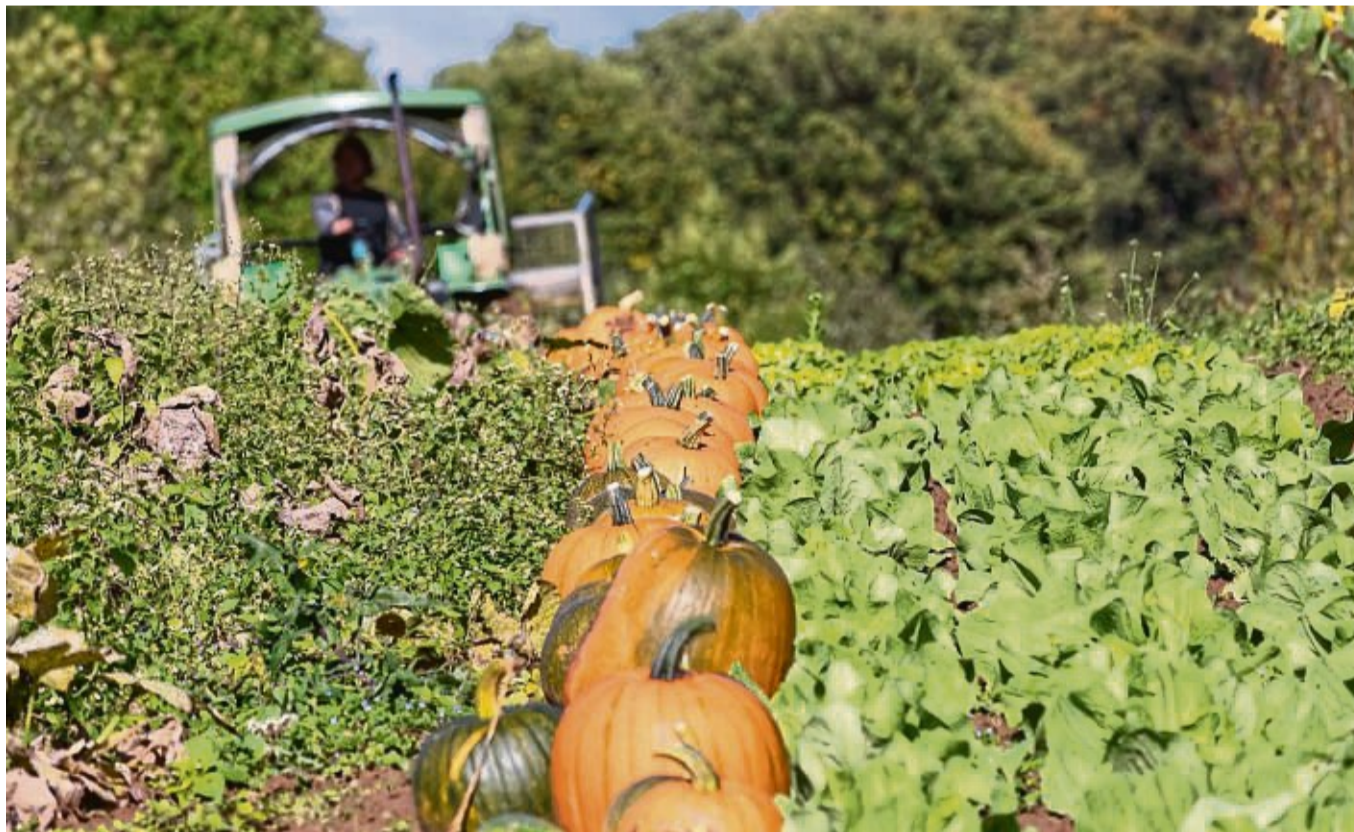
Gut getrocknet können sie gelagert werden: Auch Schnitzkürbisse wurden schon vor einigen Wochen auf den Flächen in Hübenthal geerntet. Hier liegen diese zum Trocknen am Rand der Fläche.

Trotzdem meint Niehaus, dass die Kürbisse davon kei-