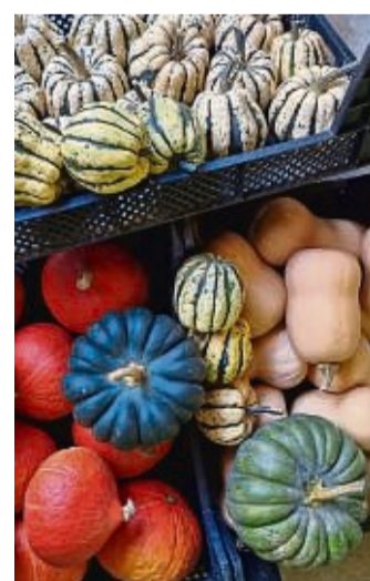
Bunte Hingucker: Vom Hokkaido bis zum Muskatkürbis.

ser ähnlich den Zucchini fortlaufend Exemplare hervorbringt, die dann geerntet werden müssen. red