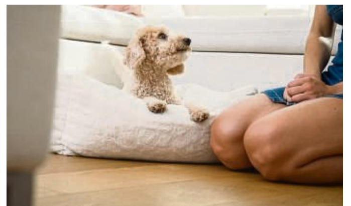
Gerichtsbeschluss: Nach einer Trennung ist ein gemeinsam angeschafftes Haustier als Alleineigentum einem der bisherigen Miteigentümer zuzuweisen.