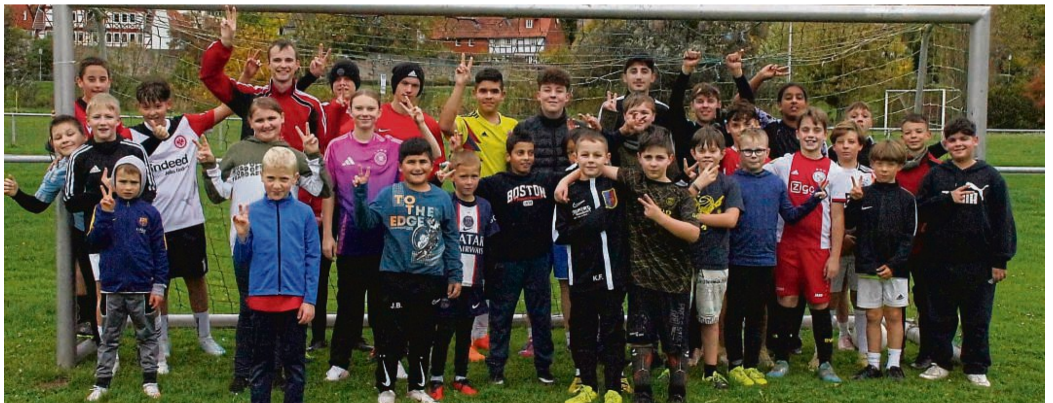
Am viertägigen Fußballcamp der evangelischen Kirchengemeinde Sooden nahmen 40 Kinder und Jugendliche teil, sie kicken im Schatten der Allendorfer Kirche.

Unter Gebet und Segen verabschiedeten sich die leidenschaftlichen Spieler voneinander und bekundeten dabei schon ihre Vorfreude auf das nächste Fußballcamp im Herbst 2025. red/sff