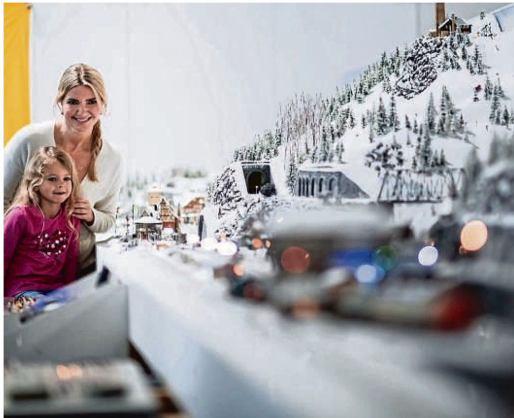
Winterzauber-Idylle: So eine pudersüßige Modellbahnanlage weckt nostalgische Weihnachtsgefühle, klar – aber ist eine Modellbahn auch heute für Kinder sinnvoll?

Auf der Suche nach einem Weihnachtsgeschenk? Warum Modelleisenbahnen ein sinnvolles Präsent für Menschen aller Altersgruppen sein können und was beim Kauf wichtig ist.