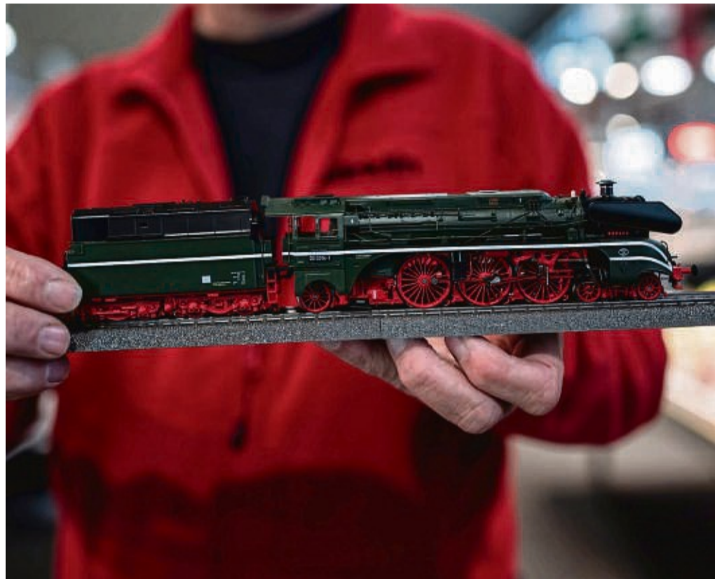
Schöne Schätze: Manche alte und neue Lokomotiven können Sammlerstücke sein und richtig ins Geld gehen.