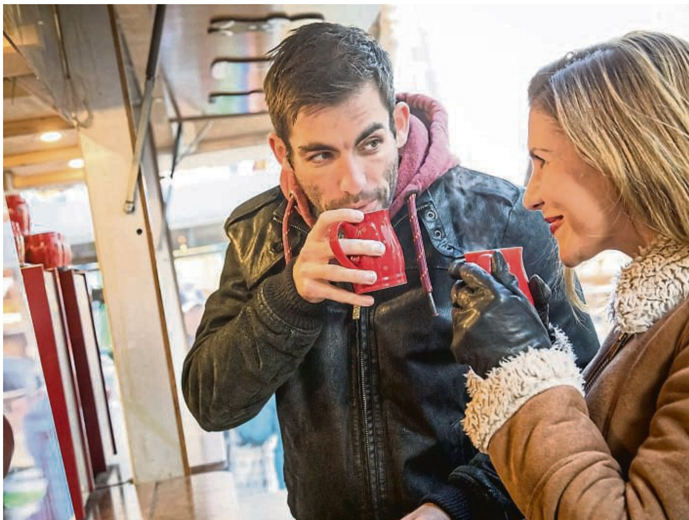
In Maßen: Glühwein enthält viel Zucker und Alkohol.