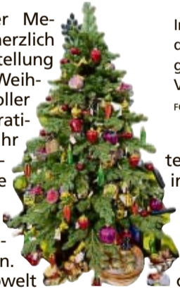
Im Trend: der fröhlich geschmückte Veggie-Baum.

Das Gartencenter Meckelburg lädt herzlich zur Adventsausstellung ein – für eine Weihnachtssaison voller Magie und Inspiration. In diesem Jahr dominieren elegante Farben wie Schneeweiß und sanfte Grüntöne, die an einen Tannenwald erinnern. Die grüne Farbwelt bringt die Natur in unser Zuhause. Bäume aus Holz, Glas und Metall, harmonisch aufeinander abgestimmt, schaffen ein einzigartiges Ambiente. Ergänzt wird das Sortiment durch edle Lichterhäuser und mundgeblasene Christbaumkugeln aus Europa. Träume von weißer Weihnacht werden wach. Einladende Lichterhäuser ziehen sich durch alle Farbthemen – vor der Haustür, auf der Fensterbank oder auf dem Esstisch. Voll im Trend sind Rot, Weiß und Schwarz mit goldenen Akzenten, das einen Hauch von Glamour zaubert. Klare Formen und Streifenmuster machen die Dekoration außergewöhnlich, und die Nussknacker sind ein stylischer Blickfang. Ein Highlight ist der Veggie-Baum mit fantasievoll gestalte-