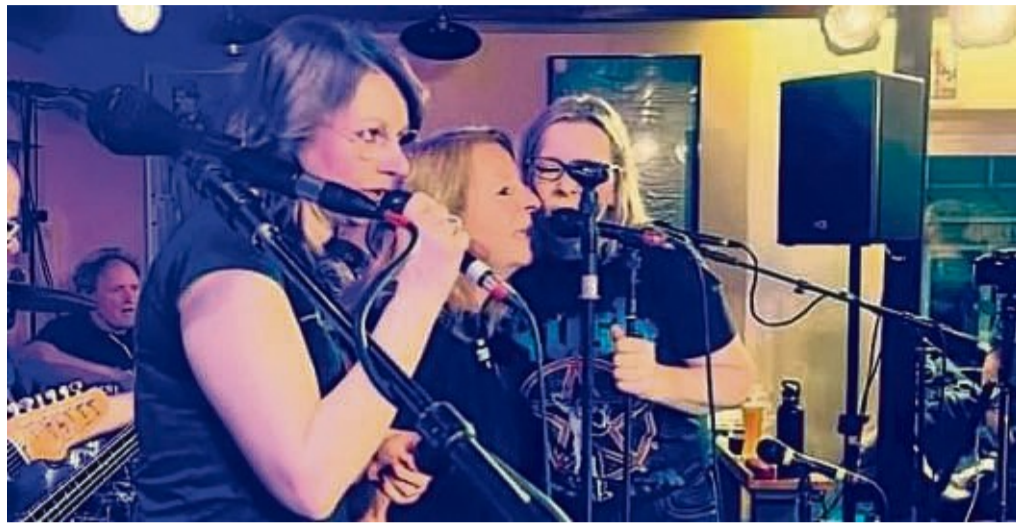
„Those Were The Days“ heißt es in der Musikkneipe Berlinchen bereits zum vierten Mal: Die Musiker-Combo hat dafür ein komplett neues Programm vorbereitet.

Sie werden etwa die Hälfte der Titel vom letzten Konzert spielen und die andere Hälfte neue Songs präsentieren. Ein Aspekt dieses „Musiker-Kollektivs“, anders als bei einer festen Band, ist ja der Wunsch nicht immer das gleiche Programm zu spielen. Es gibt ja auch so viele Songs, die einen engagierten Musiker quasi „darum bitten“, mal wieder gespielt zu werden. Und es sollen nach Möglichkeit auch die Stärken und Vorlieben aller Musiker berücksichtigt werden.