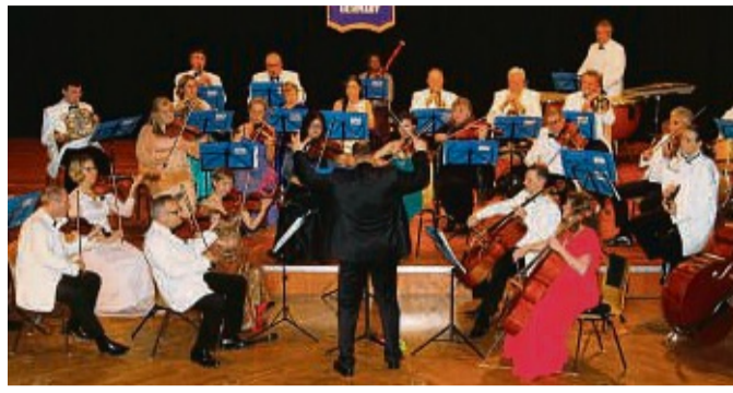
Johann-Strauß-Orchester Frankfurt: Zum Neujahrskonzert des Kiwanis-Clubs Ederbergland gastieren die Musiker zum 16. Mal in Frankenberg.

Für das Johann-Strauß-Orchester Frankfurt ist es schon das 16. Neujahrskonzert in