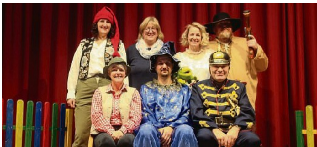
Das Stück vom Räuber Hotzenplotz führt die Kuckucksbühne Battenfeld in der Kulturhalle Battenfeld auf.

sich gerade für den Samstagabend auch auf den Besuch erwachsener Theaterfreunde, da die Vormittagsaufführungen hauptsächlich für die heimischen Schulen und Kindergärten geplant sind, allerdings sind auch hier erwachsene Zuschauer willkommen. Erwachsene zahlen am Samstag 8 Euro, Kinder an allen Tagen 5 Euro Eintritt. Eintrittskarten gibt es unter theatergruppe.battenfeld@gmail.com oder telefonisch unter der Nummer 0 64 52/ 74 00 oder an der Tagesbeziehungsweise an der Abendkasse. mp