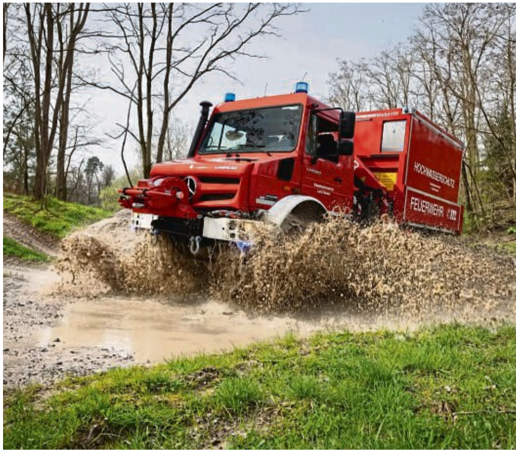
Multifunktional und geländegängig: Ein Unimog mit Kran, besonders geeignet für Einsätze bei Hochwasser, Wald- und Flächenbränden, wird in Edertal stationiert.

Bürgermeister Klaus Gier. Die Aufgaben des Katastrophenschutzes werden seit vielen Jahren im Landkreis ernst genommen, betonte Frese. Zug um Zug werden in notwendige Ausstattung investiert. Bei der aktuellen Aktion stehen insbesondere drohende Klima-Katastrophen im Blick. Dafür stellen Bund und Land spezielle Fahrzeuge zur Verfügung, die Kreise finanzieren die Gebäude dafür. In bewährter Partnerschaft mit Hilfsorganisationen vor Ort werden die Unimogs in Dienst gestellt. Das Katastrophenschutzfahrzeug ist bereits ausgeliefert und bei der Feuerwehr Bergheim-Gifflitz untergebracht. Nach Angaben von