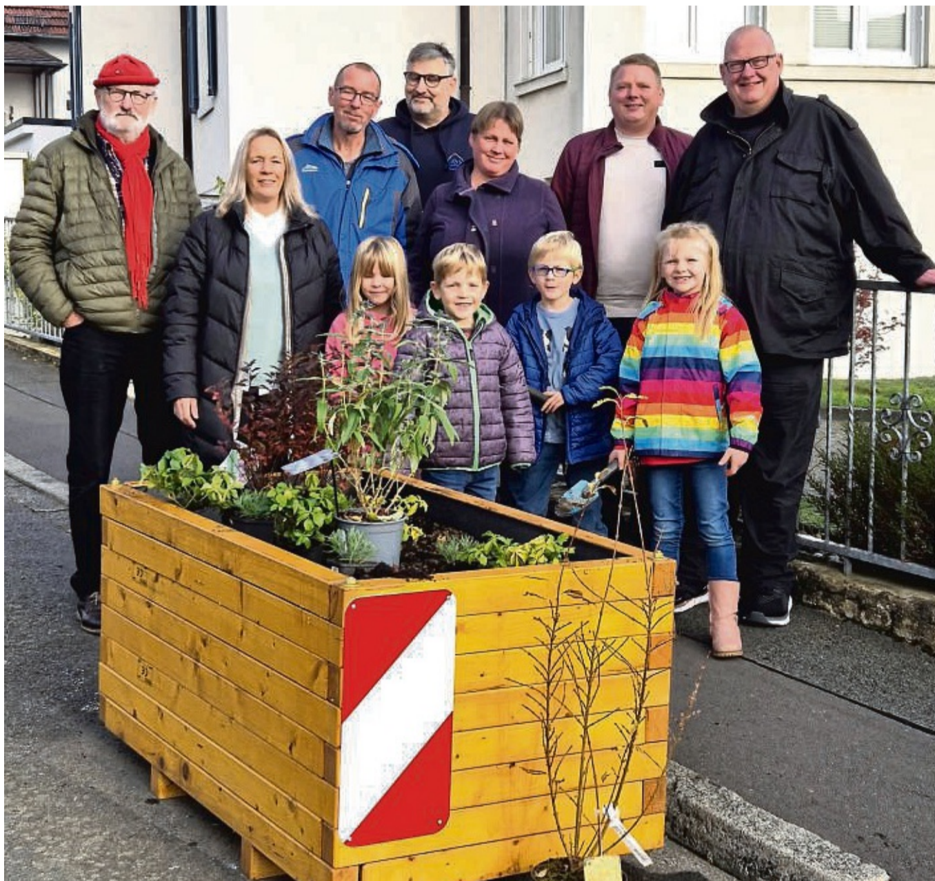
Sind stolz auf ihre Arbeit: Die Schülerinnen und Schüler der Guxhagener Schulen haben Blumenkübel an der Schönen Aussicht in Guxhagen erneuert.

Die Idee zu dem Projekt sei auf Anregung des Ortsbeirates entstanden, der sich für die Erneuerung und Verschönerung der Blumenkübel einsetzte. In der Regel werden solche Blumenkübel durch den Bauhof der