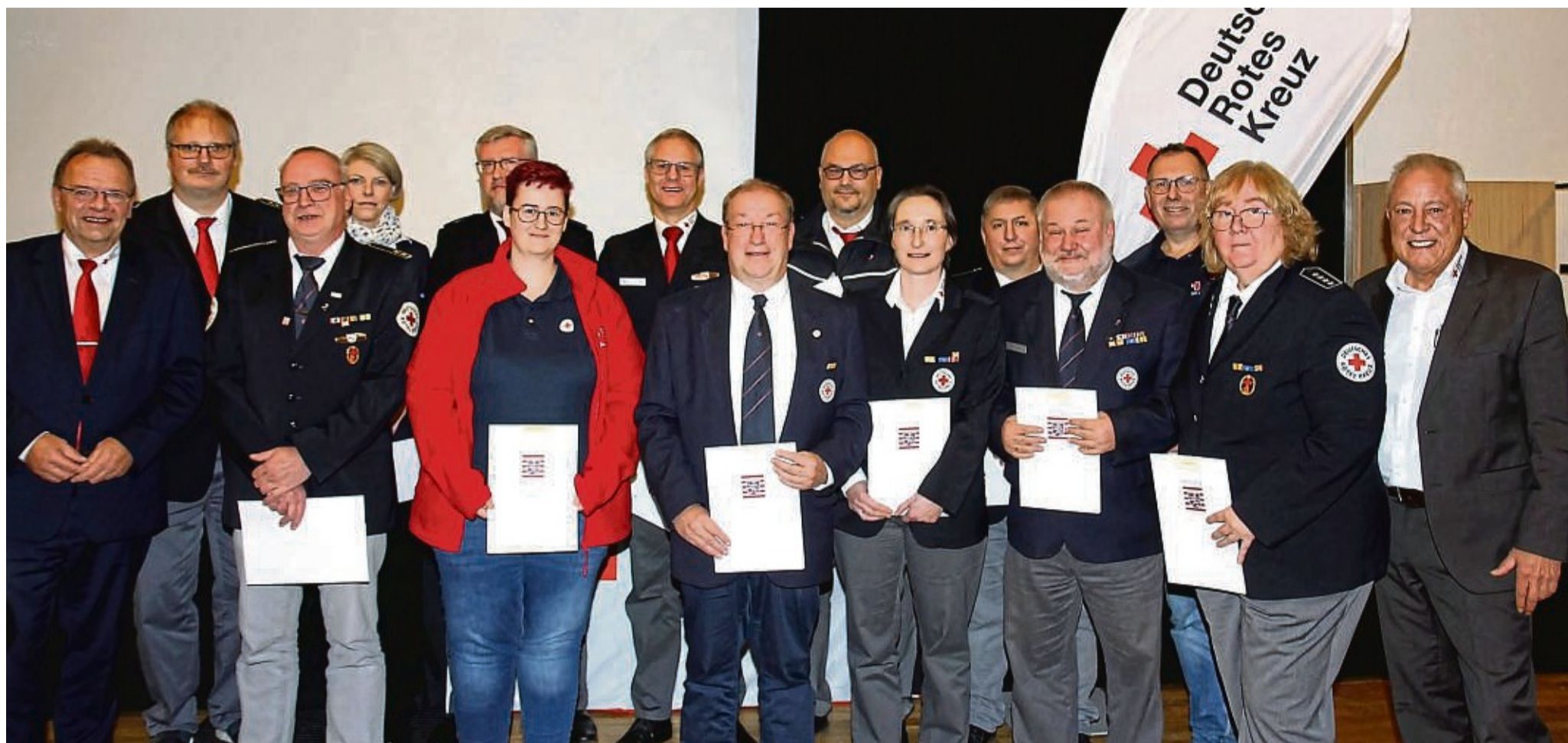
Ausgezeichnetes Engagement: Zahlreiche Mitglieder erhielten bei der DRK-Kreisversammlung die Anerkennungsprämie des Landes Hessen für langjährige aktive Mitgliedschaft.