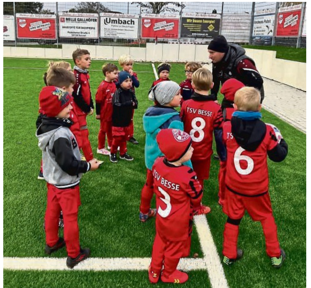
Beim Bambini-Turnier in Guxhagen konnten die jungen Kicker des TSV Besse überzeugen. Das Flutlichterlebnis werden sie so schnell nicht vergessen.