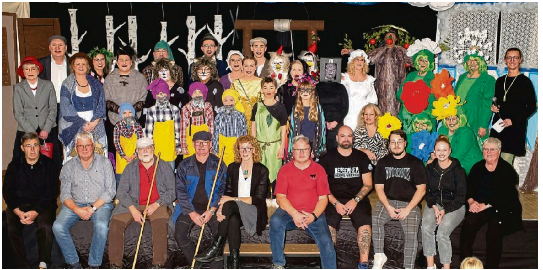
Die Schauspieler und Helfer der Katerbühne haben dafür gesorgt, dass die drei Aufführungen gelungen sind.

Für die aufwendige Arbeit gab es viel Lob von den Anwesenden, die besonders die Leistungen der Schauspieler würdigten und ausschließlich positive Rückmeldung zur Vorstellung gaben, heißt es weiter. Das lustige Stück, angelehnt an das Märchen der Gebrüder Grimm, sorgte sowohl bei den jungen Zuschauern als auch den älteren für viele Lacher und großen Applaus. Viele der Gäste waren extra für die Vorstellungen angereist, um sich von Frau Holle, dem sprechenden Apfelbaum und Backofen sowie den anderen Märchenfiguren verzaubern zu lassen.