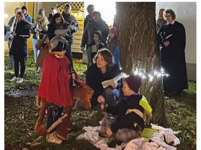
Sankt Martin kam extra auf seinem Pferd vorbeigeritten und bescherte den Kindern ein schönes Laternenfest.