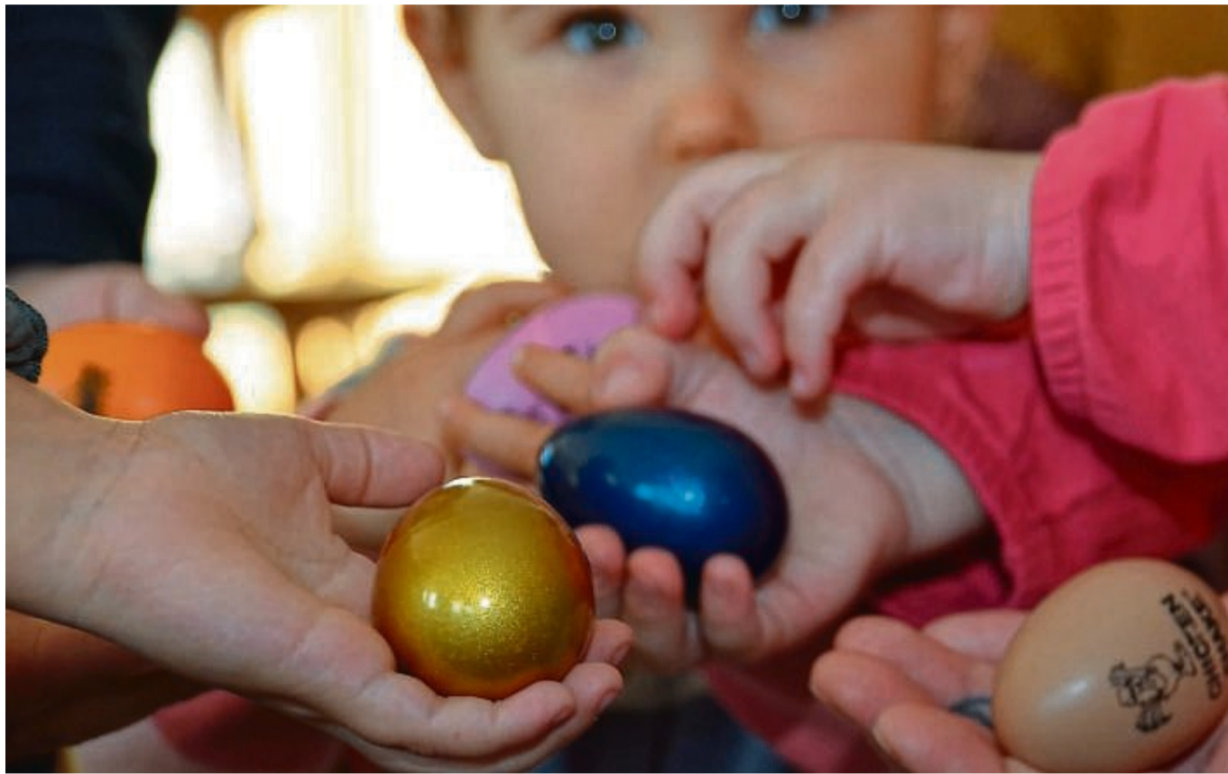
Die musikalische Früherziehung an Kitas und Schulen hat Anfang des Schuljahres begonnen: Für die derzeit 33 Angebote sind drei Lehrkräfte in Teilzeit tätig.

Zum Vergleich listete sie die Zahlen der Musikschule Werra-Meißner, die ihren Betrieb einstellte, vom November 2023 auf: Damals waren knapp 400 Schüler im musikalischen Einzelunterricht, es gab 40 Gruppen für Gruppen- und Ensembleunterricht und 24 Gruppen der musika-