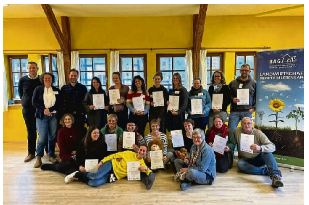
Freuen sich auf die Bildungsarbeit: Alle Teilnehmer und Referentinnen bei der Zertifikatsübergabe in Germerode.

Ziel der Qualifizierung ist es, Bauernhöfe als Lernorte zu etablieren, an denen Kindergärten, Schulen und auch Erwachsenenengruppen Einblicke in die Landwirtschaft und die Natur erhalten können. Neben theoretischem Wissen standen praktische Übungen