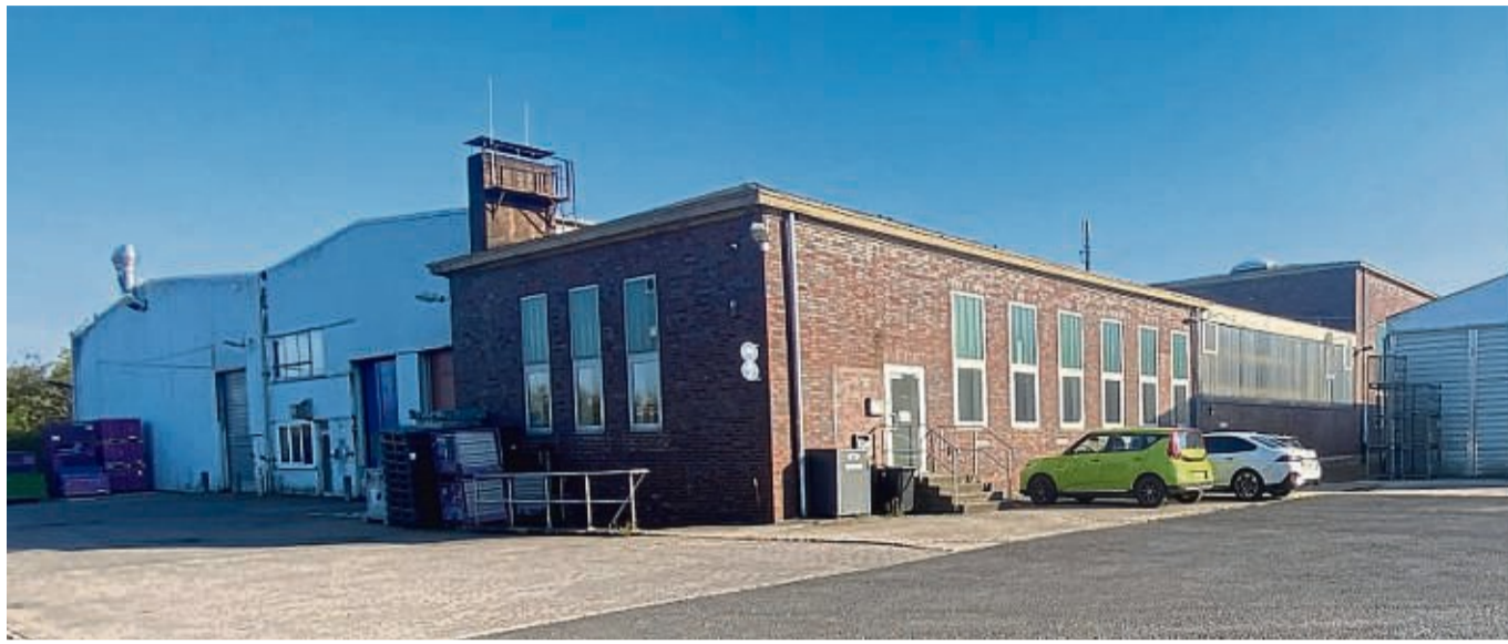
Der Hauptstandort von Bo Parts Solutions ist in Nentershausen-Dens im Industriegebiet Reichenberg: Hier werden für die Automobilindustrie beispielsweise Türverkleidungen, Instrumententafeln und Seitenwandverkleidungen hergestellt.

Bo Parts Solutions ist spezialisiert auf die Produktion von Ersatzteilen für die Automobilindustrie. Die erneute Krise wurde durch das Auslaufen eines wichtigen Auftrags für ein Volkswagenmodell und den unerwarteten Verlust eines Ersatzauftrags ausgelöst. Dies führte zu finanziellen Schwierigkeiten, die die Geschäftsleitung nun im Rahmen eines Insolvenzverfahrens überwinden will. „Unser Ziel ist es, das Unternehmen zu sanieren und möglichst viele der 73 Arbeitsplätze zu sichern“, er-