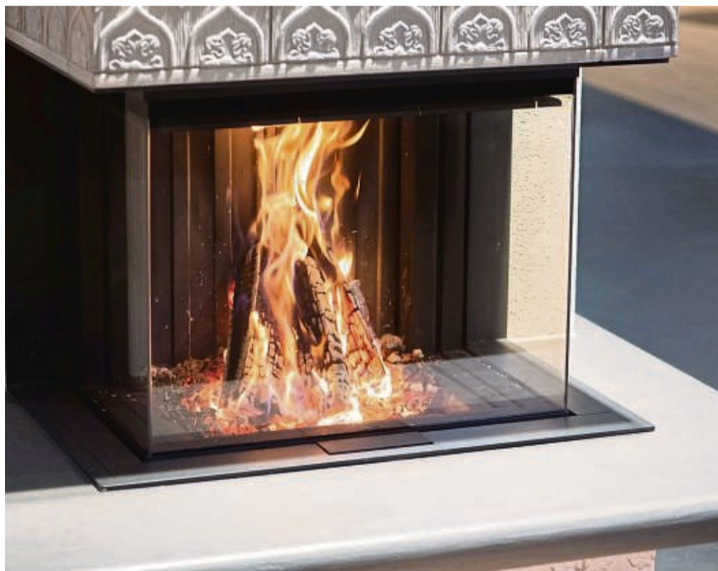
Die Qualität des Brennstoffs hat großen Einfluss darauf, wie umweltfreundlich ein Ofen heizt.

BOTHUR: Es ist viel effizienter und umweltfreundlicher, wenn man sich an die Her-