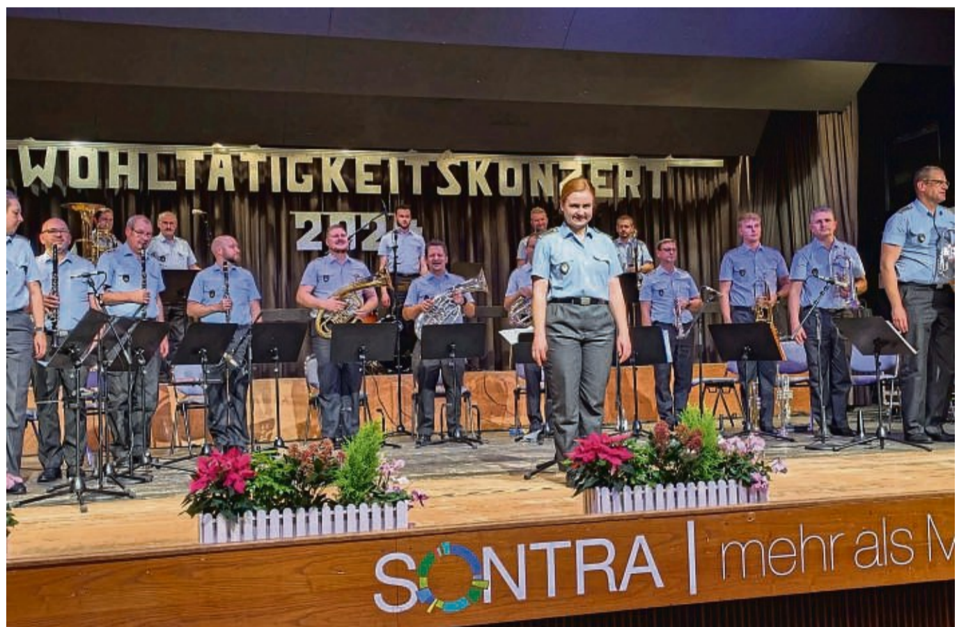
Unterhielten die Besucher auf das Beste: die 18 Egerländer des Heeresmusikkorps Kassel, die am Dienstag im Sontraer Bürgerhaus ihr Wohltätigkeitskonzert spielten.

Die 18 Musiker des Egerländer Ensembles vereint die Begeisterung für die böhmische Blasmusik, die untrennbar mit den Namen Ernst