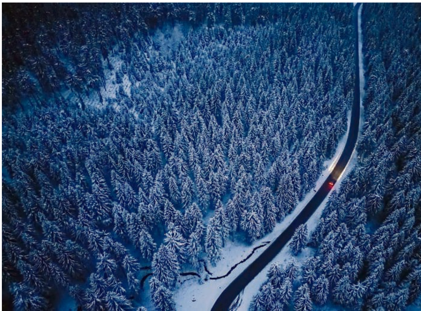
Entspannt durch die Winterlandschaft: Mit gutem Licht und vorsichtigem Agieren am Lenkrad gelingt das besser.

Wer auf winterlichen Straßen mit nicht vorgeschriebenen Reifen erwischt wird, muss als Fahrer mit 60 Euro Bußgeld rechnen. Werden andere behindert, sind 80 Euro fällig. Zudem wird in Flensburg ein Punkt notiert. Dem Halter drohen 75 Euro und ebenfalls ein Punkt.