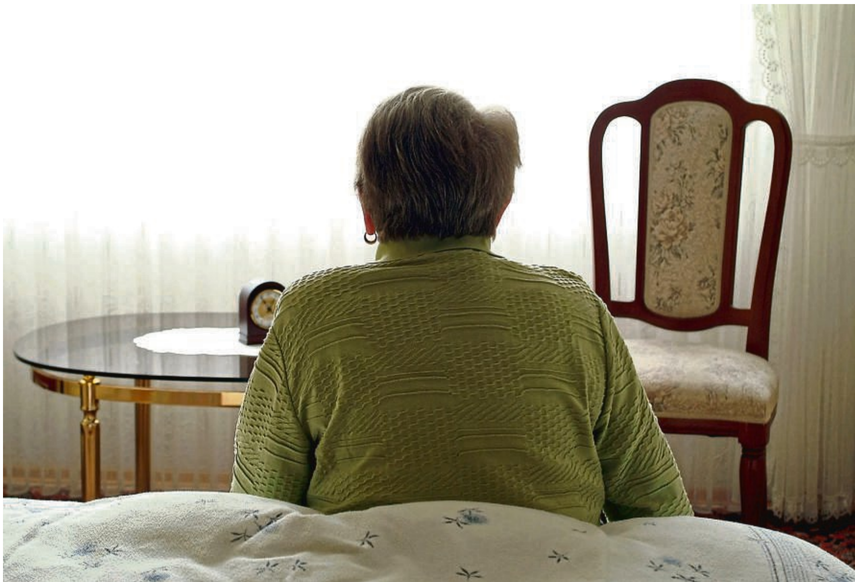
Morgens immer fürchterlich müde: Viele Ältere können beim Thema Schlafstörungen mitreden.

Oder die Bettgezeit ist zu früh: 5 Prozent der Hochbetagten – also der über 85-Jährigen – legen sich vor 19 Uhr schlafen. „Wenn ihr Tag monoton und langweilig und ohne Anregungen war, sie aber nur noch sechs bis sieben Stunden Schlaf brauchen, sind sie natürlich um 3 Uhr schon ausgeschlafen“, sagt