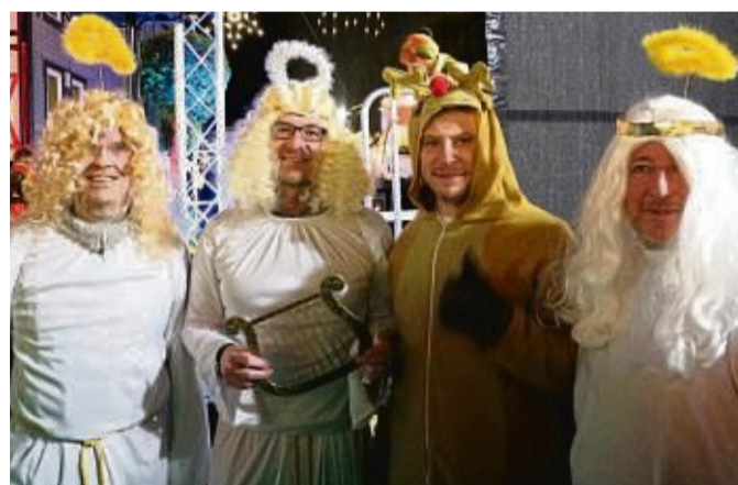
Als Christkind und Weihnachtselch nach einer verlorenen Weihnachts-Wette.

welt, möglichst viele Mitglieder zu aktivieren und zum Singen auf die Bühne zu bringen.