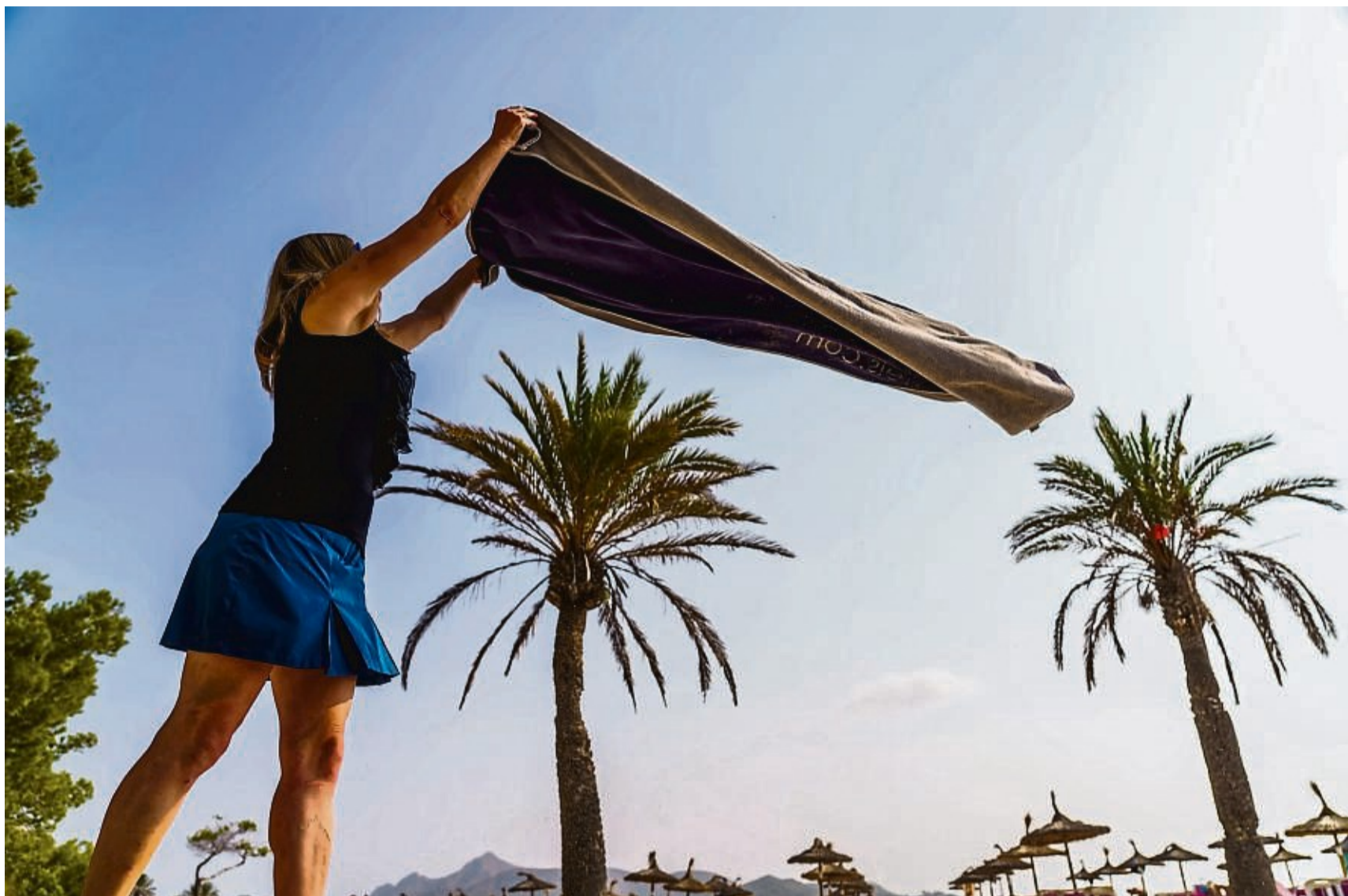
Hach, wenn doch wieder Sommer wäre. Wer jetzt den nächsten Urlaub bucht, kann zumindest schon einmal in Gedanken das Strandhandtuch auswerfen.

Mit vielen Monaten Vorlauf die Reise buchen, das heißt auch: sich früh festlegen. Machen Krankheiten, plötzli-