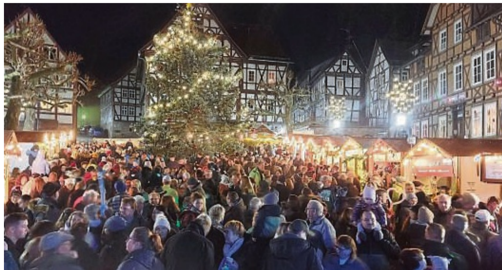
Schneebedeckte Marktbuden zauberten im vergangenen Jahr eine wundervolle vorweihnachtliche Stimmung.

Cebulla Ausschussvorsitzender Standesamt Sontra bietet auch in 2025 Samstagstrauungen an Wie schon in den vergangenen Jahren bietet das Standesamt auch im Jahr 2025 wieder außerhalb der regulären Dienstzeit Samstagstrauungen an. Brautpaare können an folgenden Terminen zwischen 10.00 Uhr und 12.00 Uhr im Standesamt Sontra die Ehe schließen: Termine: 18.01.2025 15.02.2025 08.03.2025 12.04.2025 10.05.2025 28.06.2025 26.07.2025 23.08.2025 13.09.2025 18.10.2025 15.11.2025 13.12.2025 Falls Sie beabsichtigen, an einem der vorgenannten Termine im Standesamt Sontra zu heiraten, empfehlen wir eine baldmöglichste Kontaktaufnahme mit den Standesbeamtinnen. Für weitere Fragen und Informationen stehen Ihnen die Standesbeamtinnen der Stadt Sontra unter der Telefonnummer 0 56 53/97 77 46, per E-Mail unter standesamt@sontra.de sowie persönlich während der Öffnungszeiten gerne zur Verfügung. gez. Thomas Eckhardt Bürgermeister