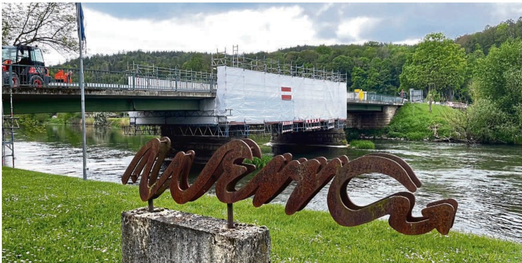
Der Verkehr kann wieder rollen: Über sieben Monate war die Brücke über die Werra bei Wanfried gesperrt und von einem Gerüst umsäumt. Hessen Mobil und die Baufirma Eurovia haben die Werrabrücke grundlegend saniert und erneuert, seit gestern dürfen wieder Kraftfahrzeuge passieren.

Die vollumfänglichen Instandsetzungsarbeiten an der historischen Werrabrücke in Wanfried haben rund 1,5 Millionen Euro gekostet. Nötig gewesen seien sie, um dem immer größeren Verkehrsaufkommen auch zukünftig