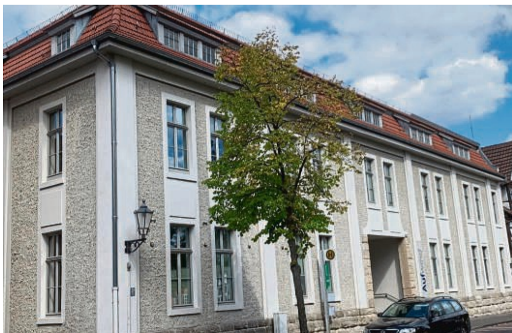
Neben den 31 Praxen im Kreis gibt es Hilfsangebote wie Aufwind – Verein für seelische Gesundheit und Selbsthilfegruppen für Betroffene und Angehörige.

Bei einem Bevölkerungsanteil von rund 15 Prozent an Menschen unter 18 Jahren