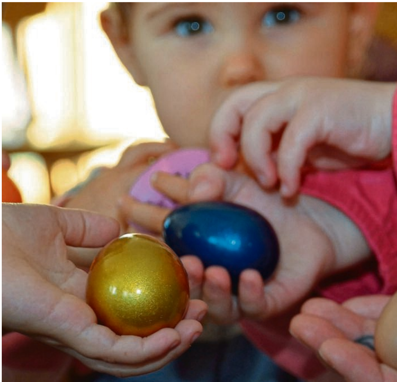
Die Musikschule Früherziehung an Kitas und Schulen hat Anfang des Schuljahres begonnen: Für die derzeit 33 Angebote sind drei Lehrkräfte in Teilzeit tätig.

Für den jetzigen Einzelunterricht wurden Angaben der Landrätin zufolge 14 Lehrkräfte in Teilzeit eingestellt, was in etwa den Umfang von sieben Vollzeitstellen ausmache. Diese Lehrkräfte reichten für bis zu