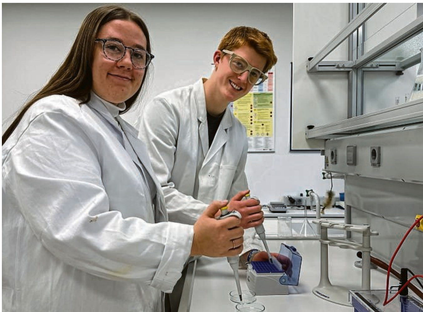
Schüler experimentieren im neuen S1-Labor der Beruflichen Schulen Witzenhausen.