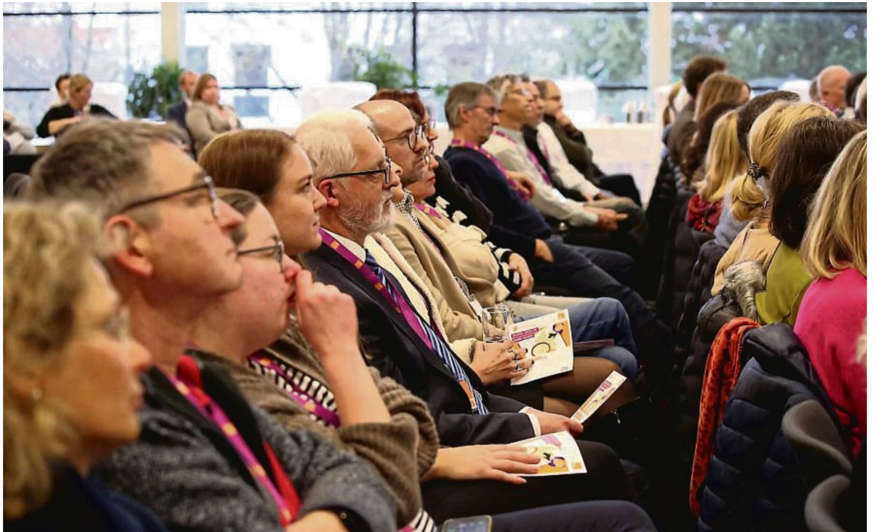
Im engen Austausch waren Medizinerinnen und Mediziner bei der von der Kassenärztlichen Vereinigung organisierten Veranstaltungsreihe #FokusVersorgung in der Korbacher Stadthalle.

KINO STUDIO Willingen Vaiana 2: Tägl. außer Di 16 h (2D) u. 20 h (3D), Sa u. So auch 14 h (2D) Alter weißer Mann: Tägl. außer Di 16.30 h Niko - Reise zu den Polarlichtern: Sa u. So 14.30 h Gladiator 2: Tägl. außer Di 19.30 h KINO K Korbach Alter weißer Mann: Sa, Mo u. Di 17 h André Rieu Weihnachtskonzert 2024 - Gold and Silver: So 17 h Bagman: Sa 19.30 u. 22.15 h, So u. Mi 20 h, Mo 19.45 h, Di 17.15 u. 19.45 h Der Herr der Ringe - Die Schlacht der Rohirrim: Mi 17 u. 19.30 h Der Vierer: Sa 17.15 h, So bis Di 19.45 h Der wilde Roboter: Sa 13 u. 15 h, So 13 h, Mo bis Mi 15 h Die Schule der magischen Tiere 3: Tägl. 15 h, Sa u. So auch 13 h, Mo auch 17.15 h Gladiator II: Sa 19.15 h, So 19.30 h, Mo 16.45 h, Di 16.45 u. 19.15 h, Mi 17 u. 19.15 h Gloria!: Mi 19.45 h Niko - Reise zu den Polarlichtern: Sa u. So 13 u. 15.15 h, Mo bis Mi 15 h Red One - Alarmstufe Weihnachten: Sa, So u. Di 17.15 u. 19.45 h, Sa auch 22.15 h, Mo 17.15 u. 19.30 h, Mi 17.15 h Sneak Preview: Mo 20 h Terrifier 3: Sa 21.45 h Vaiana 2: 3D: Tägl. 17.15 h, Sa auch 22 h, So auch 15 h / 2D: Sa 13, 15, 17 u. 19.45 h, So 13, 15, 17.15 u. 20.15 h, Mo 15 u. 19.45 h, Di u. Mi 15 u. 19.30 h Weihnachten in der Schuster-gasse: Sa u. So 13 h Wicked (Songs dt. gesungen): Sa 19.45 h, So 17 h Woodwalkers: Tägl. 15 h