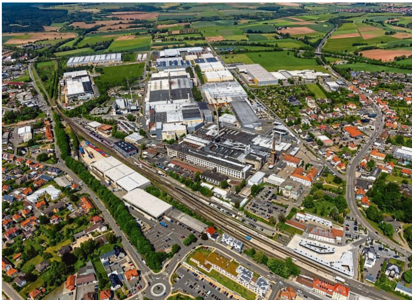
Continental-Standort Korbach: Aktuell sind nach Angaben des Unternehmens hier mehr als 3600 Mitarbeitern beschäftigt.