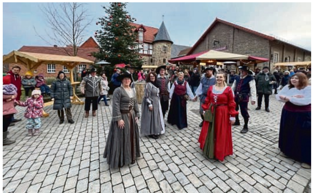
Die Gruppe Gaudium Saltandi tritt erneut beim Weihnachtsmarkt auf.

Das Hotel Brunnenhaus Schloss Landau begrüßt die Gäste der Bergstadt mit einem kulinarischen Angebot, welches den Markt zusätzlich perfekt ergänzt. Auch in