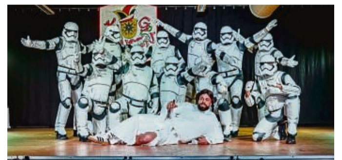
Männerballettturnier in Münden: Mit einer galaktischen Auf-führung wurden die Zuschauer begeistert.

Der Konzern gab zudem auf Nachfrage eine Einschätzung zum Sanierungsrückstand ab: „Der Umfang der unmittelbar erforderlichen Investitionen hängt maßgeblich von der geplanten Nutzungsart des Gebäudes ab.“ Die hohe Summe, die den Wicker-Konzern letztlich mit zur Schließung veranlasste, bezog sich auf einen Weiterbetrieb des Gebäudes als Klinik. red