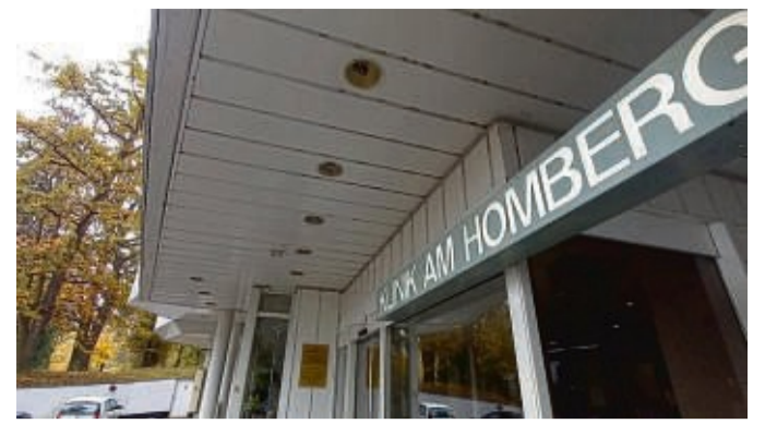
Schließt im zweiten Quartal 2025 auf: die Wicker-Klinik am Homberg.