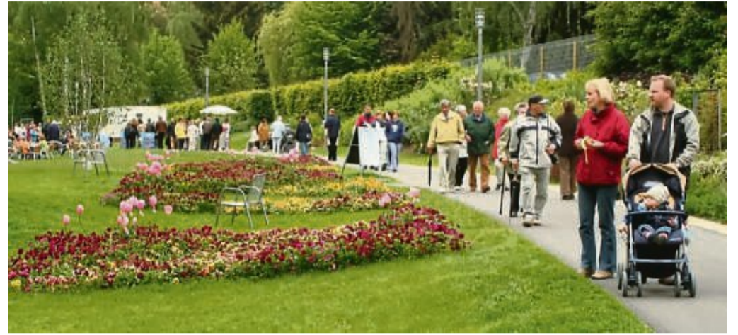
Ein „Urbaner Waldgarten“ soll das ehemalige Gartenschaugelände in Bad Wildungen neu beleben. Hier eine Aufnahme von der Veranstaltung 2006.

Zu acht Handlungsfeldern wurden insgesamt 40 Maßnahmen entwickelt, die jeweils eine Vielzahl von Teilmaßnahmen aufweisen. Unter anderem wird auf eine klimafreundliche Energieversorgung, eine nachhaltige