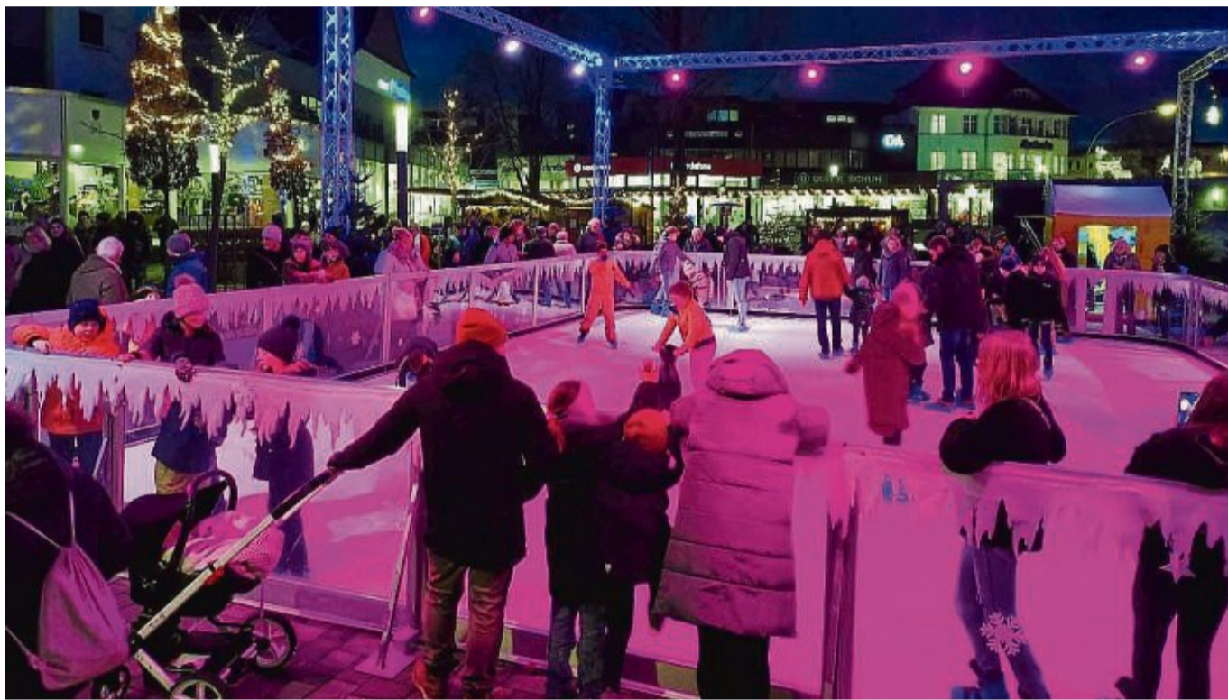
Wieder dabei: Die Eisbahn beim Weihnachtsmarkt auf dem Parkplatz an der Kalkmauer.

Ob Hobby-Musiker oder Klavier-Profi – alle Besucher sind eingeladen, die Atmosphäre musikalisch mitzugestalten. Den Auftakt macht am 7. Dezember die Musikschule Korbach (13 bis 16.30 Uhr). An allen anderen Tagen