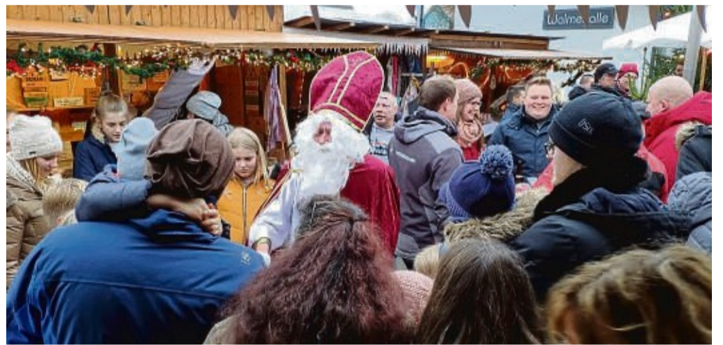
Der Nikolaus wird auch in diesem Jahr wieder zum Weihnachtsmarkt in Meininghausen kommen.