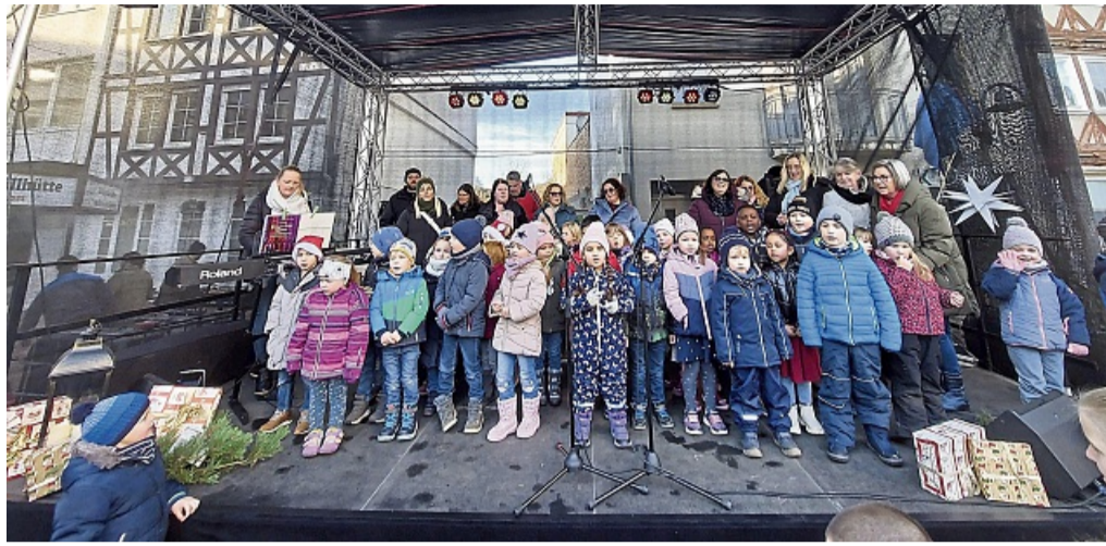
Kupferstädter Adventsmarkt: Alle sechs Sontraer Kindertagesstätten sangen gemeinsam auf der Bühne

schulden vom Neujahrsempfang, wo Bürgermeister Eckhardt gegen den Hänselmeister Kohl beim Darten gewonnen hatte, brachte die Adventsmarktbesucher zum Schmunzeln, als der Hänselmeister in einem Pinguin-Kostüm die Bühne betrat.