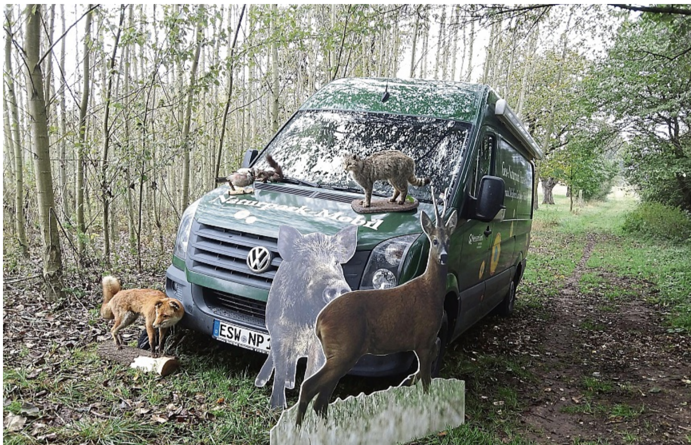
Das Naturpark-Mobil ist eine Erfolgsgeschichte: Nach diesem Vorbild werden auch von den Naturparks Habichtswald und Diemelsee Naturparkmobile betrieben.

In jedem Jahr nehmen mehr als 5000 Kinder an den Veranstaltungen des Geo-Naturparks teil. Bereits seit dem Jahr 2009 besucht das Naturpark-Mobil mit stetig steigenden Teilnehmerzahlen Schulen und Kindergärten im Frau-Holle-Land. Ziel der mobilen Umweltbildung ist es, Kinder durch praktisches Erleben für Natur und Umwelt zu begeistern und zu zukunftsfähigem und damit nachhaltigem Denken und Handeln zu befähigen. Im Jahr 2024 betreuten acht speziell geschulte Ranger dabei 202 Umweltbildungseinsätze in den Grundschulen und Kindergärten im Werra-Meißner-Kreis.