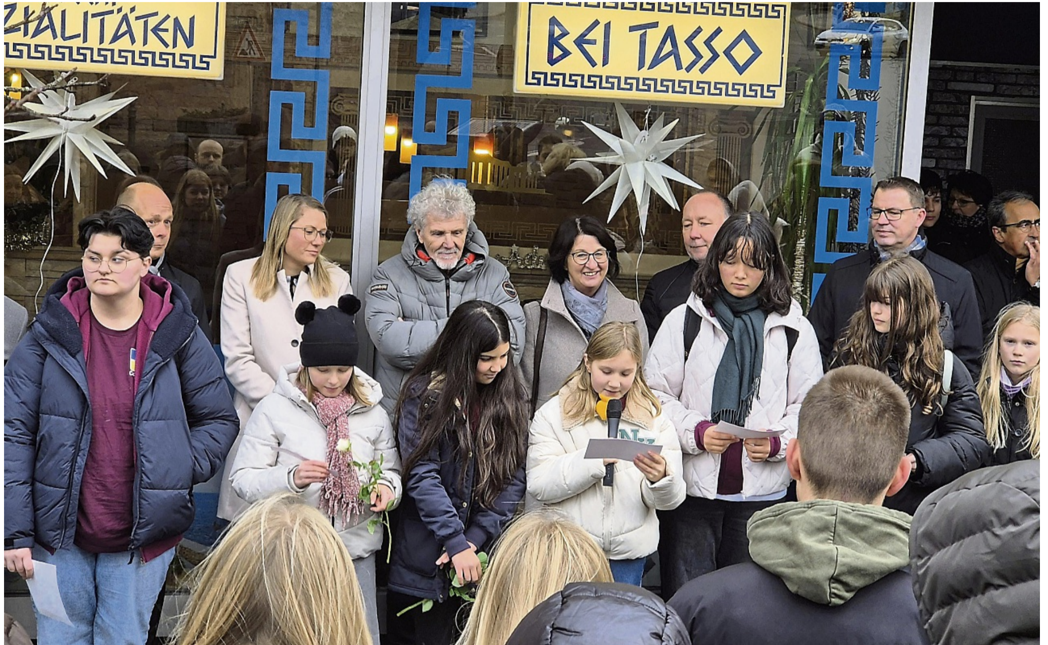
Schüler der Brüder-Grimm-Schule verlesen die Geschichte der Familie Katzenstein, die bis 1938 am Schlossplatz 6 lebte.

Sparkasse lässt Stolpersteine für schikanierte jüdische Kunden verlegen