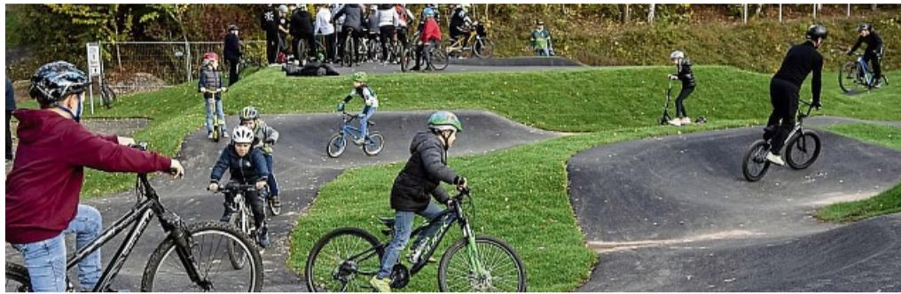
Jede Stimme zählt: Sontra bewirbt sich für Tourismuspreis der GrimmHeimat NordHessen.