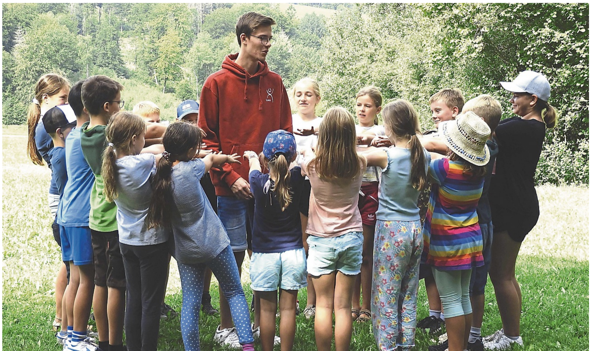
Engagement und Einsatzbereitschaft werden für den Einsatz als Freizeitbetreuer (hier mit einer Kindergruppe im Waldlabor) vorausgesetzt – die neue Ausbildungsreihe startet in Kürze.

Die Jugendförderung Werra-Meißner-Kreis erweitert ihr Angebot der Betreuerausbildung.