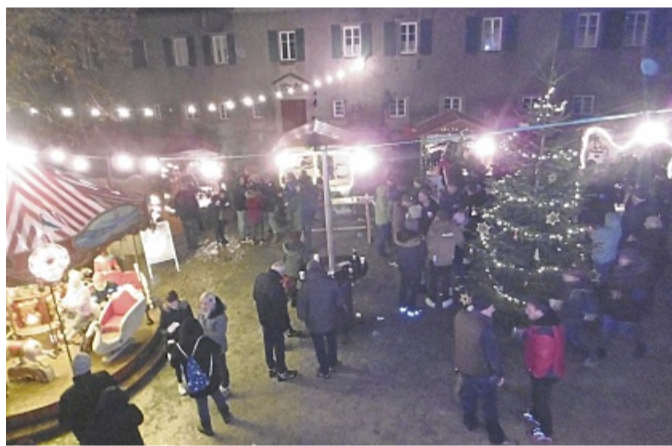
16. Weihnachtsmarkt in Wichmannshausen auf dem Schlosshof