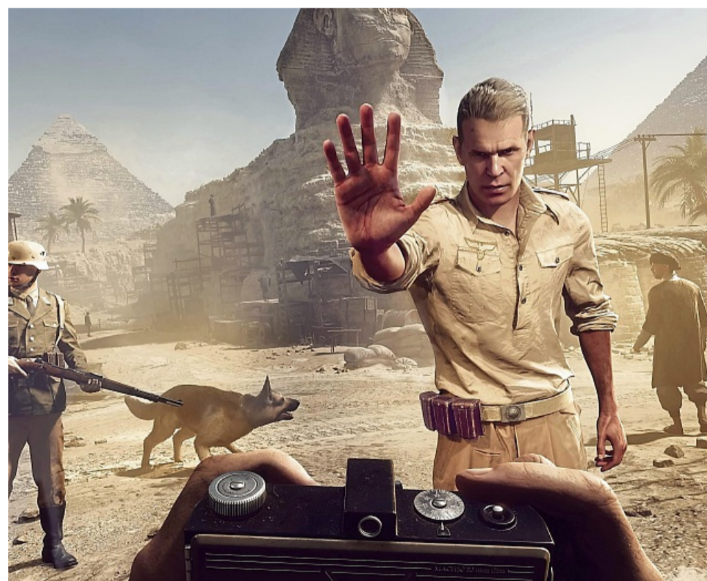
Halt, Fotoverbot! - Das ist misslich, denn Indy holt oft seine Kamera aus der Tasche, um Hinweise zu dokumentieren.

Einmal eine Art Schachspiel lösen, ein anderes Mal Schalter in einer bestimmten Reihenfolge aktivieren. Das kann schon mal knifflig werden, endet aber