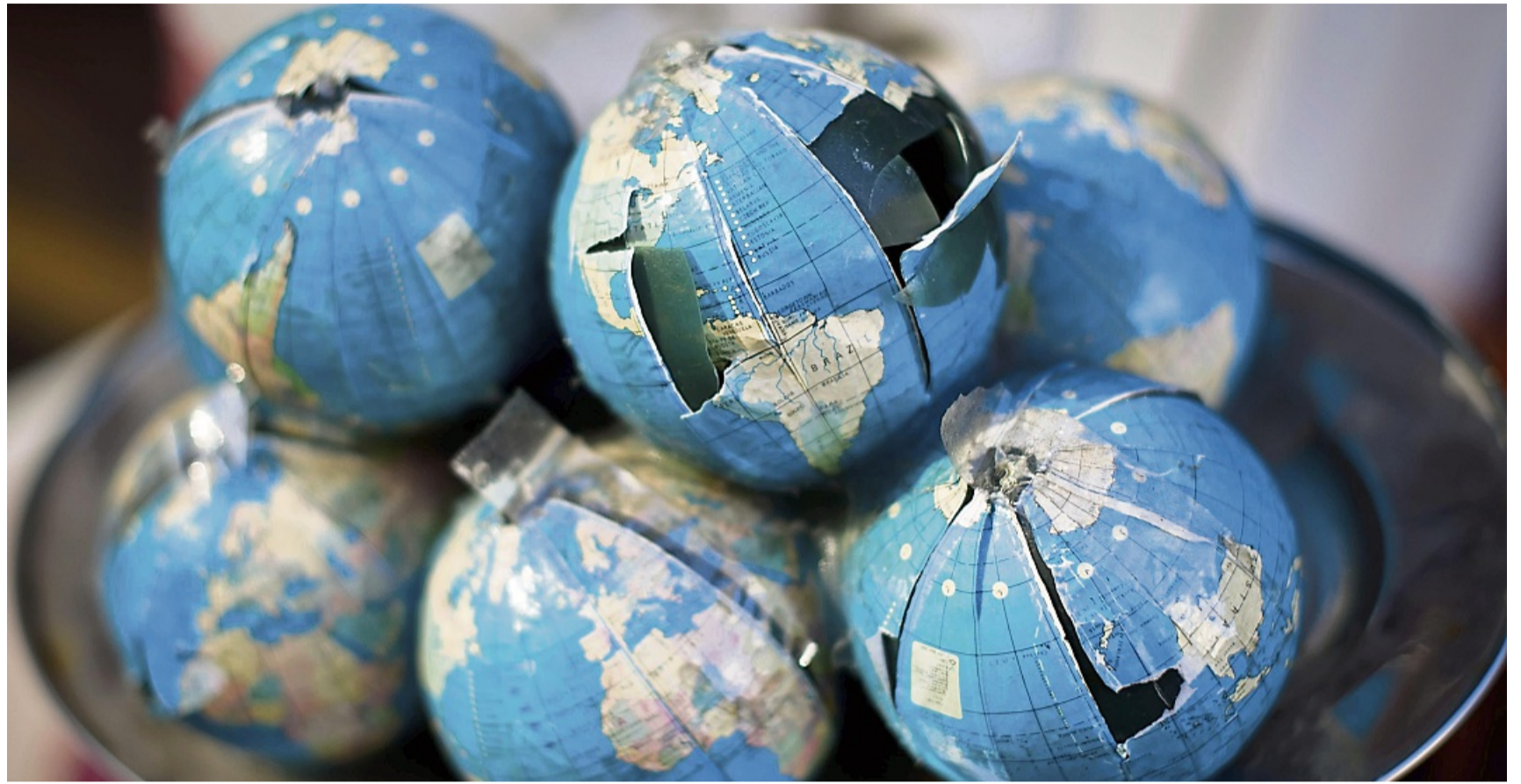
Wenn Urlaubsträume kurzfristig platzen, können Reiserücktrittversicherungen den finanziellen Schaden mindern.

Vorn lagen die beiden Anbieter Europ Assistance und TravelSecure von Würzburger. In den vier Kategorien (Verträge für eine Reise für Einzelpersonen bzw. Familien und Jahresverträge für Einzelpersonen bzw. Familien) erzielten deren jeweilige Tarife Bestnoten - sie versichern laut „Finanztest“ viele Ereignisse, sind verständlich und liegen preislich im Mittelfeld. Kostenbeispiel: Ein sehr gut benoteter Familientarif mit Mitreisenden bis maxi-