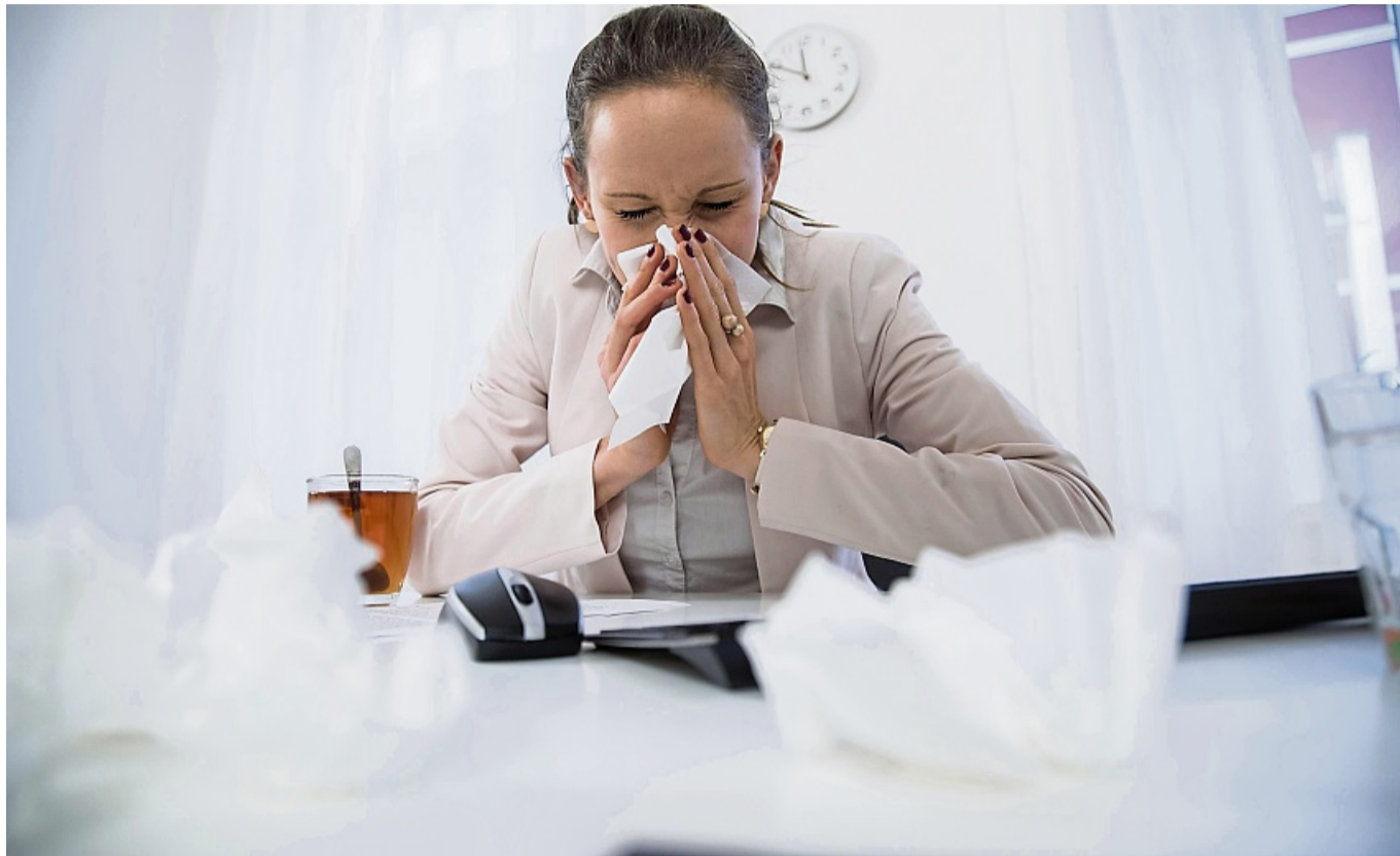
Husten, Schnupfen, Heiserkeit: So mancher Arbeitnehmer fragt sich dann, ob eine Krankmeldung nun gerechtfertigt ist oder nicht.

Es gebe Menschen, die mit einer Erkältung im Bett liegen müssen - und andere, die stolz darauf sind, in ihrer Dienstzeit auf kaum Fehltag zu kommen. Hirmke mahnt: «Letzteres wiederum ist klassischer Präsentismus. Wenn Beschäftig-