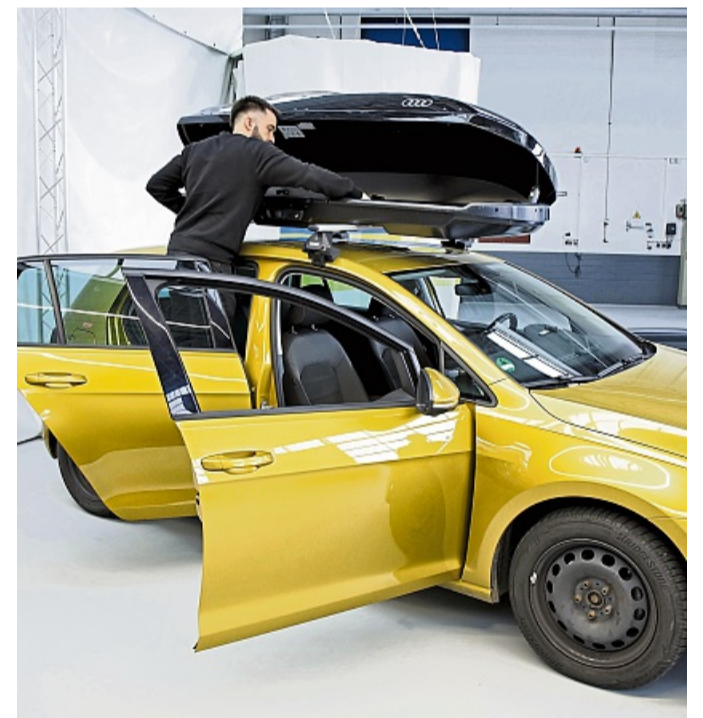
Laut ADAC-Test sind 8 von 13 getesteten Dachboxen „gut“. Und: Herstellerboxen sind nicht automatisch besser.