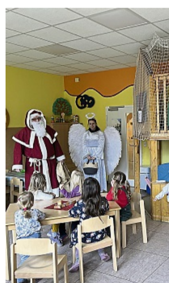
In der Spiel- und Lernschule Rabennest in Berneburg freuten sich die Kinder über den Besuch am Nikolaustag STADT SONTRA

„Ja, wir wissen, dass man im Allgemeinen sehr wenig dar-