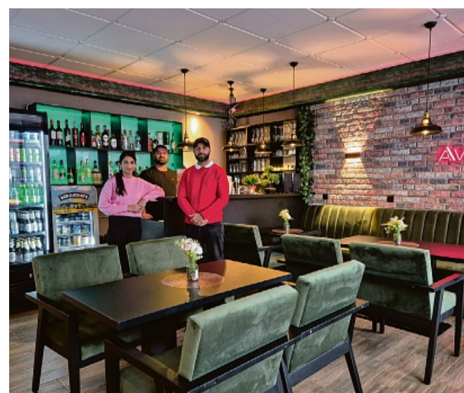
Familie Singh freut sich auf Ihren Besuch.