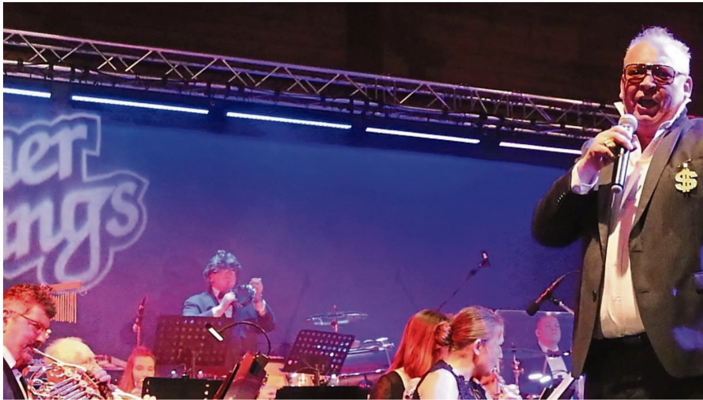
Voller Überraschungen stecken die Konzerte der Ulfener Jungs. Bei den Neujahrskonzerten im Januar erwartete das Publikum „Just a Gigolo“.