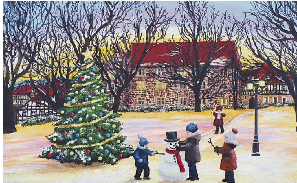
Adventskalender für 2024 des Lions Club Eschwege-Werratal Winter im Schlosspark Bild von Corinne Iffert aus Röhrda PRIVAT