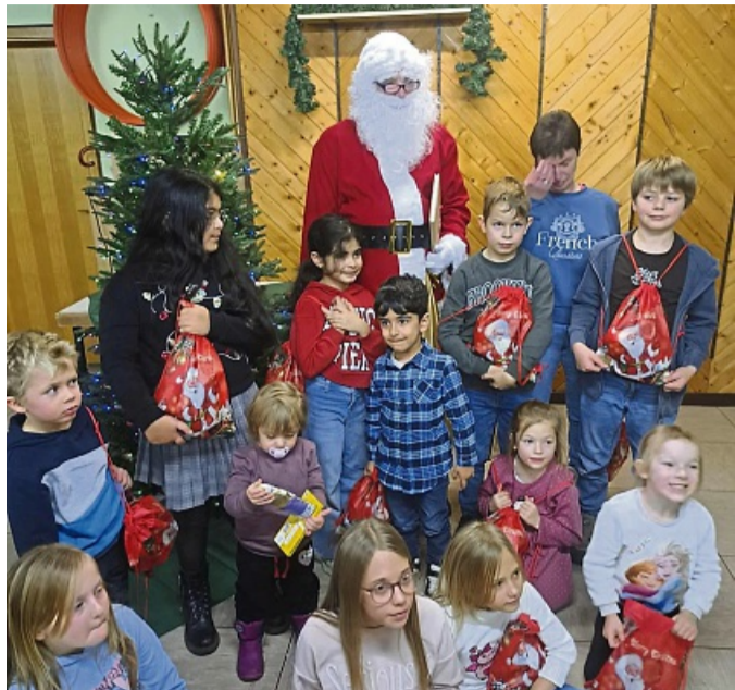
Tolle Überraschung für die Kinder: Der Nikolaus kommt zu Besuch. SV MITTERODE

Mitterode – In der Adventszeit ist es für den Schützenverein Mitterode eine Freude eine Nikolausfeier für seine Mitglieder, die Kleinsten und ihrer Eltern auszurichten. Diese fand im Jugendraum von Mitterode statt, der liebevoll, weihnachtlich geschmückt war. Der Vorstand war von der großen Resonanz beeindruckt. Selbst der weiteste Weg wurde nicht gescheut. Leider fiel der geplante Lampenumzug wegen starkem Regen aus. Was aber der fröhlichen Stimmung keinen Abbruch tat. Dann erschien zur Freude der Kinder der Nikolaus. Dieser las, der gebannten Kinderschar, eine Kindergeschichte aus seinem goldenen Buch vor. An-