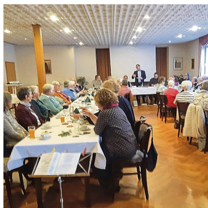
AWO Ortsverein Sontra feierte stimmungsvolle Weihnachtsfeier.

Nach dem gemütlichen Kaffeetrinken mit Gelegenheit zum Austausch und der Vorstellung des neuen Verbandsreferenten des AWO Kreisverbandes Werra-Meißner, Felix Gö-