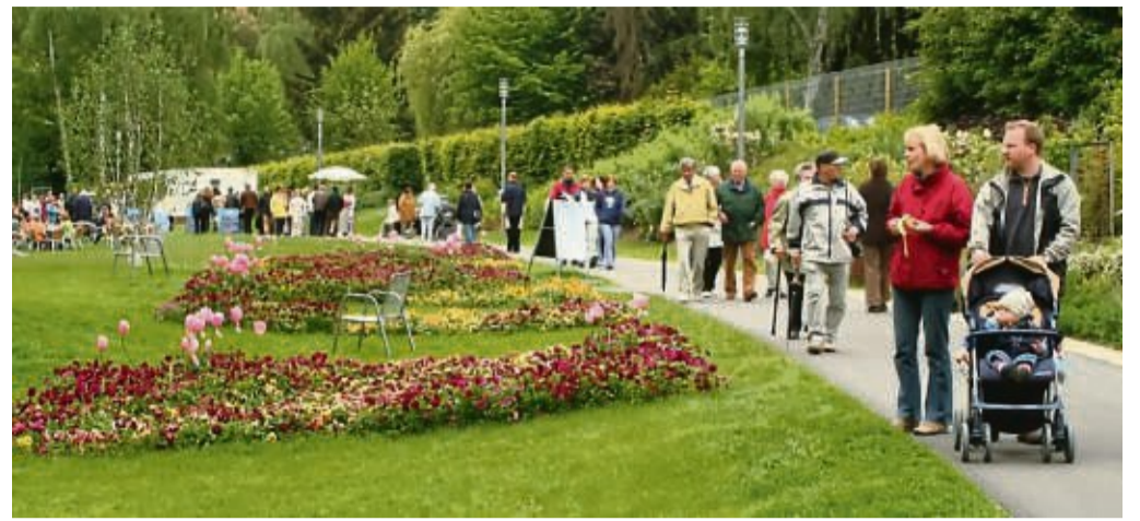
Ein „Urbaner Waldgarten“ soll das ehemalige Gartenschaugelände in Bad Wildungen neu beleben. Hier eine Aufnahme von der Veranstaltung 2006.

Zu acht Handlungsfeldern wurden insgesamt 40 Maßnahmen entwickelt, die jeweils eine Vielzahl von Teilmaßnahmen aufweisen. Unter anderem wird auf eine klimafreundliche Energieversorgung, eine nachhaltige