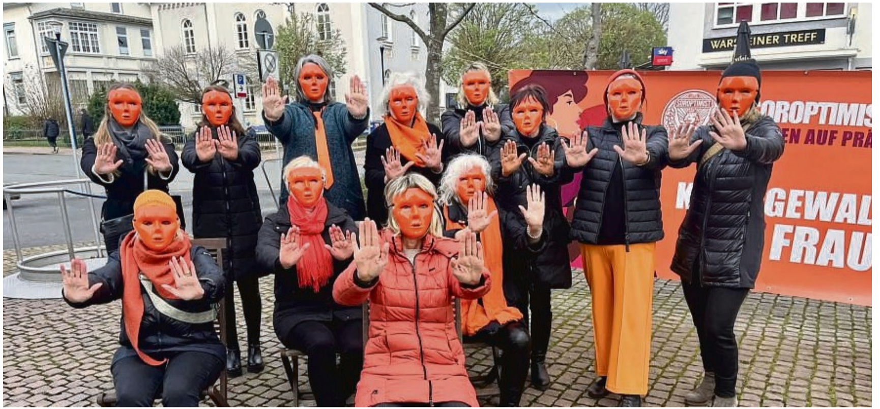
Stopp – keine Gewalt: Am internationalen Tag zur Beseitigung von Gewalt gegen Frauen lockte ein stummer Protest der Bad Wildunger Soroptimistinnen am Kurschattenbrunnen zahlreiche Passanten an. Eine weitere Protestaktion im Zeichen der „Orange Days“ findet am Donnerstag von 15 bis 17 Uhr statt.