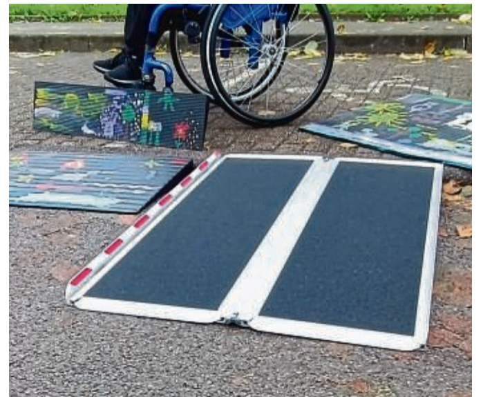
Um die Barrierefreiheit in Waldeck-Frankenberg noch weiter zu stärken, verleiht der Landkreis Rampen.