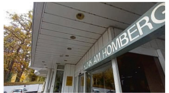
Schließt im zweiten Quartal 2025 auf: die Wicker-Klinik am Homberg.