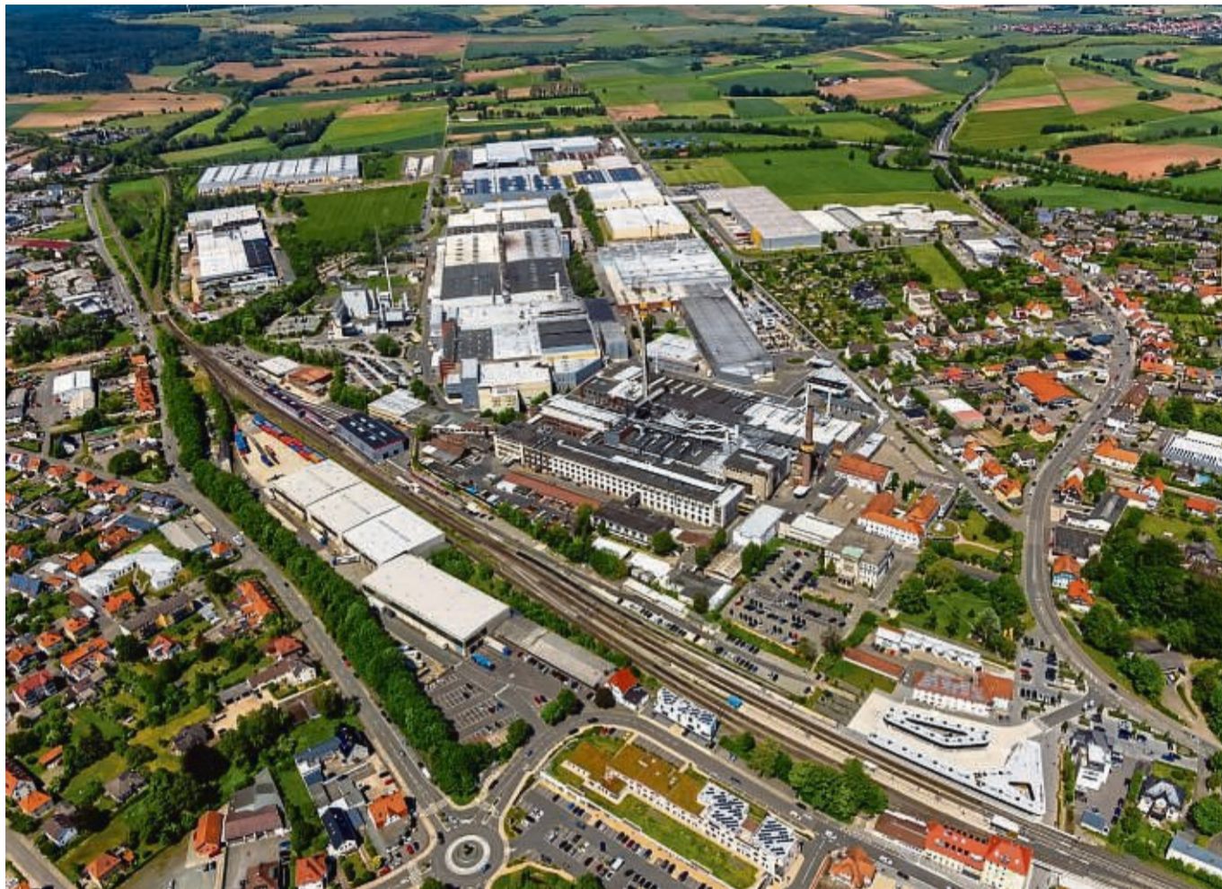
Continental-Standort Korbach: Aktuell sind nach Angaben des Unternehmens hier mehr als 3600 Mitarbeitern beschäftigt.