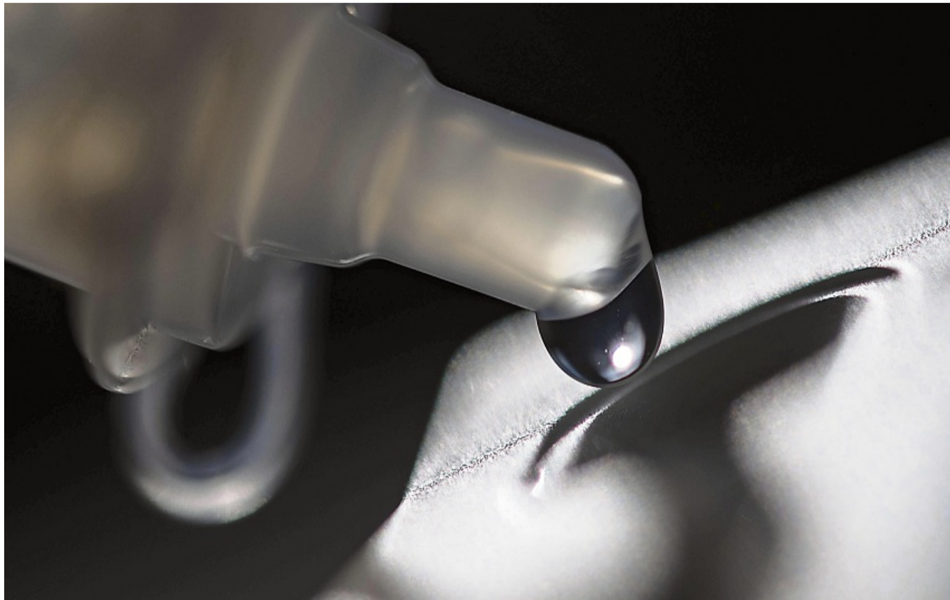
Kombi-Selbsttests auf Corona, Influenza und RSV sind besonders für Risikopatienten nützlich, da sie schnelle Behandlungsentcheidungen ermöglichen.