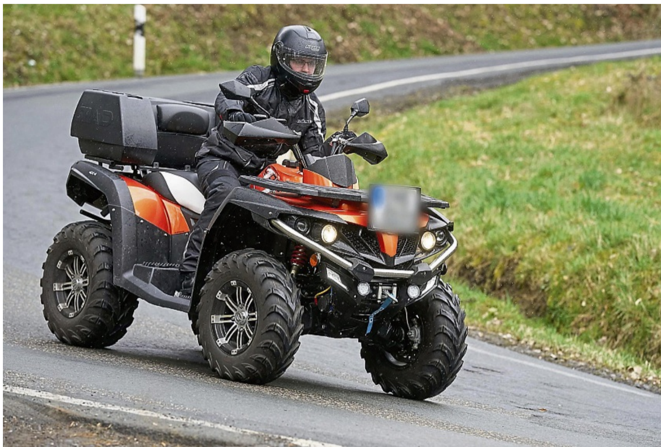
In Dransfeld sind mehrere Quads gestohlen worden. (Symbolbild)

Als neueste Fälle teilten die Ermittler zwei Diebstähle aus der Dransfelder Kleingartenanlage in der Flüte mit. Dort verwendeten Unbekannte nach Angaben des Anzeigenerstatters zwischen Montagabend, 25. November, und Mittwoch-