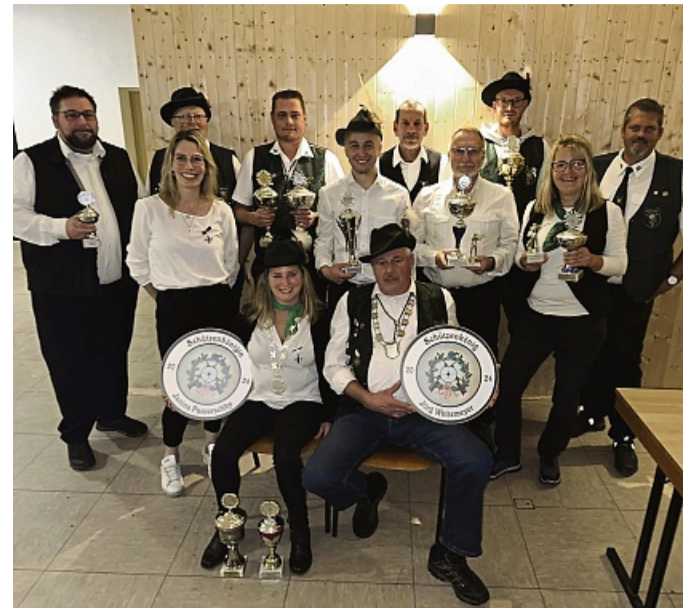
Das neue Königshaus des KKSVD Hedemünden.