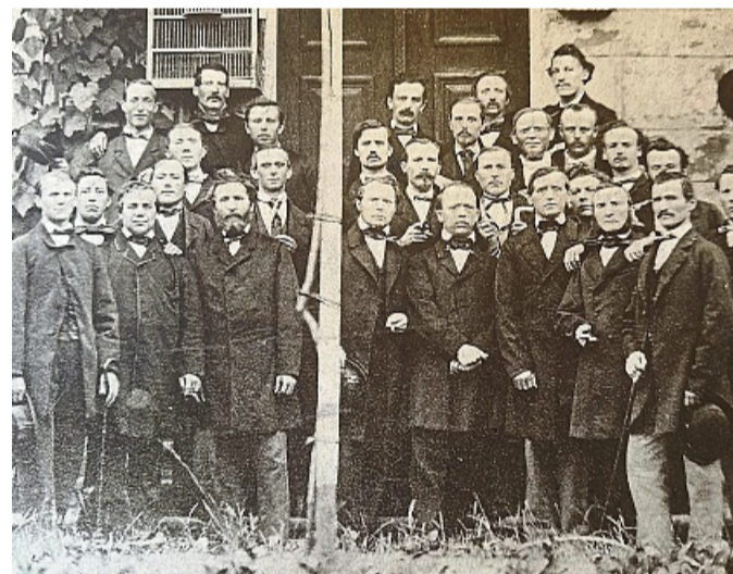
190 Jahre Liedertafel 1834 Witzenhausen , das Foto zeigt die Liedertafel im Jahre 1862.