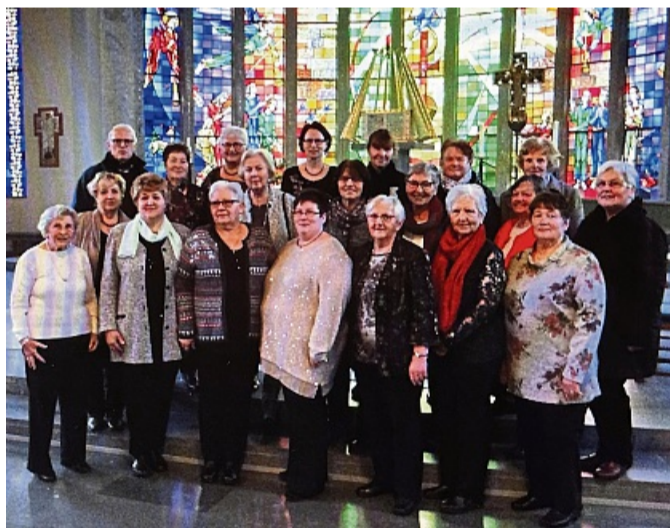
Die Mitglieder der Liedertafel auf einem aktuellen Foto.