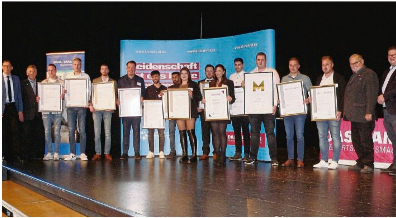
Es ist noch kein Meister vom Himmel gefallen: Aber diese 15 Frauen und Männer aus dem Kreisgebiet haben dafür hart gearbeitet.