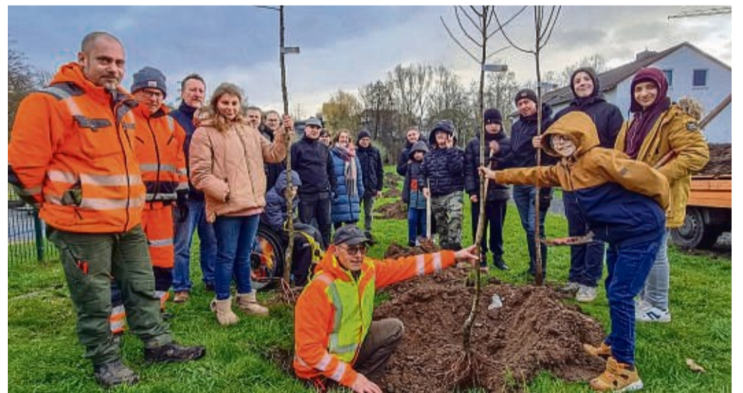
Gemeinsam angepackt: Schüler der August-Wilhelm-Mende-Schule, ihre Lehrer und Mitarbeiter der Stadt mit den ersten Bäumen der künftigen Allee am Postweg. Im Hintergrund sind die Löcher für weitere Bäume zu sehen, die der Bauhof mit einem Mini-Bagger bereits ausgehoben hat.

Entstanden ist die Idee bereits bei einer Apfel-Projektwoche der Schule im vergangenen Herbst. Weil die Schü-