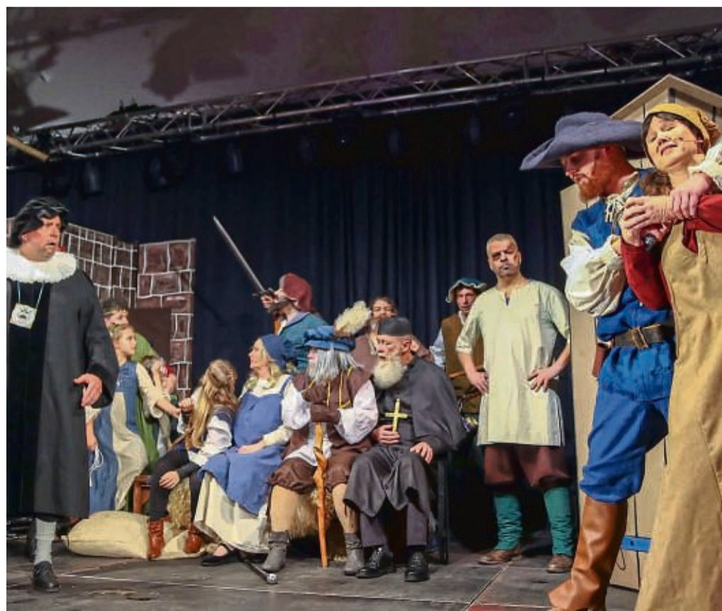
Starkes Ensemble: die Rotenburger Bornschisser verabschieden sich.