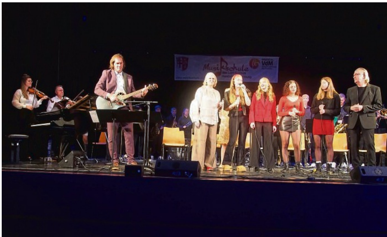
Musikschulkonzert in der Stadthalle: Zum Finale, in dem John Lenkons „Happy Xmas“ erklang, waren noch einmal fast alle Mitwirkenden auf der Bühne zu erleben.