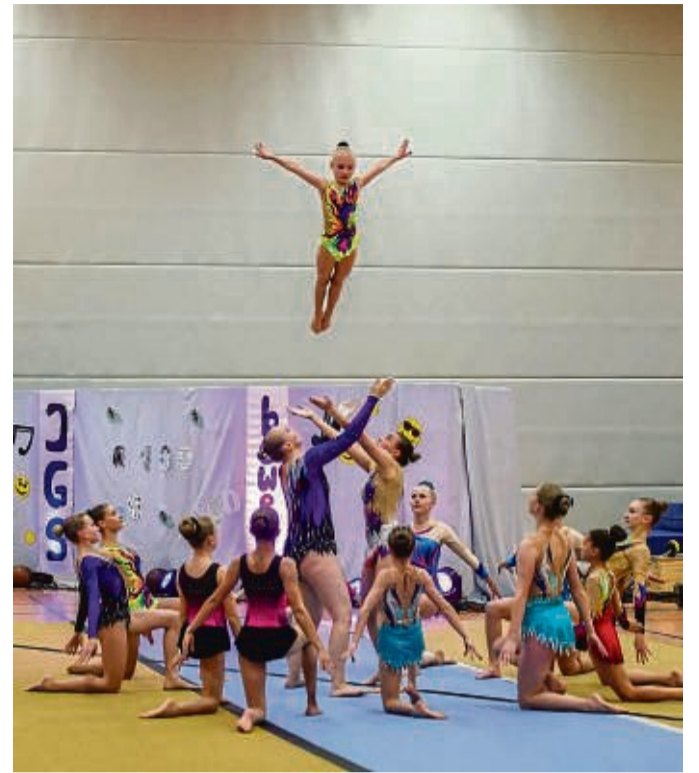
Hoch hinaus: Die Sportakrobaten der TG 08 Lispenhausen zeigten eine starke Leistung.