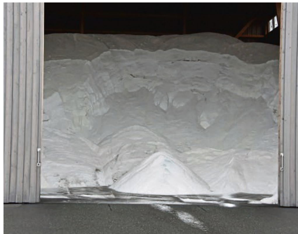
Der Winterdienst von Hessen Mobil ist startklar: Die Salzsilos und Lagerhallen sind gut gefüllt.

Um möglichst wenig Salz zu verbrauchen, nutzt Hessen Mobil eine computergesteuerte Streutechnik sowie hochwirksames Feuchtsalz, bei dem trockenes Auftausalz mit einer Salzlösung (Sole) angefeuchtet wird, teilt Hessen Mobil mit. Dieses sogenannte „FS 30“ (70 Prozent Auftausalz, 30 Prozent Sole) haften gut und erziele schon mit kleinen Mengen große Tauwirkung. In der Salzlösungsanlage der Straßenmeisterei Solms, die der Staatssekretär kürzlich besuchte, werde die