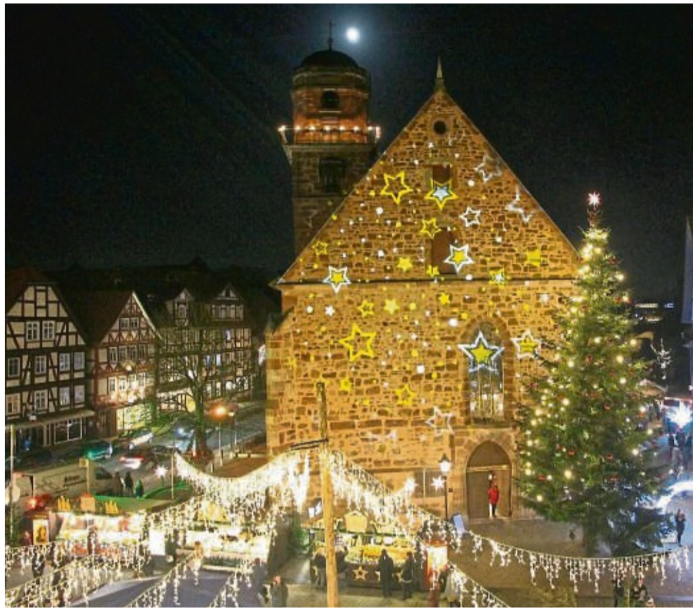
Der Rotenburger Weihnachtsmarkt, hier der Blick vom Rathaus aus.

Die „Weihnachtsgeschichte“ ist freitags ab 17.30 Uhr