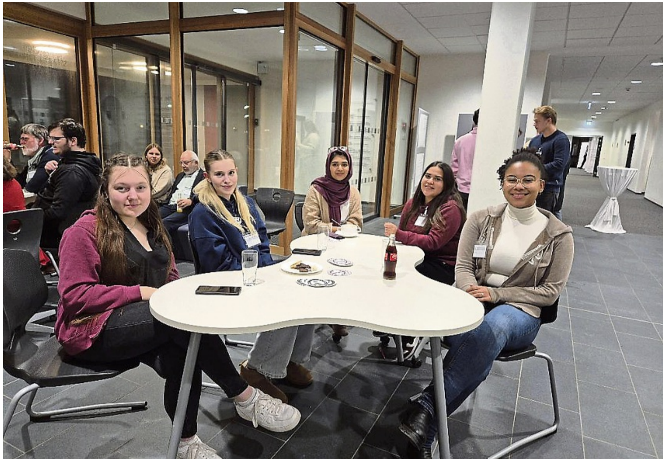
Im Foyer der Schule kamen die Schülerinnen und Schüler zu den Workshops zusammen. Rund 30 Teilnehmer waren bei der Kick-Off-Veranstaltung des Demokratieforums Waldeck-Frankenberg dabei.