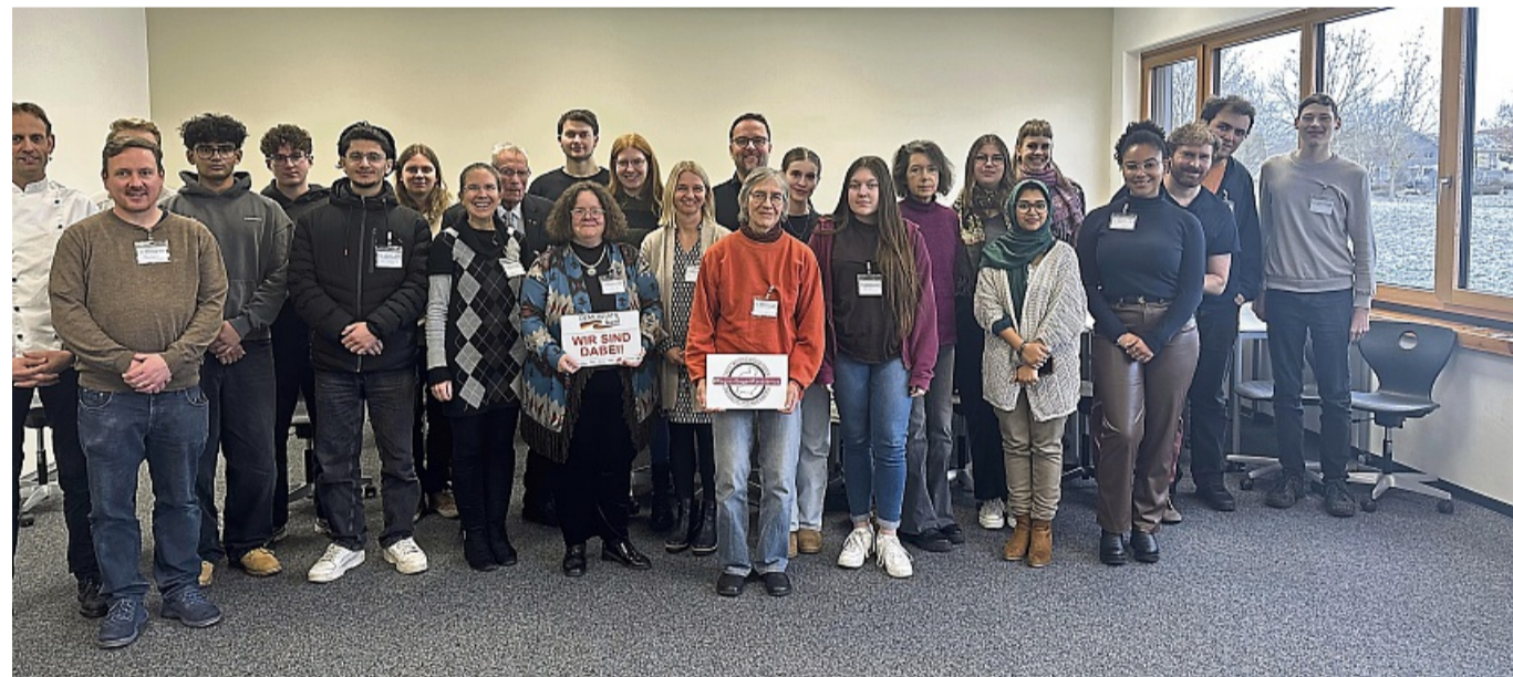
Gemeinsam viel erfahren: An der Kick-Off-Veranstaltung des Demokratieforums nahmen Schüler und Vertreter von Vereinen und Institutionen aus Waldeck-Frankenberg teil.