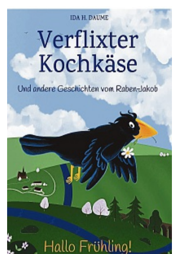
„Verflixter Kochkäse“: Das findet der Rabe Jakob.