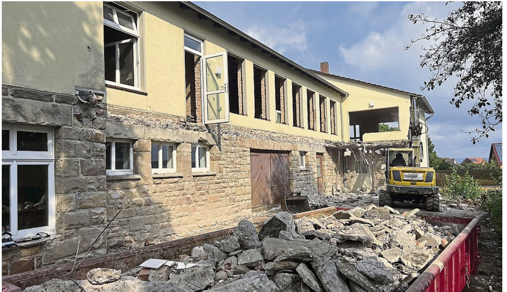
Der Rathausneubau in Diemelstadt wird teurer als geplant: Das Gemeinschaftshaus aus dem Jahr 1953 wurde entkernt. Dabei sind eine Reihe von baulichen Überraschungen zutage getreten.

All das habe zu Mehrkosten von rund 155 000 Euro bei den Abrissarbeiten und weiteren 155 000 Euro bei den Rohbauarbeiten geführt. Weitere Mehrkosten in der Größenordnung von 14 000 Euro seien entstanden, weil die Rathausmitarbeiter darum gebeten hätten,