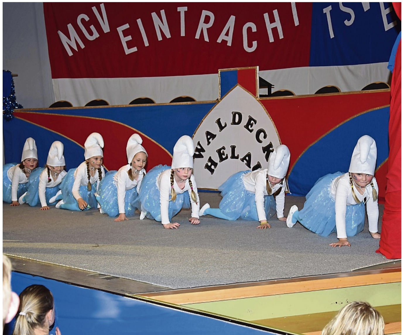
Parade der Schlümpfe beim Kinderkarneval in Waldeck. Er wird in dieser Session um zwei Wochen vorverlegt.