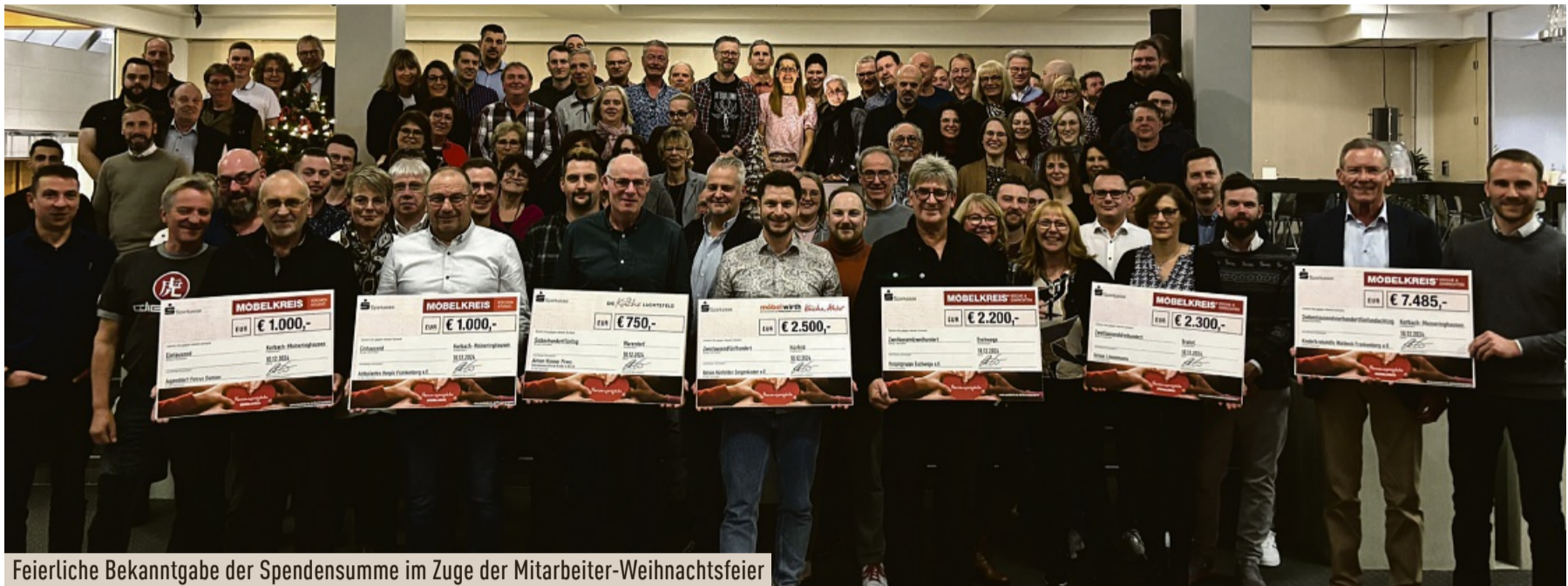
Feierliche Bekanntgabe der Spendensumme im Zuge der Mitarbeiter-Weihnachtsfeier

Möbelkreis setzt ein Zeichen gesellschaftlicher Verantwortung und regionaler Verbundenheit