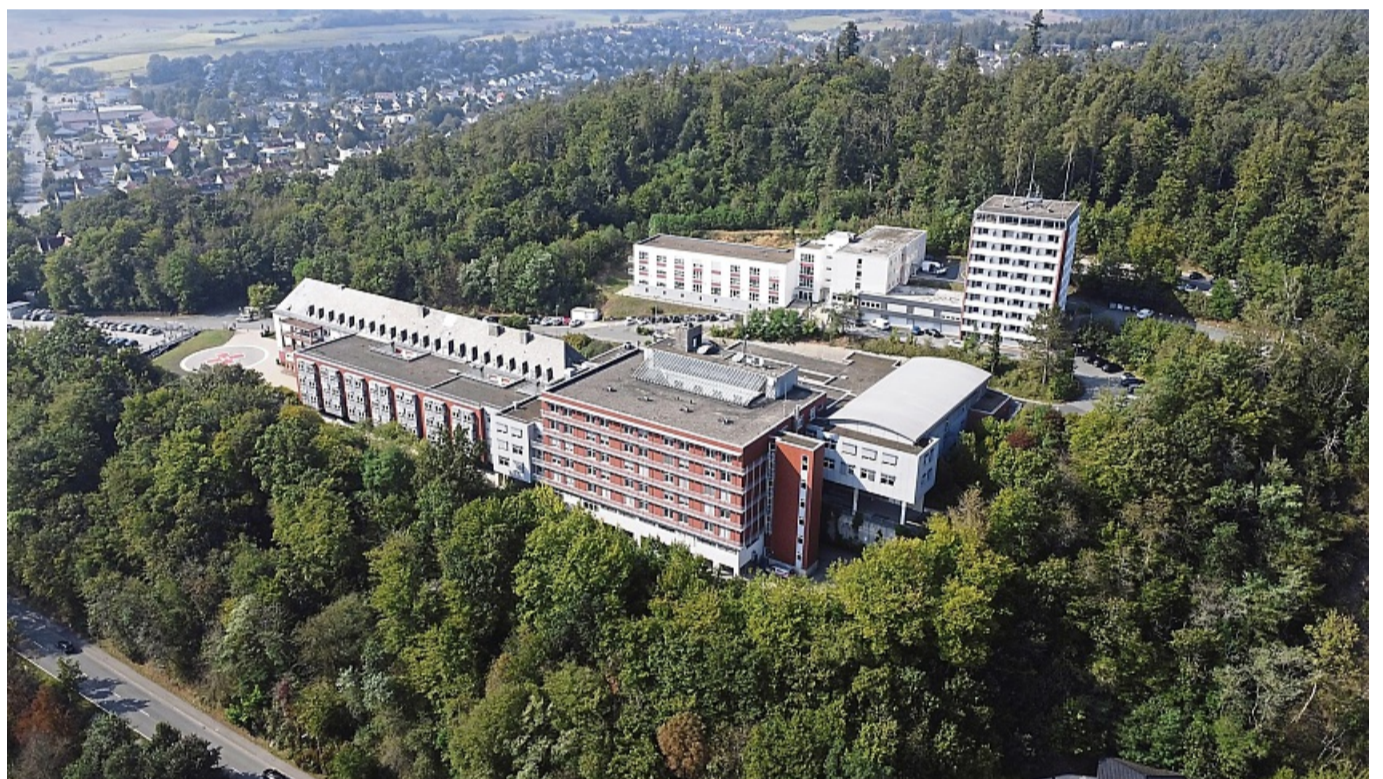
Der Zusammenschluss der beiden Krankenhäuser in Korbach (oben) und Frankenberg als eine Klinik mit zwei Standorten unter dem Dach des Landkreises wird in Waldeck-Frankenberg intensiv vorangetrieben.