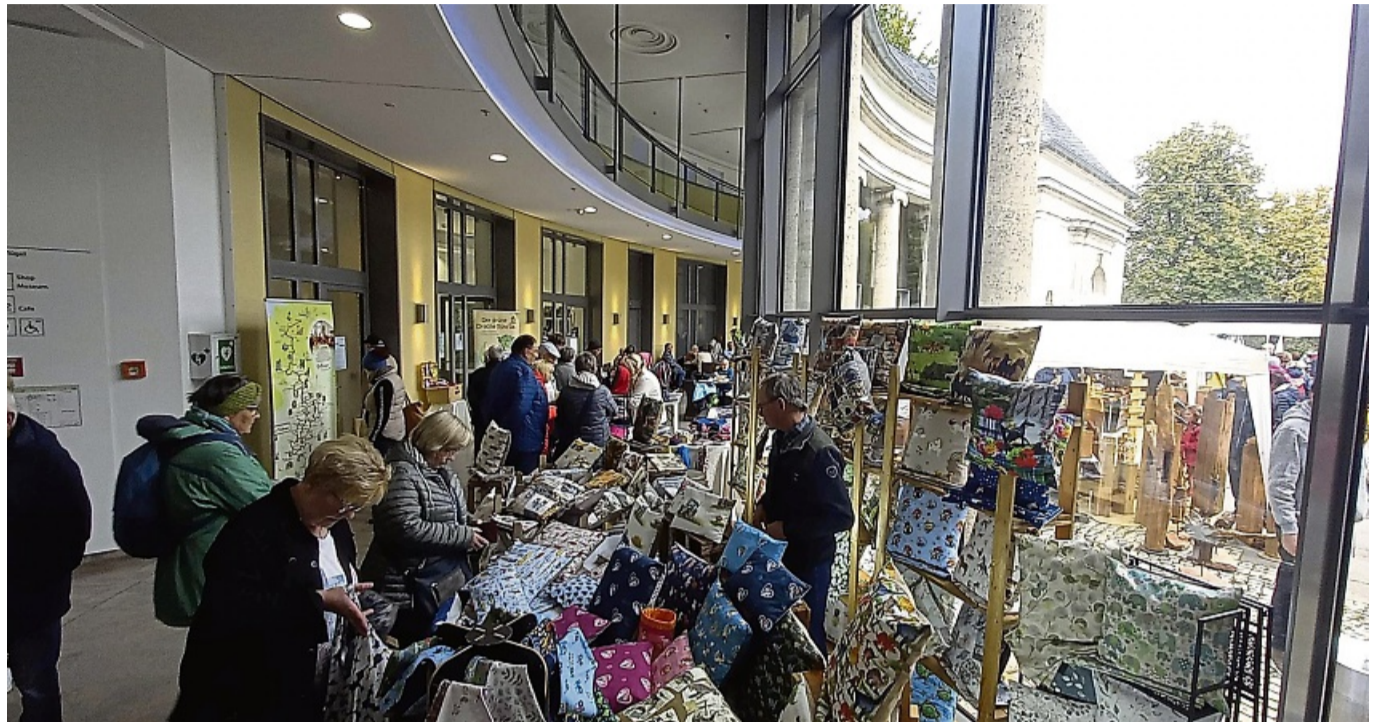
Die Ausgaben für Kur und Tourismus – hier die Direktvermarktermesse in und an der Wildunger Wandelhalle – fallen im Haushaltsrecht unter „freiwillige Leistungen“. Dort muss eine Kommune sparen, wenn Geld fehlt. Der Heilbäderverband fordert nun, dass diese Ausgaben im Interesse der Allgemeinheit zu Pflichtaufgaben erklärt werden.