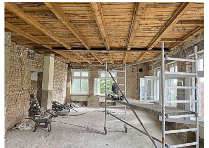
Rathausneubau in Diemelstadt: Das Gemeinschaftshaus aus dem Jahr 1953 wird entkernt, und dann zu einem modernen Rathaus mit PV-Anlage und Wärmepumpe umgebaut.