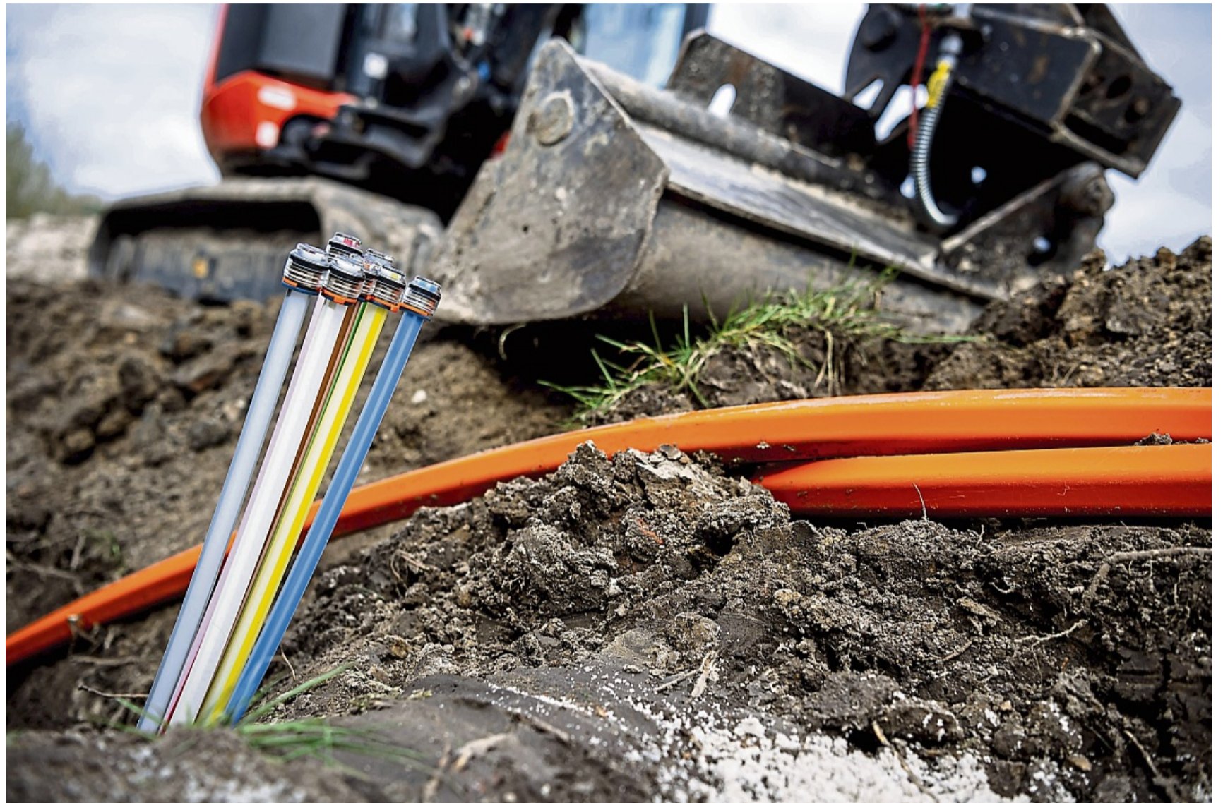
Der Glasfaserausbau über die Ortskerne hinaus soll in der Gemeinde Willingen im „Graue Flecken“-Programm erfolgen.

Die Gemeinde absolvierte bereits einen Branchendialog