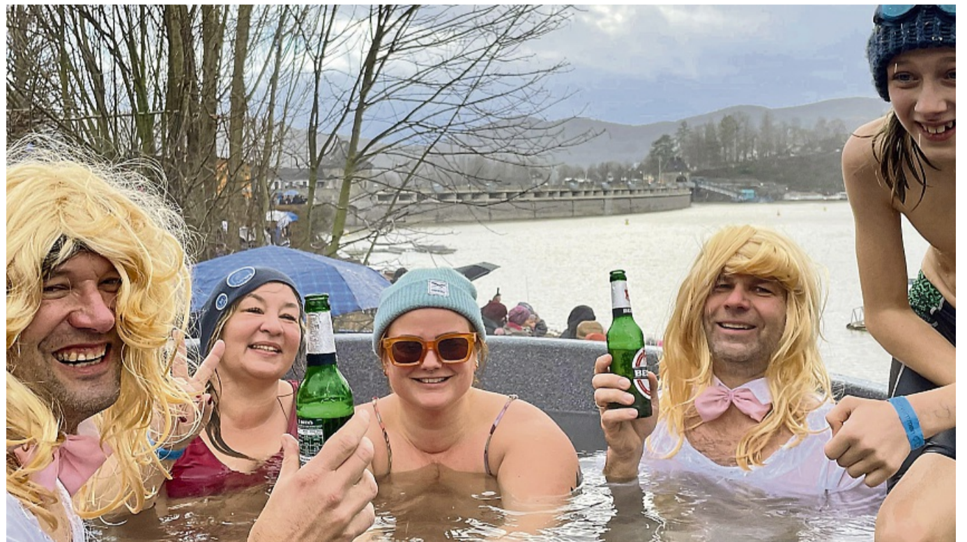
Große Gaudi: das Neujahrsschwimmen im Edersee.

Die Veranstaltung wird vom Bürgerverein Hemfurth-Edersee organisiert und ausgerich-