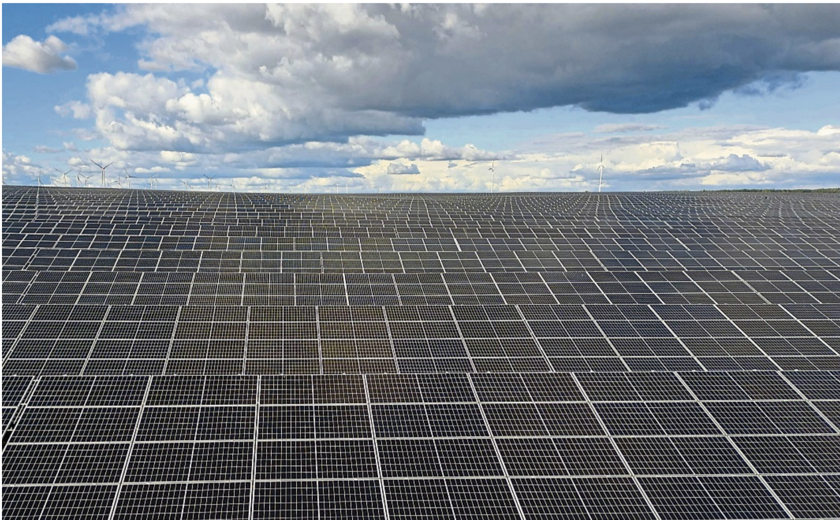
Solarfelder wohin man sieht. In Diemelstadt gibt es viele Investoren für Photovoltaik entlang der Autobahn A44.

Diemelstädter müssen sich mit Solarfeldern und Windparks arrangieren