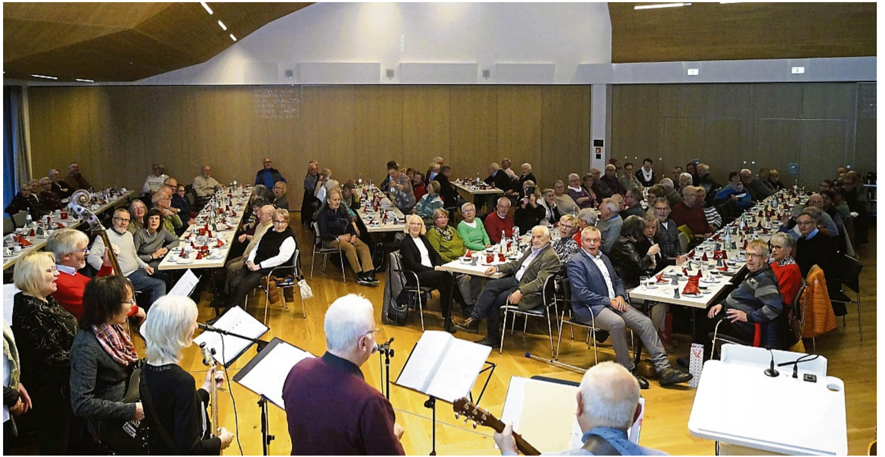
Großer Zuspruch zur Weihnachtsfeier vom Frankenerger VdK im Philipp-Soldan-Forum.