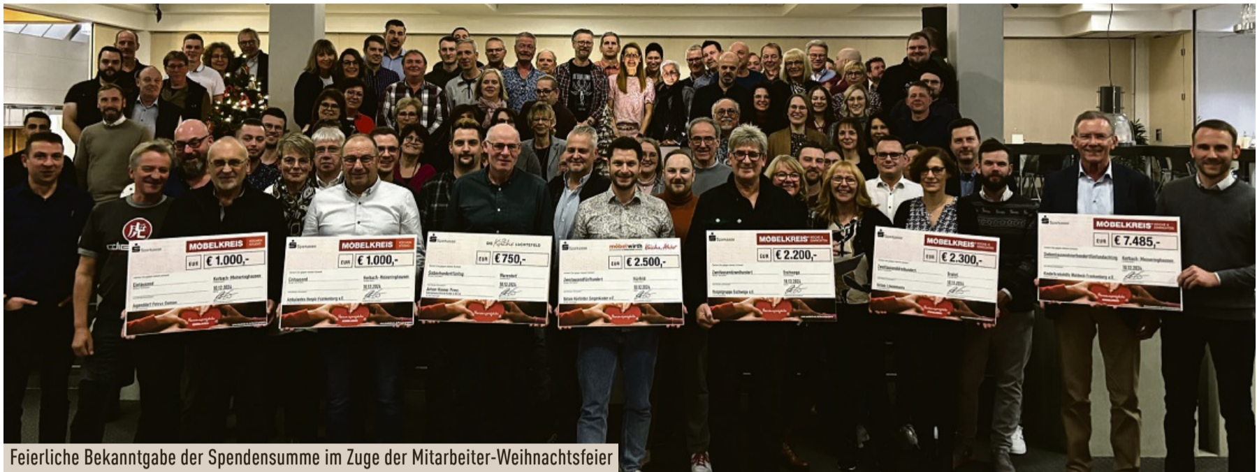
Feierliche Bekanntgabe der Spendensumme im Zuge der Mitarbeiter-Weihnachtsfeier

Möbelkreis setzt ein Zeichen gesellschaftlicher Verantwortung und regionaler Verbundenheit