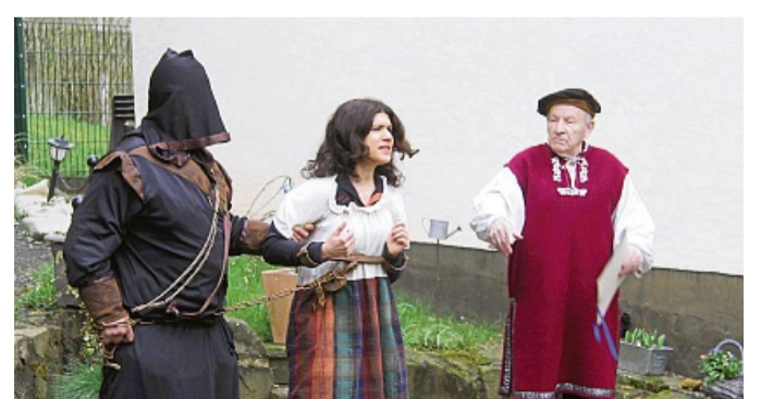
Historische Stadtführung: Eindrucksvolle Szenen der Frankenger Stadthistorie wird das Ensemble der Komödie Frankenberg. Das Bild zeigt einen Ausschnitt aus der Aufführung.

Aufführungstermine der historischen Stadtführungen sind: Samstag, 17. Mai (18.45 Uhr, Sonderaufführung); Freitag, 23. Mai (18.45 Uhr); Freitag, 27. Juni (19 Uhr); Sonntag, 17. August