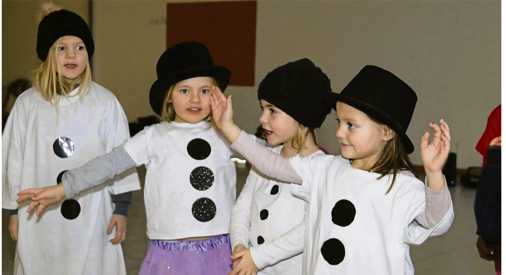
An den „kleinen Schneemann mit seinem schwarzen Hut“ erinnerten die Kita-Kinder bei ihrem vorweihnachtlichen Auftritt beim Seniorennachmittag.