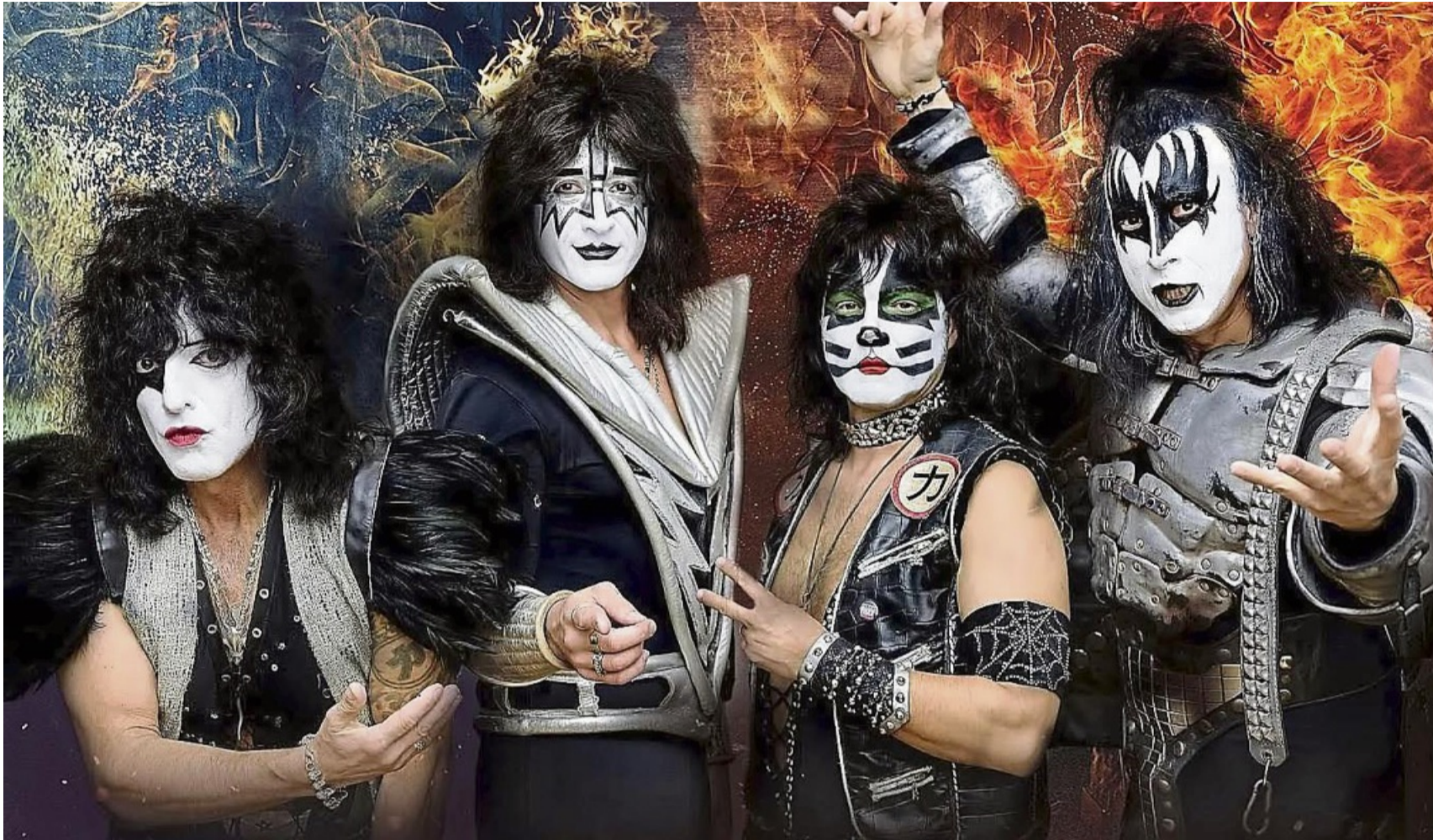
Kommt nach Battenberg: Die Coverband „Kiss forever“ aus Budapest.