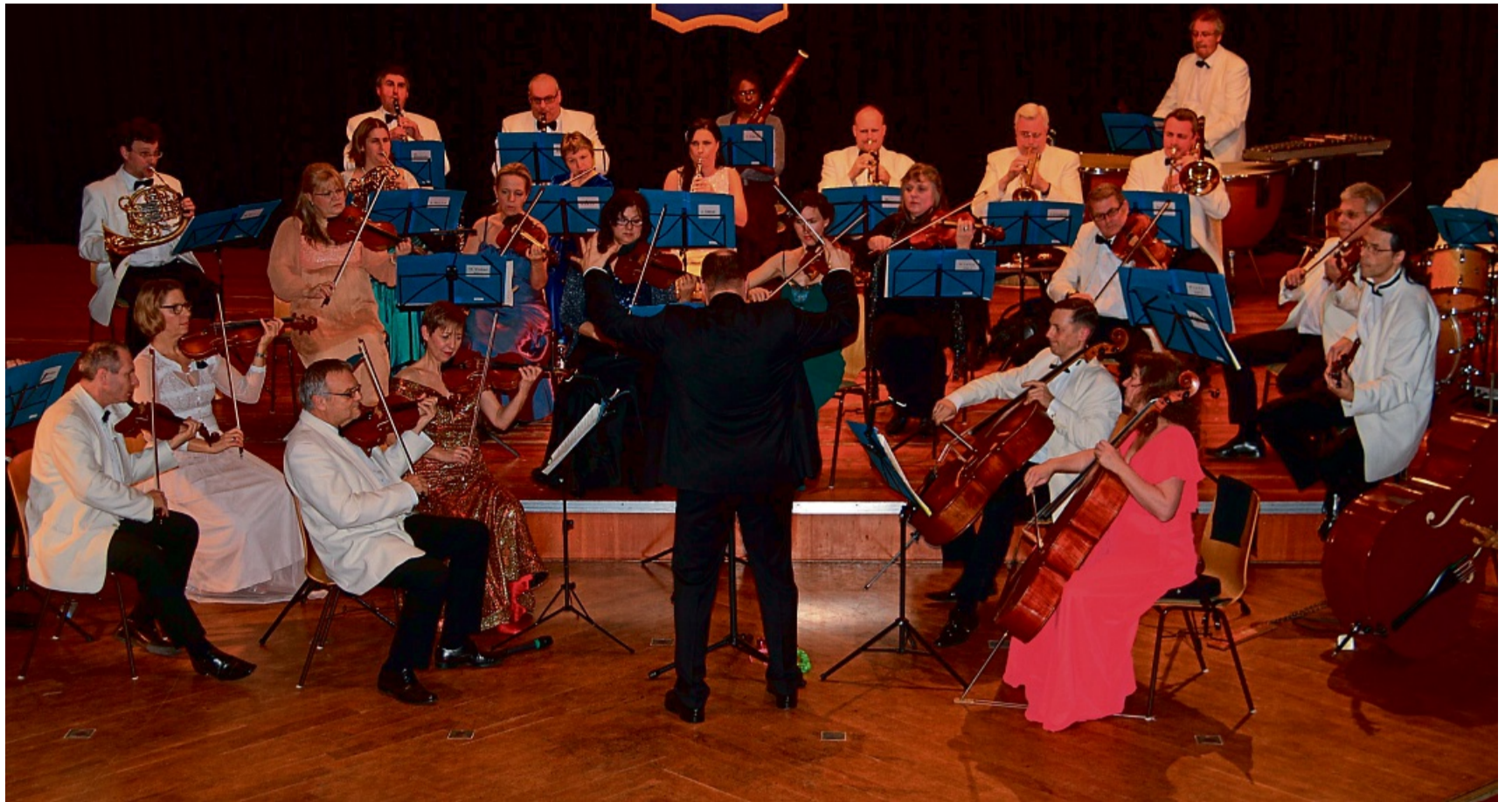
Johann-Strauß-Orchester Frankfurt: Zum Neujahrskonzert des Kiwanis-Clubs Ederbergland gastieren die Musiker zum 16. Mal in Frankenberg.