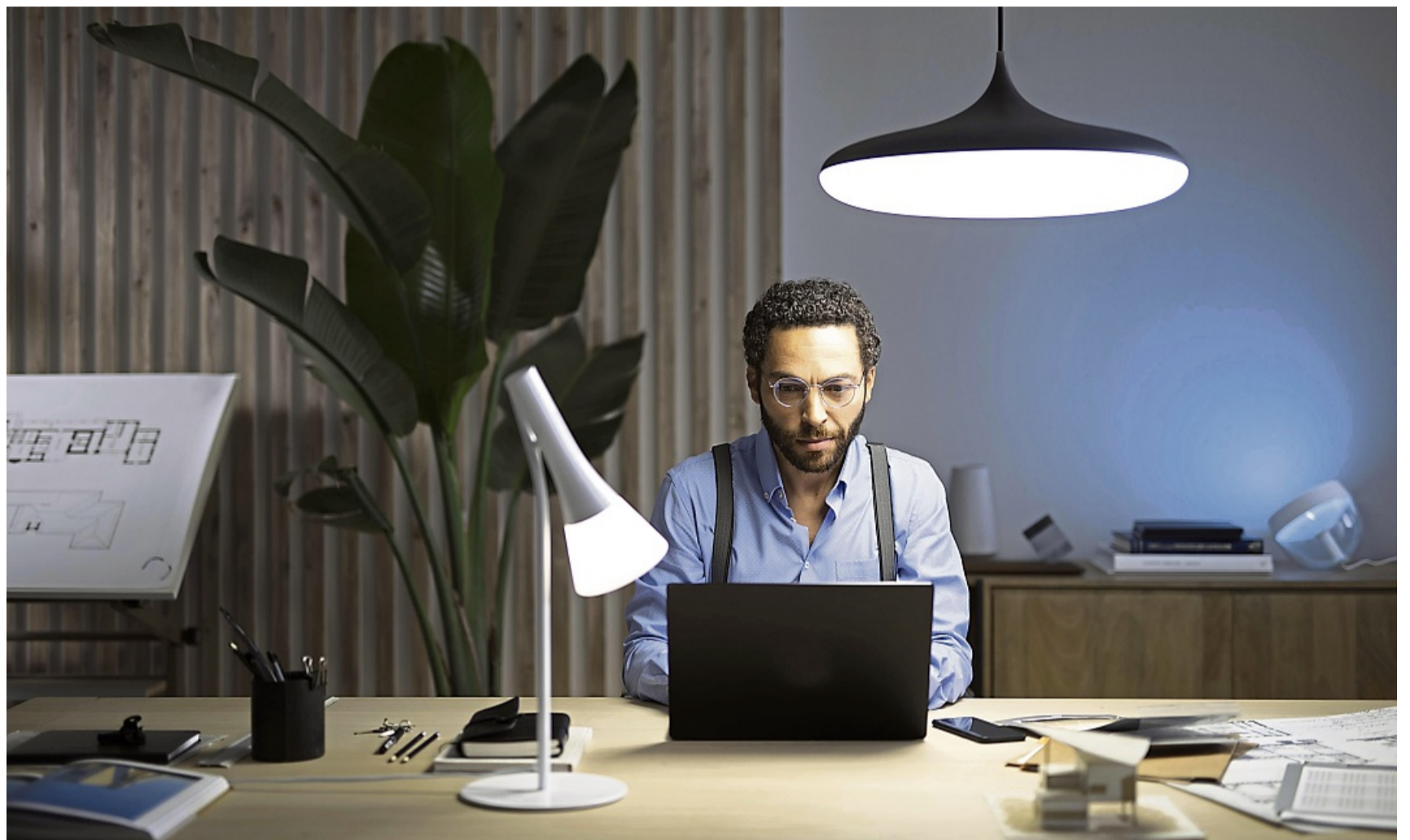
Konzentriert arbeiten: Lampen mit kühler Lichtfarbe fördern die Produktivität und schonen die Augen.