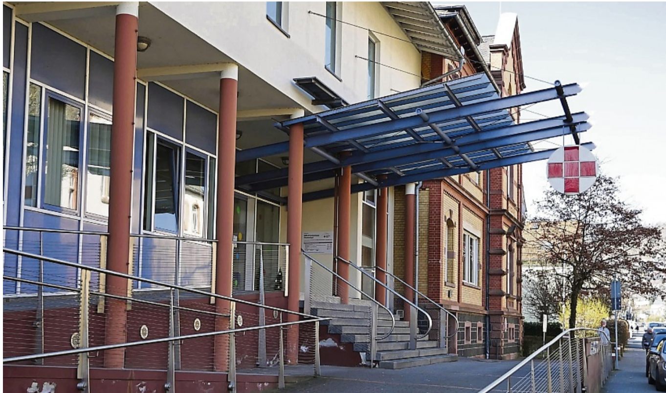
Neues Konzept: Der Landkreis Marburg-Biedenkopf will das insolvente DRK-Krankenhaus in Biedenkopf vorerst selbst betreiben. Es wird jedoch ein privater Träger gesucht.