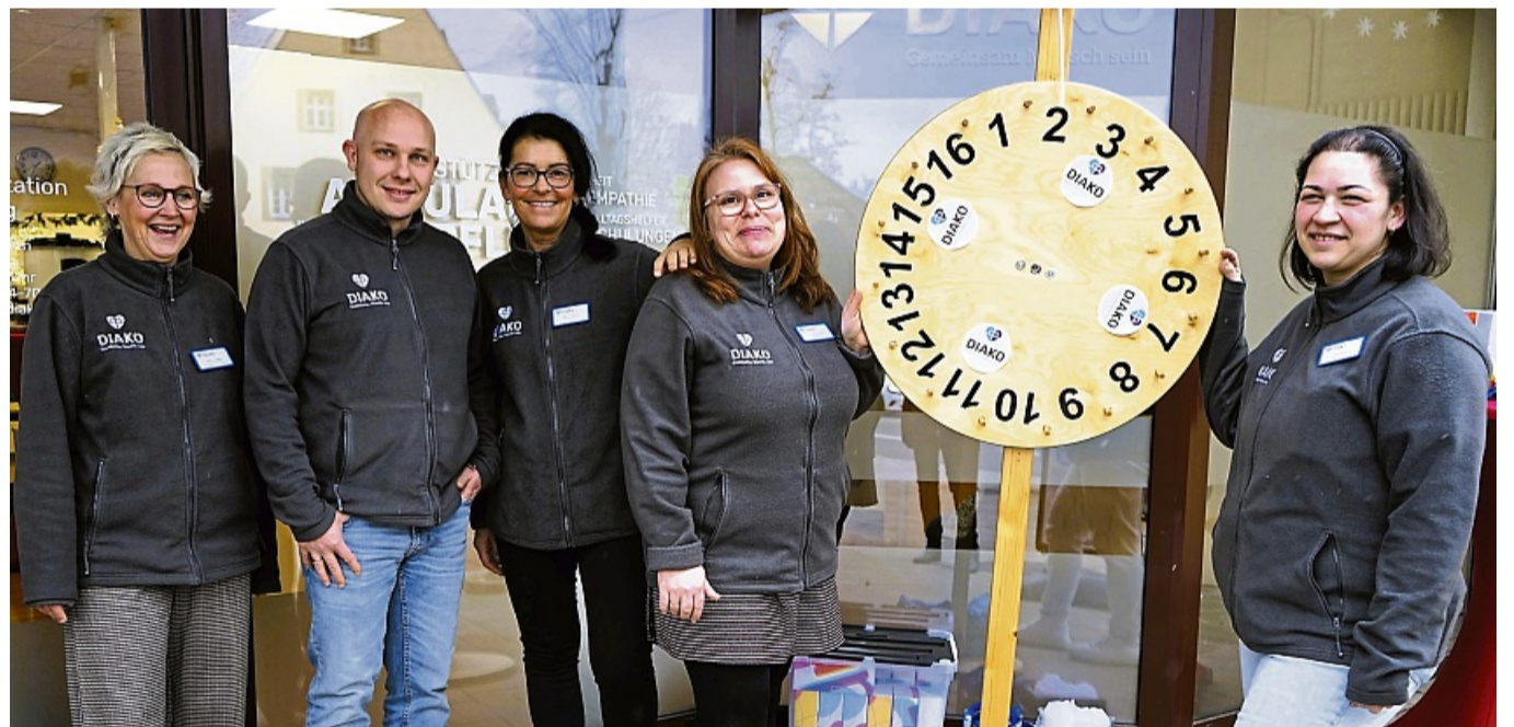
Die Diakonie-Sozialstation Frankenberg präsentierte sich beim Tag der offenen Tür.

Neben dem informativen Austausch standen vor allem