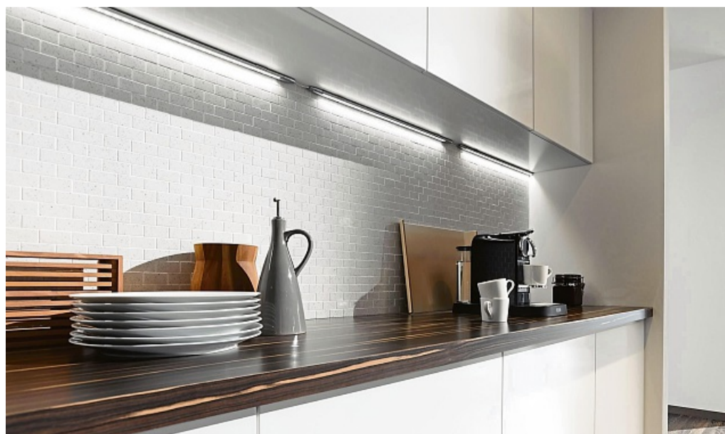
Helles Licht sorgt in der Küche für optimale Bedingungen – und damit für mehr Sicherheit auf den Arbeitsflächen.

Wichtig für das Badezimmer ist zudem: möglichst viele helle Oberflächen und wenig gerichtetes Licht, so Moosmann. Denn Spots und Co. werfen harte Schatten auf das Gesicht, betonen die Falten und machen das Schminken zu einer echten Herausforderung. tmn