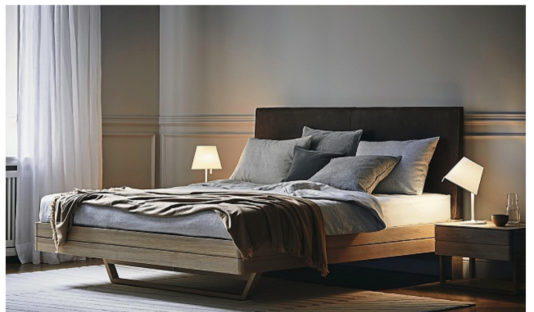
Im Schlafzimmer ist es praktisch, wenn man Leuchten mit sanftem Licht direkt neben dem Bett platziert.