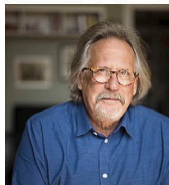
Harald Martenstein verteilt politische Spitzen.