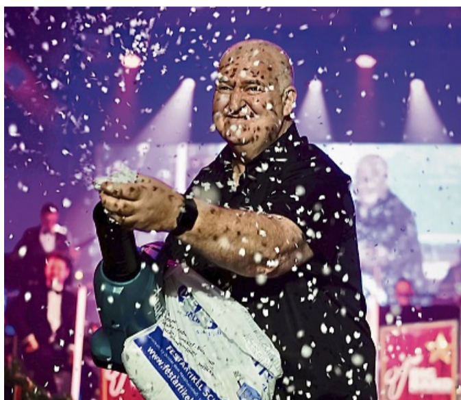
Führte launig durchs Programm: Der Comedian Markus Maria Profitlich ließ zu „Leise rieselt der Schnee“ Konfettis schneien.