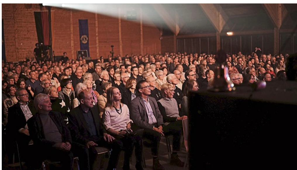
Körle Big Band Konzert 10. Dezember Berglandhalle Wohltätiger Zweck Kleine Riesen