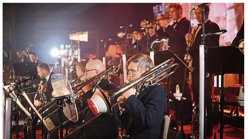
Körle Big Band Konzert 10. Dezember Berglandhalle Wohltätiger Zweck Kleine Riesen