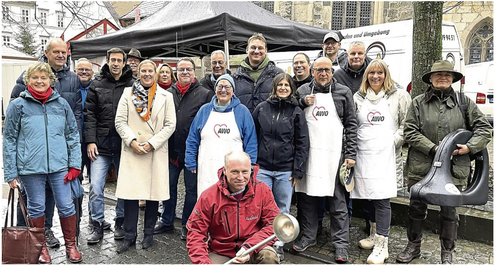
Sponsoren, Unterstützer, Helfer und viele Gäste waren zum „Löffeln im Regen“ gekommen.