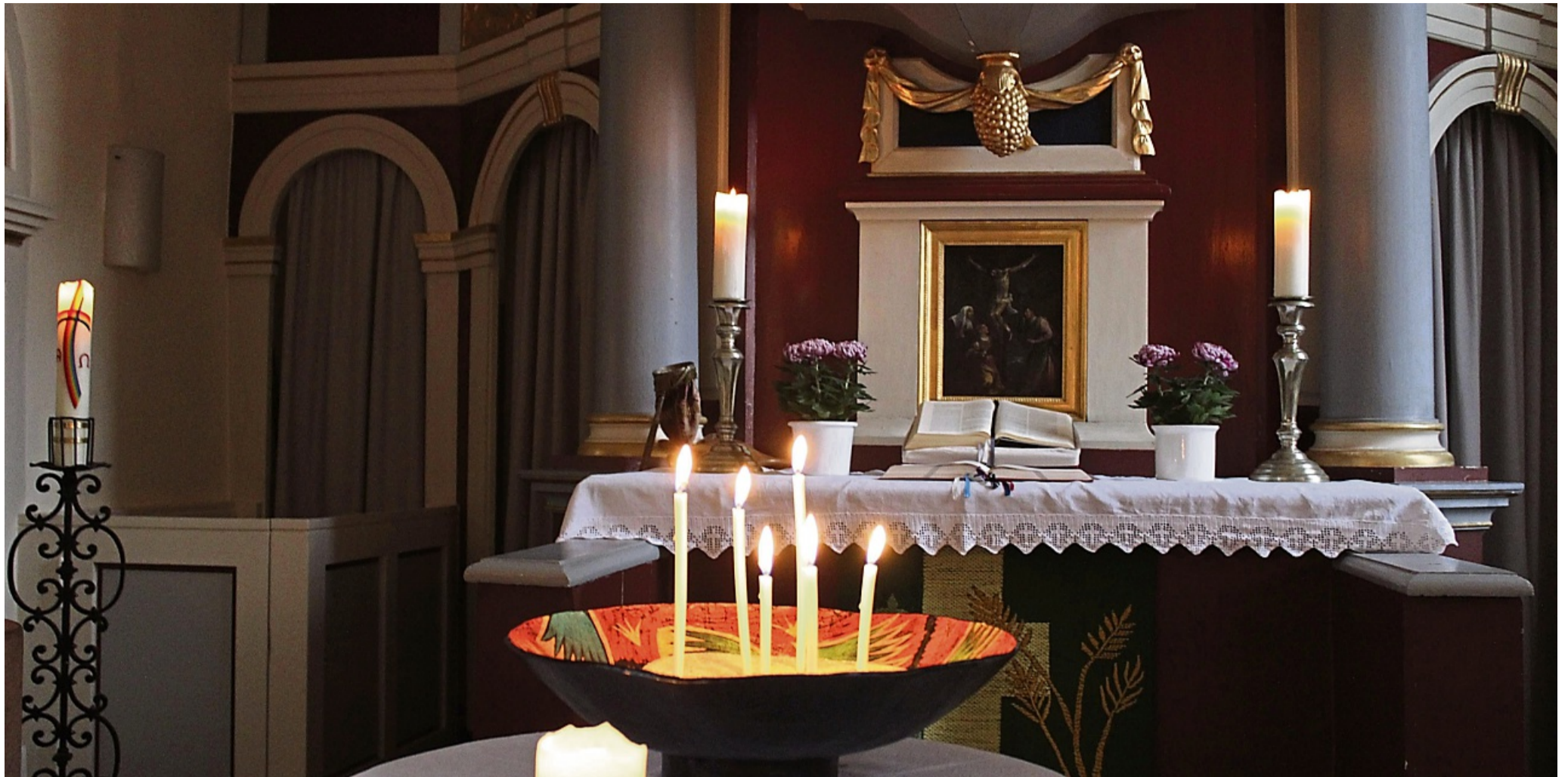
Dämmerstunde in der Jühnder Kirche: Kerzen werden beim Fürbittengebet angezündet.

Alle vier Wochen ist Dämmerstunde in der Kirche in Jühnde