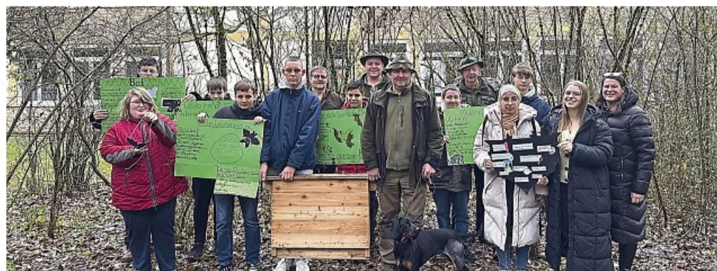
Im Garten der Rommeröder Hirschbergschule wurden jetzt die Fledermauskästen durch den Jagdverein übergeben.

In einer besonderen Kooperation mit dem Jagdverein Hubertus Witzhausen wurde zudem ein bedeutender Beitrag zum aktiven Naturschutz geleistet. Der Verein hat der Schule mehrere Fledermauskästen gespendet, die einen praktischen Nutzen für die Förderung der Fledermauspopulation in der Region haben. Die Kästen wurden dem Jagdverein von der Unteren Naturschutzbehörde des Kreises zur Verfügung gestellt. Hergestellt wurden sie von den Werraland-Le-