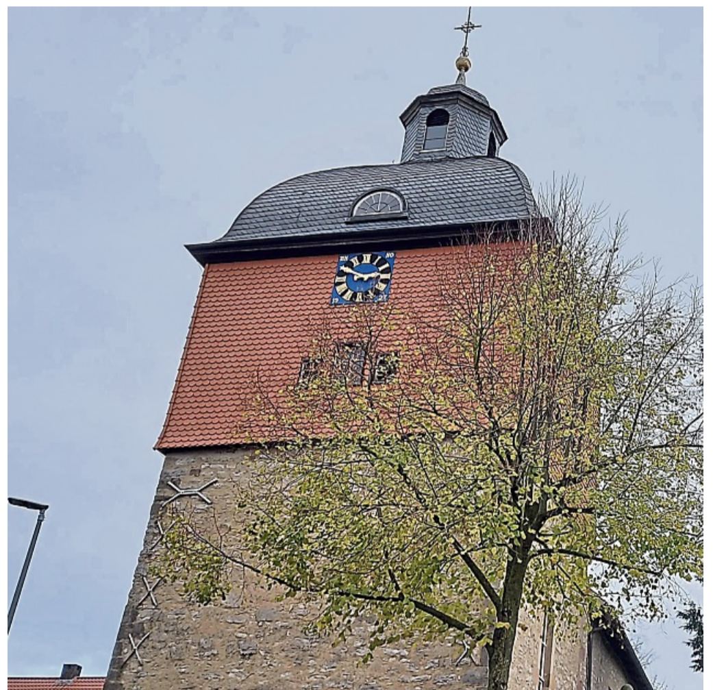
In der Jühnde Kirche findet alle vier Wochen der Dämmerstunden-Gottesdienst statt.