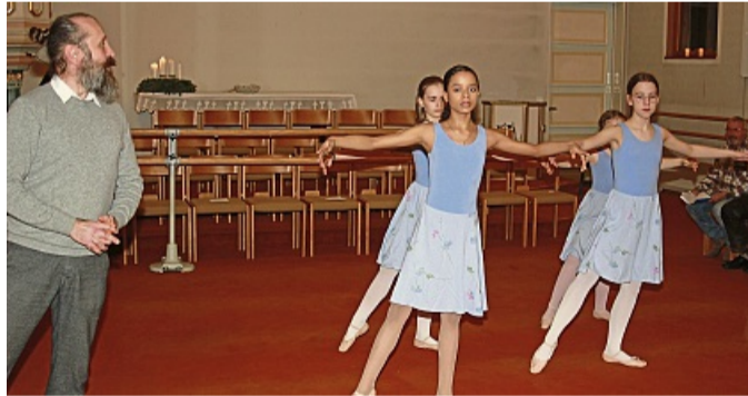
Vier Schülerinnen des Ballettlehrers Jens Hellemann vom Mündener Ballettverein zeigten unter seiner Anleitung den Aufbau tänzerischer Posen im Raum.

Ballettschülerinnen traten in der Reformierten Kirche auf