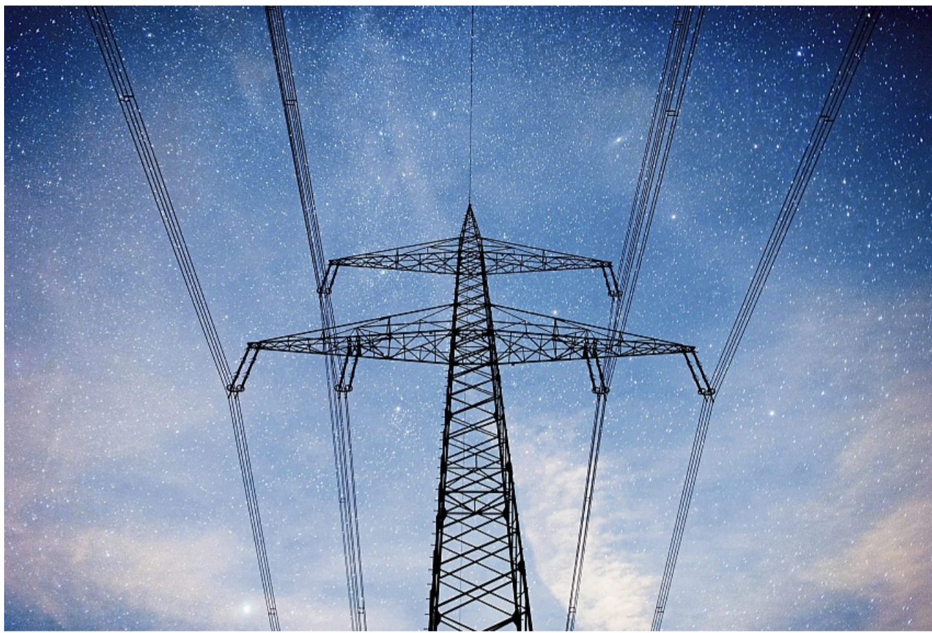
Noch steht es in den Sternen, ob sich dynamische Stromtarife für Verbraucher im Allgemeinen lohnen.

Festpreistarife: Diese klassischen Tarife haben einen festen Grundpreis plus je nach Verbrauch pro Jahr einen fixen Arbeitspreis, der in Cent pro Kilowattstunde abgerechnet wird. Preisschwankungen an der Börse preisen Anbieter hier mit ein. Von sinkenden Preisen profitieren Verbraucher also nicht. Variable Tarife: Bei ihnen kann sich der Arbeitspreis meist monatlich ändern. Bei zeitvariablen Tarifen gibt es zwar unterschiedliche Preise je nach Tageszeit, diese sind je-