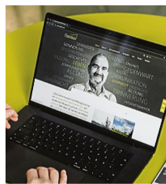
Die Startseite des neuen Internetauftritts des Grenzmuseums rückt die Zeitzeugen in den Fokus.

So können Führungen sowie weitere Angebote im Bildungsbereich jetzt direkt online reserviert werden. Ein Blog informiert über aktuelle Projekte, neue Initiativen und spannen-