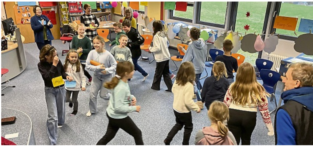
Der Umgang mit dem Tod kann auch fröhlich sein, zeigen die Grundschüler aus Abterode.

„Hospiz macht Schule“: Projekt zum vierten Mal in Abterode