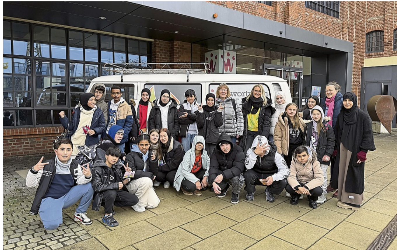
Intensivklassen der Adam-von-Trott-Schule erkunden im Rahmen eines Klassenleitertages das „Wortreich“ in Bad Hersfeld

Im Anschluss daran genossen die Schülerinnen und Schüler freie Zeit und erkundeten auf eigene Faust die Altstadt Bad Hersfelds.