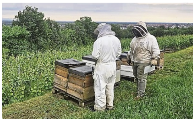
Kontrollieren die Bienekästen an einem ihrer Standplätze im Werra-Meißner-Kreis.