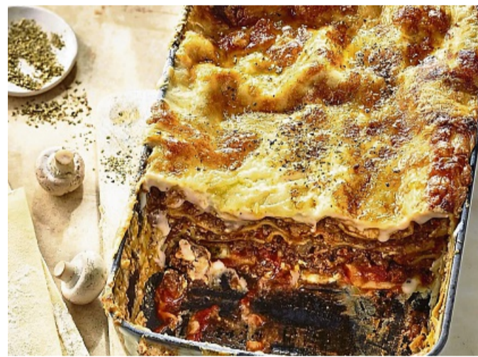
Eine tomatige, rotweinduftende Hackfleischsoße gehört für Martina Meuth in die klassische Lasagne – in ihrem Rezept sind auch noch Champignons dabei.

Esslöffel Bechameloße auf dem Boden der Form verteilen, dann eine Schicht Nudeln, Hacksoße, Bechamel und etwas Käse. Das wiederholen, bis alles aufgebraucht ist. Die oberste Schicht sind mit Bechamel bestrichene Nudeln.