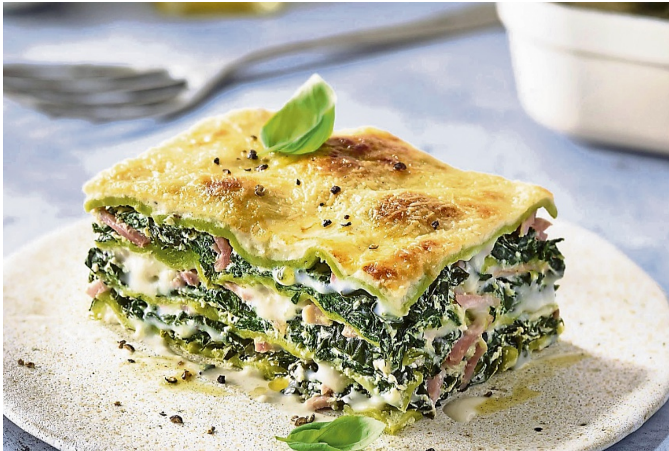
Eine leichte Variante des Klassikers ist die Grüne Lasagne mit Spinat-Ricotta-Füllung – sie funktioniert mit Speck oder auch vegetarisch.