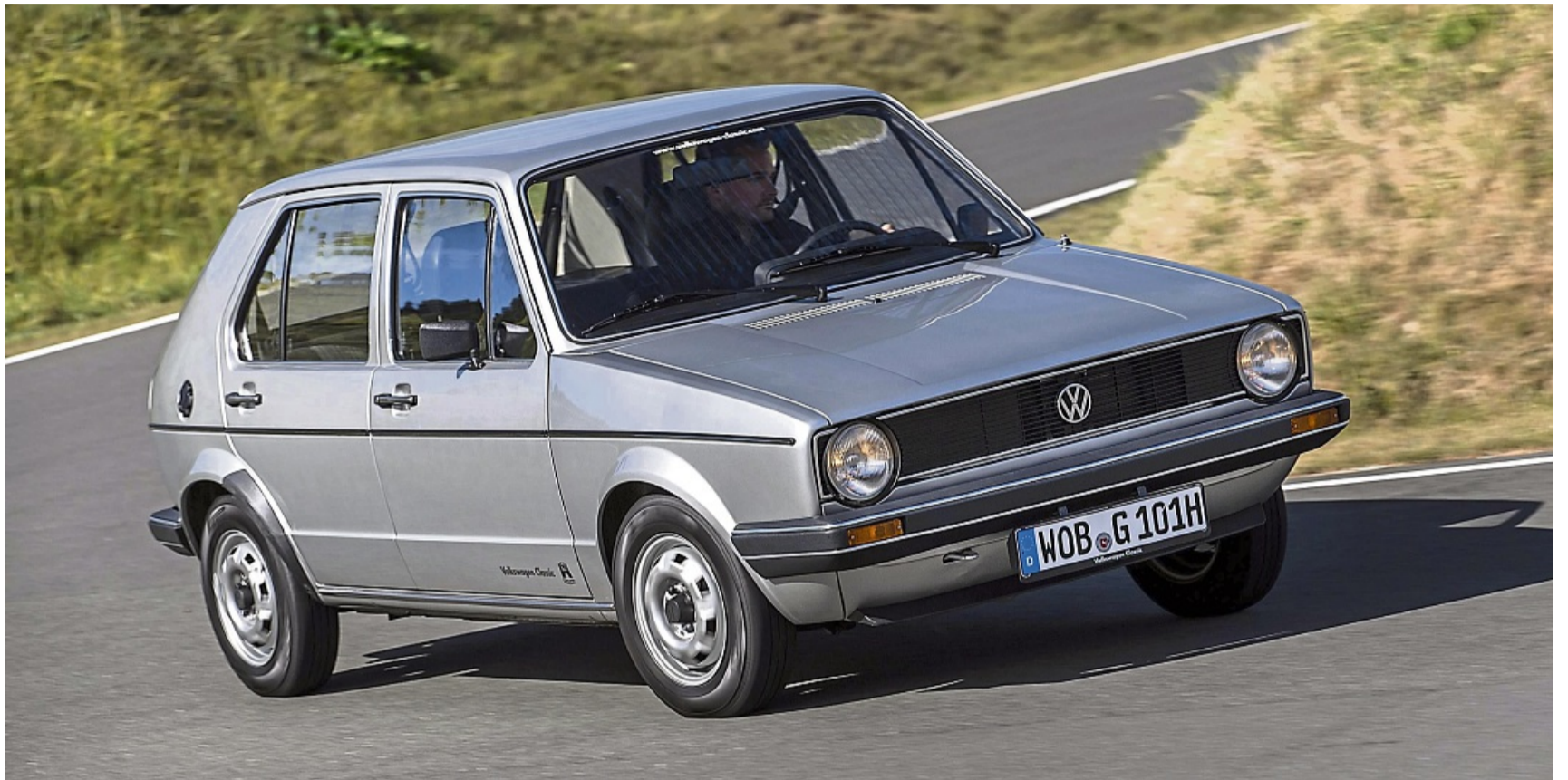
Dank geringen Gewichts kann man mit dem Einser heute auch noch recht flink unterwegs sein.

Wer heute mit einem Golf der ersten Stunde unterwegs ist, muss deshalb auch keine unwissenden Fragen beantworten, wie sonst so oft bei Oldtimern. Denn egal wie alt die Passanten auch sein mögen, haben sie gefühlt alle mit hoher Wahrscheinlichkeit mit einem Golf oder seinem Nachfolger ihren Führerschein gemacht, selbst mal einen beses-