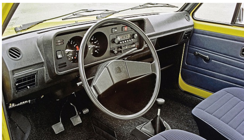
Genau hingeschaut: Die kleinen kegelförmigen Abdeckungen beim Tacho kamen bis 1980 zum Einsatz.