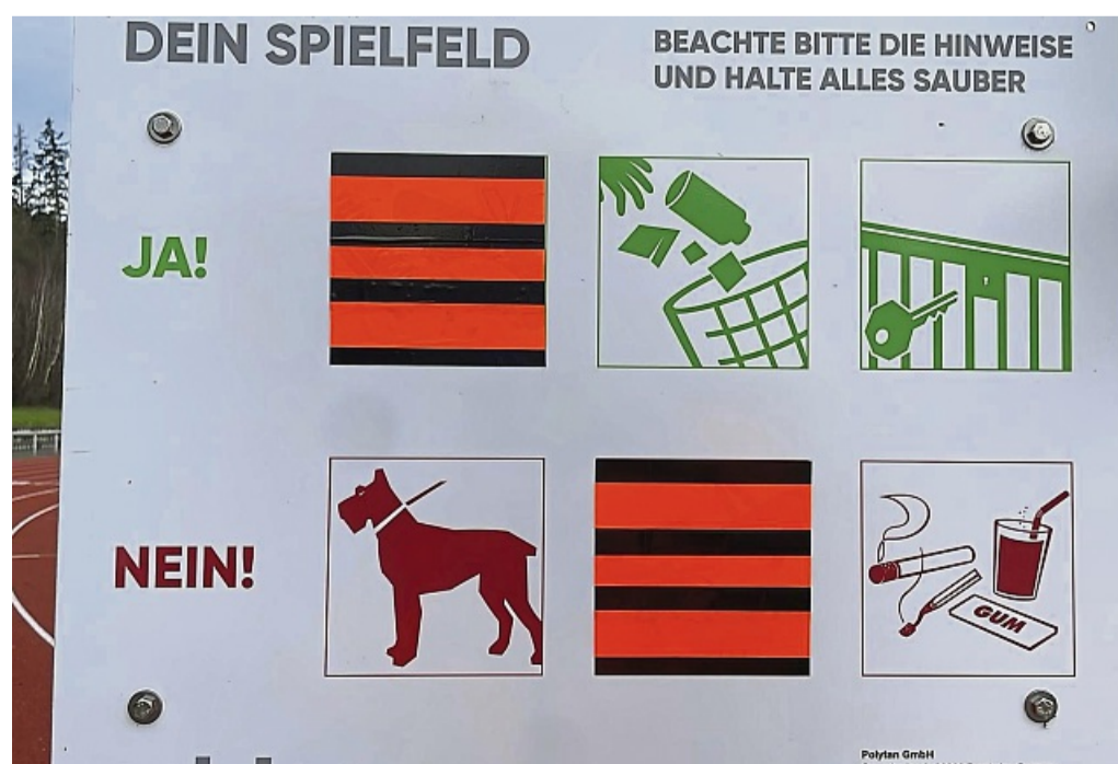
Schild an der Laufbahn in Melsungen überklebt: Ab sofort ist auch offiziell ein Training mit Spikes wieder erlaubt.