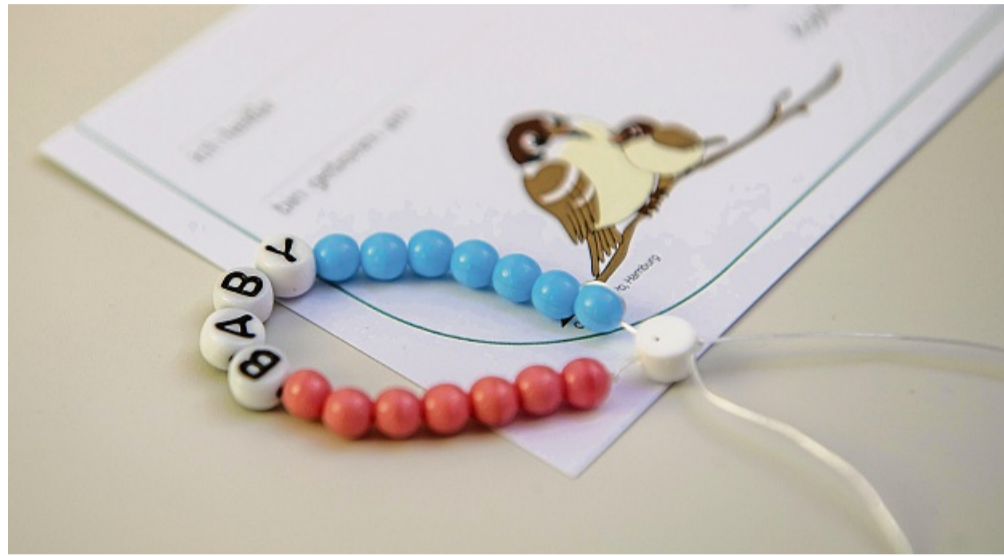
Oft gar nicht so einfach: Die Frage, welchen Namen das Kind für den Rest seines Lebens tragen soll, treibt viele werdende Eltern um.