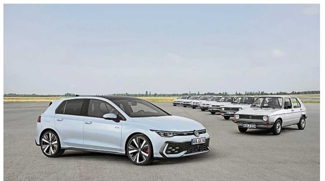
Aufgereichte Ahnengalerie: Der aktuelle Golf (links) blickt auf seine sieben Vorgängergenerationen.