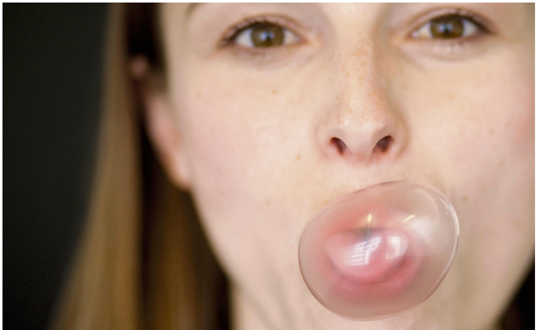
Ein Rauchstopp geht oft mit der Frage einher: Wie halte ich meinen Mund nun beschäftigt? Eine Idee: ein (Nikotin-)Kaugummi.

Wie die aussehen können, ist ganz individuell. Vielleicht gönnt man sich nach der ersten rauchfreien Woche einen Sauna-Besuch oder ein Dinner im Restaurant. Und nach einem