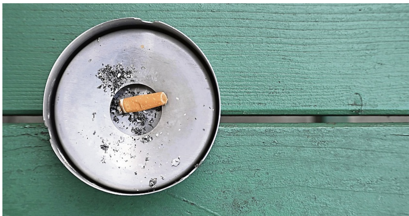
Die letzte Zigarette: Rund um den Jahreswechsel nehmen sich viele einen Rauchstopp vor.