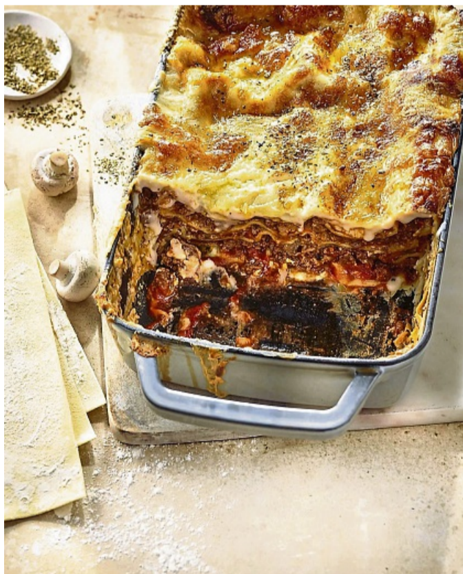
Eine tomatige, rotweinduftende Hackfleischsoße gehört für Martina Meuth in die klassische Lasagne – in ihrem Rezept sind auch noch Champignons dabei.