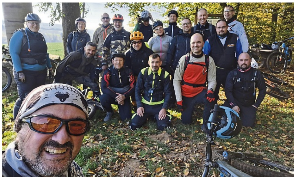
Sind gerne gemeinsam unterwegs: Die E-Bike Enthusiasten aus dem Landkreis.

Gruppe organisiert Fahrten und steht vor Vereinsgründung