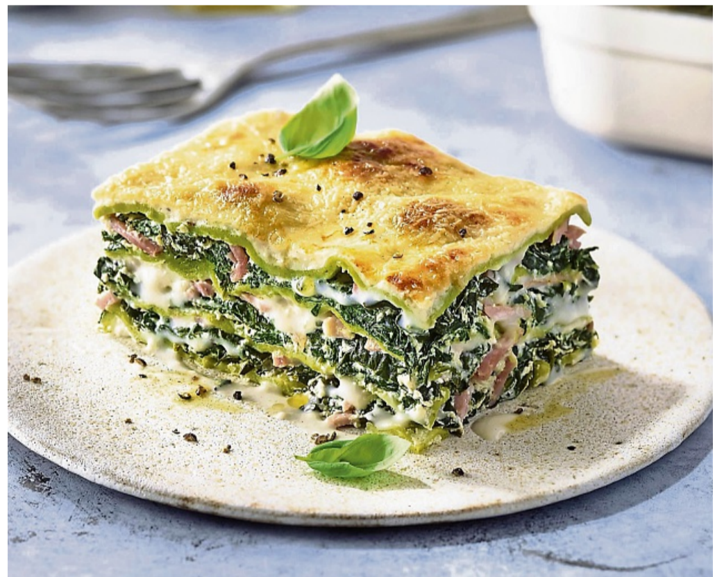
Eine leichte Variante des Klassikers ist die Grüne Lasagne mit Spinat-Ricotta-Füllung – sie funktioniert mit Speck oder auch vegetarisch.

Dann 400 ml Gemüsebrühe und 400 g gehackte Tomaten zugeben und alles einmal aufkochen. Bei mittlerer Hitze zehn Minuten köcheln lassen und mit Salz, Pfeffer und Curry würzen. Die Bechameloße bereitet die Bloggerin aus 25 g Butter, 25 g Mehl und 600 ml Milch zu, gewürzt mit Salz,