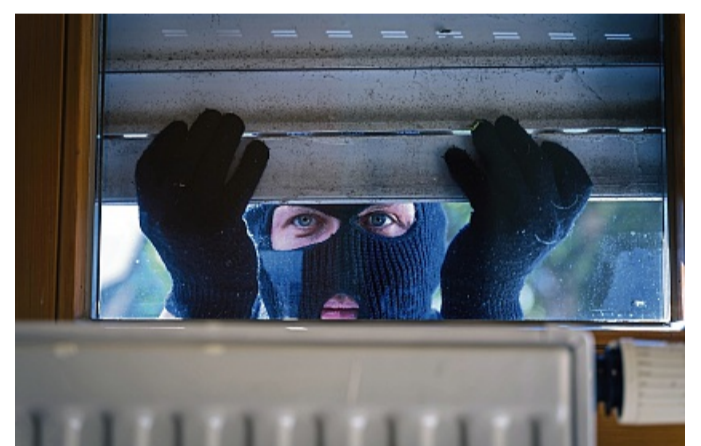
Um Zeugenhinweise auf zwei Einbrüche am Edersee bittet die Polizeistation Bad Wildungen.

In der Zeit zwischen Freitag und Samstagmorgen drangen Kriminelle in ein Hotel in der Schloßstraße in Waldeck ein, indem sie ein Kellerfenster aufhebelten und dann durch den Keller ins Gebäude gelangten. Sie nahmen sich die Rezeption vor, in der sie die Schubladen durchsuchten und eine Geldkassette öffneten. Da diese jedoch leer war, verließen die Einbrecher den Tatort ohne