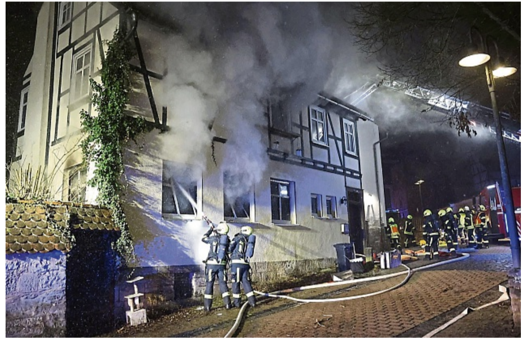
In der Nacht von Donnerstag, 2. Januar auf Freitag, 3. Januar, ist es in der Korbacher Altstadt zu einem Feuer in einem Wohnhaus gekommen. Dabei ist ein Mann ums Leben gekommen.

Von der Drehleiter aus seien das Obergeschoss und der Dachbereich kontrolliert worden. „Ein Übergreifen der Flammen auf diese Gebäudeteile konnte jedoch erfolgreich vermieden werden. Auch das