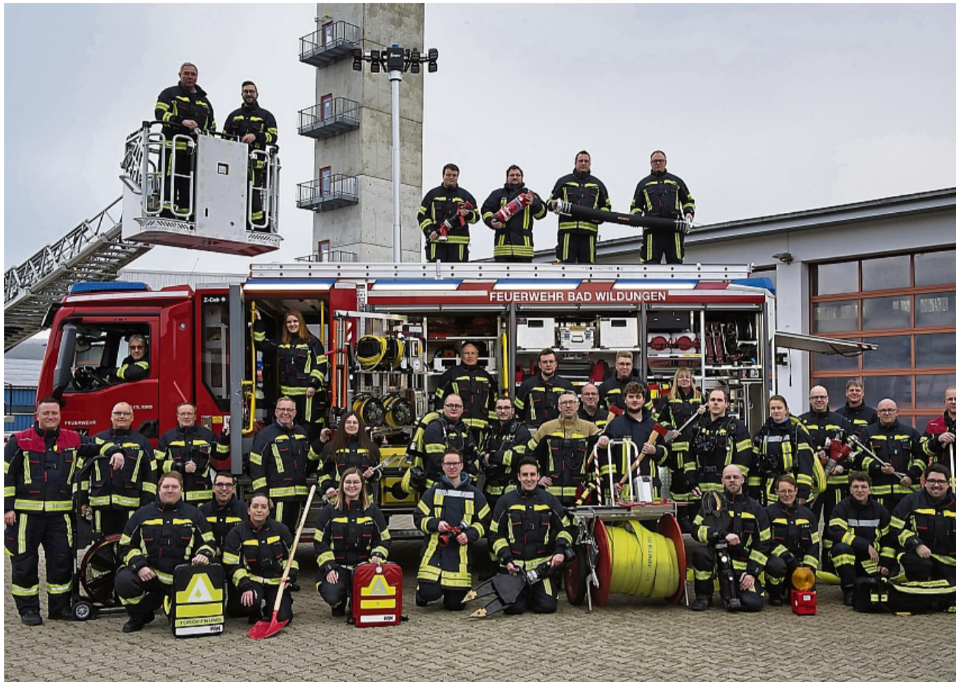
Fast 300 Einsätze absolviert: Auf ein Rekordjahr in Sachen Einsätzen blicken die Aktiven der Bad Wildunger Stützpunkt-Feuerwehr zurück.

Zu 88 Einsätzen waren die Bad Wildunger Feuerwehrleute durch ausgelöste Brandmeldeanlagen gerufen worden. Sie