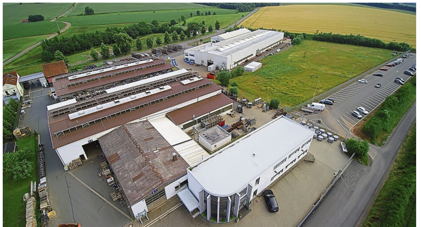
Nach einer Woche wieder erholt: Die Cyberattacke hatte keine langfristigen Auswirkungen auf die Produktion im Höringhäuser Standort.