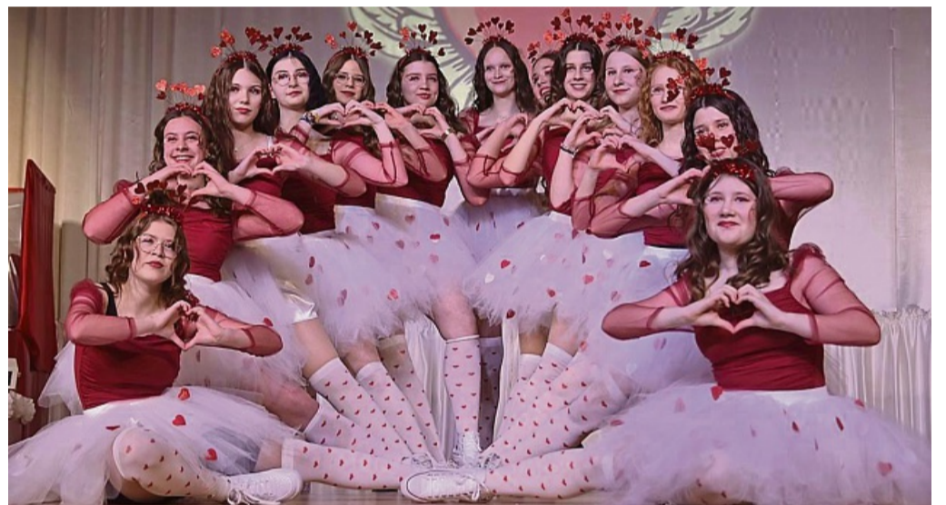
Wrexen helau: Wie im vergangenen Jahr dürfen sich die Zuschauer bei der großen Sitzung auf viele Tänze freuen.