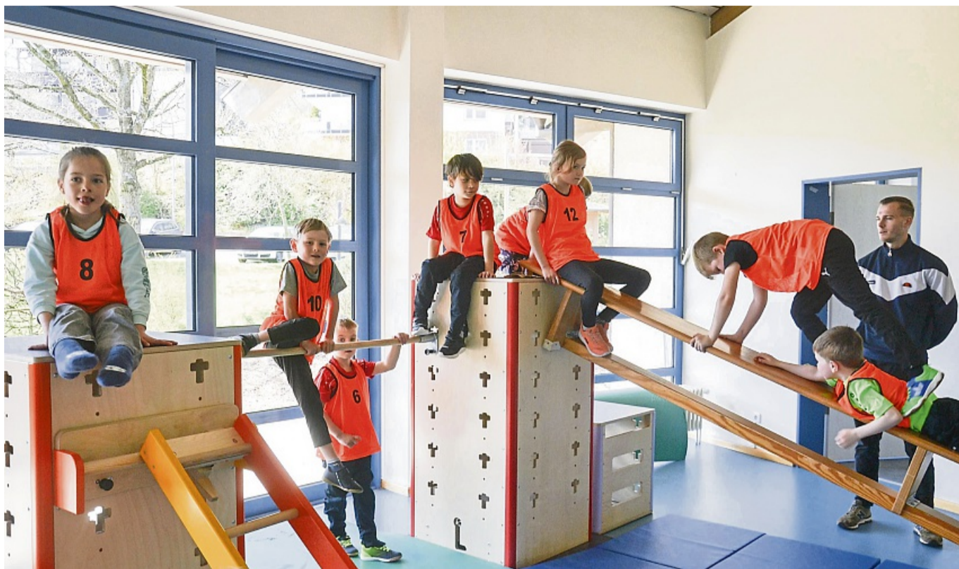
Bewegung bei Kindern zu fördern, ist beim Gesundheitsnetzwerk PORT schon länger ein Anliegen. Das neue Projekt ist breiter angelegt.

So werden zum Beispiel Speisepläne in den Kitas überprüft und bei Bedarf an die neuesten Ernährungsempfehlungen angepasst. Ferner wird ein spezieller Bewegungsparcours eingerichtet, um mögliche Bewegungsprobleme bei Vorschul-