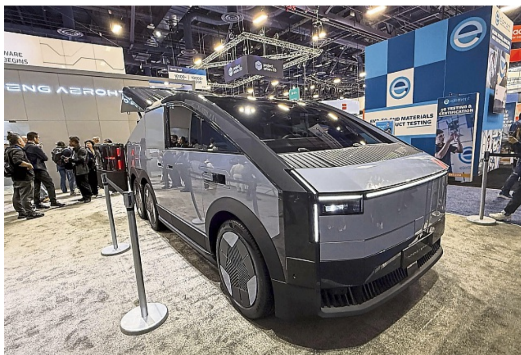
Der Xpeng Aeroht kombiniert Auto und Drohne und bietet neue Möglichkeiten für Luft- und Straßenmobilität - mit gewissen Einschränkungen.

Es fußt vor allem auf einer neuen Panorama-Projektion, mit der das untere Fünftel der Frontscheibe über die gesamte Breite zum Bildschirm wird. Zusammen mit neuen Menü-tasten am Lenkrad, einem erweiterten Head-up-Display und einem waagrecht ausgerichteten Bildschirm vor der Mittelkonsole soll es dafür sorgen, dass die Hände öfter und länger am Lenkrad und die Augen auf der Straße bleiben können. tmm