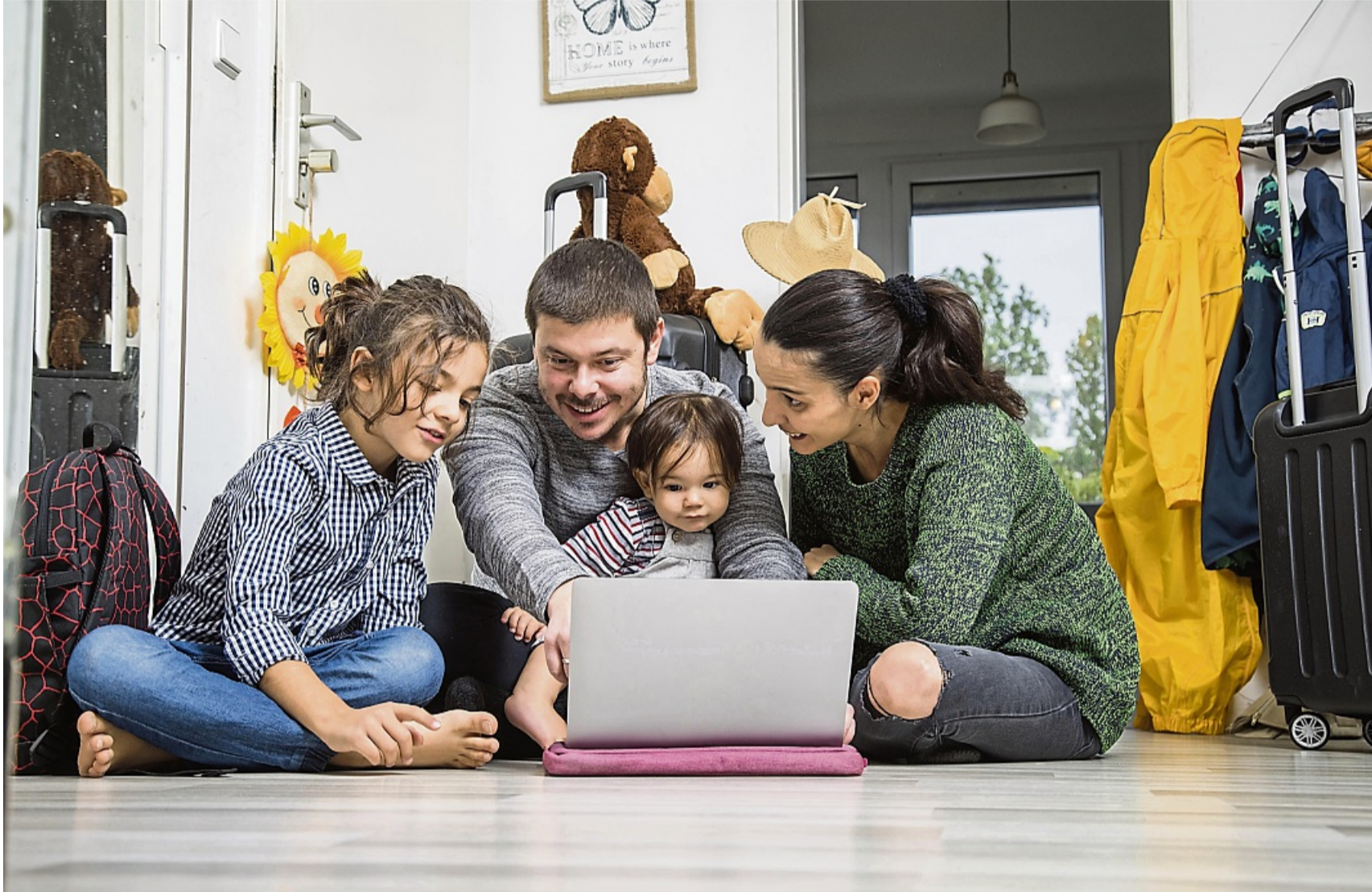
Wohin soll es gehen? In diesen Tagen sitzen auch viele Familien vor dem Rechner und planen ihren Sommerurlaub.

Sommerurlaub: So buchen Sie günstig und gut