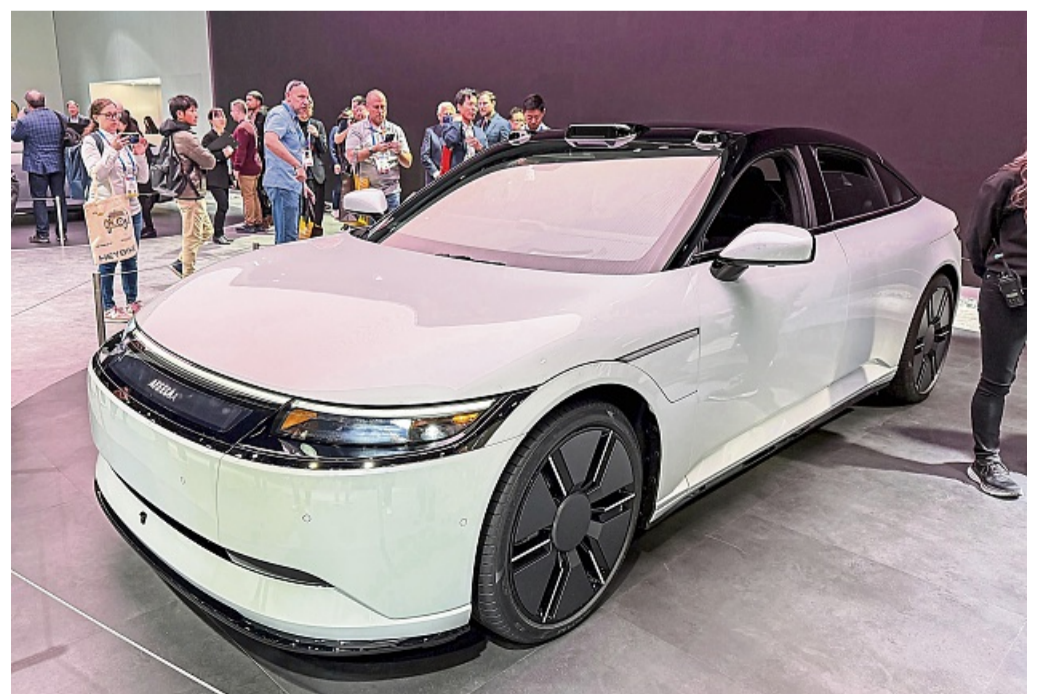
Der Sony-Honda Afeela 1 fährt mit futuristischem Design, riesigen Bildschirmen und autonomer Fahrtechnologie vor.