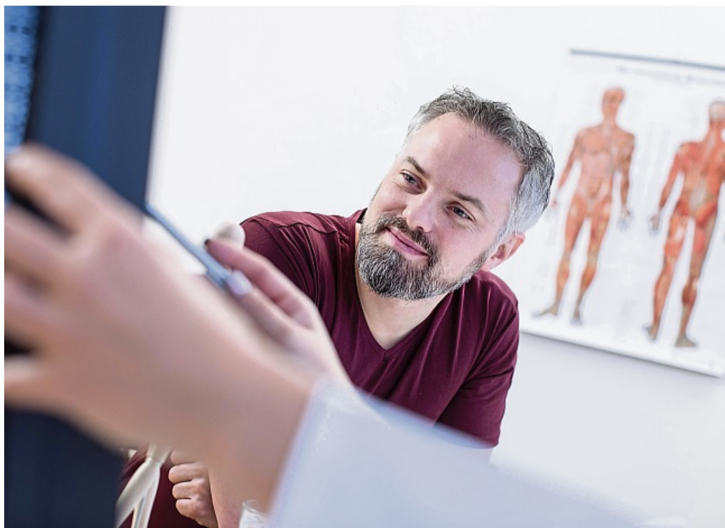
Eine Umfrage zeigt, dass viele Menschen nicht regelmäßig die Vorsorgeuntersuchungen wahrnehmen, die ihre Krankenkasse übernimmt.

Da gibt es etwa den allgemeinen Gesundheits-Check-up bei Hausarzt oder Hausärztin. Wer zwischen 18 bis 34 Jahren alt ist, hat einmalig Anspruch darauf. Wer 35 und älter ist, kann sich alle drei Jahre durchchecken