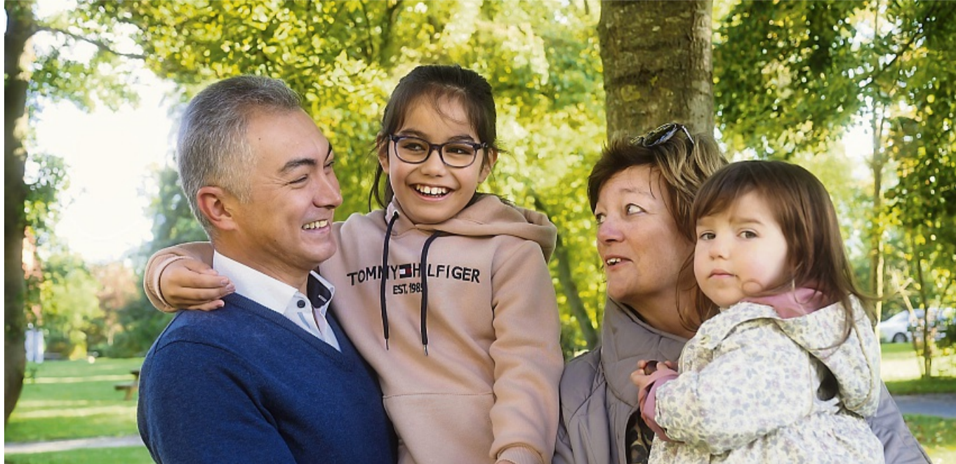
Angebote für alle: Das neue Jahresprogramm der evangelischen Familienbildungsstätte vereint die Menschen