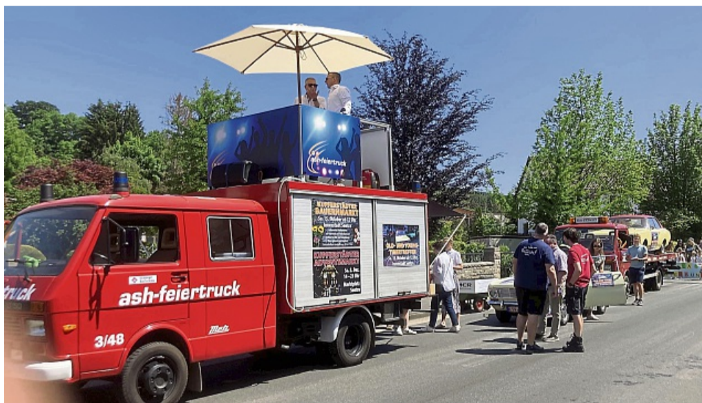
Im Einsatz: Auf dem Feiertruck findet ein DJ-Pult inklusive Sonnenschirm Platz.