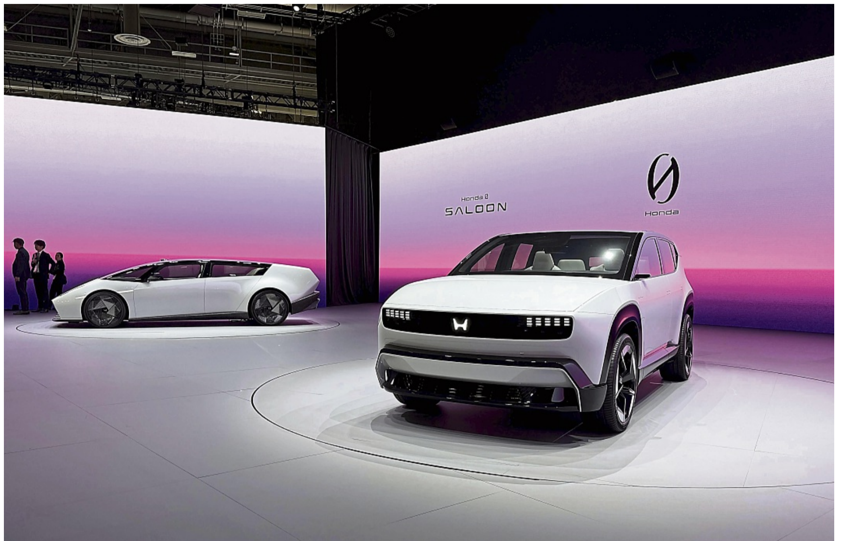
Hondas 0-Serie will den Start einer neuen Elektro-Ära mit revolutionärem Design und innovativer Technik markieren.

Das teilte der Hersteller auf der Messe mit und kündigte als zweites Modell ein SUV an. Dabei setzen die Japaner vor allem auf wegweisende Unterhaltung und bauen deshalb quer im gesamten Cockpit sowie vor der Rückbank Bildschirme ein. Die sollen besser und größer sein als bei der Konkurrenz und mehr Inhalte bieten. Außerdem will Sony - den Kameras und Sensoren auf dem Dach sei Dank - Maßstäbe beim auto-