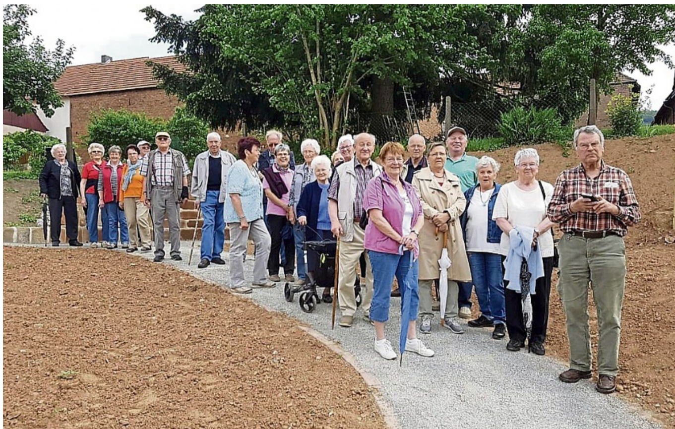
Immer flott unterwegs: Wenn die Weißenbörner und Rambacher der Seniorenbewegung nicht gerade im Ort unterwegs sind, machen sie auch mal Tagesausflüge, etwa nach Lindewerra, Kassel und Frankfurt.

Seit der Gründung vor über 13 Jahren trifft sich die Gruppe zweimal im Monat von 15 bis 17.30 Uhr im Dorfgemeinschaftshaus Graburgschule in Weißenborn. Um die 30 Seniorinnen und Senioren kommen