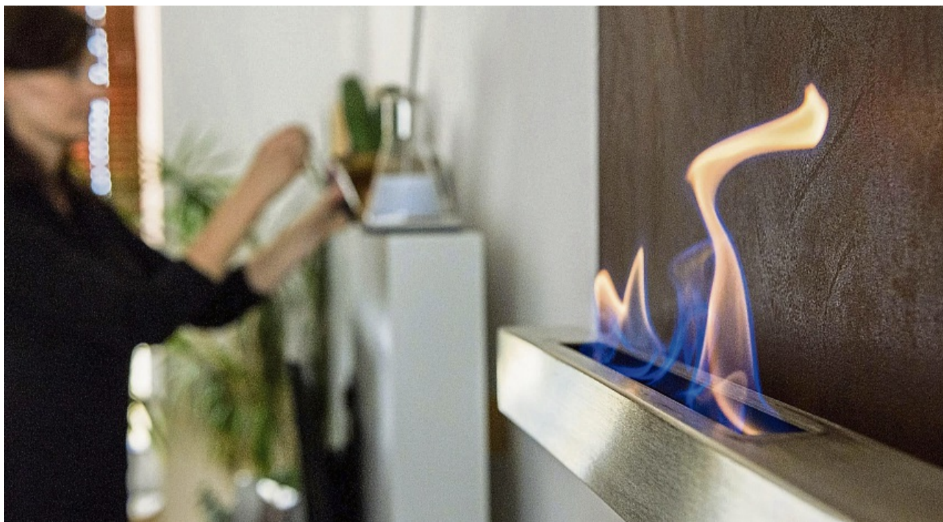
Ethanol-Kamine versprechen pflegeleichte Gemütlichkeit. Jedoch muss bei der Handhabung einiges beachtet werden.

Insbesondere bei unsachgemäßem Gebrauch oder bei Bil-