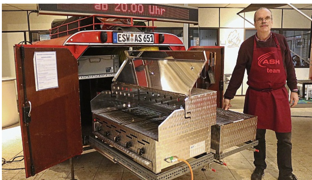
Neu dabei: Im Anhänger verbirgt sich neben zwei Grills eine Spülmaschine.