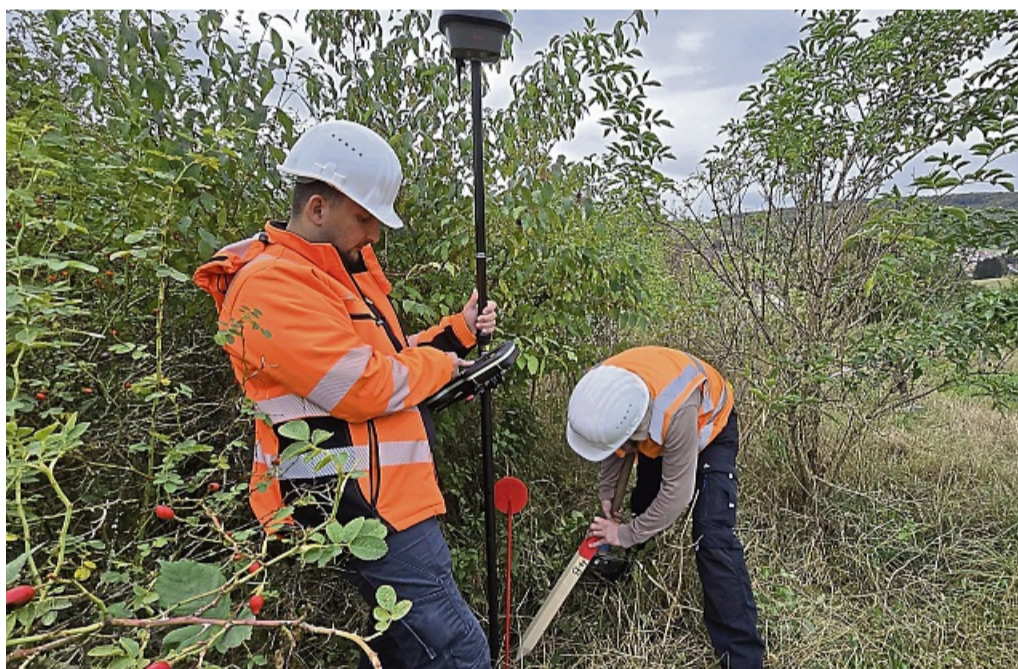
Spielt im Ringgau eine Rolle: der Bau der Megastromtrasse Suedlink. Auch um sie soll es in der Bürgerversammlung gehen.

Am 20. Januar sollen alle Themen noch mal auf den Tisch