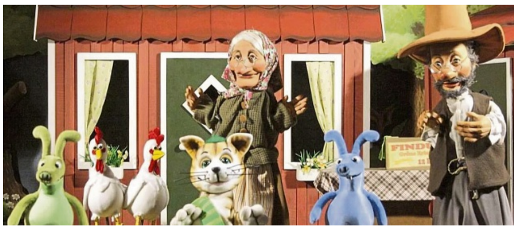
Das Puppenspiel „Pettersson und Findus“ zeigt das Wolfhager Figurentheater am 18. Januar in Frankenberg.

Wolfhager Figurentheater am 18. Januar in Frankenberg