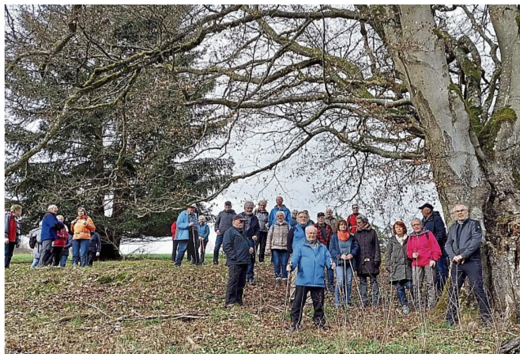
Unterwegs: Zum Wandern in der schönen Natur im Ederbergland wird auch in diesem Jahr wieder vom Gebirgs- und Wanderverein Oberes Edertal eingeladen, im Bild die Rast bei der Schäfersbuche nahe Hommershausen.