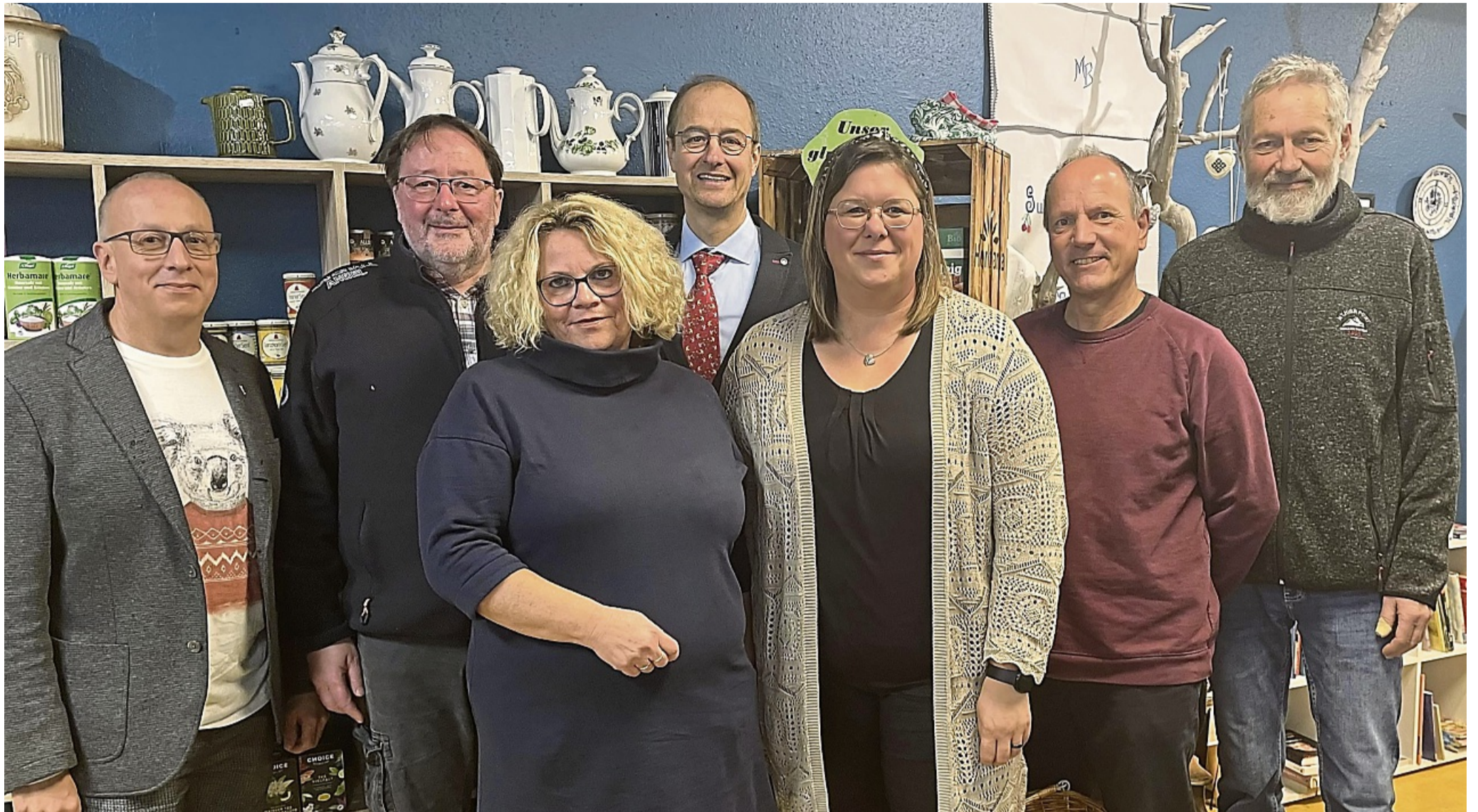
In einer kleinen Feierstunde ehrte der Vorstand der Lebenshilfe mit dem Betriebsrat die Mitarbeiter.

Mitarbeiter für 25 und 40 Jahre Betriebszugehörigkeit ausgezeichnet