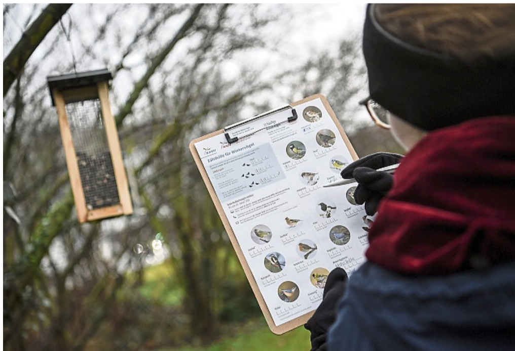
Zählhilfen und Vogelportäts hält der NABU für die bundesweite Aktion „Stunde der Wintervögel“ bereit, die am 2. Januar-Wochenende stattfindet.

Mitmachaktion „Stunde der Gartenvögel“ startet vom 10. bis 12. Januar