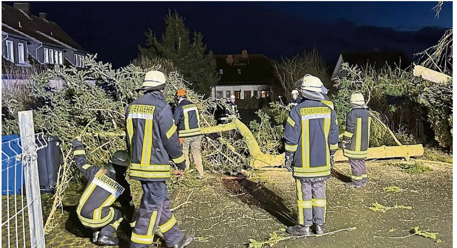
Wegen starker Winde: Mitten in einer Siedlung fiel dieser Baum auf Straße und Garten. Die Feuerwehren der Waldecker Stadtteile zerkleinerten ihn in kurzer Zeit und räumten ihn aus dem Weg.

Gleichzeitig ging die Einsatzmeldung über einen weiteren umgestürzten Baum ein, dieses Mal in Ober-Werbe. Nach Beseitigung wurde auch das Oberwerber Feuerwehrhaus besetzt, da im Dorf ebenfalls der Strom ausgefallen war. Zu diesem Zeitpunkt war der Funkraum im Feuerwehrhaus Sachsenhausen besetzt, um die