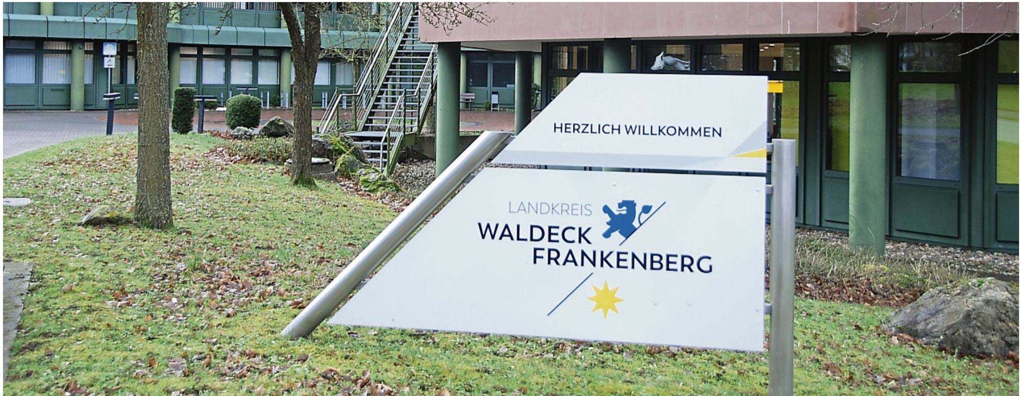
Schwer unter Druck: Seit Jahren steigende Ausgaben, die von Land und Bund nicht eins zu eins gegenfinanziert werden – unter anderem das bringt die Haushalte der Kommunen und des Landkreises an den Rand des Machbaren.

Waldeck-Frankenberg – Dringender Appell an Land und Bund: Gemeinsam wenden sich die Spitze des Landkreises Waldeck-Frankenberg mit Bürgermeisterin und Bürgermeistern an das Land Hessen und den Bund, um auf die desolote Finanzlage der Kommunen aufmerksam zu machen und eine zügige Kehrtwende in der kommunalen Finanzierung anzumahnen. Die Städte und Kommunen stünden vor einer nie dagewesenen, prekären Haushaltslage. Bei der Bürgermeisterdienstversammlung am gestrigen Dienstag im Korbacher Kreishaus stellten sie sich demonstrativ Schulter an