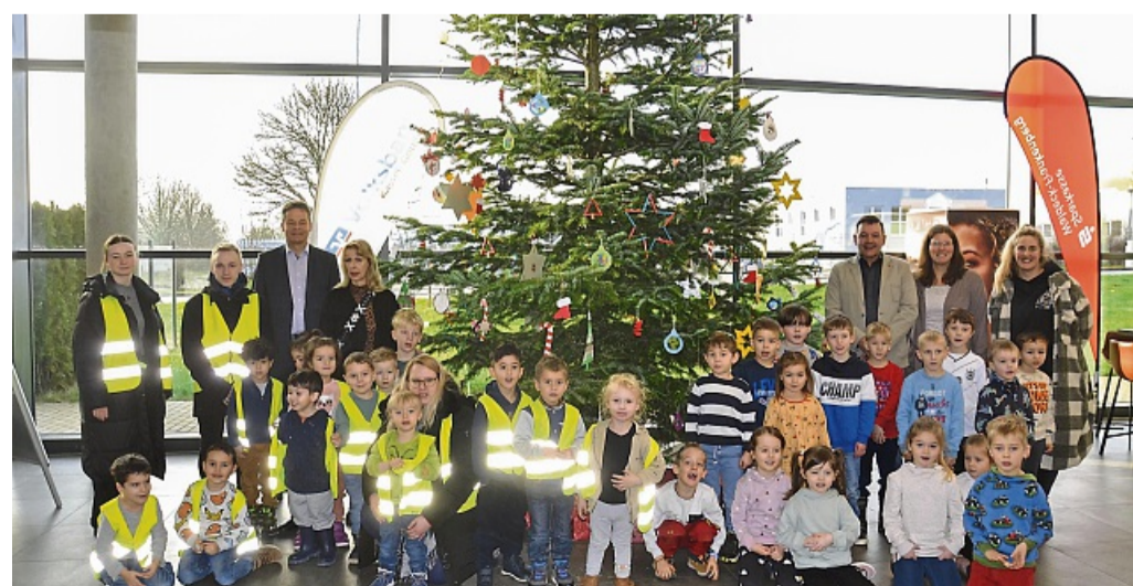
Zum Strahlen gebracht haben Mädchen und Jungen aus den Kindergärten Schmittlotheim und „Kleines Wunderland“ den Weihnachtsbaum im Korbacher Kino und durften sich danach einen Film ansehen.