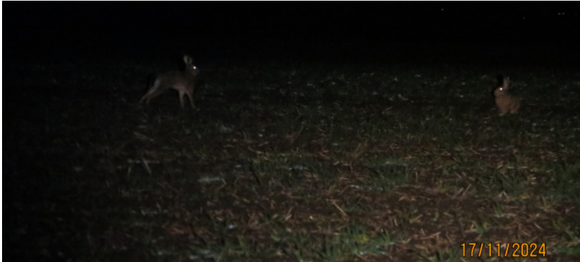
Ihnen gilt bundesweite Aufmerksamkeit

Wir möchten die Hasenzählung in Thüringen weiter voranbringen und rufen potentielle Revierinhaber zur Unterstützung auf. Anlässlich dessen veröffentlichen wir auf der Homepage des LJVT eine Kurzanleitung zusammen mit einem Beispielformular, für alle die sich engagieren wollen und Interesse zeigen.