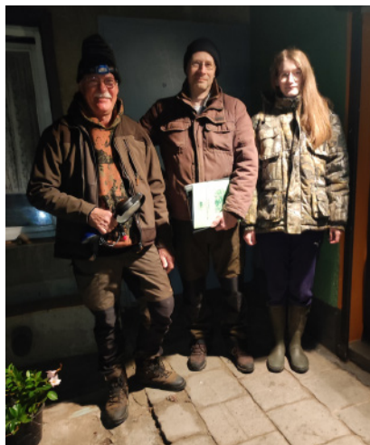
Zwei hochmotivierte Zählteams des GJB Schwerstedt im Landkreis Sömmerda

gestellt. Die Kosten für den Fahrtaufwand werden vom Landesjagdverband Thüringen e.V. ebenso vollständig übernommen.