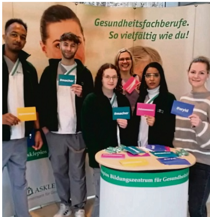
Das Asklepios Bildungszentrum für Gesundheitsfachberufe Nordhessen gGmbH zählt zu den größten us-, Fort- und Weiterbildungsanbietern in Nordhessen.

Zudem werden die ausbildungsintegrierten Studiengänge Therapie- und Pflegewissenschaften (B.Sc.) und Physiotherapie (B.Sc.) angeboten. Hin-