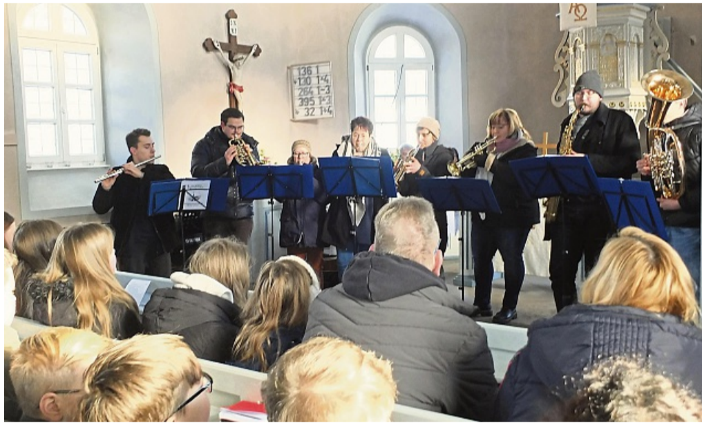
„Die Kirche steht gegründet allein auf Jesus Christ“: Lied der Gemeinde mit Unterstützung des Posaunenchores Frankenau.

morvollen Dialog, in dem sie über die vielfältigen Anforderungen ihres Berufsfeldes sprachen und Erwartungen oder auch Ängste bezüglich der kommenden Aufgaben äußerten.