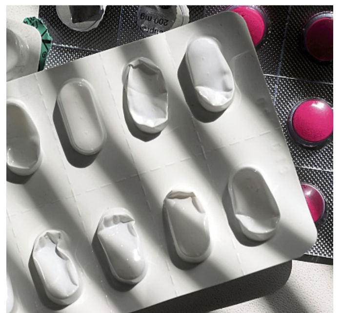
Solche Blister können in die Gelbe Tonne – sofern wirklich keine Tabletten mehr drin sind. Andernfalls gehören sie meist in den Restmüll.

Wichtig: Alle Verpackungen sollten wirklich vollständig geleert sein und keine Medikamentenreste enthalten. tmn