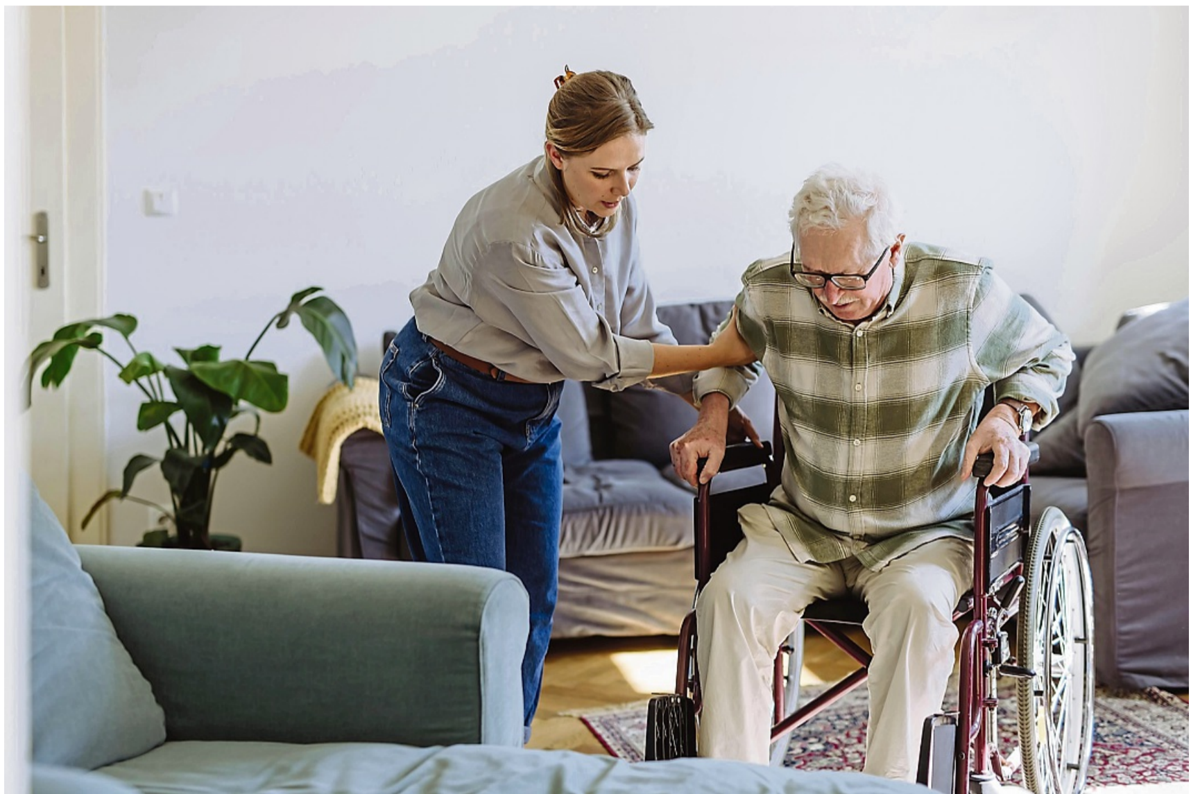
Wenn Vater oder Mutter Pflege brauchen, müssen wir unseren Alltag oft ganz neu organisieren.