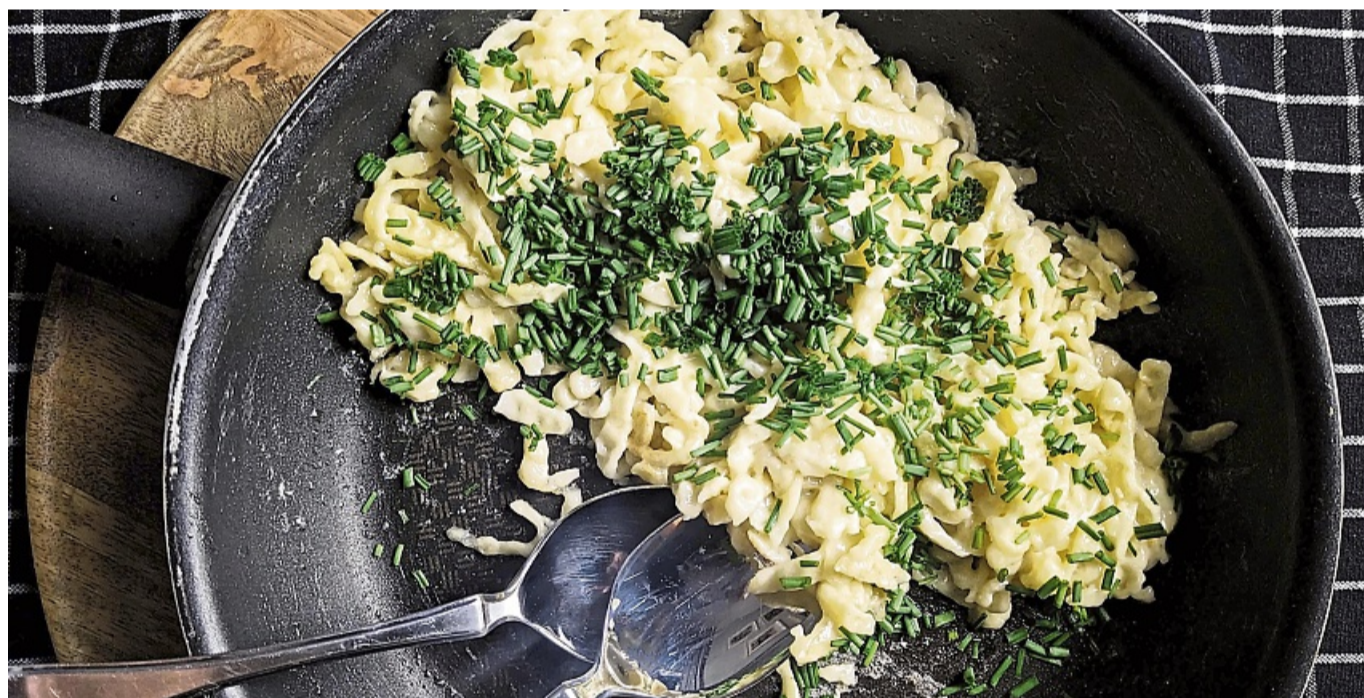
Für Kasnockerl kommen Spätzle und Käse auf den Herd und werden mit Schnittlauch bestreut - und das Ganze wird am besten direkt aus der Pfanne gegessen.