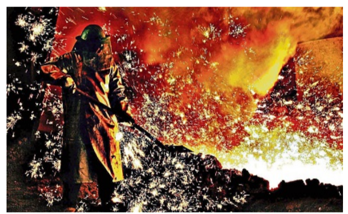
Bei einer Werksführung im Hüttenwerk Salzgitter kann man die Stahlgießern über die Schulter schauen.

Von der Südheide bis ins Harzvorland erstreckt sich die Freizeitregion Braunschweiger Land und bietet viele außergewöhnliche Erlebnisse: malerische Schlösser, zwischen Mühlen aus aller Welt im Freilichtmuseum oder im Park der Autostadt Wolfsburg. Werksführungen versprechen unvergessliche Einblicke hinter die Kulissen, etwa im Stahlwerk Salzgitter, in einer Zuckerfabrik oder bei den Braunschweiger Atomuhren. Für Aktivurlauber empfiehlt sich ein Fahrradausflug auf der neuen „Rundtour Braunschweiger Land“, kleine Fachwerkstädte laden zum Bummeln ein und Museen zeigen bedeutende Schätze von der Steinzeit bis zur Industriekultur. Unter www.freizeitregion.de sind alle Events und Sehenswürdigkeiten zu finden.