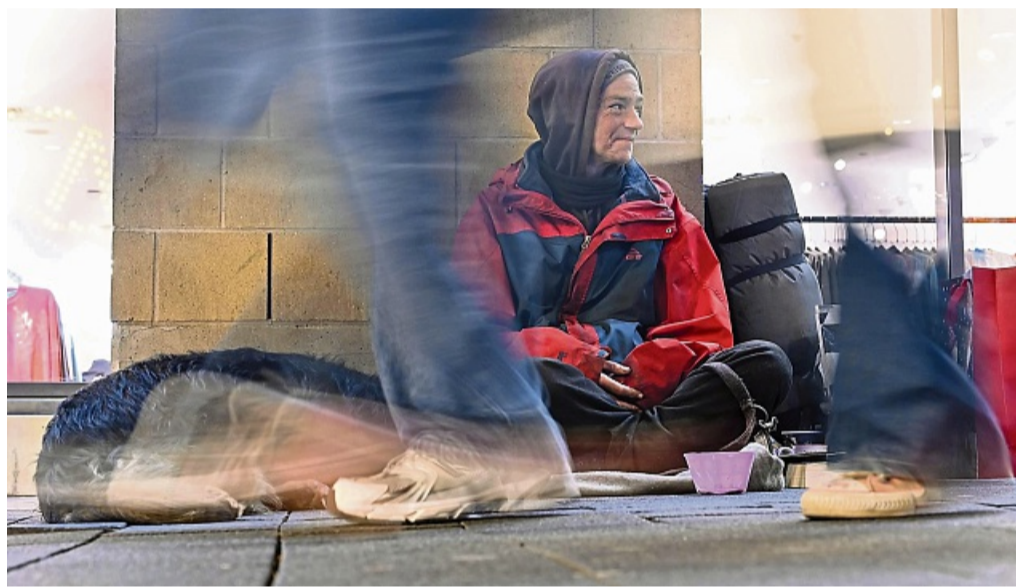
Hilfe: In Fritzlar unterhält das Diakonische Werk des Kirchenkreises Schwalm-Eder in der Steinmühle 1 a eine Fachberatungsstelle und eine Tagesaufenthaltsstätte für Obdachlose.

Für diese Aufgaben stellt der LWV als überörtlicher Träger der Sozialhilfe rund 761.500 Euro mehr zur Verfügung als in 2023. Die Förderung in Höhe von 13,57 Millionen Euro decke zu 95 Prozent die Personal- und Sachkosten der Hilfeinrichtungen. In Hessen gibt es derzeit 40 Fachberatungsstellen und Tagesaufenthaltsstätten für alleinlebende Wohnungslose. In Fritzlar unterhält das Diakonische Werk des Kirchenkreises Schwalm-Eder in der Steinmühle 1 a eine Fachberatungsstelle und eine Tagesaufenthaltsstätte. Diese fördert der LWV in diesem Jahr mit