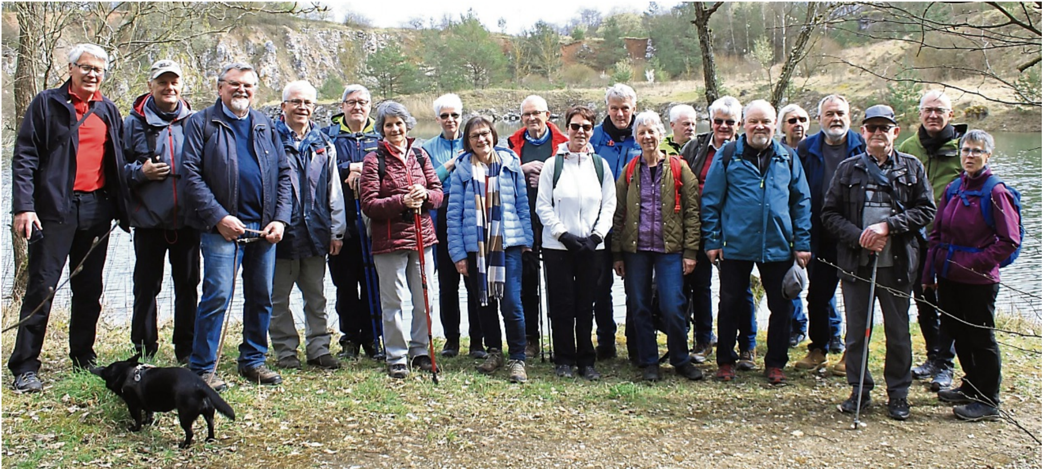
Bewegung an der frischen Luft, das schätzen die Wanderer der Wandergruppe Morschen, die sich jeden Dienstag trifft.