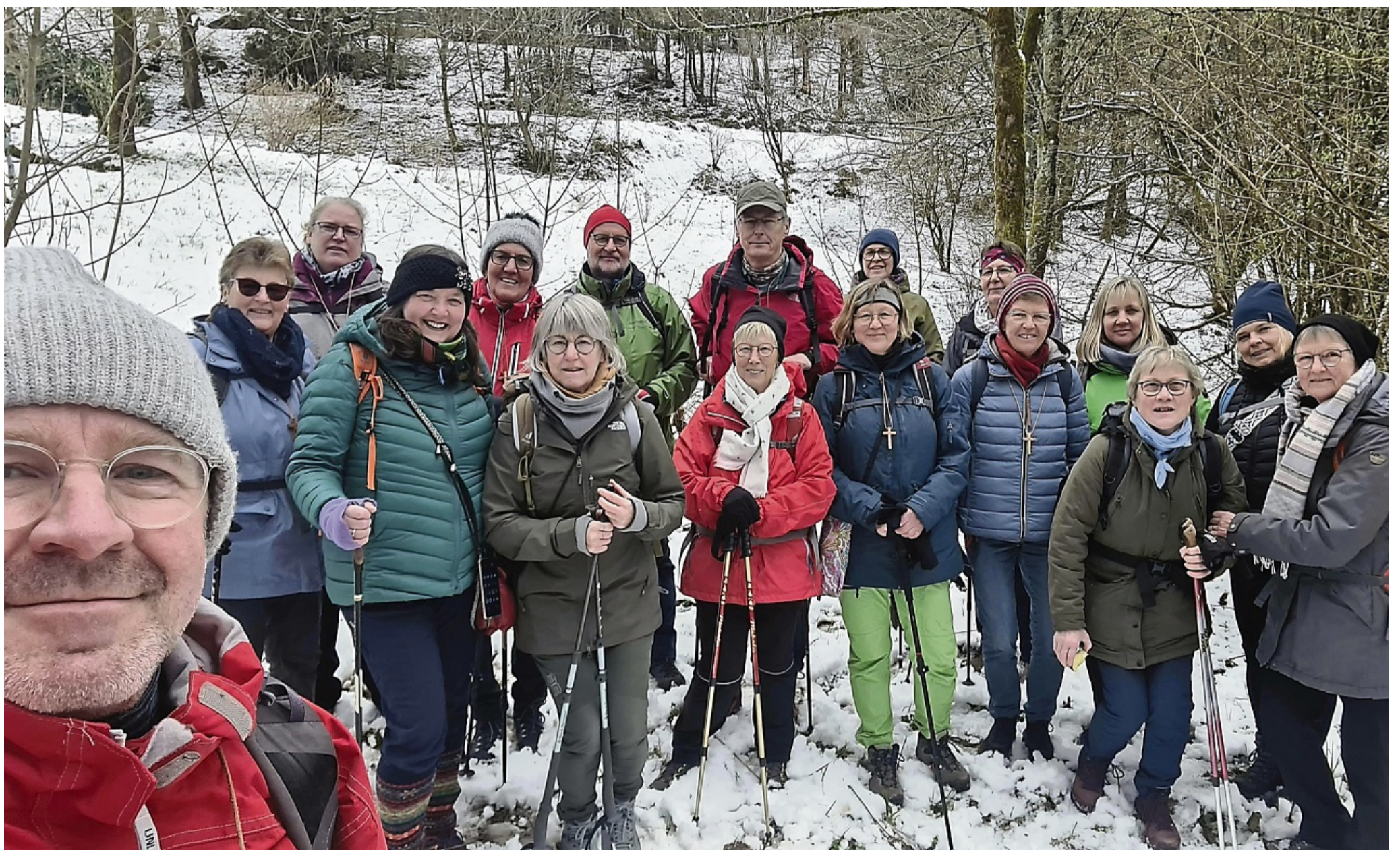
Spangenberg Pilgerwanderung 2023 Sauerland