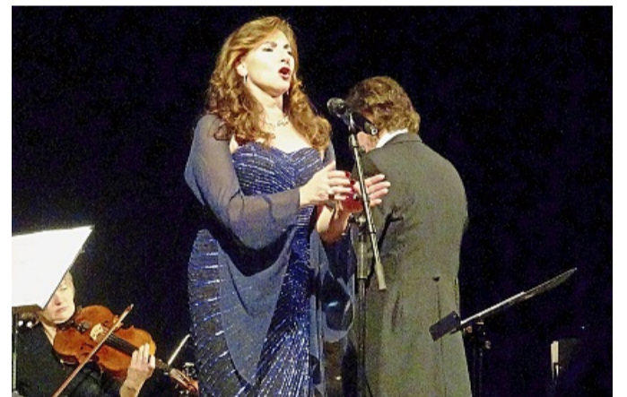
Eine Stimme, die begeisterte: Die Mezzo-Sopranistin Nidia Palacios verzauberte das Publikum.