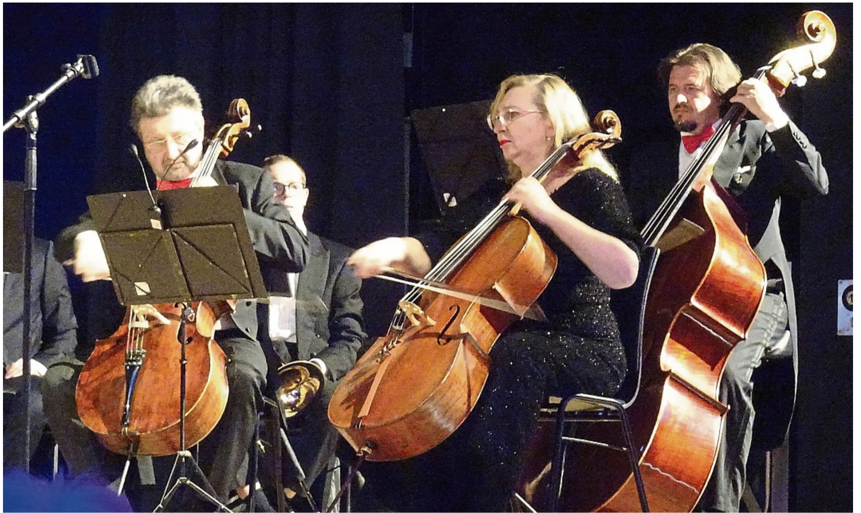
Die Philharmonia Frankfurt präsentierte eine raffinierte Kombination aus Filmmusiken auf der Bühne der Fritzlarer Stadthalle.

Im dazu kontrastierenden elegischen Soundtrack zu „Schindlers Liste“ zeigten die Streicher des hervorragenden aufspielenden Orchesters ihr Können. Klassiker aus „Der Pate“, „Love Story“, „Pirates of the Caribbean“ oder Paul McCartneys „Live and Let Die“ wurden präsentiert und auch der populäre „Walzer II“ von Schostakowitsch war dabei. Höhepunkte aber waren Kombinationen aus Orchester und Gesang wie der Tango „Por Una Cabeza“ aus „Der Duft der Frauen“ oder