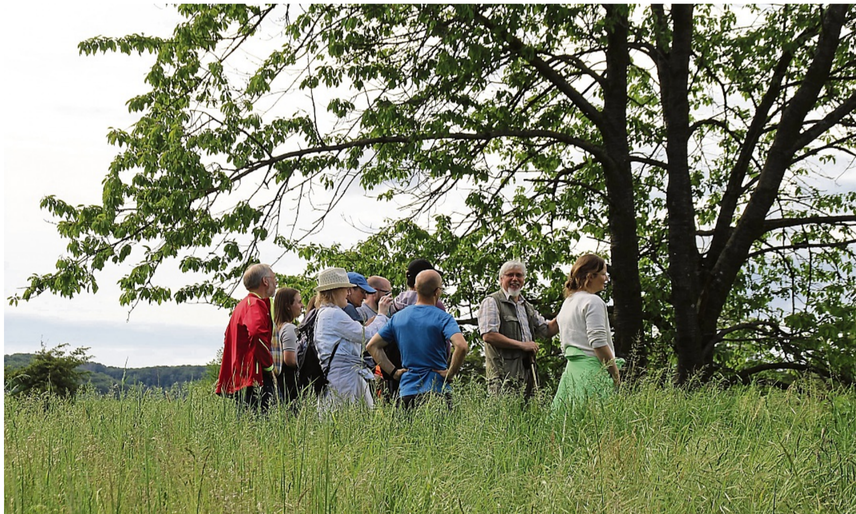
Eine Wandergruppe erkundet die Landschaft des Geo-Naturparks Frau-Holle-Land.