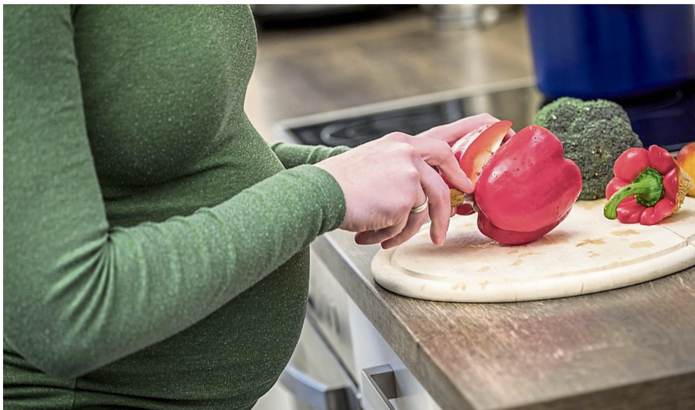
Wichtiger Baustein, um sich gut mit Nährstoffen zu versorgen – umso mehr in der Schwangerschaft: viel frisches Gemüse.

Das heißt allerdings nicht, dass jedes Rohmilchprodukt diesen Erreger enthält. Die Frau muss für sich entschei-