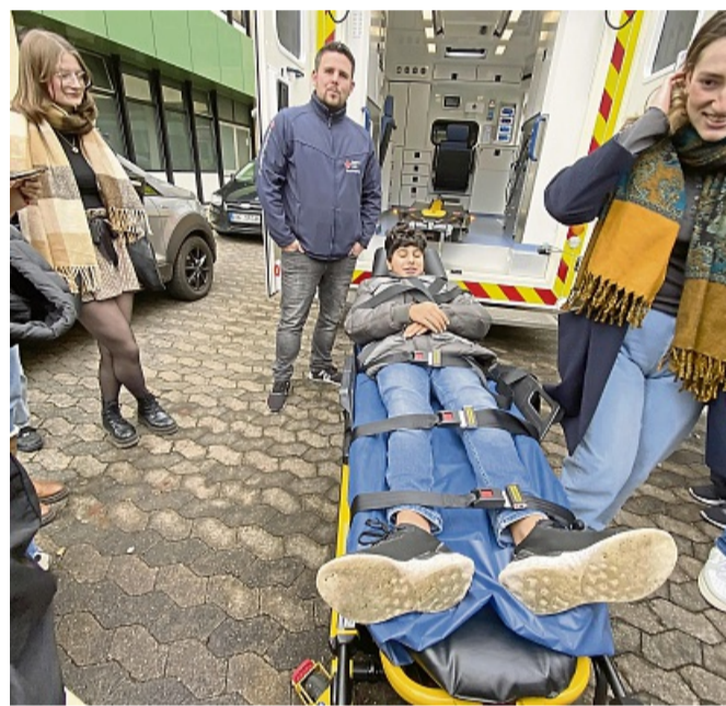
Schüler der Adam-von-Trott-Schule lernen Ausbildungsberufe hautnah kennen.