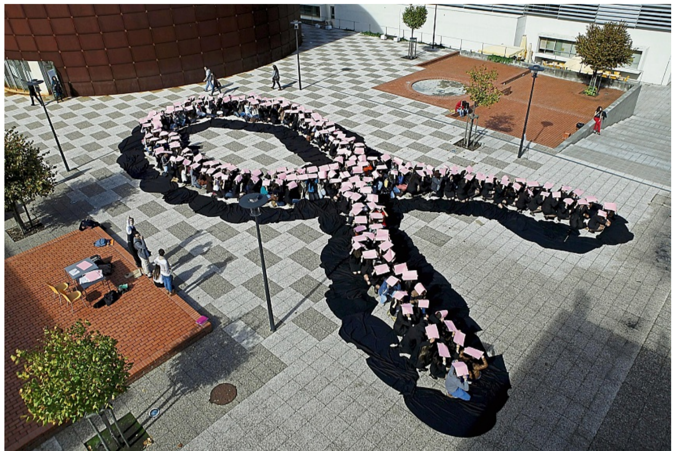
Die rosa Schleife ist ein internationales Symbol, das Bewusstsein für Brustkrebs schaffen will. Eine von acht Frauen ist im Laufe ihres Lebens davon betroffen.

Ihnen ist beim Selbstcheck etwas aufgefallen? Dann gilt: Keine Scheu und die Veränderung in der Hautarztpraxis checken lassen. Einige Praxen bieten extra Sprechstunden, um