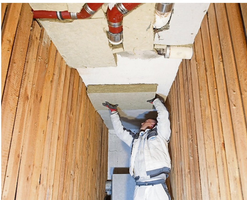
Manchmal sollte besser ein Profi ran – wer seinen Keller dämmen will, sollte sich vorab auf jeden Fall beraten lassen.

Kleben, Dübeln oder ein Schienensystem: Es gibt verschiedene Systeme zum Befestigen der Dämmplatten. „Oft werden die Platten direkt an die Wand geklebt“, sagt Klaus-Jürgen Edelhäuser. Allerdings: