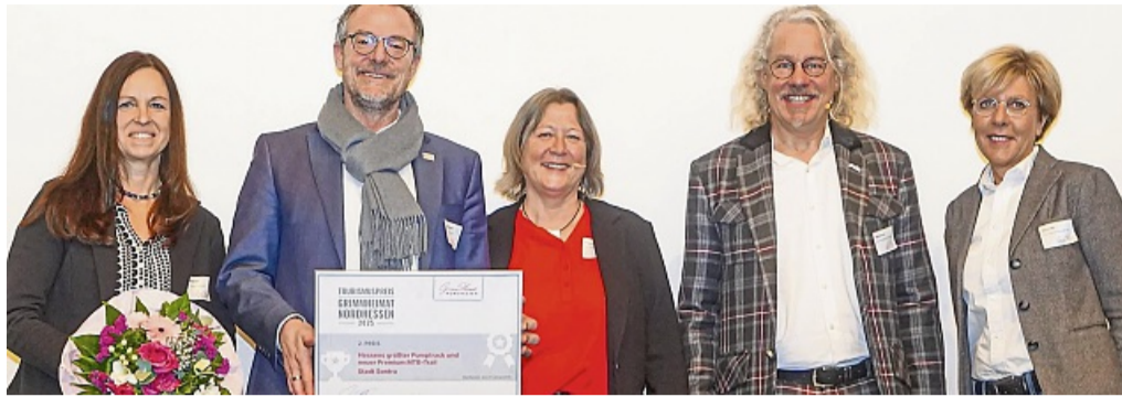
Stolz nehmen die Vertreter der Stadt Sontra die Auszeichnung anlässlich des Jahrestreffen Tourismus in Borken entgegen.