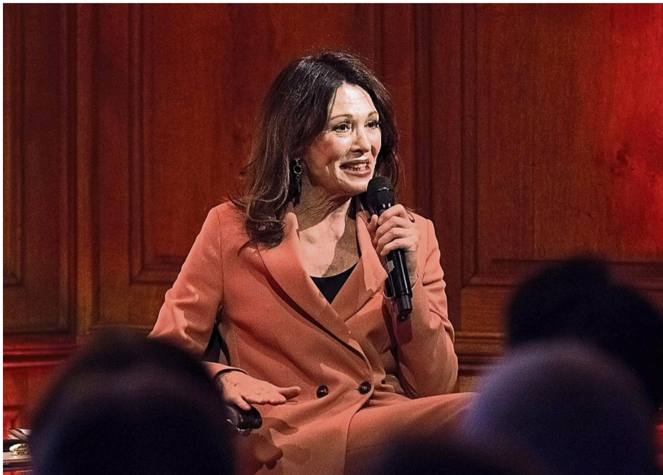
Schirmherrin Iris Berben, hier bei einem Auftritt 2022 auf Schloss Waldeck, wird in diesem Jahr mit einer Veranstaltung zum Thema Humor beim Literaturfestival dabei sein.

Im Gespräch mit Hubertus Meyer-Burckhardt wird Iris Berben einen fröhlichen Einblick in die Internationale des guten Humors geben. Von Mark Twain über Kurt Tucholsky bis zu Lorient; von Heinrich Heine über Ernst Jandl bis zur KI-gestützten Heiterkeit. Dabei wird nicht nur der eine oder andere Witz erzählt, auch die psychologischen Hintergründe mancher Scherze, die schon Sigmund Freud erforschte, kommen zur Sprache. Ist der Witz eine Waffe der Unterdrückten?