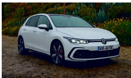
z. B. VW Golf GTE 1,5 I eHybrid OPF 130 kW (177 PS) / 85 kW (116 PS) 6-Gang-DSG, Uranograu

Energieverbrauch gewichtet kombiniert: 16,2-15,9 kWh/100 km plus 0,4 l/100 km; Kraftstoffverbrauch bei entladener Batterie kombiniert: 5,4-5,3 l/100 km; CO 2 - Emissionen gewichtet kombiniert: 8 g/km; CO 2 -Klasse gewichtet kombiniert: B; CO 2 -Klasse bei entladener Batterie: D.