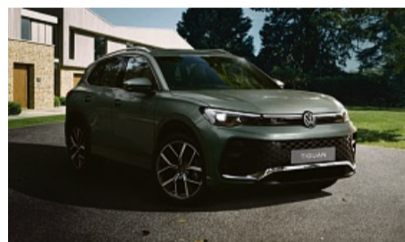
z. B. VW Tiguan Elegance 1,5 I eTSI OPF 110 kW (150 PS) 7-Gang-DSG, Uranograu

Energieverbrauch in l/100 km (kombiniert): 6,7-6,2; CO 2 -Emission in g/km (kombiniert): 153-142. CO 2 -Klasse: E