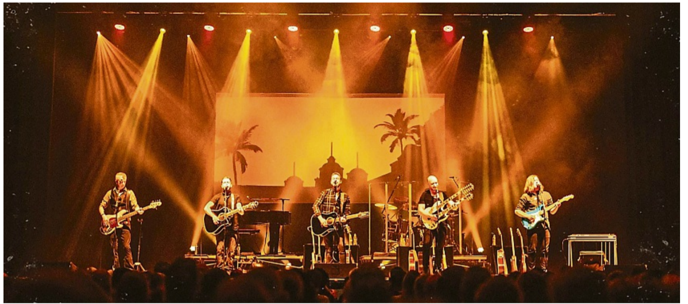
Contry-Rock von der Westküste: Die Cover-Band „Ultimate Eagles“ tritt in der Korbacher Stadthalle auf und präsentiert große Hits.

Die Show in der Korbacher Stadthalle beginnt am 6. Februar um 20 Uhr. Tickets gibt es im Vorverkauf für 39,50 Euro unter kulturforum-korbach.de oder über Reservix.