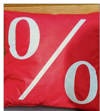
Die teilnehmenden Geschäfte bieten absolute Schnäppchen. Schauen Sie vorbei!

Anders als beim Online-Shopping punkten die Fachgeschäfte vor Ort vor allem mit