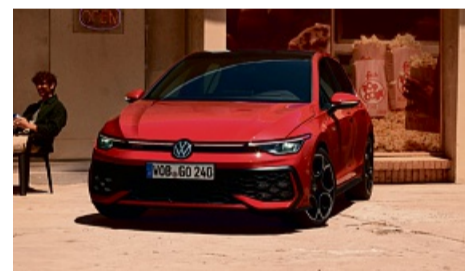
z. B. VW Taigo Life 1.0 I TSI, 59 kW (80 PS) 5-Gang, Ascotgrau

Energieverbrauch in l/100 km (kombiniert): 7,3-7,1; CO 2 -Emission in g/km (kombiniert): 167-162. CO 2 -Klasse: F