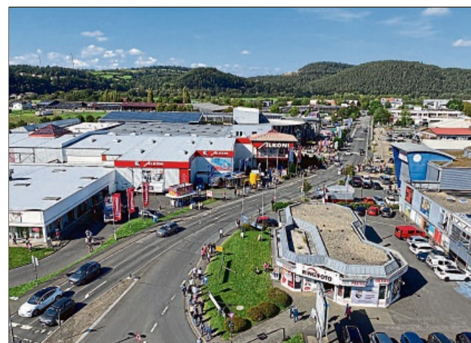
Der Kaufpark ist bei Kunden aus nah und fern äußerst beliebt. Hier finden sie alles an einem zentralen Ort.

fits oder vieles mehr: Der Kaufpark Wehrda macht ein tolles Shopping-Erlebnis möglich!