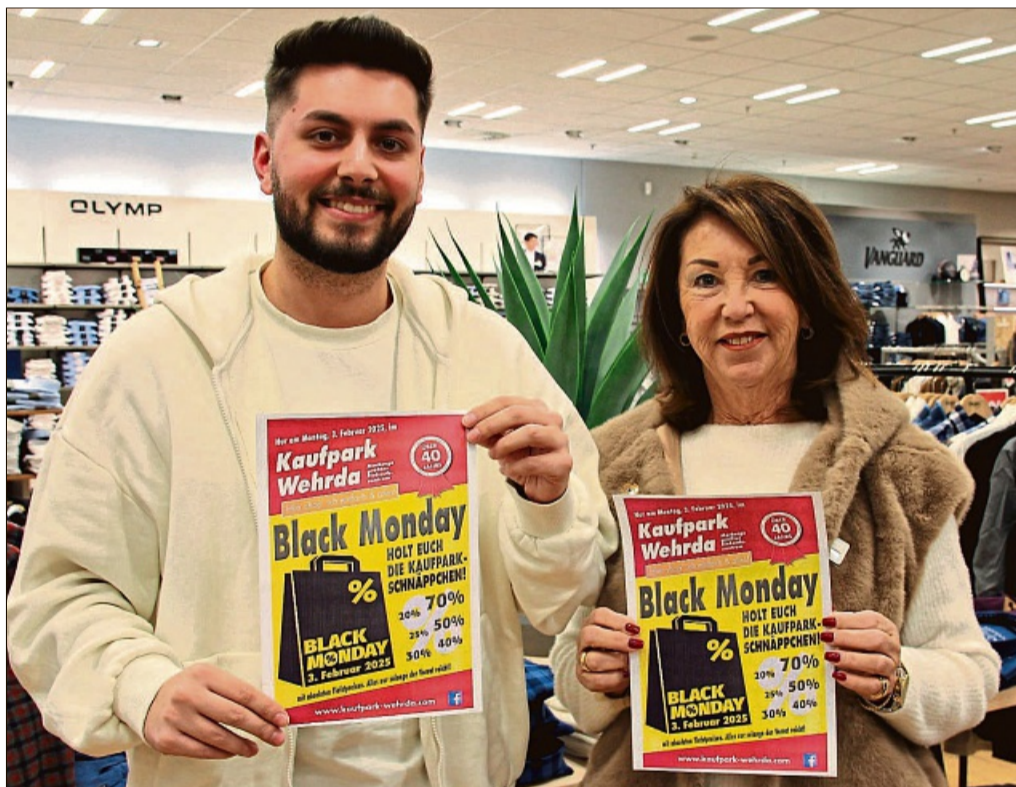
Die Einzelhändler in Marburgs größtem Einkaufszentrum haben sich zum Black Monday am 3. Februar wieder jede Menge Schnäppchen einfallen lassen.

Marburg-Wehrda (sr). Der Black Monday steht vor der Tür: Die Sonderaktion findet am Montag, 3. Februar, statt. Der Black Monday sorgt für bestes Einkaufsvergnügen. Hier können Schnäppchenjäger zentral an einem Tag so viele vielfältige Artikel zu besonders niedrigen Preisen ergattern – und das erneut den gesamten Montag lang.