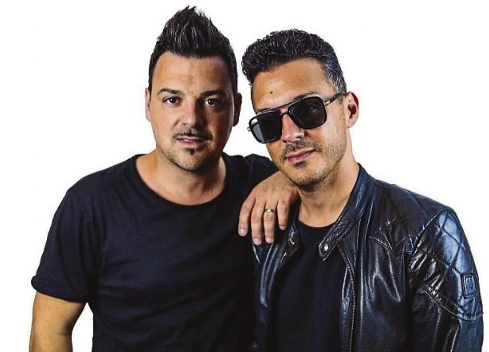
Wollen für Stimmung sorgen: Die „LAMAS“ kommen zum bayerischen Frühschoppen.

Mit der Einladung zu diesem musikalischen Frühschoppen möchte der SV Allendorf auch