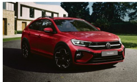
z. B. VW Taigo Life 1.0 I TSI, 59 kW (80 PS) 5-Gang, Ascotgrau

Energieverbrauch in l/100 km (kombiniert): 5,9-5,5; CO 2 -Emission in g/km (kombiniert): 132-123. CO 2 -Klasse: D