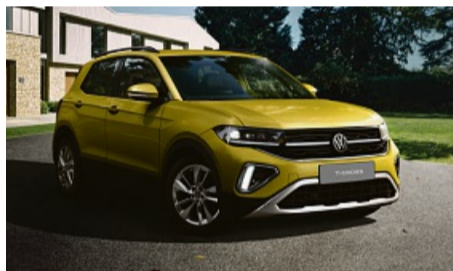
z. B. VW T-Cross Life 1.0 I TSI, 70 kW (95 PS) 5-Gang, Grape Yellow

Energieverbrauch in l/100 km (kombiniert): 5,9-5,6; CO 2 -Emission in g/km (kombiniert): 134-127. CO 2 -Klasse: D