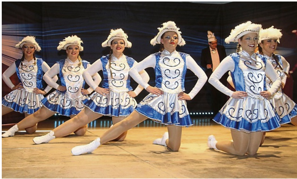
Burgwaldfunken: Die Burgwaldgarde war wieder ein Hochgenuss.

Motto: „Wenn's auch stürmt und kracht – wir Narren feiern Fassenacht!“ Kartenvorverkauf am 1. und 8. Februar ab 15 Uhr im DGH Burgwald. Die Elferatssitzung im Philipp-Soldan-Forum in Frankenberg startet am Samstag, 1. März, um 20.11 Uhr. Kartenvorverkauf dafür ab sofort im Edeka-Markt Schwebel, Reisebüro Lauterbach und in der Buchhandlung Jakobi in Frankenberg.