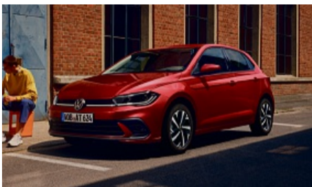
z. B. VW Polo Life 1.0 I TSI, 59 kW (80 PS) 5-Gang, Ascotgrau

Energieverbrauch in l/100 km (kombiniert): 5,6-5,2; CO 2 -Emission in g/km (kombiniert): 128-121. CO 2 -Klasse: D