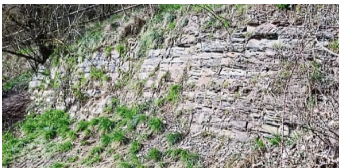
Geotop des Jahres 2024 – der Adorfer Bänderschiefer.

Kontaktadressen für die Vorschläge oder für Auskünfte zum Geotop des Jahres sowie allgemein zum Geopark: Projektbüro „Nationaler Geopark GrenzWelten“, Auf Lülingskreuz 60, 34497 Korbach, Tel. 05631 9541512, E-Mail: geopark@lkwafkb.de .